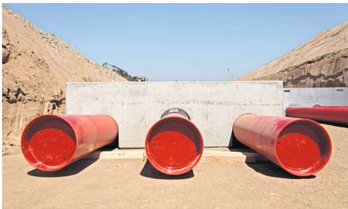
Erdkabel: Fest verankert werden die Rohre für die 525-Kilovolt-Leitungen im Boden verlegt.

Netzbetreiber Tennet und 50 Hertz wollen mit dem Ostwestlink den Raum Oldenburg/Bremen mit Baden-Württemberg verbinden. Die Leitungen dazu könnten im Calenberger Land einen ähnlichen Verlauf wie die des Südlinks nehmen. Der Korridor, innerhalb dessen die genaue