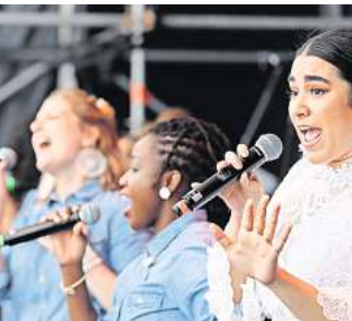
Mitmachen können alle, die Freude am Singen haben.

2025. Im Theater am Aegi Hannover präsentieren dann die 200 Stimmen eine Musikexplosion der Extraklasse. Um die Proben effektiver zu gestalten, erhalten die Sänger ein Songbook sowie Übungs-Dateien. Mitmachen können alle, die Freude am Singen haben sowie die Dynamik eines Mass-Choirs erleben möchten. Sei dabei! Anmeldung unter: hannover@singout-projekt.de