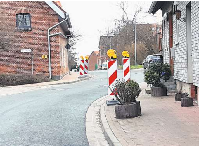
Baken für mehr Sicherheit: Die von der Stadt aufgestellten beweglichen Barken sollen an geeigneten Stellen durch fest installierte ersetzt werden.

Schleichverkehr: Die Stadt reagiert mit einer halbseitigen Sperrung der Holtenser Straße und will Fußgänger mit Baken schützen