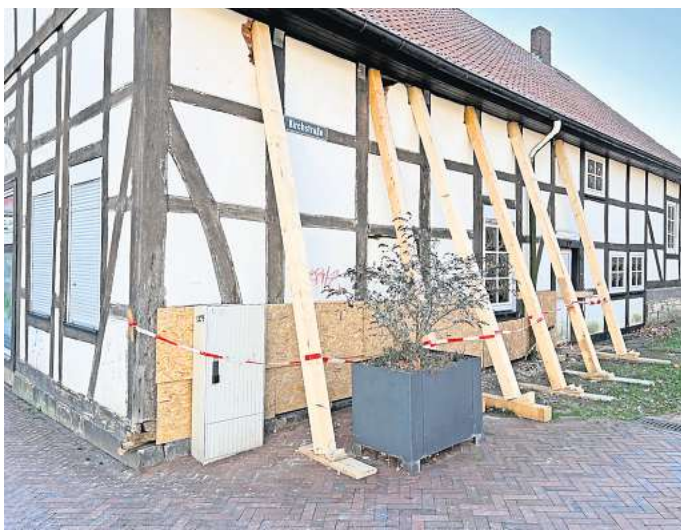
Stützbalken als Sicherungsmaßnahme: Das von der Stadt erworbene Fachwerkhaus am Thie soll saniert werden und aus Sicht der Ratsmehrheit durch eine vielseitige Nachnutzung einen Beitrag zur weiteren Innenstadtgestaltung leisten.

Hintergrund sind kürzlich vorgenommene Sicherungsmaßnahmen der Stadt an dem gekauften Gebäude. Wegen neu aufgestellter Stützbalken hatte