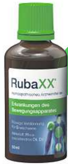
Rubaxx Tropfen (PZN 13588561)