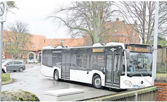
Mit finanzieller Unterstützung vom Land: Busse wie die 520 halten bislang auf einer Straßenseite der Haltestelle „Denkmal“ an einem Bedarfshalt. Dieser soll nun ausgebaut werden.

Etwa 99.000 Euro betragen die Kosten für den Umbau, das Land beteiligt sich mit 75 Prozent. Die Haltestelle in der Gegenrichtung (in Richtung Hannover) ist bereits vor sechs Jahren fertiggestellt worden und seitdem barrierefrei. Insgesamt beteiligt sich das Land im Zuge der Fördermittelvergabe des niedersächsischen Wirtschafts- und Verkehrsministeriums für den ÖPNV landesweit mit rund 103,6 Millionen Euro an 255 Projekten, darunter auch eine weitere Bushaltestelle in Ronnenberg. Der Halt „Denkmal“ in Bredenbeck ist bislang lediglich eine Bedarfshaltestelle, an der die Busse auf dem Gehweg an der Rechtsabbiegerspur