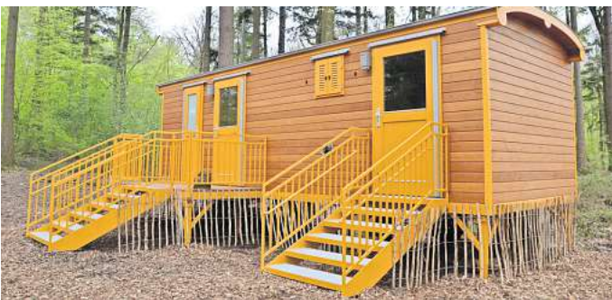
Waldkindergarten: Ein Bauwagen, wie dieser, der im Mai 2023 in Wennigser Mark in Betrieb genommen wurde, gehören zur Grundausstattung.

Genehmigung vom Ministerium Grundsätzlich als Standort für