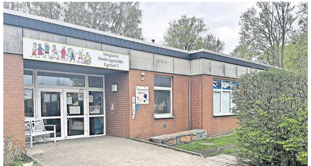
Länger geschlossen: Aufgrund personeller Ausfälle konnte die Kita Egestorf 1 seit Wochen keine verlässliche Betreuungszeit mehr bieten. Jetzt wird die Betreuungszeit generell eingekürzt, um eine Verlässlichkeit wieder herzustellen.

SPD- und auch Grünen-Fraktion arbeiten demnach intensiv an möglichen Nutzungen, um die Chancen für die Innenstadt auszuloten. Ein Architekturbüro aus Großgoltern hatte schon im Frühjahr 2022 ein Nutzungskonzept erarbeitet und darin das Haus in drei Geschosse unterteilt – unter anderem mit Tourismusbüro, Stadtteil- oder Quartierstreff, Büroräumen, Pop-up-Store, Freiwilligenbörse und Co-Working-Space. Die Architekten verwiesen auch auf den Umfang der Instandsetzungsarbeiten und notwendige Sofortmaßnahmen.