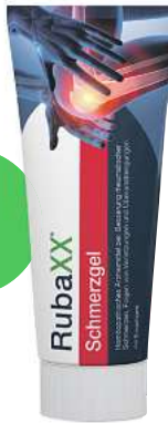
Rubaxx Schmerzgel (PZN 18709526)