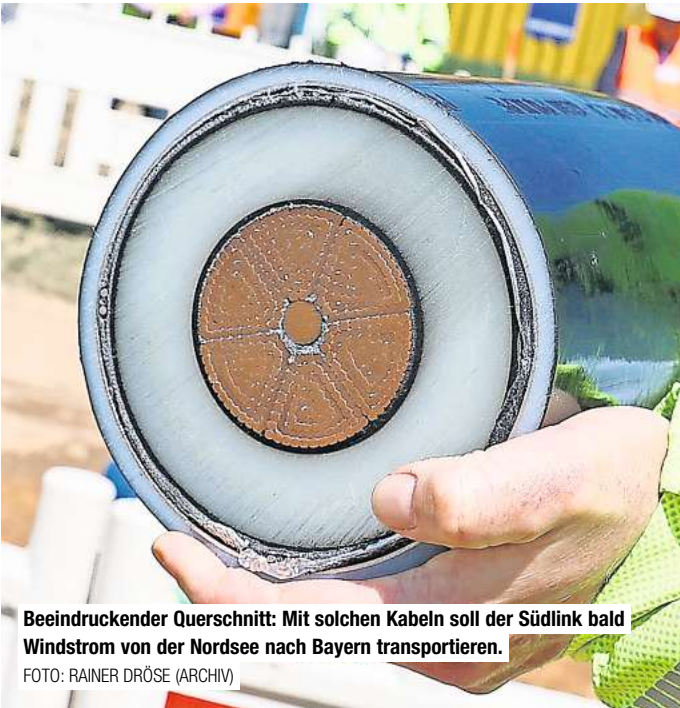
Beeindruckender Querschnitt: Mit solchen Kabeln soll der Südlink bald Windstrom von der Nordsee nach Bayern transportieren.

Die Korridore, in deren Grenzen die Leitungen verlaufen sollen, haben eine Breite von fünf bis zehn Kilometern. Aktuell prüft die Bundesnetzagentur, welche Umweltauswirkungen sie jeweils hätten. Welche genauen Auswirkungen das Projekt für Gehrden hat, ist noch nicht abzusehen.