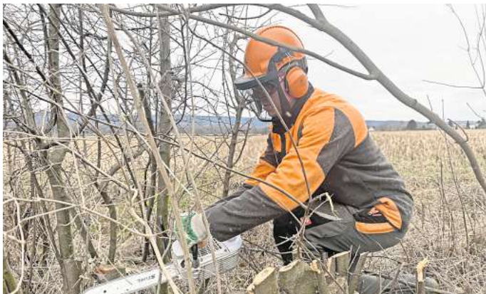
Nötiger Heckenbeschnitt: Die Gewächse werden tief am Boden „auf den Stock gesetzt“ (gestutzt), um von unten neue Austriebe zu erzeugen.

„Von außen wirken die Bäume meist noch gesund, aber innen sieht es ganz anders aus“, erklärt Teamleiter Reinecke, während zwei Bauhofmitarbeiter auf das brüchige Innere eines verbliebenen Baumstumpfes hinweisen. Weiße pudrige Spuren zeugen von dem Pilz, der die Bäume be-