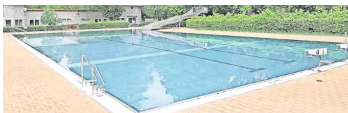
Einladend: Ab dem 1. Mai öffnet das Freibad Empelde wieder die Türen.

Die Verwaltung hatte im Zuge der Sparbemühungen auch ermittelt, dass die Vormittagsstunden im Freibad vergleichsweise wenig von Badegästen genutzt worden sind. Probleme mit den reduzierten Öffnungszeiten hat nun aber unter anderem eine Gruppe von Frühschwimmern, die künftig auf andere Bäder in der Umgebung ausweichen muss.