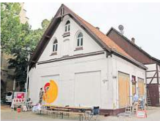
Arbeitseinsatz: Mitglieder der Bürgerinitiative „Wir in Gehrden“ haben kürzlich das Haus am Steinweg 25 verschönert.