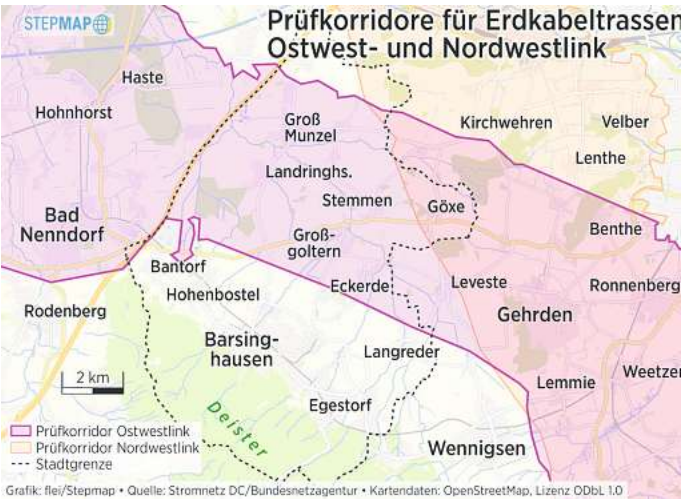
Prüfkorridore für Erdkabeltrassen Ostwest- und Nordwestlink

Tennet hat in einem etwa 1000 Meter breiten Korridor nach der optimalen Trasse gesucht. Dafür waren etwa Bodenuntersuchungen und Naturschutzgutachten erforderlich. Grundeigentümer wurden beteiligt, ebenso wie die Öffentlichkeit. Alles zum derzeitigen Stand der Planungen ist im Internet unter www.netzausbau.de zu finden.