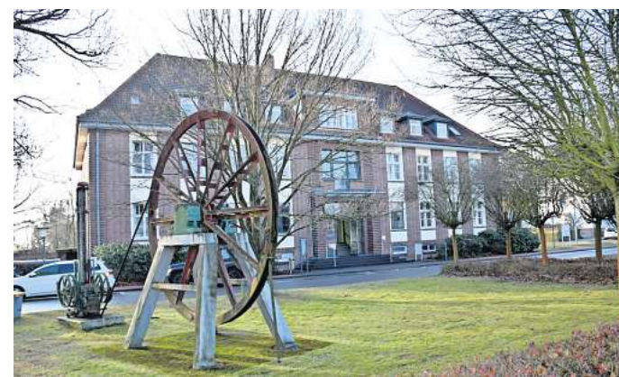
Anbau notwendig: Die Stadtverwaltung plant für den Ausbau der Digitalisierung auch eine Erweiterung des Rathauses.