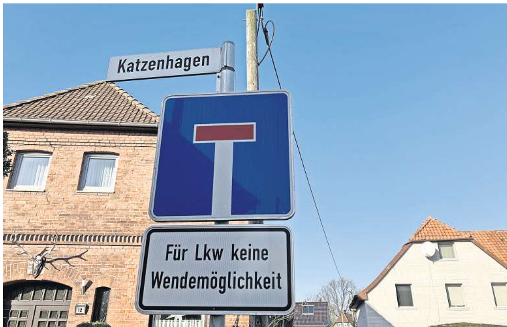
Nicht nur dieses Schild wird oft ignoriert: Auch die Schilder „Anlieger frei“ missachten viele Autofahrer mit ortsfremden Kennzeichen. Das ärgert die Anwohner.

Deshalb ist auch sie am Samstag bei der Versammlung, zu der die Nachbarn zusammengekommen sind, um sich zu beraten. Am Ende stehen fast 40 Menschen in der Kurve der Straße Katzenhagen und