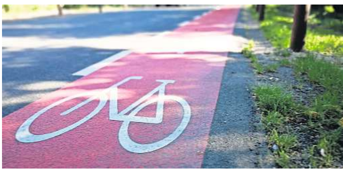
Roter Fahrradstreifen in Gehrdn: So wünscht es sich der ADFC auch für Wennigsen.

Mit der roten Einfärbung der Radsuren konnten an vielen Orten in der Region bereits positive Erfahrungen gemacht werden. Die Radfahrenden würden vom Verkehr besser wahrgenommen und fühlten sich sicherer, heißt es von den Kommunen, die das Konzept nutzen. Mitunter werde der Schutzstreifen von Autos auch weniger oft grundlos befahren, und die Abstände beim Überholen vergrößerten sich.