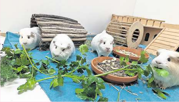
Knabbern gerne im Rudel: Edelweiß, Endivie, Erbse und Enzian.

Tierschutzverein Barsing- hausen und Umgebung Ludwig-Jahn-Straße 11a 30890 Barsinghausen Telefon (05105) 7736777