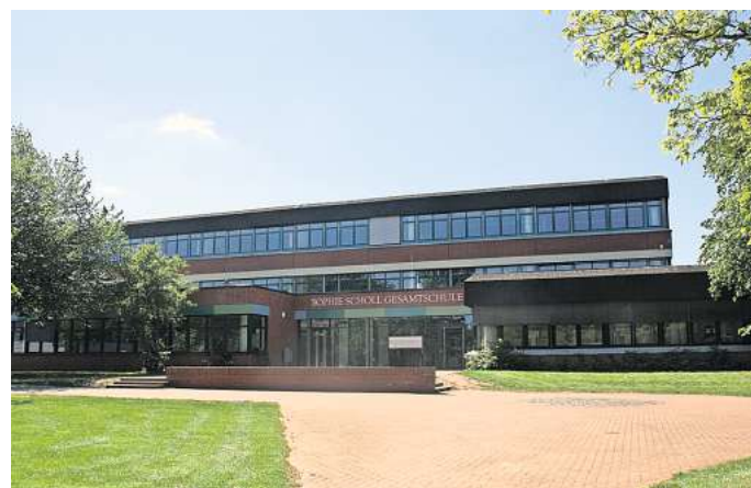
Schnupperunterricht und Infoabend: Die Sophie-Scholl-Gesamtschule informiert Grundschüler und ihre Eltern über das Schulkonzept

Die Anmeldefrist für die Schnuppertage endet am 12. Februar. Für Anmeldungen und Fragen steht das Schulsekretariat unter der Telefonnummer (05103) 928821 zur Verfügung.