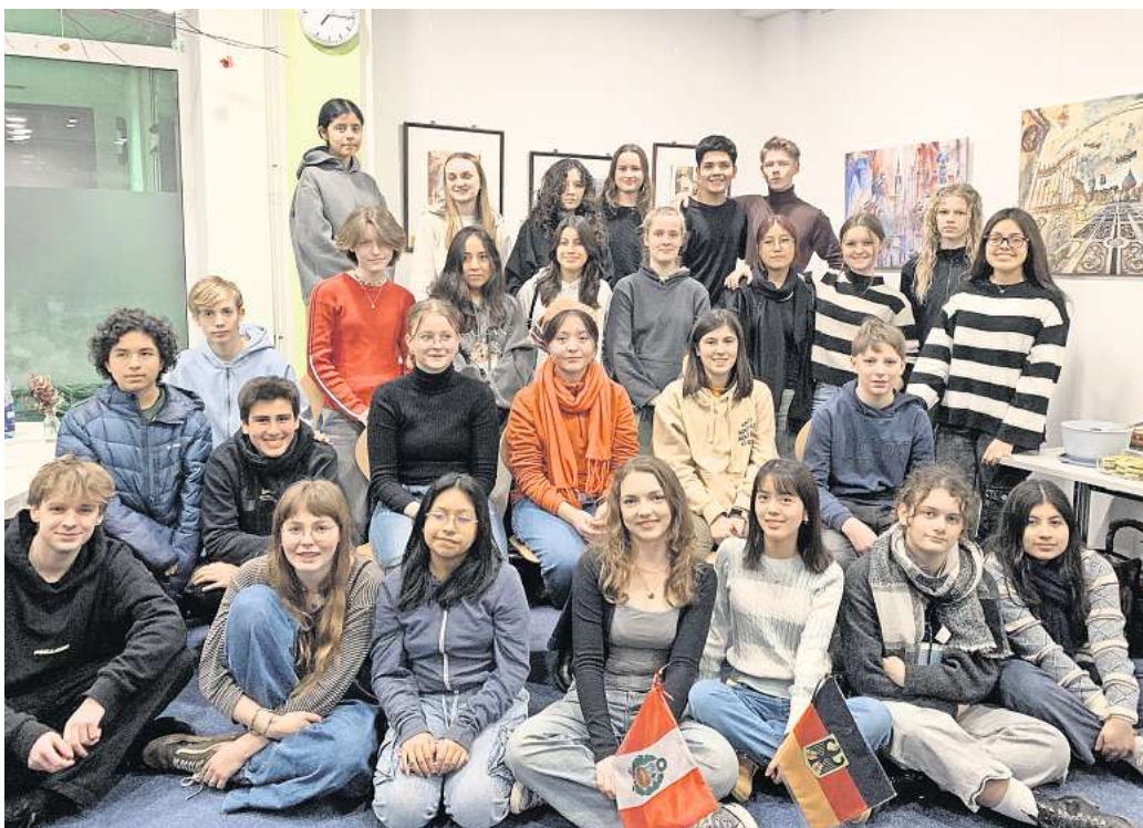
Austausch: 15 Schüler und Schülerinnen aus Peru sind derzeit zu Gast in der Region Hannover.