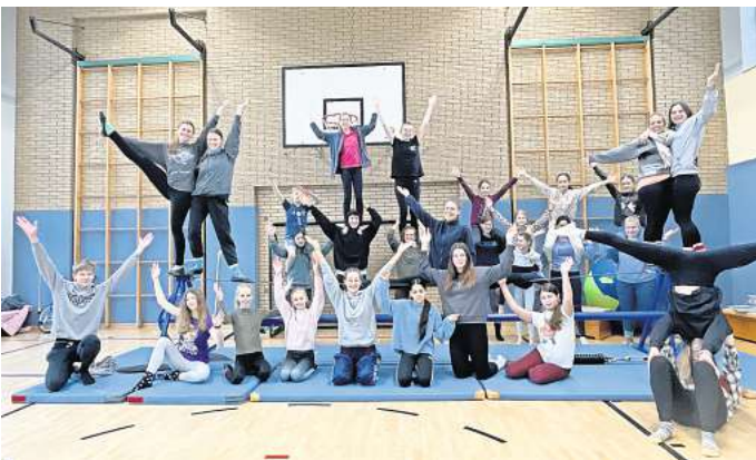
Manege frei: Die älteren Mitwirkenden am KiJuCiBa trainieren sonntags in der Sporthalle der Adolf-Grimme-Schule. Ab Anfang Februar proben sie ihr Programm auf der Aula-Bühne im Schulzentrum, wo sie am 10. und 11. Februar ihre Gala-Vorstellungen geben.