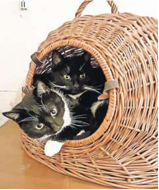
Momo und Penny sind ein gut einge- spieltes Duo.

Barsinghausen. Die drei Tier- schutzkatzen Momo, Penny und Luzie leben derzeit auf einer Pflege- stelle in Barsinghausen. Ihre Pflegerin muss allerdings dem- nächst ins Krankenhaus. Daher soll das Trio vermittelt werden. Die Katzen sind zutraulich und in- zwischen ganz verschmust. Fremde müssen allerdings ein bisschen Geduld mitbringen, sie peilen zunächst mal vorsichtig die Lage.