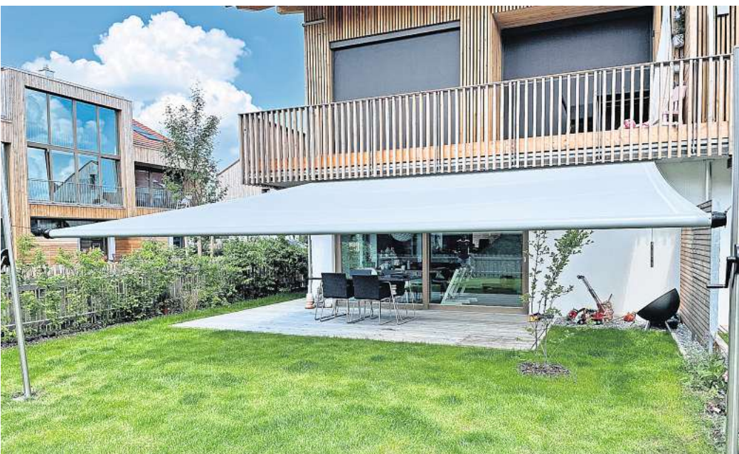
Mit dem Sonnensegel lassen sich große Flächen elegant und formschön überspannen – ganz ohne eingeschränkte Sicht durch Gelenkarme oder Querprofile.

Und: Je nach Sonnenstand können wir die Schattenlinie dank Höhenverstellung flexibel regulieren und genießen so allseits hohen UV-Schutz mit UPF 50+. Aber auch bei Regen ist