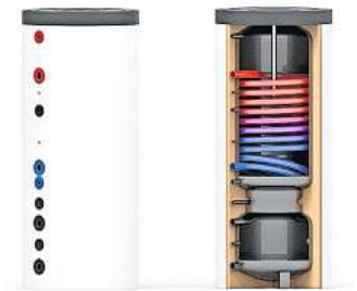
Der Wärmepumpen-Pufferspeicher kombiniert die sichere Trinkwassererwärmung mit einem untergebaute Pufferspeicher zur energieeffizienten Raumheizung bzw. -kühlung.

einem Gerät verbaut sind, wird nicht nur der Installationsaufwand erleichtert, sondern auch deutlich weniger Stellfläche benötigt. In Zeiten, in denen sich jeder Quadratmeter mehr spürbar auf die Baukosten auswirkt, ist das ein nicht zu unterschätzender Vorteil. Die Funktionen