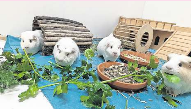
Knabbern gerne im Rudel: Edelweiß, Endivie, Erbse und Enzian.

Tierschutzverein Barsinghausen und Umgebung Ludwig-Jahn-Straße 11a 30890 Barsinghausen Telefon (05105) 7736777