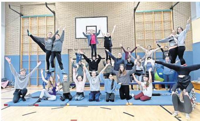
Manege frei: Die älteren Mitwirkenden am KiJuCiBa trainieren sonntags in der Sporthalle der Adolf-Grimme-Schule. Ab Anfang Februar proben sie ihr Programm auf der Aula-Bühne im Schulzentrum, wo sie am 10. und 11. Februar ihre Gala-Vorstellungen geben.