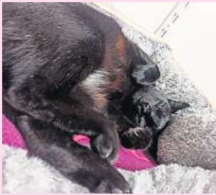
Ranja ist etwa eineinhalb Jahre alt und entsprechend verspielt.

Ranja kam im Spätsommer 2023 als Fundtier ins Tierheim nach Barsinghausen. Die junge Katze war trächtig und brachte Ende August drei Söhne zur Welt. Rania kümmert sich vorbildlich um ihren Nachwuchs. Ein Sohn hat die Familie bereits verlassen und auch die anderen beiden Kater können jetzt in ein neues Zuhause ziehen.