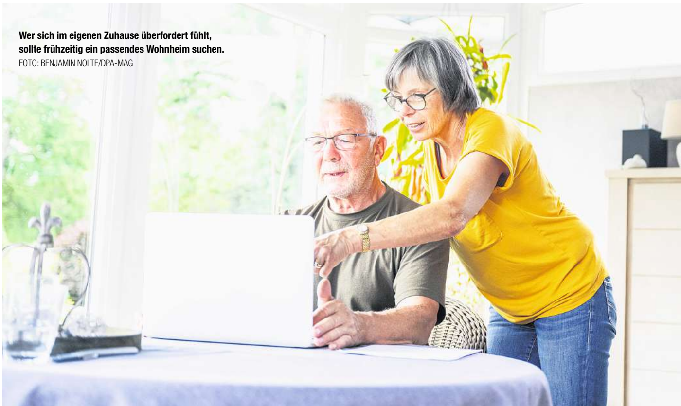
Wer sich im eigenen Zuhause überfordert fühlt, sollte frühzeitig ein passendes Wohnheim suchen.

Was brauche ich, wo fühle ich mich wohl?