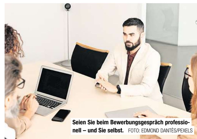
Seien Sie beim Bewerbungsgespräch professionell – und Sie selbst.

Mit 43.140 gedruckten Exemplaren pro Ausgabe und enger Kooperation mit anderen Titeln der Madsack-Mediengruppe ist der burgbergblick ein starker Partner für lokale Unternehmen jeder Branche. Wenn Sie einen Azubi (m/w/d) suchen oder eine Fachkraft, helfen wir Ihnen gerne dabei. Dann landet Ihre Stellenanzeige direkt im Briefkasten Ihrer Zielgruppe. Nehmen Sie Kontakt zu uns auf.