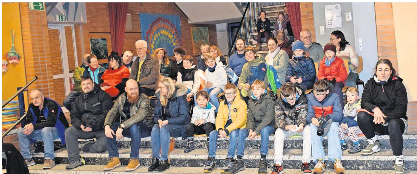
Voll wie selten: Im Zuschauerraum versammeln sich insgesamt mehr als 20 Kinder aus dem Ort mit ihren Eltern. Sie wollen ihrem Wunsch nach einer Skateranlage in Weetzen Nachdruck verleihen.

Gebaut werden könnte die neue Jugendeinrichtung in Weetzen auf dem Festplatz