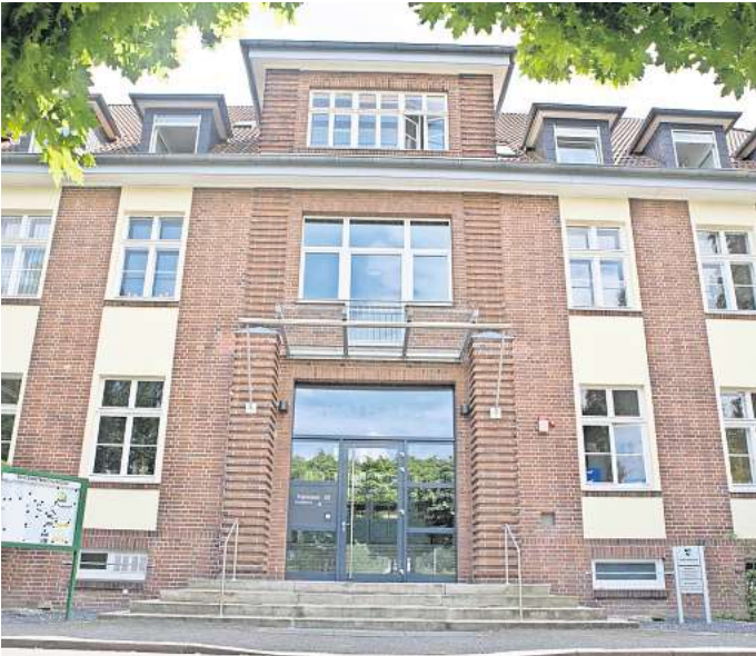
Warmer Geldsegen: Im Rathaus sind 3,2 Millionen Euro Finanzhilfe vom Land Niedersachsen eingegangen.

Die Region Hannover als Aufsichtsbehörde hatte die Ronnenberger Verwaltung im Rahmen der Genehmigung des Haushalts der Stadt für 2023 dazu aufgefordert, eine Bedarfswzuweisung des Landes zu beantragen. Dazu muss eine außergewöhnliche finanzielle Lage der Stadt festgestellt werden. Das war mit einem Minus in Höhe von rund 6,5 Millionen Euro im Haushaltsentwurf für 2023 und der Aussicht auf weitere Defizite in ähnlicher Höhe in den Folgejahren gegeben. Dem positiven Bescheid des MI vom 21. Juli 2023 über eine mögliche Bedarfswzuweisung in Höhe von 3,2 Millionen Euro folgte die intensive Suche nach weiteren Einsparpotenzialen im