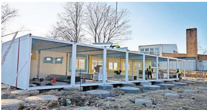
Rohbau: Auf einer Wiese des Freibades werden Container aufgestellt. Sie sollen vorübergehend fehlende Klassenzimmer der Oberschule ersetzen.

Es war kein gerader Weg bis nun die Container aufgestellt werden können. Zwischenzeitlich gab es einen Zwist zwischen der Stadt Gehrden und der Re-