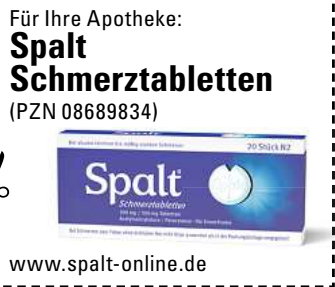
Abbildung Betroffenen nachempfunden SPALT SCHMERZTABLETTEN. Für Erwachsene bei akuten leichten bis mäßig starken Schmerzen. Schmerzmittel sollen längere Zeit oder in höheren Dosen nicht ohne Befragen des Arztes angewendet werden. Bei Schmerzen oder Fieber ohne ärztlichen Rat nicht länger anwenden als in der Packungsbeilage vorgegeben! www.spalt-online.de • Zu Risiken und Nebenwirkungen lesen Sie die Packungsbeilage und fragen Sie Ihre Ärztin, Ihren Arzt oder in Ihrer Apotheke. • PharmaSGP GmbH, 82166 Grafelfing

„Seit Tagen habe ich keine Schmerzen mehr im Knie! Ich werde die Tropfen weiter nehmen.“ (Klaus W.)