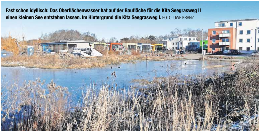
Fast schon idyllisch: Das Oberflächenwasser hat auf der Baufäche für die Kita Seegrasweg II einen kleinen See entstehen lassen. Im Hintergrund die Kita Seegrasweg I.

Die Stadt plant eine zweite Kita im Nordosten von Empelde und rechnet mit Kosten in Höhe von 7,3 Millionen Euro