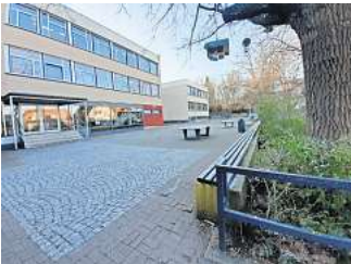
Noch nicht maßgeschneidert: Die Gebäude der Marie-Curie-Schule in Ronnenberg müssen für die Nachnutzung als Grundschule umgebaut werden.

Im übertragenen Sinn stellt Schulz fest: „Es nutzt nichts, etwas zu bauen, was der Kunde nicht will.“ Entsprechend will die Verwaltung auch weiterhin mit der Schulleitung und der Lehrerschaft in Kontakt bleiben und sich deren Wünsche anhören. Der Baustart könne natürlich nicht erfolgen, bevor der Umzug der Marie-Curie-Jahrgänge im Sommer 2025 abgeschlossen ist.