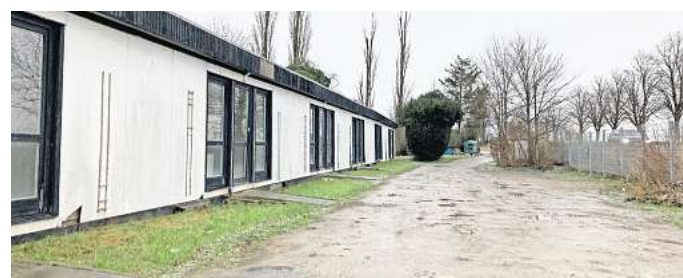
Eine Unterkunft: Hier leben in Ronnenberg Obdachlose, rechts am Bildrand ist die Bundesstraße zu erkennen.

„Das sind nur reine Planungskosten. Es ist zunächst einmal gut, wenn wir diese Summe im Haushalt haben. Gegebenenfalls könnten wir reagieren und intern in die Abstimmung gehen, sollte der Bedarf vorhanden sein“, sagt Roegglen. Ohnehin würden 300.000 Euro gar nicht reichen, um eine neue Unterkunft tatsächlich zu errichten. Dafür werde weitaus mehr Geld benötigt. „Die Baukosten würden dann sowieso mit einem Jahr Verzug kommen.“ Daher ist dieser Posten ein bisschen wie ein Regenschirm: Für alle Fälle dabei haben – und wenn man davon nichts benötigt, dann war es trotzdem nicht verkehrt, sicherheitshalber daran gedacht zu haben.