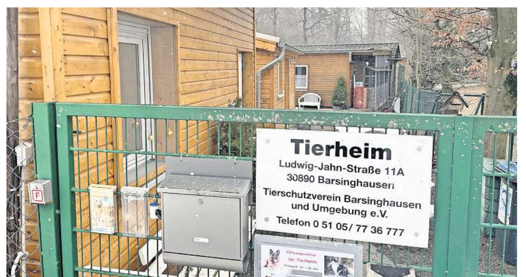
Full House: Das Tierheim an der Ludwig-Jahn-Straße hat im vergangenen Jahr rund 250 Tiere – vom Hund über Katze, Kaninchen bis Meerschweinchen – aufgenommen und ist damit an seine Kapazitätsgrenzen gestoßen.

Für die Zukunft hofft Wildhagen auf Gesetzesänderungen,