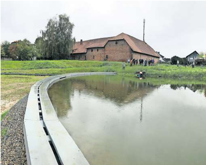
Neues Bauwerk: Das Regenrückhaltebecken in der Bredenbecker Ortsmitte kann bis zu 5000 Kubikmeter Wasser aufnehmen.

Teil 2 von 2: Vier der acht Ortsbürgermeister berichten, was für dieses Jahr geplant ist und welche Wünsche sie haben