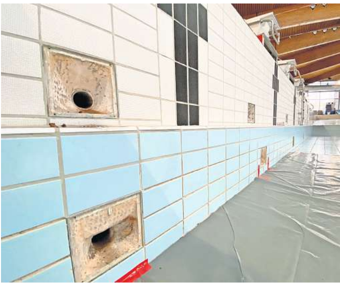
Hier wurde aufgemacht, um an das kaputte Rohr zu kommen: Die Lecks im Zu- und Ablauf werden mit dem Inlinerverfahren repariert. Dazu wird eine „zweite Haut“ in das Rohr reingeklebt.