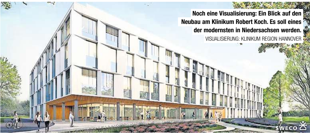
Noch eine Visualisierung: Ein Blick auf den Neubau am Klinikum Robert Koch. Es soll eines der modernsten in Niedersachsen werden.

Dass es Handlungsbedarf an dem Hospital am Rande des