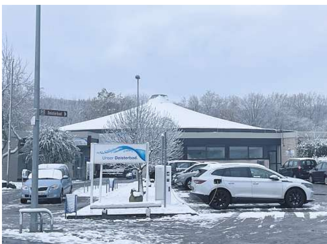
In die Jahre gekommen: Das Deisterbad ist über 50 Jahre alt und aufgrund von Reparaturarbeiten ungeplant geschlossen.

„Bevor wir uns nun auf den Weg machen und die alten Bäder sanieren, sollten wir innehalten und die Wirtschaftlichkeit und Nachhaltigkeit auf den Prüfstand stellen“, betont der Fraktionsvorsitzende. Über die städtischen Gremien ist die Verwaltung nach Worten Messings damit beauftragt worden, eine Machbarkeitsstudie für den Neubau eines kombinierten Hallen- und Freibades zu erstellen.