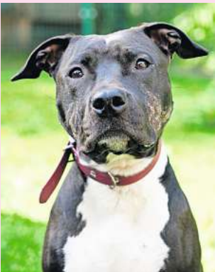
Azula lernt schnell und ist sehr wissbegierig.

„Kleine Kinder sind zu viel für sie, so dass wir sie in einem Haushalt ohne Kinder sehen“, heißt es aus der Hundegruppe.