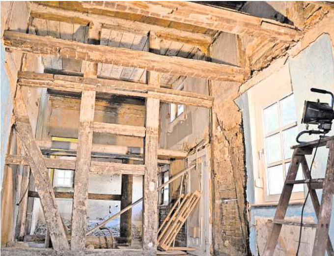
Vierständerhaus: Nur auf den ersten Blick scheint das Holzständerwerk in Ordnung. An einigen Stellen sind Balken und Wände von Schwamm befallen.

Einen Grund für die Sicherungsaktion zu diesem Zeitpunkt hat die Öffentlichkeit – und nach Angaben des CDU-Fraktionsvorsitzenden Gerald Schroth auch seine Partei – bisher nicht genannt bekommen. „Die aktuellen Sicherungsmaßnahmen an dem Fachwerkhaus wurden vermutlich notwendig, weil wegen eines morschen Balkens die Wand abgesackt ist und Fachwerkfelder beschädigt wurden“, ist in einer