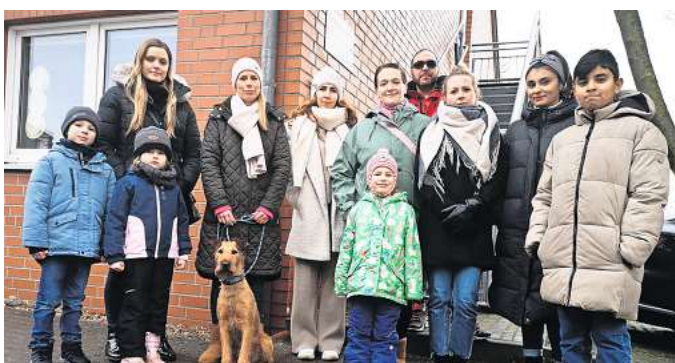
Verärgert: Zahlreiche Eltern wollen die eingeschränkten Schließzeiten der Kita II in Leveste nicht mehr länger hinnehmen. Sie fordern eine schnelle Lösung für das Betreuungsproblem.

Schon seit Langem sei laut Fuchs zu beobachten, dass die Kinder nur „notbetreut“ würden. „Es fallen altersentsprechende Angebote immer wieder aus“, beklagt sie. Vorschulkinder bekämen kein Angebot, das sie auf die Schule vorbereite. Erzieherinnen seien häufig krank; hinzu käme,