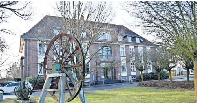
Anbau notwendig: Die Stadtverwaltung plant für den Ausbau der Digitalisierung auch eine Erweiterung des Rathauses.

Während der Vorstellung des Etatplans für 2024 hatte Bürgermeister Frank Schulz die Schwerpunkte der Investitionsplanung