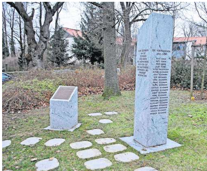
An der Stele am Alten Friedhof in Ronnenberg werden am 26. Januar Kränze niedergelegt.

Erste Reaktionen auf den neuen Zusammenschluss gibt es bereits. „Es wird dankbar aufgenommen“, berichtet Krüger. Olesch bleibt noch etwas kritisch. „Wir werden in der Auftaktveranstaltung sehen, ob der Bedarf überhaupt da ist“, meint er. „Kein Bedarf? Das wird nicht passieren!“, meint Krüger und lacht. Für Wennigsen wünschen sich alle eines: „Eine blühende kulturelle Landschaft“, wie Behr es zusammenfasst.