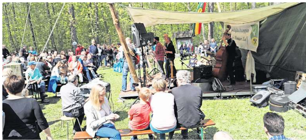
So schön war es in den vergangenen Jahren beim Jazzfrühschoppen.