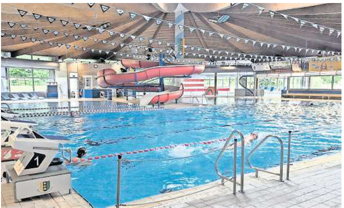
Wieder warm ums Herz: Im Deisterbad kommt der Warmbadetag (mittwochs) zurück – und mit ihm auch das beliebte Babyschwimmen.

Stelle offenbar nicht leicht zu beheben, weil sie an sehr ungünstigen Stellen liegen. „Den Beckenrand aufzuheben, wäre eine mittlere Katastrophe. Daran will ich gar nicht denken, das wäre ein riesengroßer Aufwand. Daher müssen wir jetzt ein Unternehmen finden, das diese Leckagen ohne aufwendige Ausgrabungen und Buddelerei erledigen kann“, sagt Korczowski. Mit zwei Firmen sei er nun in Kontakt, eine sollte den Schaden noch am Freitagmittag begutachten, die andere am kommenden Montag. „Wir hoffen, dass man durch die neuen Möglichkeiten in Sachen Leitungssanierung ein Verfahren findet, das diese Leckagen beheben kann.“