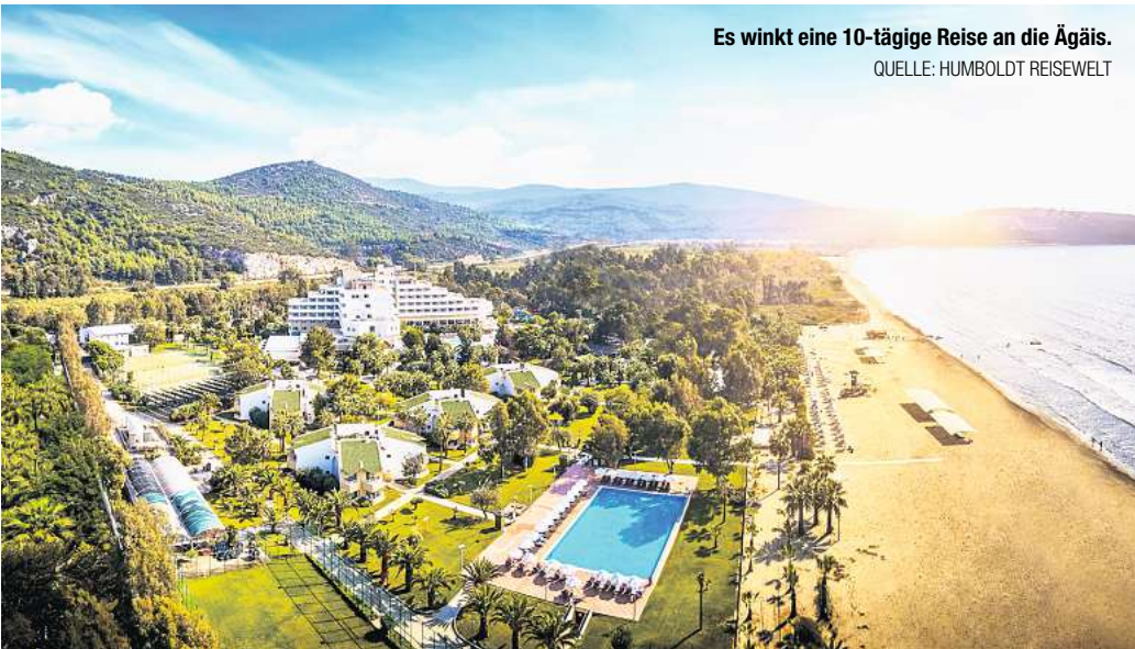
Es winkt eine 10-tägige Reise an die Ägäis.