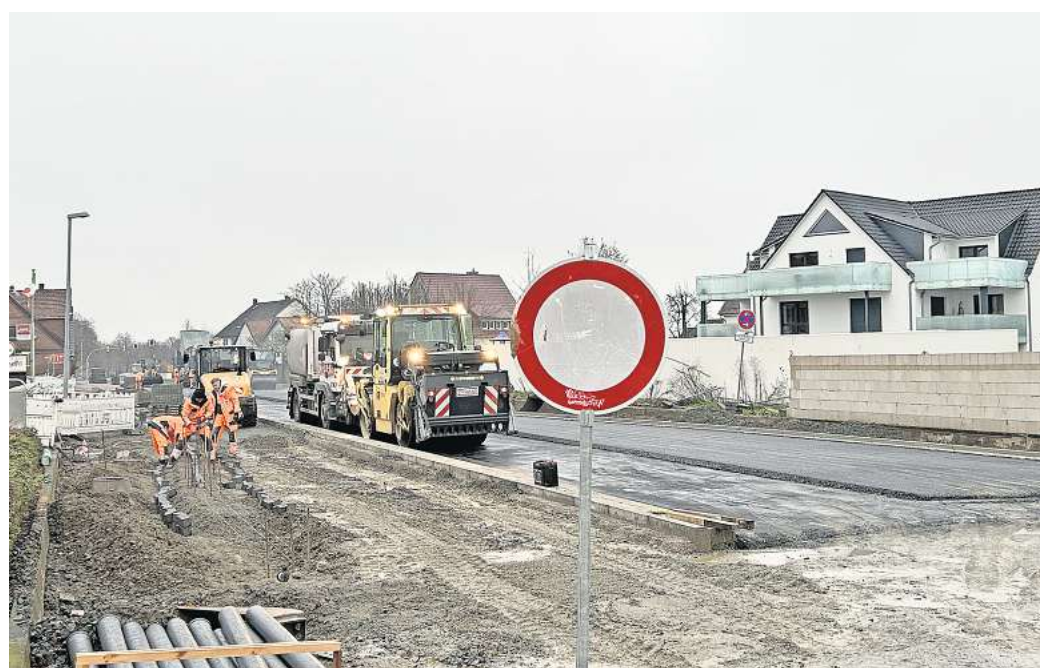
Es geht voran in Holtensen: Im zweiten Bauabschnitt sind die Asphaltarbeiten fast fertig. Auch das Pflastern von Rad- und Gehweg ist in vollem Gang.

„Wir wollen so schnell wie möglich wieder ins Bauen kommen, sofern es die Witterung zulässt“, begründete Behördensprecher