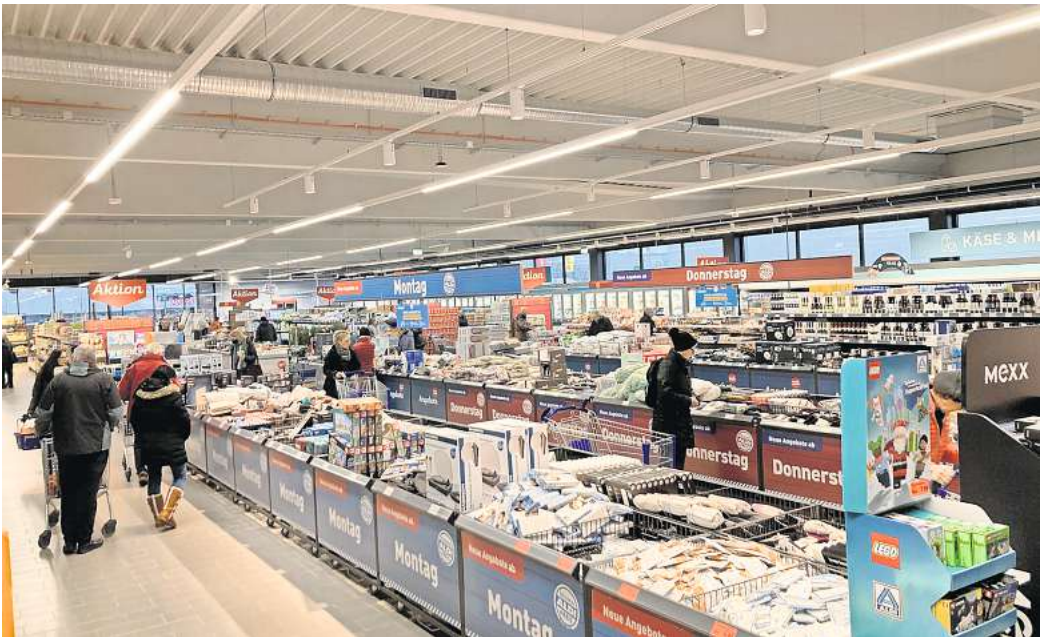
Unterschied: Im Vergleich zum vorherigen Geschäft hat sich die Ausstellungsfläche im sogenannten Non-Food-Bereich vergrößert.

Im Nahversorgungszentrum im Osten von Barsinghausens Kernstadt begannen im April dieses Jahres die Abrissarbeiten einer alten Lagerhalle für Verpackungsmaterial, es folgte der Neubau der Aldi-Filiale – in direkter Nachbarschaft der bisherigen Verkaufsfläche. Stressige Tage mit Ausräumen und Aufbauen liegen hinter seinem Team, berichtet Rogalski. Denn der alte Markt schloss am 2. Dezember, nun gab es die Neueröffnung. Die bisherigen zehn Mitarbeiter wurden übernommen, die Belegschaft ist auf 14 Kollegen angewachsen. Gewachsen ist auch die Verkaufs-