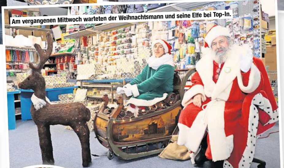
Am vergangenen Mittwoch warteten der Weihnachtsmann und seine Elfe bei Top-In.