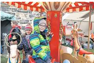
Großer Spaß für die kleinen Besucher in Ronnenberg: eine Runde mit dem Karussell.

Ronnenberg. Die Ronnenberger Vereine, der Stadtfestverein Stafero und die Michaelisgemeinde laden am Sonntag, 3. Dezember, zum Adventsmarkt auf dem Kirchhügel rund um das Gemeindehaus und die Michaeliskirche ein. Wegen der Corona-Pandemie musste dieser Höhepunkt der Vorweihnachtszeit in den vergangenen Jahren pausieren. Von 14 bis 19 Uhr gibt es auf dem Kirchhügel Angebote für alle Altersgruppen, darunter Adventsgestecke, Kunsthandwerk, Singen mit dem Posauenchor sowie Aktionen für Kinder mit den Johannitern und dem Lesehelferverein Mentor. Auch der Weihnachtsmann soll die Kinder auf dem Fest überraschen. Für Kulinarisches sorgen Stafero mit Bratwurst und Getränken sowie der Sportverein SG05 Ronnenberg mit