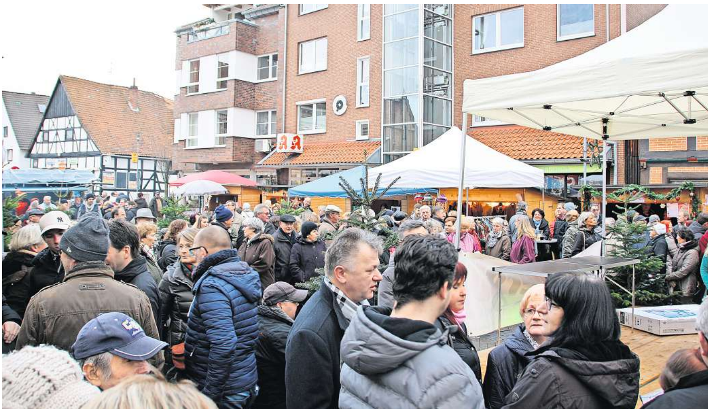
Voller Marktplatz: 2016 hat der Verein „Gehrden feiert Feste“ letztmals ein Weihnachtsdorf in der Innenstadt aufgebaut. In diesem Jahr organisiert der Verein wieder die beliebte, vorweihnachtliche Veranstaltung.

Der Weihnachtsmarkt öffnet am Sonnabend, 16. Dezember, von 12 bis 22 Uhr, am Sonntag, 17. Dezember, von 12 bis 18 Uhr.