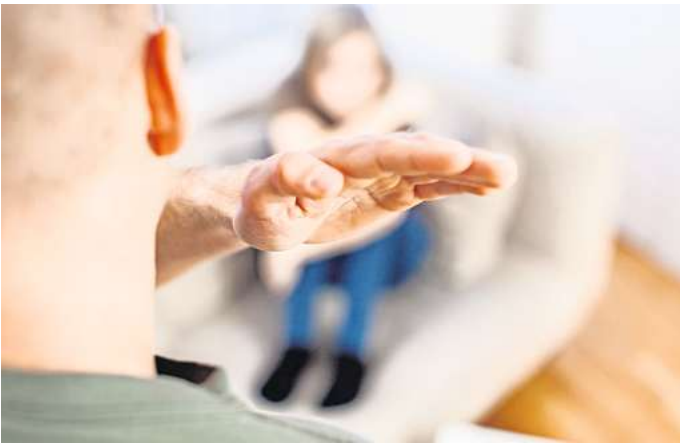
Leider ein trauriges Thema: Häusliche Gewalt, auch gegenüber Kindern, kommt viel zu oft vor.