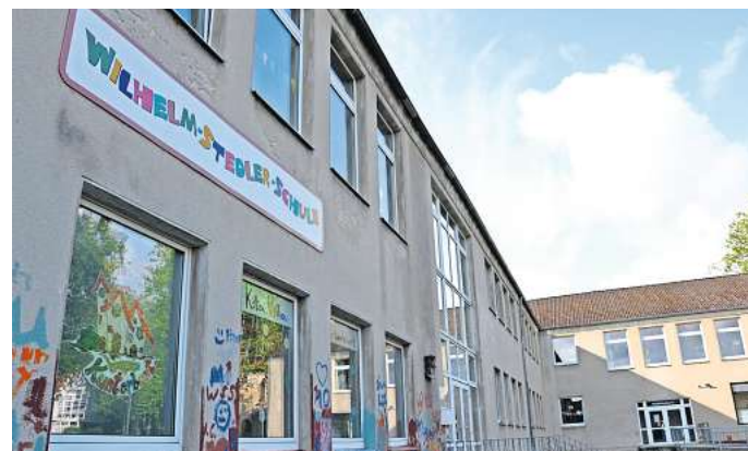
Aufregung in Barsinghausen: Die Schulleitung der Wilhelm-Stedler-Schule warnt in einem Schreiben vor fremden Männern, die Kinder auf dem Weg zur Schule ansprechen

Auf Facebook und in Eltern-Whatsapp-Gruppen macht das Schreiben die Runde. Die Schulleitung der WSS fordert die Eltern darin zur Wachsamkeit auf. Diese sollten mit ihren Kindern über dieses Thema sprechen und diese in den nächsten Tagen den Schulweg gemeinsam mit anderen Klassenkameraden gehen. Die Schule werde das Thema zudem im Unterricht aufnehmen.