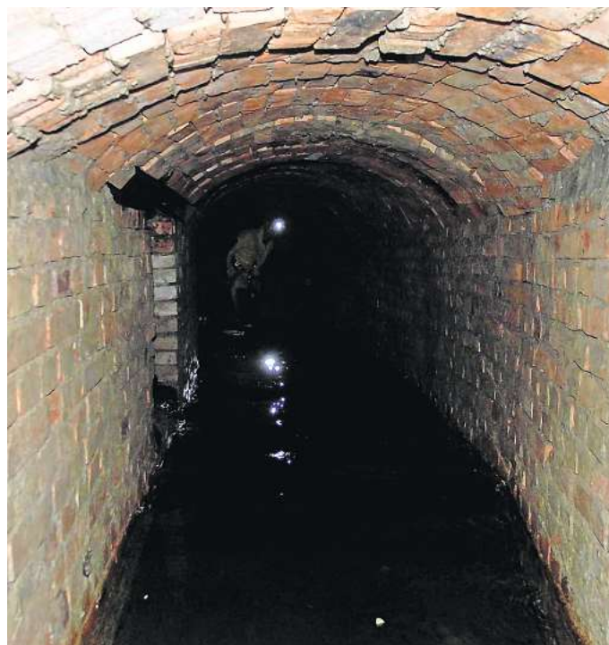
Verwunschener Brunnen auf dem Gehrden Berg? Im Jahr 1898 wurde der Plan gefasst, auf dem Bergrücken des Gehrden Berges nach Wasser zu graben. Es wurde ein kreisförmiger Schacht angelegt, der immerhin 24 Meter senkrecht in die Tiefe geht. Der Tunnel ist noch gut erhalten.

Da besann man sich auf den Brauereiteich, von dem eine Abflussleitung entlang der Hornstraße in Richtung Niederung führte. In der Hornstraße hatte diese Leitung eine Zapfstelle. Nur wenige Meter daneben befand sich ein Hydrant des städtischen Wasserleitungsnetzes. Kurzerhand wurde die vom Brauereiteich kommende Leitung angezapft und das Wasser mit einer starken Pumpe in das öffentliche Leitungsnetz gepumpt. Über 14