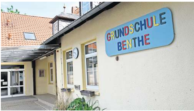
Zukunft offen? Politik und Verwaltung in Ronnenberg diskutieren, wie es mit der Grundschule in Benthewer weitergehen soll.

Aller Voraussicht nach nicht. Während Ortsbürgermeister Bitter bei der Ortsratssitzung erklärte, niemand der Anwesenden sei für eine Schließung der Schule, spricht vor allem die Schülerzahlenprognose klar gegen eine Schließung. So klein die Schule auch ist: Die Benthewer Kinder müssten nach einer Schließung an anderen Standorten unterrichtet werden. Aber weder in Empelde noch in Ronnenberg gibt es dafür künftig ausreichend Kapazitäten.