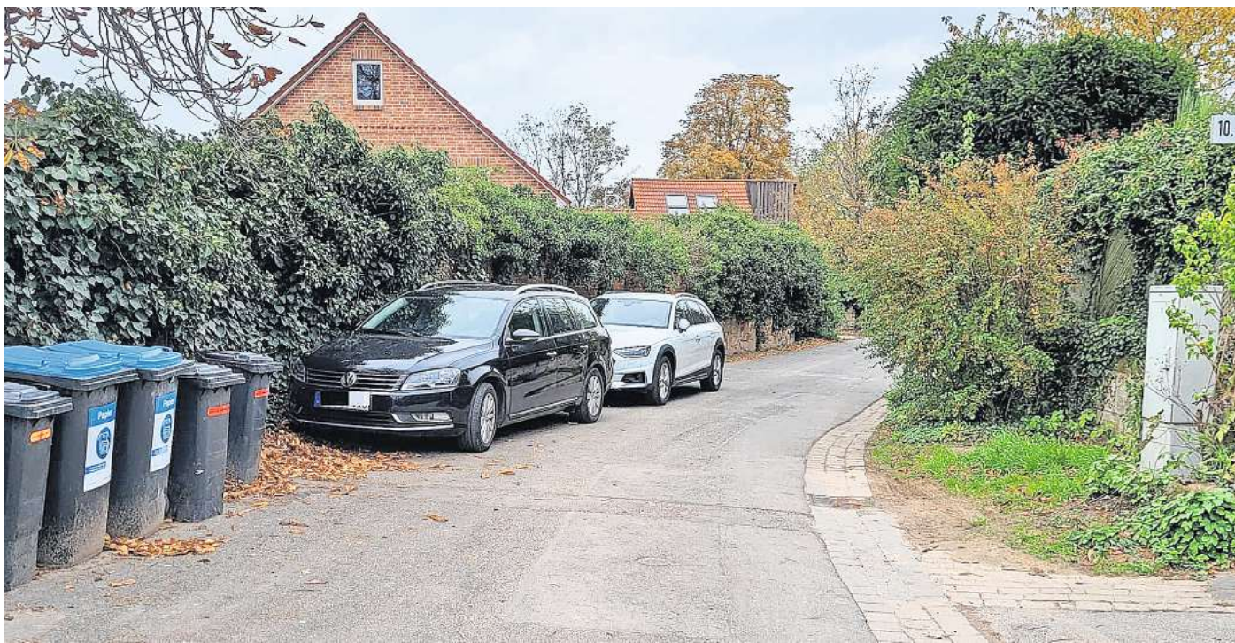
Zu schmale Fahrbahn: Am Kapellenweg sorgen regelmäßig Mülltonnen und parkende Autos für Engpässe.

Der Ortsrat betrieb auch Ursachenforschung für Engpässe. Demnach gibt es unter anderem für die Mieter der Wohnung im Dorfgemeinschaftshaus (DGH) keine ausgewiesenen Parkplätze. Die Mitglieder dieses Haushaltes – mit mehreren Autos – seien deshalb oft gezwungen, am schmalen Fahrbahnrand der angrenzenden Beerenstraße ihre Fahrzeuge abzustellen. „Wenn sie ihre Autos auf den sechs öf-