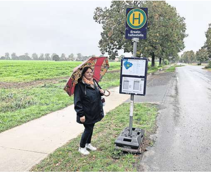
Noch müssen die Holtenser im Regen stehen: Für die Ersatzhaltestelle an der B217 haben die lokalen Gewerbetreibenden einen Unterstand organisiert.

B217: Gewerbetreibende organisieren Wetterschutz – und es gibt mehr Sicherheit für Schulkinder