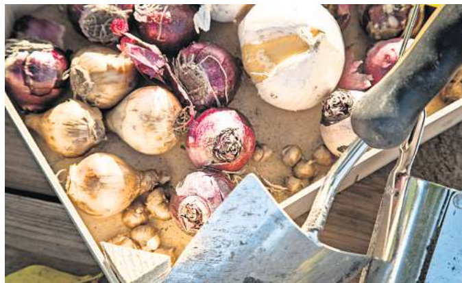
Der Mix macht's: Hier warten Hyazinthen, Krokusse, Narzissen und Zierlauch darauf, in die Erde zu kommen.