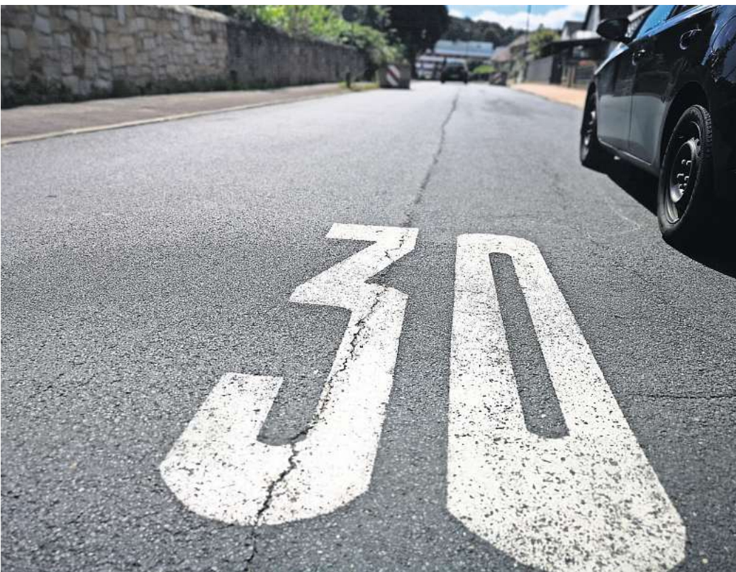
Deutlich sichtbar: In Gehrden ist, wie hier auf der Franzburger Straße, seit Jahren in der Kernstadt nur Tempo 30 erlaubt. Ausgenommen davon sind die Bundes- und Landesstraßen, die durch das Stadtgebiet führen.

Gehrden. Es ist eine kleine, aber wichtige Änderung im Straßenverkehrsgesetz (StVG), die der Bundestag kürzlich beschlossen hat: Sie räumt den Kommunen künftig mehr Befugnisse ein, auch ohne Unfallschwerpunkte Tempo-30-Zonen auf ihren Straßen einzurichten. Für Gehrden hat diese geplante Neuerung allerdings nur bedingt Auswirkungen. Denn die Stadt ist in Bezug auf Tempo 30 schon weiter als die meisten anderen Kommunen. „Im Bereich der Gemeindestraßen haben wir im Gehrden Stadtgebiet nahezu flächendeckend Tempo 30“, betont Stadtsprecher Frank Born. Für die Anordnung von Tempo 30 auf Bundesstraßen, Landesstraßen und Kreisstraßen ist die Region Hannover als untere Verkehrsbehörde zuständig. Das bedeutet: Über die Ortsdurchfahrten kann die Stadt Gehrden gar nicht entscheiden. Dennoch ist Gehrden im vergangenen Jahr der Städteinitiative „Tempo 30“ beigetreten. Auslöser ist ein Antrag des Ortsrats Lemmie. Dort wird schon seit Langem gefordert, auf der Deisterstraße ein durchgängiges Tempo-30-Limit zu erlassen. Auch in Leveste gibt es den Wunsch, die Geschwindigkeit auf der Durchfahrtsstraße auf 30 Kilometer pro Stunde zu begrenzen. „Die Chance sind nun gestiegen, weil die Voraussetzungen dafür aufgeweicht worden sind“, sagt Born. Doch er schränkt: Die Entscheidung trifft