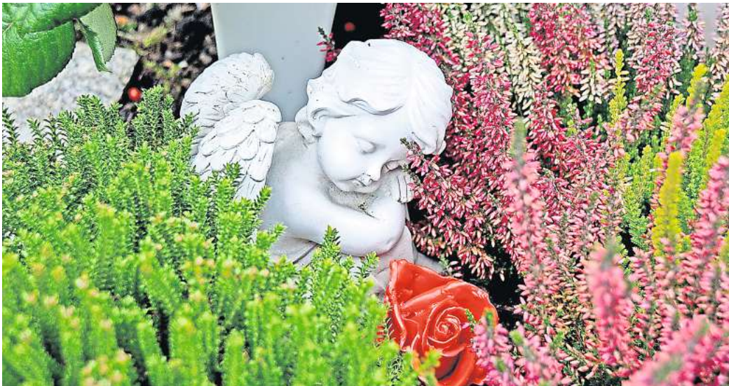
Zum Totensonntag finden sich zahlreiche Möglichkeiten, Verstorbener zu gedenken.

Der Trauer Ausdruck verleihen – Gefühle und Verbundenheit über den Tod hinaus