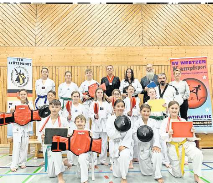
Grund zur Freude: Vom Preisgeld in Höhe von 400 Euro ist neue Ausrüstung für das Training angeschafft worden.