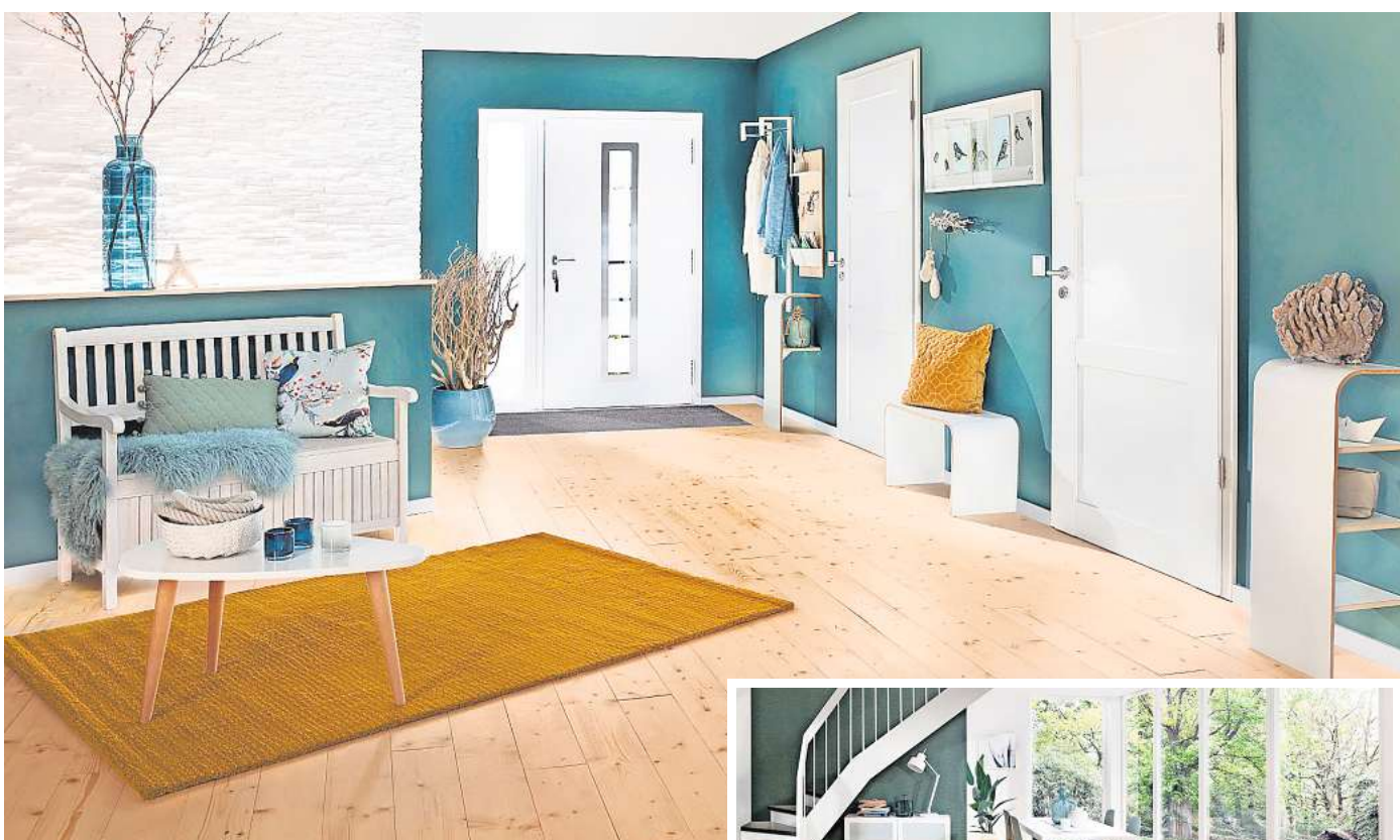
Mit einem massiven Holzfußboden holt man sich ein Stück pure Natur ins Haus.

Aktuell im Trend liegen helle, leichte Böden aus nordischer Kiefer und Fichte, die dank des natürlichen Astanteils über eine besonders schöne, charakterstarke Maserung verfügen. Die Farbnuancen des Holzes wirken warm und freundlich und harmonisieren wunderbar mit Einrichtungsstilen wie dem Landhaus-, Scandi- oder Hygge-Look. Gut fürs grüne Gewissen: Die Massivholzdielen stammen aus nachhaltiger, PEFC-zertifizierter Forstwirtschaft, sind stets sehr gut verfügbar und punkten dank kurzer Transportwege mit einer CO 2 -freundlichen Ökobilanz. Dass sie sich im Renovierungsfall