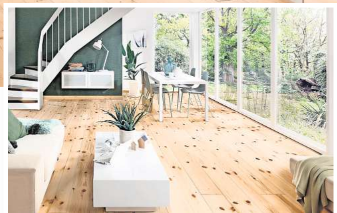
Massivholzdielen gibt es in verschiedenen Holzarten, Farbvarianten und Strukturen. Besonders beliebt sind aktuell helle, leichte Böden aus nordischer Fichte und Kiefer.