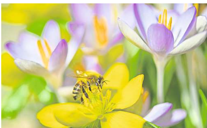
Farbenfrohe Bienenfreude: Der Winterling sollte jetzt eingesetzt werden, um im Frühjahr Nahrung zu bieten.

Achtung: Die Zwiebeln sollten glatthäutig, fest und trocken sein. Sie faulen, wenn an der Pflanzstelle Staunässe entsteht. Überhaupt vertragen nur ein paar Sorten dauerhaft feuchte Erde, Sonne dagegen mögen die meisten. Zu den ersten, deren Blüten sich ab Februar von den noch schwachen Sonnenstrahlen streicheln lassen, gehören Iris reticulata und Eranthis, der Winterling. Sie wachsen ebenfalls