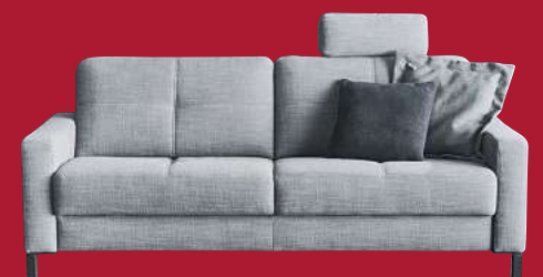
3-SITZER UND 2-SITZER