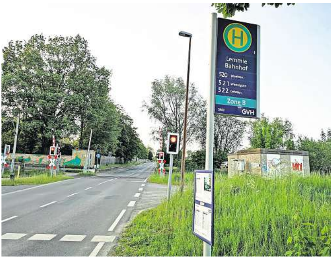
Umbau gewünscht: Die Bushaltestelle am Lemmier S-Bahnhof soll behinderten-gerecht ausgebaut werden.

„Im Mobilitätskonzept sind einzelne Punkte aufgeführt wor-den, aber sie sind weit weg da-von, auch umsetzbar zu sein“, sagt er. Martins Kritik: Den Planer hätten bei der Ausarbeitung die lokalen Kenntnisse gefehlt. In vielen Punkten seien sie sehr all-gemein geblieben. Das findet auch Urban. Das Mobilitätskon-zept stoße schnell an seine Gren-