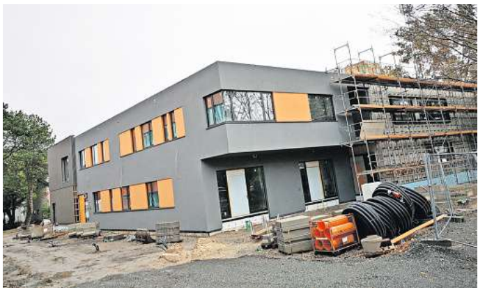
Neue Mensa: An der Ecke Schulstraße/Lange Feldstraße wird eine neue Zentral-mensa gebaut.

Auch die Modernisierung der Oberschule Gehrden ist ein zä-her und langwieriger Prozess. Durch die aufgrund von Be-standsmängeln (Statik) eingetre-tene Bauzeitenverzögerung bei der Sanierung des Bauteils B der OBS konnte eine Fertigstellung und Wiederinbetriebnahme des Gebäudekomplexes nicht wie geplant erfolgen. Erst im zweiten Quartale 2024 soll der Schul-trakt, in dem Fachräume für Kunst, Werken und die Naturwis-senschaften sowie Klassenräu-me untergebracht sind, fertig sein. Gegenwärtig werden die Trockenbauarbeiten und haus-technischen Installationen in al-len Geschossen ausgeführt, auch der der Estrich wird einge-baut. Die Inbetriebnahme soll zum Ende der Sommerferien 2024 erfolgen.