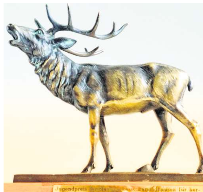
Barsinghäuser Hirsch: Die Stadtparkasse bittet um die Einsendung von Vorschlägen für die Verleihung des gleichnamigen Jugendpreises.