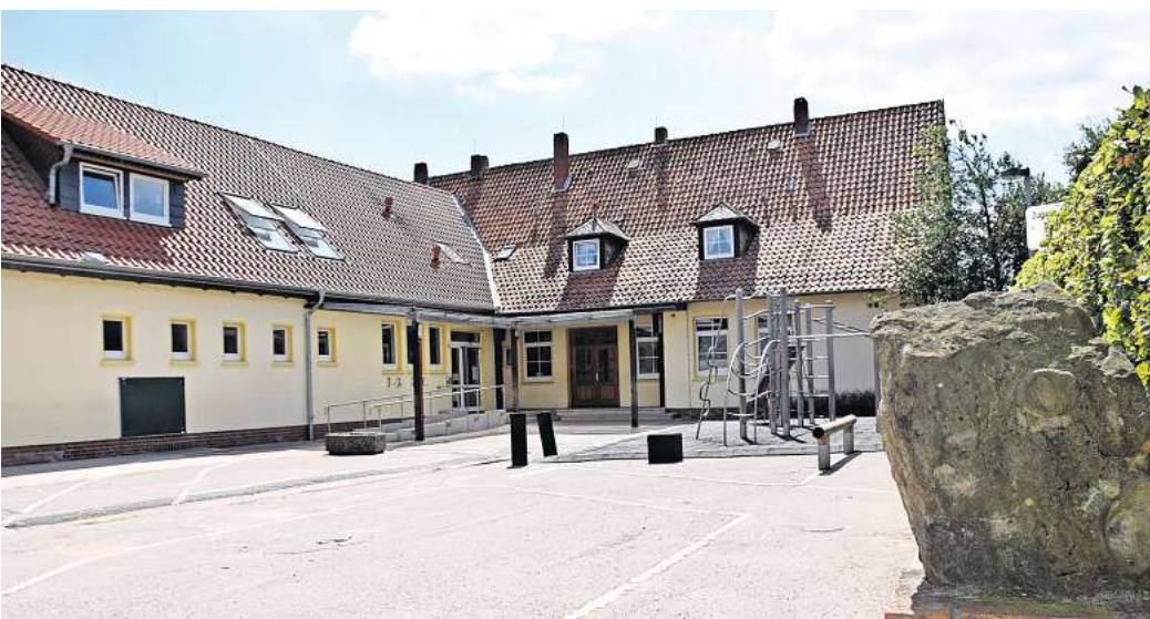
Nicht ganztagsauglich: Der alte Baukörper der Grundschule Bente bietet nur im Dachgeschoss Platz für notwendige Differenzierungsräume.

Einzige Ausnahme ist die neu gebaute Grundschule Auf dem Hagen in Empelde. Diese Einrichtung wird wie im Vorfeld geplant bereits im kommenden Schuljahr von einer verlässlichen Grundschule in eine Ganztagschule umgewandelt. Verzögerungen werden sich dagegen die Neu- und Umbauten an den anderen Standorten. So soll in Weetzen eine moderne, ganztagsaugliche Grundschule mit Sporthalle für 34 Millionen Euro neu entstehen. Das Projekt soll aber nach den Planungen