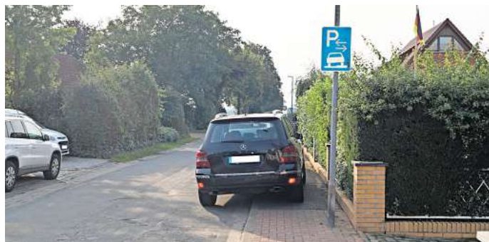
Bürgersteigparken erlaubt: Im Wehrfeld bleibt auf dem Fußweg kaum Platz zum Gehen.

Welchen Zeitraum das umfassen wird, konnte Schulz noch nicht sagen. Die neuesten Vorschläge des Arbeitskreises gehen nun auch erst mal zur Beratung in die Ratsfraktionen. Danach müssen die Parteien entscheiden, ob sie den Empfehlungen des Arbeitskreises folgen wollen. Unstrittig erscheint dabei die Kostenfrage für die Hortkinder in Bente: Das müsse gratis angeboten werden, stellte Kai Roegglen, Fachbereichsleiter Bildung, fest. Letztlich darf die unkonventionelle Lösung für Bente keine Benachteiligung der dortigen Kinder gegenüber der kostenlosen Ganztagschule mit sich bringen.