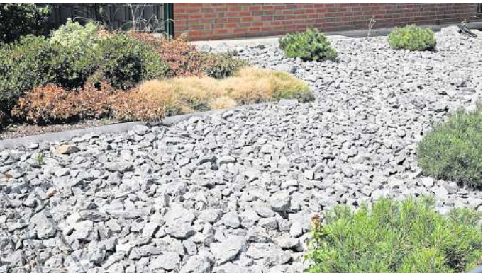
Avantgarde oder Garten des Grauens? Der Verwaltung schätzt die Zahl der Schottergärten in Barsinghausen auf etwa 1800.

Seit Oktober 2022 kümmern sich zwei Mitarbeiter in Hannovers Bauverwaltung um die laut Niedersächsischer Bauordnung schon seit 2012 verbotenen Schottergärten. Es wurden eigene zwei neue Stellen geschaffen, um baupolizeilich gegen die Steinwüsten vorzugehen. Die Verwaltungsmitarbeiter werten unter anderem Luftbilder aus und befahren die Straßen, um alle Grundstücke systematisch zu erfassen. Eigentümer von Schottergärten werden angeschrieben und haben zunächst die Möglichkeit, die versiegelte Fläche freiwillig umzugestalten. Tun sie dies nicht, kann eine Ordnungs-