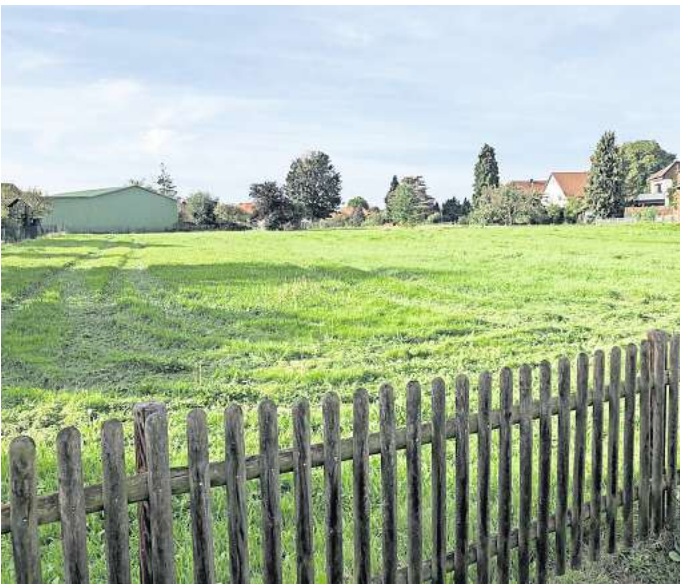
Hier kommt das Minibaugebiet hin: Auf der Grünfläche zwischen Linderter und Hamelner Straße sollen sieben Doppelhäuser mit 14 Wohneinheiten entstehen.

Einzige Ausnahme ist das erste Haus auf der Westseite. Hier