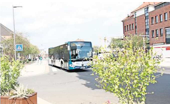
SprintH-Bus: Mit den Bussen der Linie 500 ist Gehrden mit Hannover verbunden. Etwa 45 Minuten dauert die Fahrzeit bis zum Hauptbahnhof.

Für Hischke steht fest: Ein beschleunigter Nahverkehr verkürzt die Reisezeit gegenüber dem Autoverkehr signifikant und steigere die Pünktlichkeit. Gerade Letzteres sei ein vorherrschender Mangel in der Kernstadt von Gehrden. Durch enge Straßen und Ampeln würden die Busse regelrecht ausgebremst. „Durch eine Bevorrechtigung beziehungsweise Beschleunigung erlangt der Busverkehr einen deutlichen Wettbewerbsvorteil, was