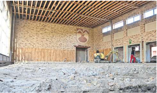
Man achte auf das Wappen: Noch während des Umbaus lagen zwischen Wappen und Hallendecke vier Reihen Backsteine. Wegen einer verbauten Heizung musste die Decke nach unten gezogen werden. Der Hallenboden wurde jedoch offenbar nicht im selben Maße abgesenkt.

ne wurden bei den Planungen nie mit einbezogen und stattdessen vor vollendete Tatsachen gestellt“, kritisiert Schibille die Kommunikation der Stadtverwaltung.