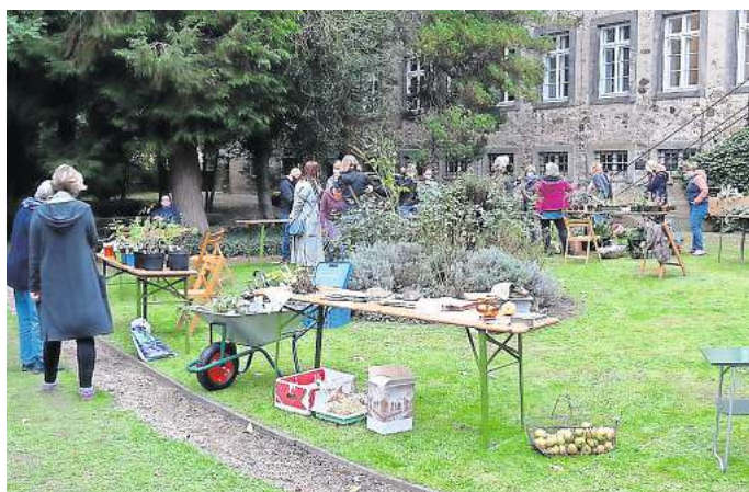
Tauschen und Fachsimpeln im Klostergarten: Auch im vergangenen Jahr war die Staudenbörse im Klostergarten gut besucht.