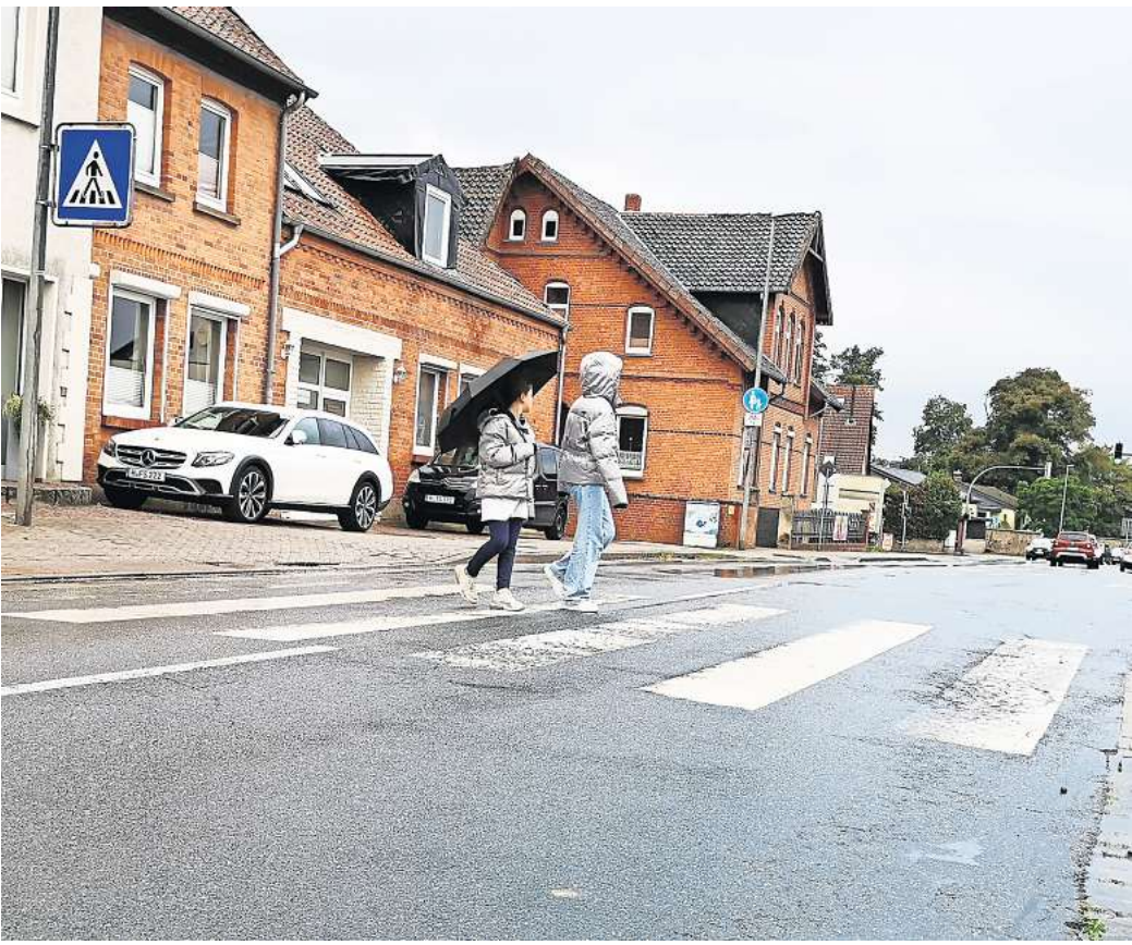
Abgenutzt: Der Zebrastreifen an der Gehrdenener Straße in Leveste muss dringend erneuert werden.