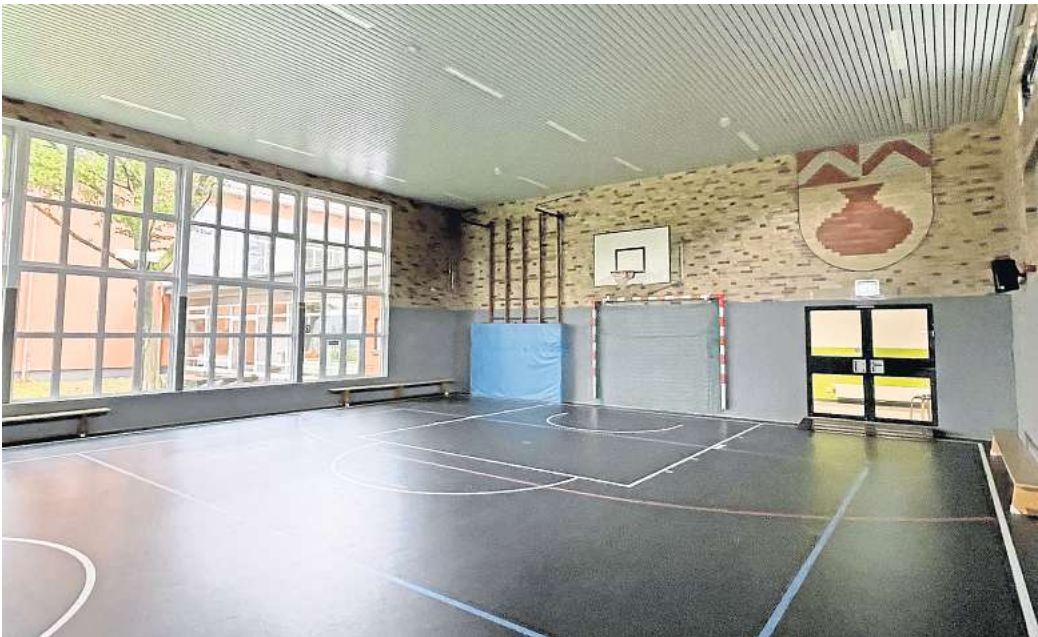
Verdächtig: Vor der Sanierung lagen zwischen dem Wappen an der Wand und der Hallendecke nach Angaben des TSV Groß Munzel noch einige Reihen an Ziegelsteinen. Diese sind nach dem Umbau nicht mehr zu sehen.