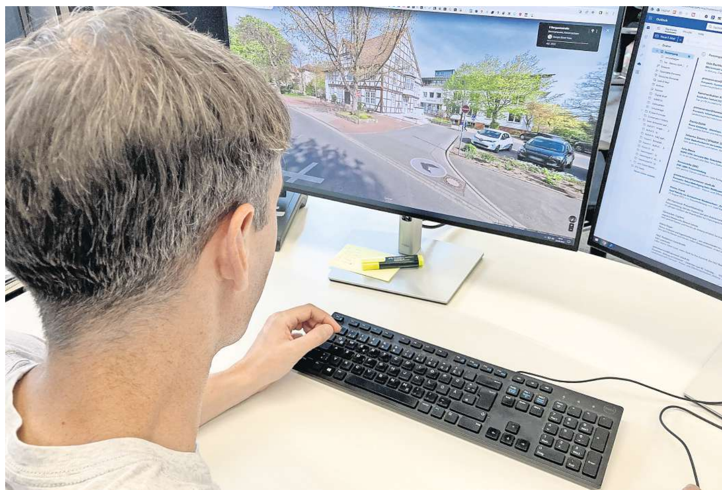
Orientierung kaum möglich: Wer sich bei Google Street View in Barsinghausen umsehen will, findet dort nur die Hauptverkehrsstraßen.

Anbieter von Sanierungs- und Energielösungen, Beratungs- und Finanzdienstleistungen ergänzen das Vortragsangebot mit eigenen Messeständen, an