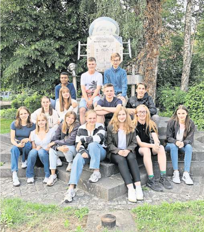
Engagierte Jugend: Diese 14 Kandidierenden gingen bei der Jupa-Wahl in Wennigsen ins Rennen. Elf haben den Sprung ins neue Parlament geschafft.

Elf Mitglieder wählen Jugendbürgermeister