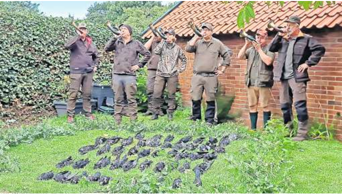
Halali: Nach der Jagd präsentieren die Jäger die Beute. Insgesamt schossen die Jäger des Hegerings Barsinghausen am Stadtfestwochenende 55 Rabenkrähen.

Wo Tiere aber kaum natürliche Feinde haben und der Mensch zusätzlich nicht regulierend einwirkt, kann sich eine Population stark vergrößern. So geschehen im Calenberger Land. Klöber