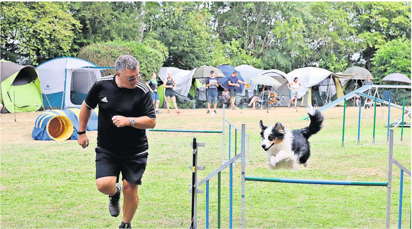
Der Abschlussprung: Nach dem letzten Hindernis eines Parcours wird jeweils die Zeit der teilnehmenden Teams gestoppt.

Seeger steckt zurzeit mitten in den Planungen für ein großes Fest: Anlässlich des 65-jährigen Vereinsbestehens lädt der PHV für Ende September seine zurzeit 138 Mitglieder und Ehrengäste zu einer Sommerparty ein. Seeger erinnert sich aber auch noch gut an Zeiten mit deutlich weniger Mitgliedern. Der 72-jährige Rentner ist bereits seit 40 Jahren beim PHV – und seit 15 Jahren Vorsitzender. „Vor 40 Jahren haben auf dem Gelände nur zwei bis drei Trainer ohne Lizenz an maximal zwei bis drei Tagen pro Woche Schutzhunddienste angeboten“, sagt er. Im Laufe der