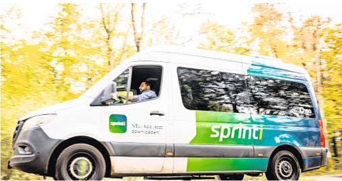
Neu ab Dezember: Die Sprinti-Busse fahren künftig auch im Barsinghäuser Stadtgebiet.

Dennoch: „Mit Sprinti erhöhen wir die Mobilität im ländlichen Raum. Der reguläre Busverkehr bietet hier nur eingeschränkte Möglichkeiten“, sagte Geschwinder, Teamleiter für Verkehrsentwicklung und -management. Mit Sprinti kommen barrierefreie Mercedes-Kleinbusse zum Einsatz, die von den Fahrgästen mithilfe einer App oder per Telefon gebucht werden können. Wer in der