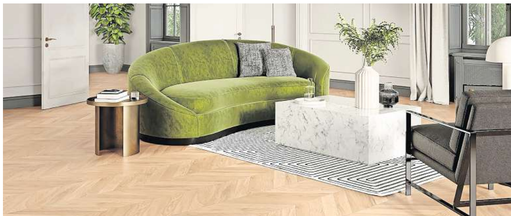
Parkett mit Fischgrätmuster war einst exklusiv für königliche Ansprüche. Mittlerweile gilt es in unseren eigenen vier Wänden als klassisches Design-Highlight.

Die Renaissance, zu deutsch etwa „Wiedergeburt“, markiert neben dem historischen Übergang vom Mittelalter in die Frühe Neuzeit auch die unverwechselbare Kunstepoche, die große Künstler wie Leonardo da Vinci und Michelangelo hervorbrachte. Auch ein echter Wohnklassiker fand zu dieser Zeit seinen Ursprung: Parkett in Fischgrätverlegung. Was einst ausschließlich die Böden prachtvoller Ballsäle in fürstlichen Schlössern zierte, ist rund 500 Jahre später auch in unseren eigenen vier Wänden zum beliebten Bodenbelag geworden. In einer neuen Parkett-Kollektion lassen Fußboden-Experten das klassische und zeitlose Verlegungsmuster wieder aufleben. Dabei setzen sie auf Chevron-Dielen für die französische Art der Fischgrätverlegung. Statt der rechteckigen Form haben diese Dielen abgeschrägte Kopfkannte im 45°-Winkel. Diese ermöglichen nicht nur einen klassischen, ab-