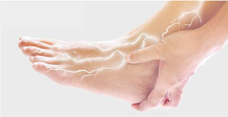
Brennen, Kribbeln oder Taubheitsgefühle in Füßen und Beinen sind häufig Begleiterscheinungen von Nervenschmerzen

len Nervensystem und kommt laut Arzneimittelbild bei scharfen, schießenden Schmerzen längs einzelner Nervenbahnen zum Einsatz. Doch nicht nur das – Gefühle, als würden die Glieder von elektrischem Strom