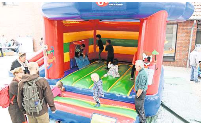
Großer Spaß für die Kleinsten: Der Verein Jupa&friends wird wieder eine Hüpfburg aufbauen.

So pumpt der Verein Jupa&friends eine Hüpfburg auf und verkauft Waffeln. Einen Stand mit Kinderschminken, Glitzertattoos, Ballontieren und Kreativwerkstatt betreut der