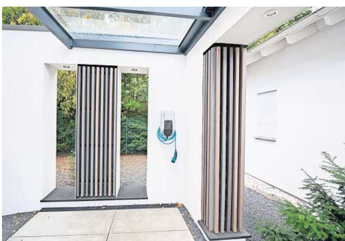
Kleine Ladestationen fürs E-Auto lassen sich unauffällig im Carport oder in der Garage anbringen.

«Zuerst einmal einen ausreichend dimensionierten Stromanschluss», sagt Martin Brandis. «Der muss gegebenenfalls neu verlegt werden, in der Regel reicht die normale Hausinstallation nicht aus.» Die Wallbox wird über eine separat abgesicherte Zuleitung an die Hausinstallation angeschlossen. «Wallboxen brauchen außerdem geeignete Schutzvorrichtungen gegen Gleich- und Wechselstromfehler, die verhindern, dass Perso-