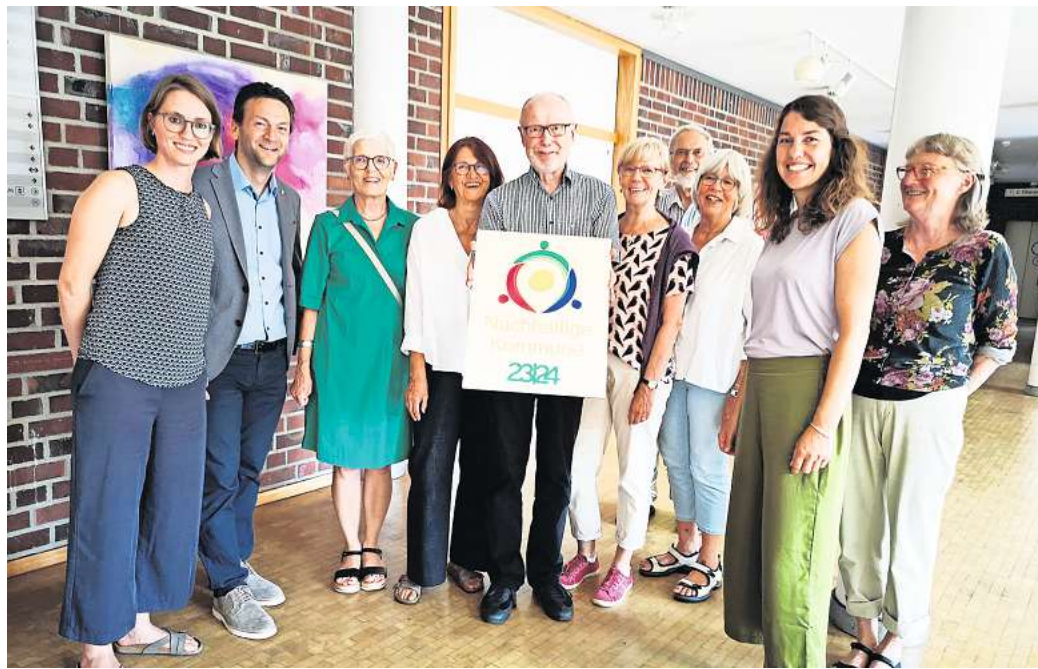
Ein Zeichen der Verpflichtung: Die Stadt Gehrden hat von der UAN das Nachhaltigkeitslogo überreicht bekommen.