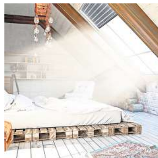
Dank der Beschattungshelfer „made in Germany“ bleibt es selbst unter dem Dach und im Wintergarten angenehm kühl.

Gesunder Schlaf ist wichtig. Nur wenn wir nachts zur Ruhe kommen, kann sich unser Körper regenerieren, um am nächsten Tag wieder fit und leistungsfähig zu sein. Im Sommer gelingt das nicht immer, denn die eigenen vier Wände heizen sich mit der Zeit auf und schon am frühen Morgen scheint das Sonnenlicht ins Schlafzimmer. Die Lösung: Aluminium-Rollläden. Sie reflektieren bis zu 92 Prozent der Sonnenstrahlen, noch bevor diese auf die Fensterscheibe treffen und schützen so nicht nur vor viel Helligkeit, sondern auch vor Hitzestau. Dank der Beschattungshelfer „made in Germany“ bleibt es auch unter dem Dach und im Wintergarten angenehm kühl.