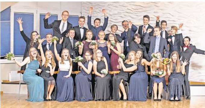
Im Schüler-Tanzkurs lernen Jugendliche ab 13 Jahren die wichtigsten Paartänze und feiern ihren großen Premierenball

Am 22. September startet dann auch ein neuer Paartanzkurs für Schüler*innen. Hier lernen Jugendliche ab 13 Jahren alle wichtigen Tänze und feiern nach 15 Wochen ihren großen Premierenball. Zum Schülerkurs gehören auch eine Elterntanzstunde und ein Seminar für moderne Umgangsformen. Im zweiten Teil des Kurses absolvieren die Schüler*innen dann ihr Bronze-Diplom und erhalten das ADTV-Gesellschaftszertifikat. Ein weiteres Highlight sind die regelmäßig stattfindenden Partys, bei denen die Jugendlichen auch abseits des Tanzkurses neue Leute treffen und häufig Freundschaften fürs Leben knüpfen. Die Anmeldung zum Schülerkurs ist