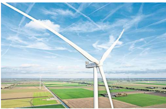
Hoch hinaus: Die Windräder bei Linderte sollen bis zu 260 Meter messen.

Ronnenberg. Das ist eine Ansage: Die Stadt Ronnenberg will die Planungen für die neuen Windkraftanlagen bei Linderte massiv aufstocken. Anstelle der drei veralteten Anlagen, die dort aktuell betrieben werden, sollten ursprünglich fünf neue entstehen. Später sollte der Windpark auf neun Windräder ausgebaut werden. Die Planung könnte nun überholt sein. Denn nach Absprachen mit dem Investor will die Stadt die Modernisierung des Windparks von Anfang an massiv vorantreiben und mög-