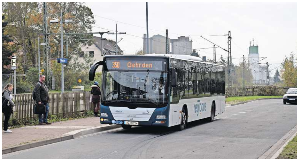
Gestrichene Buslinie: Zwischen Weetzen und Gehrden fahren seit Dezember 2019 keine Busse der Linie 350 mehr.

AG Mobilität unterstützt Verlängerung der Buslinie 500 – und zweifelt an genannten Fahrgastzahlen