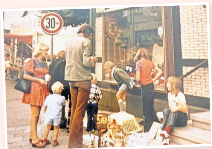
Erinnerungsfoto aus den Siebzigern vor der Glück-Auf Apotheke: Der Flohmarkt war auch damals eine feste Instanz beim Stadtfest.