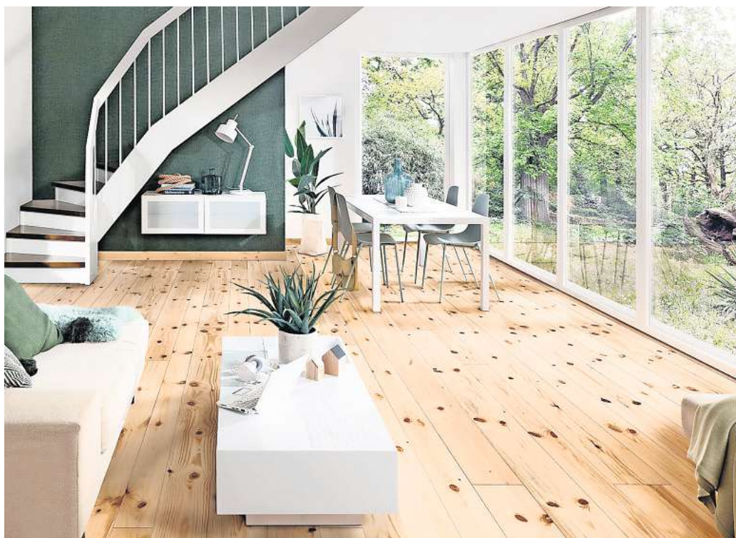
Helle Massivholzdielen aus skandinavischer Fichte und Kiefer verleihen dem Raum eine einladende, natürliche Ausstrahlung und harmonisieren ideal mit modernen Einrichtungsstilen.

ideale Basis für eine ansprechende Raumgestaltung und verleihen dem Ambiente einen naturnahen Wohlfühl-Charakter. Absolut im Trend liegen aktuell Fußböden aus skandinavischem Fichten- und Kiefernholz. Dem frostigen Klima, in dem die Bäume heranwachsen, verdanken die Massivholzdielen ihre gleichmäßige, feijnährige Maserung und ihre extreme Robustheit. Im Vergleich zur Herstellung