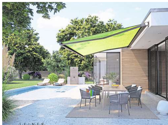
Eine neue Kassettenmarkise setzt Akzente im Außenbereich – und sorgt somit für schöne sommerliche Momente.

Es gibt einzelne Elemente, mit denen man im Außenbereich wahre Akzente setzen kann – und das sowohl optisch als auch funktional. Ein Beispiel dafür ist eine brandneue Kassettenmarkise, die mehrere Vorteile aufweist. Mit einem geradlinig-eckigen Design passt sie sich wunderbar an die Architektur moderner Neubauten an, die sich an der klaren Formensprache des Bauhausstils orientieren. Zudem ist die Markise sehr filigran. Eingefahren nimmt sie sich angenehm zurück und wirkt wie ein Accessoire an der Wand. Die optische Leichtigkeit wird unterstrichen durch ihre geringe Aufbauhöhe von nur 15 cm, somit eignet sie sich auch für kleine Häuser oder Winkel. Herkömmliche Kassetten haben häufig eine Aufbauhöhe von 25 cm, was oftmals sehr klobig wirkt. Ihr vergleichsweise geringes Gewicht erweitert die Einsatzmöglichkeiten an unterschiedlichen Fassaden und