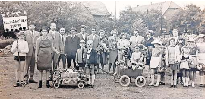
Historisch: Kleingärtner mit ihren Familien aus den Anfangsjahren des Vereins.