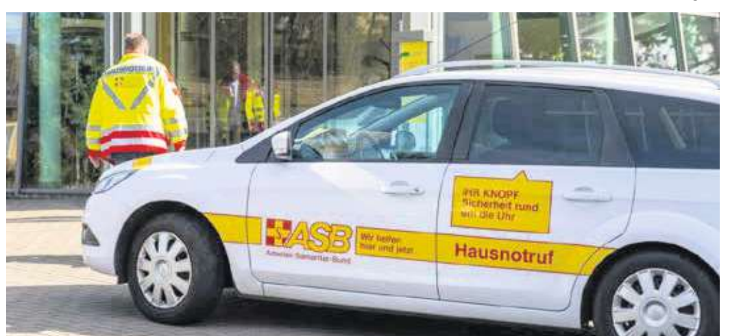
Die Fahrzeuge des Hausnotrufs sind medizinisch und technisch bestens ausgerüstet.