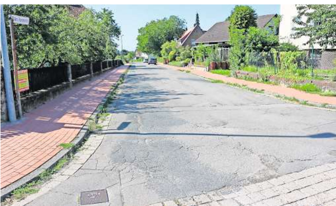
Buckelpiste mit Unebenheiten: Die Straße Am Hammfeld soll auf dem Teilstück zwischen Gergarten und Hengstweg saniert werden.

Benthe. Die Asphalttschicht ist an vielen Stellen aufgebrochen, Löcher machen sich auf der Straße breit: Die Straße Am Hammfeld im Ronnenberger Stadtteil Benthe bedarf vielerorts einer Überarbeitung. Jetzt handelt die Stadt und kündigt eine Straßensanierung an. Ab kommenden Montag, 21. August, soll in dem Teilbereich zwischen der Straße Gergarten und der Einmündung zum Hengstweg eine neue Fahrbahndecke aufgebracht werden. Dafür ist zunächst das Abfräsen der vorhandenen Asphaltdeckschicht vorgesehen, bevor eine neue Abdeckung aufgebracht werden kann. In Teilbereichen sollen außerdem defekte Randeinfassungen ausgetauscht werden.