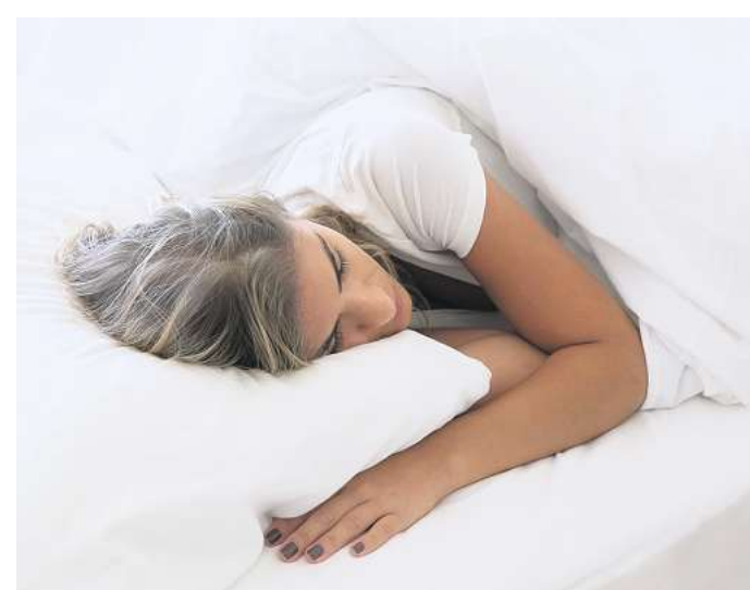
Das richtige Kopfkissen zu finden, kann manchmal lange dauern.

stets genutzt werden. Denn der Mensch sieht und fühlt mehrdimensional. (LPS/AM)