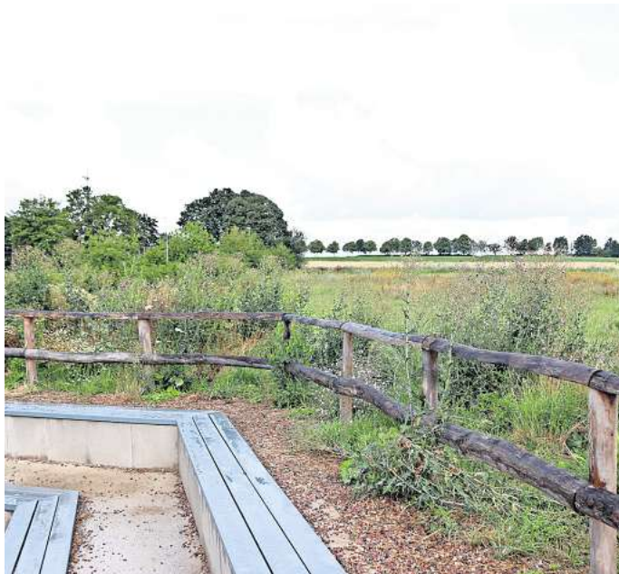
Platz für eine neue Kita: Von der Tribüne der Skateanlage aus gesehen, soll die Einrichtung auf einer Grünfläche nördlich des Bröhnwegs gebaut werden.