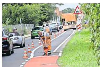
Bessere Wahrnehmung: Die Rottfärbung der Fahrdachschutzstreifen ist außerhalb der Region Hannover keineswegs Standard.

Für die Arbeiter, die mit der Markierung der Fahrdachschutz-