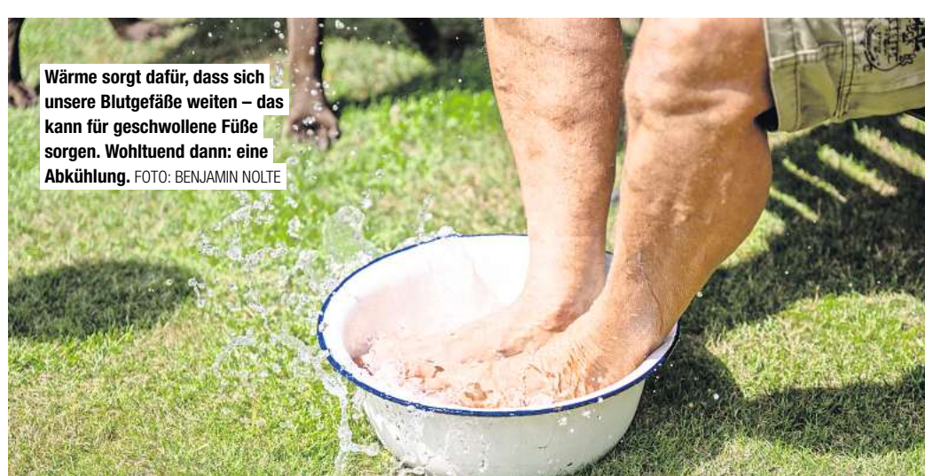
Wärme sorgt dafür, dass sich unsere Blutgefäße weiten – das kann für geschwollene Füße sorgen. Wohltuend dann: eine Abkühlung.

„Frauen trifft es eher als Männer“, sagt Funke. Das liegt daran, dass sie ein schwächeres Bindegewebe haben. Darin haben die Venen bei andauernder Hitze weniger Halt. Treten geschwollene Beine und Füße bei Ihnen immer wieder auf, sollten Sie die Ursache besser ärztlich abklären lassen. Denn die Beschwerden können auch auf ernsthafte Erkrankungen von Herz, Leber