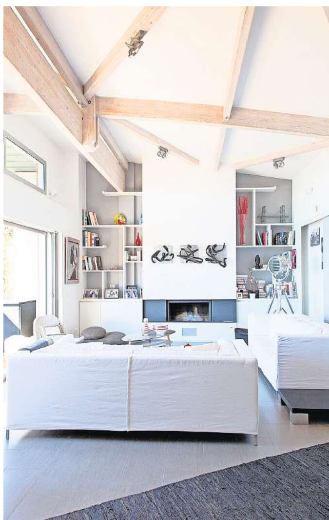
Hohe Zimmerdecken geben mehr her als nur Platz für eine Leuchte.

Auch hochwertige Deckenpaneele aus Holz oder ein Anstrich in moderner Betonoptik können zum verbesserten Wohnambiente beitragen und ein echtes Highlight im Zuhause werden. Egal für welche Variante man sich entscheidet: Die Zimmerdecke sollte