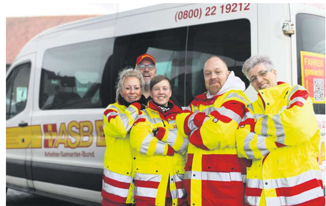
Die freundlichen und medizinisch geschulten ASB-Teams bringen Sie sicher an Ihr Ziel.

Sie haben kurzfristig einen Termin beim Arzt bekommen oder freuen sich auf einen lang geplanten Theaterbesuch? Die Gründe, unseren Fahrdienst in Anspruch zu nehmen, sind vielfältig. Sie bestimmen das Fahrziel. Wir stellen uns ganz auf Ihre Bedürfnisse ein. Unser Service: Wir holen Sie pünktlich und zuverlässig an Ihrer Haustür ab und bringen Sie sicher durch jedes Treppenhaus – bei Bedarf auch gemeinsam sitzend im Tragestuhl. Kurze Fahr- und Wartezeiten sind für uns selbstverständlich.