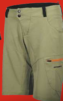
DYNAMICS Damen Garda Bike-Shorts

UVP 79,95 *** Auf UVP 51,- € SPAREN 28,-