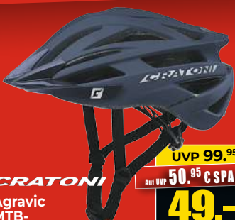
CRATONI Agravic MTB- Helm