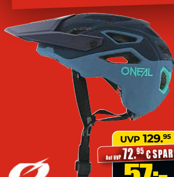
ONEAL Pike MTB-Helm