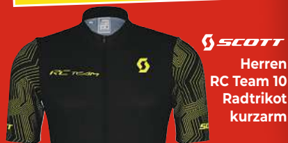
SCOTT Herren RC Team 10 Radtrikot kurzarm