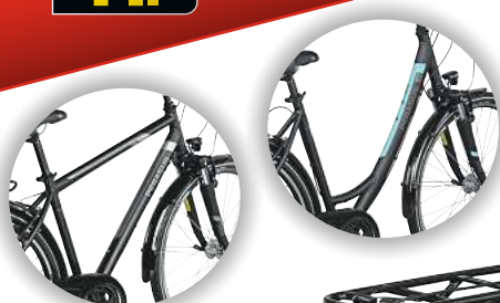
PEGASUS Piazza 21 • leichter, fahrradstabiler Alurahmen mit Komfort-Federgabel • einfach bedienbare 21 Gang Shimano Trekking-Schaltung • praktischer Alu-Systemgepäck-träger • Bereifung mit Pannenschutz-einlage • verstellbarer Komfortlenker • LED-Lichtanlage Best.-Nr.: 99654

SCOTT Herren Trail Flow W/PAD Bike Shorts UVP 79,95 Auf UVP 35,95 € SPAREN 44,-