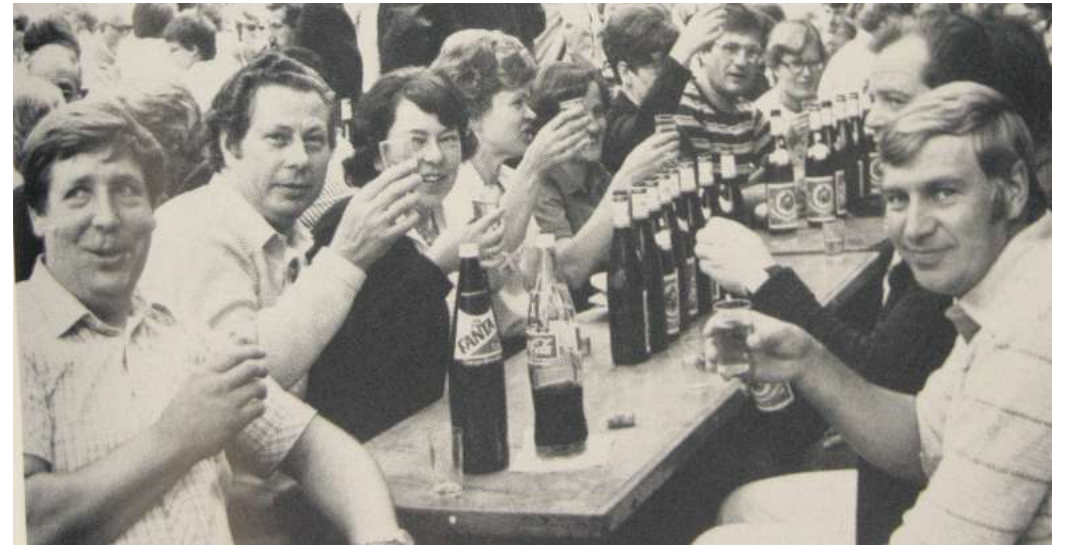
Na, dann Prost! So wurde früher beim Stadtfest gefeiert.