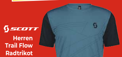
SCOTT Herren Trail Flow Radtrikot