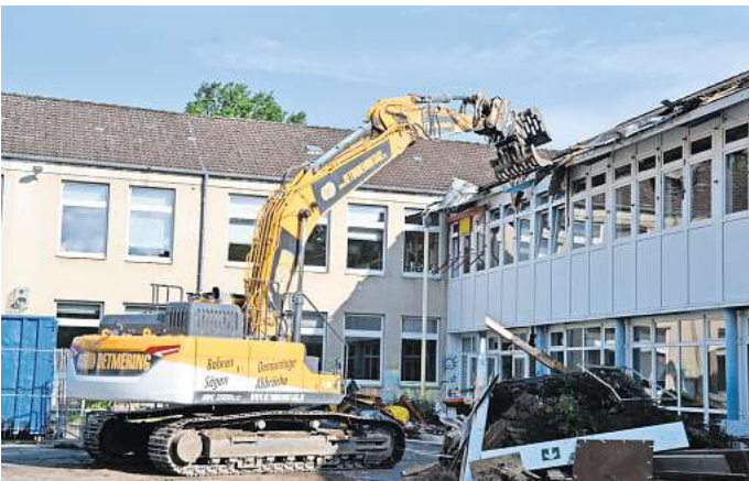
Ein Bagger trägt erste Teile des Zwischentraktes ab.

Wilhelm-Stedler-Schule: Dritt- und Viertklässler ziehen vorerst in BBS-Altbau