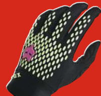
FOX Defend Race Fahrradhand- schu- he lang