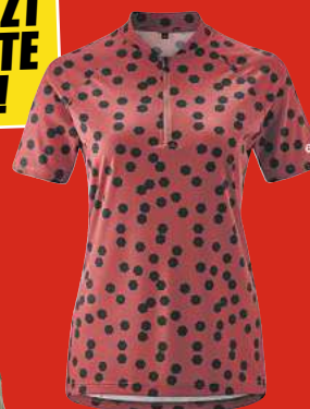
GONSO Damen Lilo HZ Radtrikot kurzarm

UVP 109,95 *** Auf UVP 60,- € SPAREN 49,-