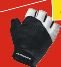
DYNAMICS Superfly 2.0 Fahrrad- hand- schu- he kurz