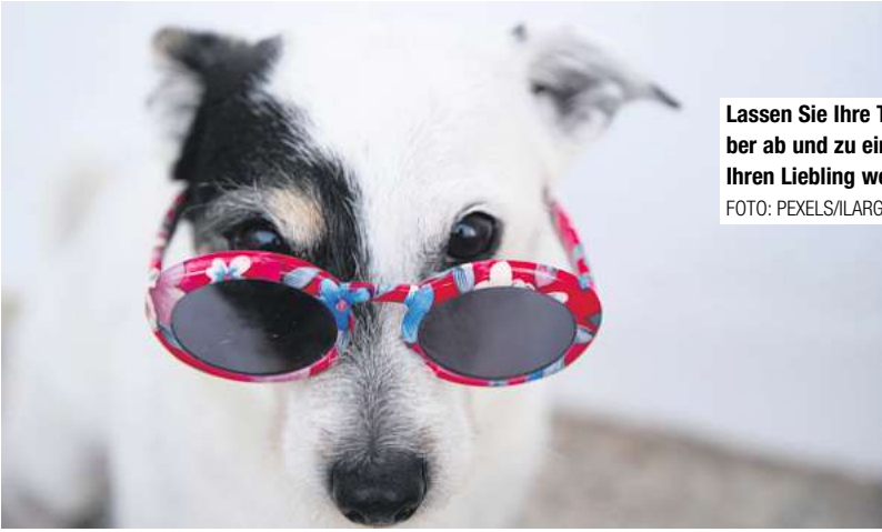
Lassen Sie Ihre Tierärztin lieber ab und zu einen Blick auf Ihren Liebling werfen.