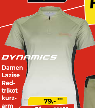
DYNAMICS Damen Lazise Rad- trikot kurz- arm

UVP 79,95 *** Auf UVP 51,- € SPAREN 28,-