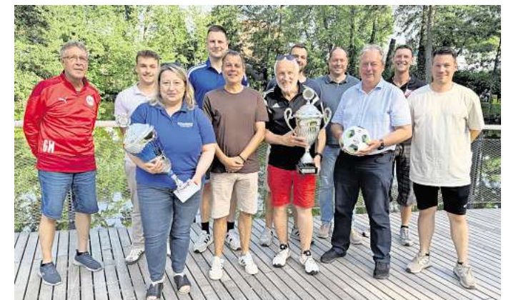
Vorfreude: Das Calenberger Masters ist für den 25. Juli in Barsinghausen terminiert.