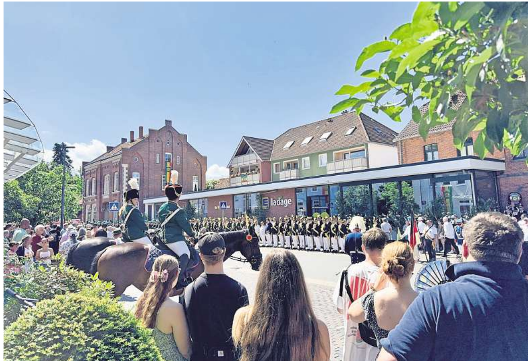
Die Parade beim Freischießen: Trotz Hitze finden sich viele Zuschauer und Zuschauerinnen ein.

Es habe keinerlei Zwischenfälle gegeben, so Rogge. Die Hitze mit Temperaturen von mehr als 30 Grad habe jedoch das Programm beeinflusst. So seien etwa Umzüge verkürzt und Getränkehalter für die Gürtel besorgt worden. Eine nette Geste von Wennigsern und Wennigerinnen sei es gewesen, den Teilnehmenden beim Umzug Getränke auf Tablett zu reichen. Bei den kühleren Temperaturen