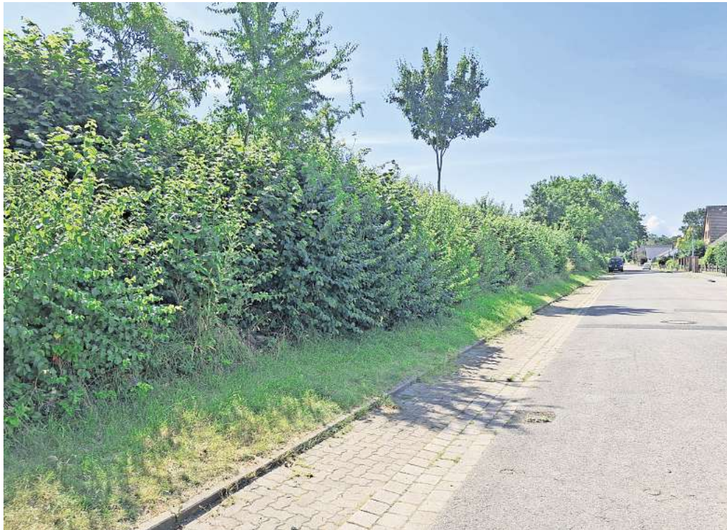
Pflegebedürftig: Den Wall an der Straße Haarbeeke muss der Bauhof etwa alle zwei Jahre zurückschneiden.

Maßnahmen der akuten Gefahrenabwehr könnten hingegen grundsätzlich immer erfolgen und dann entsprechend dokumentiert und nachbilanziert werden.