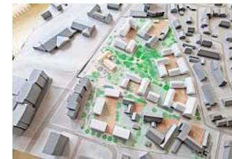
Im Modell: Die hellen Gebäude in der Darstellung zeigen die geplanten Neubauten in Empelde-Mitte.

Nach der Präsentation konnten die Besuchenden in drei Kleingruppen ihre Beiträge zur Gestaltung und Nutzung des neuen Gebäudes direkt anbringen. So wünschten sich die Anwesenden bei der Gestaltung unter anderem eine moderne Optik mit großen Fenstern und einer entsprechenden Farbgestaltung – eventuell angelehnt an das sogenannte Mondrianhoch-