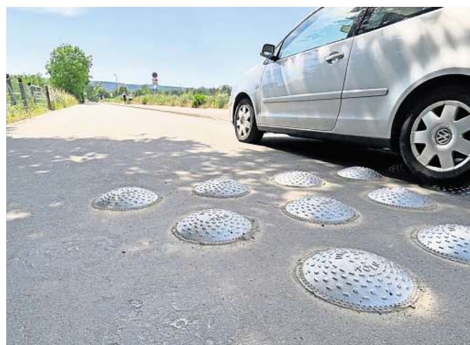
Sechs Zentimeter hoch und jeweils in Dreierreihen verlegt: Mit „Kölner Teller“ sollen Autofahrer auf dem Bröhnweg dazu gebracht werden, die vorgeschriebene Geschwindigkeit von maximal Tempo 30 einzuhalten.