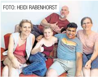
Jugendliche auf dem Weg in ein selbstbestimmtes Leben. Seite 6