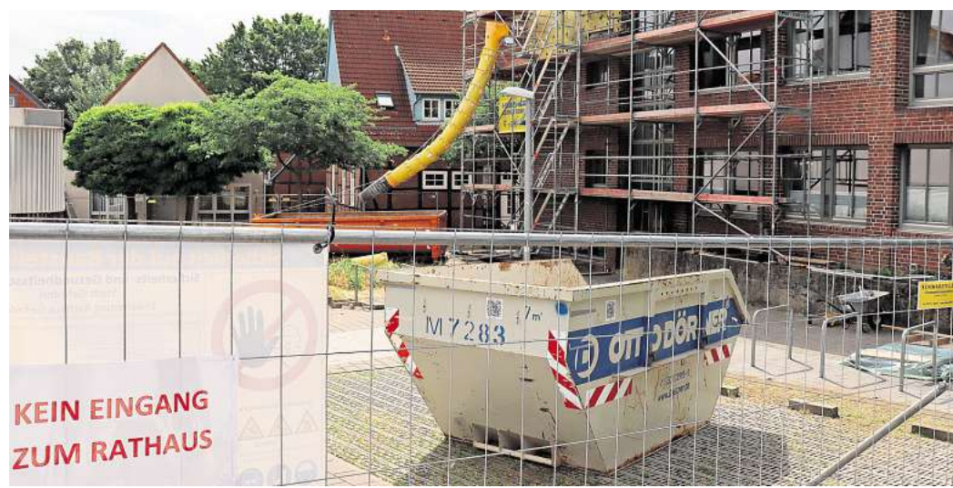
Angespannte Situation auf dem Rathaus-Parkplatz: Die Stadt hat für den beginnenden Rathausumbau eine Schotterfläche der Parkzone für die Baustelleneinrichtung abgesperrt. Weitere Abstellflächen werden außerdem für die notwendige Verlegung der Carsharing-Autos benötigt.

Es ist ein Großprojekt für optimale Verwaltungsstrukturen. Laut Stadtverwaltung soll der moderne Anbau an der Hüttenstraße zusätzlichen Raum schaffen. Weil das bestehende Ge-