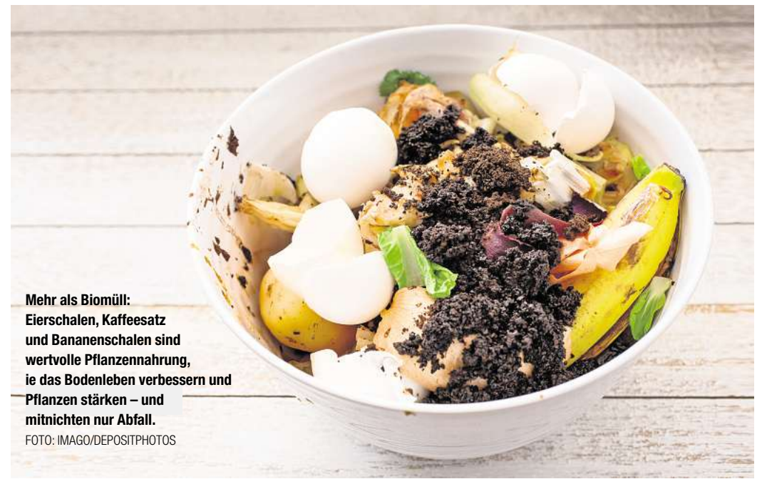
Mehr als Biomüll: Eierschalen, Kaffeesatz und Bananenschalen sind wertvolle Pflanzennahrung, sie das Bodenleben verbessern und Pflanzen stärken – und mitnichten nur Abfall.

„Für die Verwendung von Küchenabfällen im Garten gilt grundsätzlich: Qualität vor Quantität.“