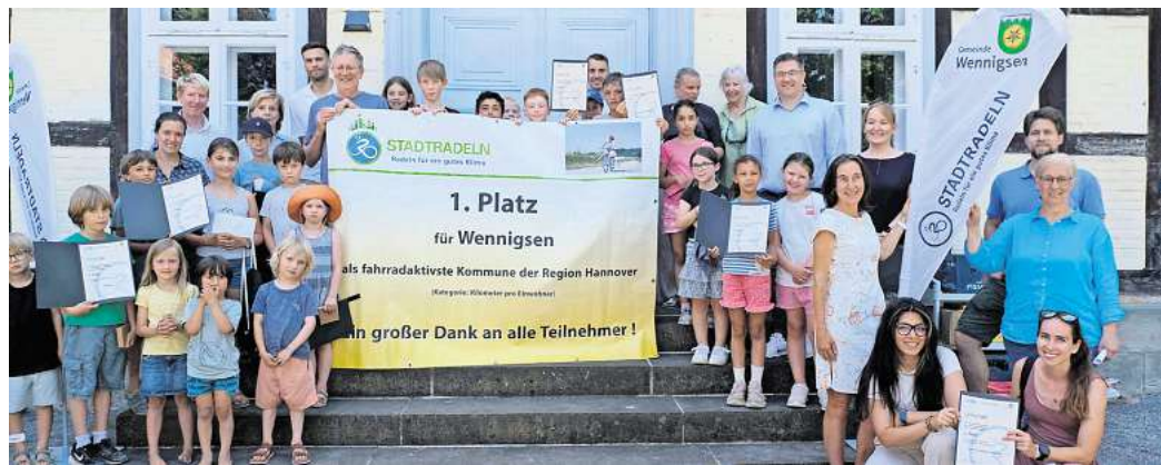
Erfolgreich: Die Gemeinde Wennigsen ehrt die erfolgreichsten Fahrradfahrer.

In der Kategorie „Kilometer pro Einwohner“ belegt Wennig-