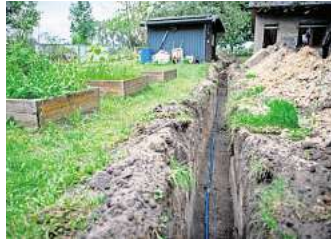
Bei Tiefbauarbeiten kann schnell etwas schief gehen.

G artenteich anlegen oder neue Wege: Wer größere Gartenarbeiten plant, sollte sich vorher über den Verlauf von unterirdischen Leitungen wie Strom-, Gas- und Wasserleitungen informieren. Sonst kann es teuer und gefährlich werden.