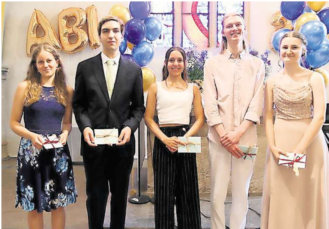
Diese fünf Schülerinnen und Schüler haben ihr Abitur am Matthias-Claudius-Gymnasium mit der Traumnote 1,0 abgeschlossen.

23 Schülerinnen und Schüler haben eine Eins vor dem Komma, einer sticht besonders heraus. Doch es geht auch um die „Menschen, die hinter den Noten stehen“