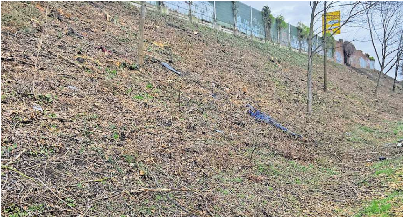
Kahlschlag: Entlang der B65 in Empelde und Hannover sind nur einzelne Bäume übrig geblieben.

Wallanlagen, ähnlich derer an der B65, sind in Ronnenberg eher selten zu finden, berichtet Borchers. Lediglich an der Nenndorfer Straße in Empelde und der Straße Haarbeeke in Ronnenberg muss der Bauhof solche Flächen pflegen. Etwa alle zwei Jahre sei dort ein stärkerer Rückschnitt erforderlich. Dabei sieht sich der Bauhof Kritik aus zwei Richtungen