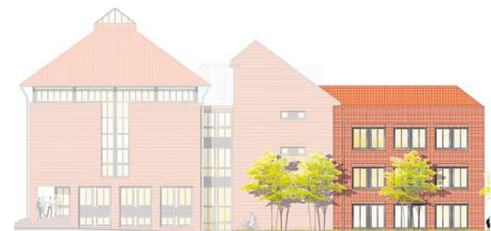
Blick auf die künftige Ostseite des Rathauses: An der Hüttenstraße soll sich ein dreigeschossiger Erweiterungstrakt (rechts im Bild) in einheitlicher Optik an das bestehende Rathausgebäude anschließen.

Zu den Umbauplänen zählt auch eine Frischeküche für den Eingangsbereich mit Empfang, Bürgerservice und Wartebereich. Abgeschlossen wird das Modernisierungsprojekt mit der Bibliothek. Nach bisherigen Schätzungen ist – inklusive Anbau – mit Bruttogesamtkosten in Höhe von rund 7,3 Millionen Euro und einer Bauzeit von drei bis vier Jahren zu rechnen.