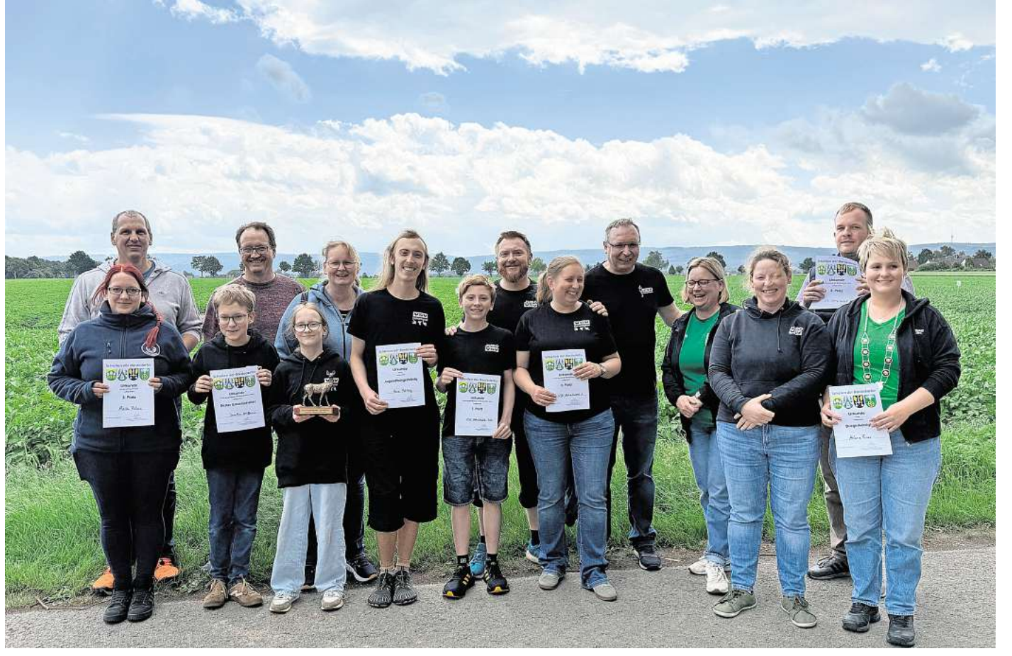
Erfolgreich: Die besten Schützen bei den Wettbewerben der Bördedörfer.