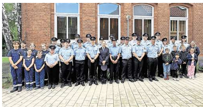
Fit für die Zukunft: Die Mitglieder der Feuerwehr Wichtringhausen feiern Geburtstag und eine Neugründung.