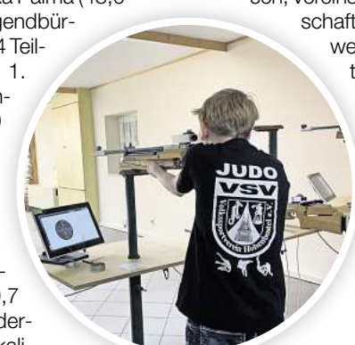
Konzentriert: 37 Schützen sind bei den Wettbewerben in Nordgoltern am Start.