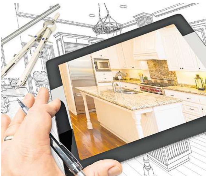
Von der Idee zum Traumhaus: Wer bauen will, sollte die Möglichkeiten und die damit verbundenen Vor- und Nachteile gut abwägen.

„Die Übertragung des Eigentums erfolgt mit der Zahlung der letzten Rate“, erklärt Balke. Er rät beim Vertragsabschluss zur Vorsicht: „Die Verträge enthalten oft unwirksame Klauseln, und die Ratenvereinbarungen sind häufig