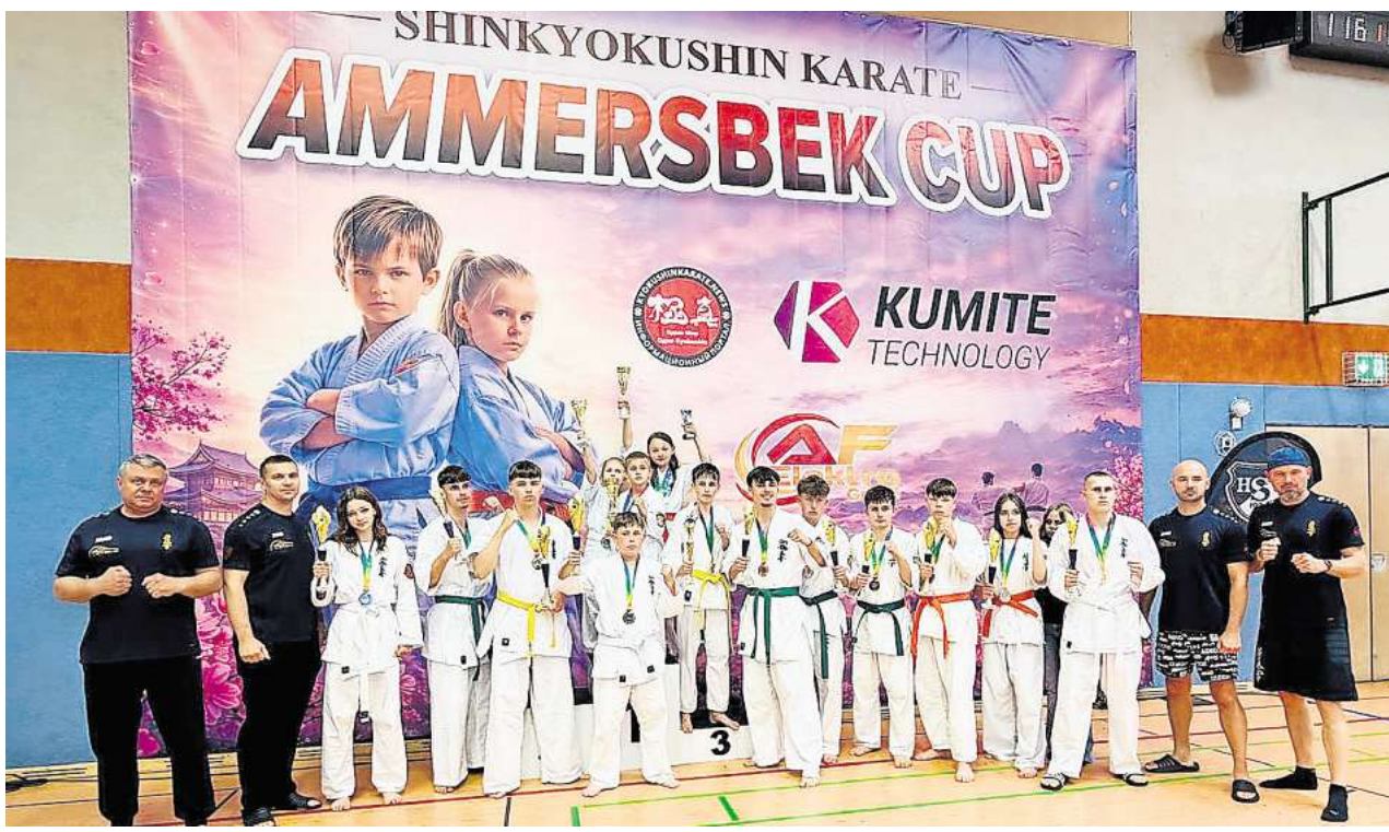
Starke Karate-Leistungen: 15-fach holen die Nachwuchssportler vom TSV Kirchdorf Medaillen.