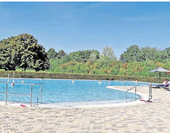
Geöffnet: Der Freibadbereich im Deisterbad steht Menschen, die eine Erfrischung suchen, wieder zur Verfügung.