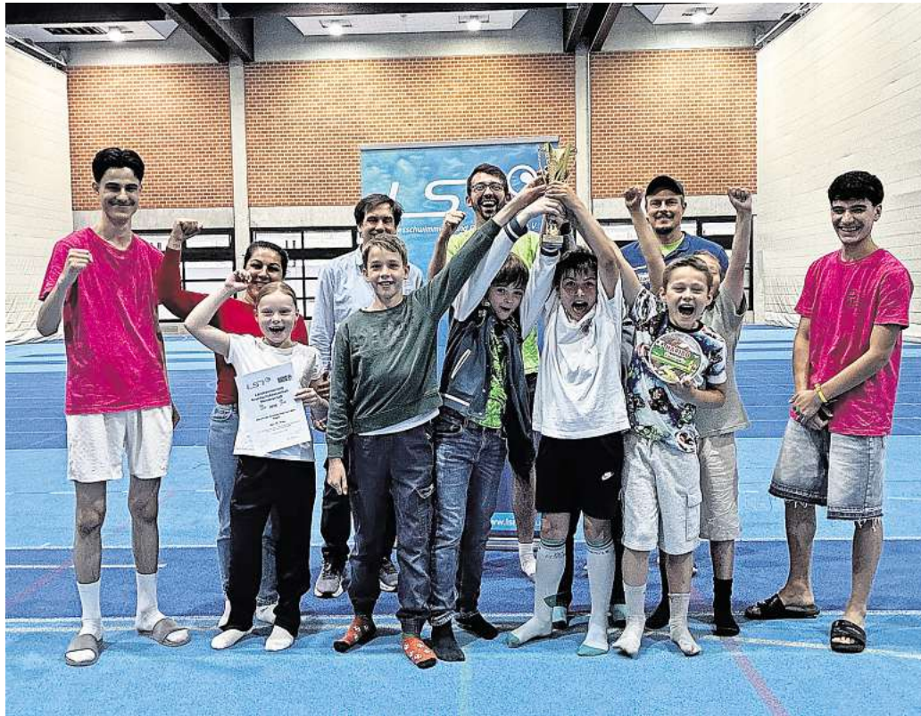
Große Freude: Das Wasserballteam der Grundschule Auf dem Hagen gewinnt den Pokal.

Die Grundlage des Empelder Pokalsieges bildet ein Angebot des frisch gebackenen Deutschen Wasserballmeisters Waspo 98 Hannover, das die Kinder in der Grundschule im Rahmen des Ganztagsunterrichtes seit zwei Jahren nutzen können. In der AG, die regelmäßig im Lehr-