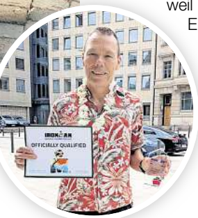
Das passende Outfit für die Reise nach Hawaii hat der 64-jährige Barsinghäuser bereits gefunden.

wieder dieser eine Satz fallen, der die Reise zum Erfolgserlebnis macht: „You are an Ironman!“