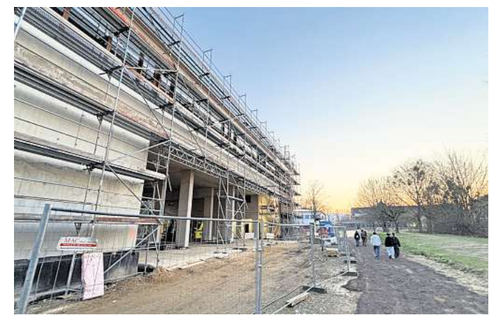
Nur eines von vielen Projekten: Die Gemeinde Wennigsen lässt derzeit eine neue Mensa für die KGS errichten. ASTRID KÖHLER