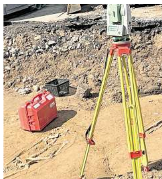
Skelette, Gehrdens Hangstraße

Nach Angaben der Stadt Gehrdens gelten die Straßen in dem Bereich als marode und müssen grundlegend saniert werden. Die Straßen rund um das Matthias-Claudius-Gymnasium sind teilweise rund 50 Jahre alt. Nach Angaben der Stadt haben unter anderem die Umbauarbeiten am Gymnasium die Fahrbahnen zusätzlich belastet. Gleichzeitig müssen die ebenfalls rund 50 Jahre alten Kanäle erneuert werden. In der Vergangenheit war es bereits zu Kanaleinbrüchen und Absackungen gekommen.