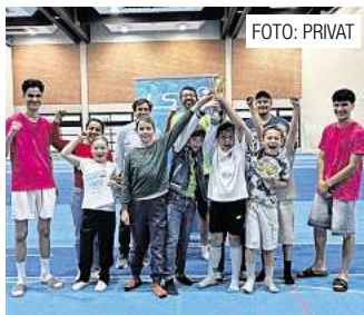
Große Freude beim Wasserballteam in Empelder Grundschule. Seite 6