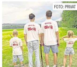
In Wennigsen läuft das Freischießen; auch mit Enkeln des Königs. Seite 7