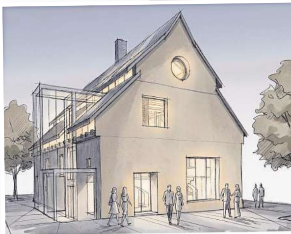
Neuer Eingang: Das Stadtmuseum soll künftig vom Süden aus betreten werden.

Unternehmen und Bürgern. Der Vorstand kann sich zudem vorstellen, dass Handwerksfirmen sich mit Azubi-Projekten beteiligen. Beispielsweise könnten die Auszubildenden eines Elektrobetriebs beim Innenausbau die Installationsarbeiten übernehmen, ohne Rechnung.