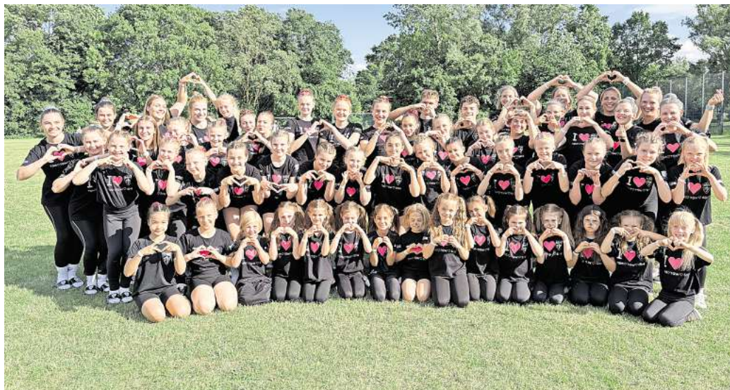
Starke Teams: Die Mannschaften des TSV Kirchdorf haben bei der Landesmeisterschaft mit ihren Leistungen überzeugt.

Vize-Landesmeister wurde die TGW-Erwachsenenmannschaft. Bereits zum Auftakt setzte das Team mit ihrer neuen Turn-