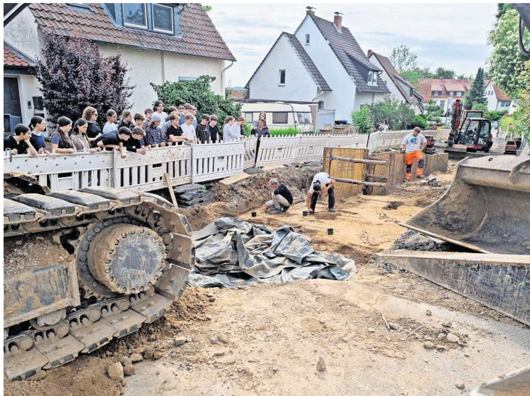
Spannendes Szenario: An der Fundstelle auf der Hangstraße in Gehrdens verfolgten zahlreiche Zuschauer die Arbeiten der Archäologen.

Langfristig soll das bisherige Mischwassersystem durch ein Trennsystem ersetzt werden, bei dem Regen- und Schmutzwasser getrennt abgeführt werden. Das gilt als umweltfreundlicher und entlastet die Kläranlagen.