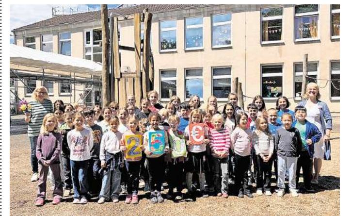
250 Euro für die gute Sache: Der Stedler Chor spendet für das Projekt „Philipp & Philippa“.

REWE Markt Reihenkamp 12 30890 Barsinghausen Öffnungszeiten: Montags bis sonnabends von 7 bis 22 Uhr