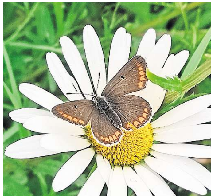
Wertvolles Projekt: In Barsinghausen trägt ein Blühstreifen mit Margeriten zur Artenvielfalt bei.

Die derzeit blühenden Margeriten sind dabei nur ein Teil der Entwicklung. Zahlreiche weitere