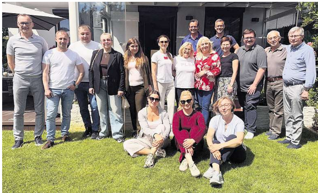
Austausch: In Brzeg Dolny treffen Vertreter der polnischen Partnerstadt, aus dem ukrainischen Ort Kovel sowie aus Barsinghausen aufeinander.

Gruppe aus Barsinghausen besucht Partnerstadt in Polen