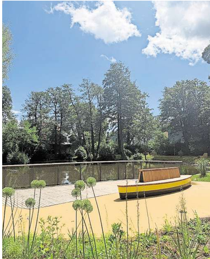
Fertig: Der neue Ziegenteich-Park lädt Menschen zum Spazieren und Verweilen ein.

Darüber hinaus hat die Umgestaltung die Anlage deutlich geöffnet. Neue Sichtachsen sor-