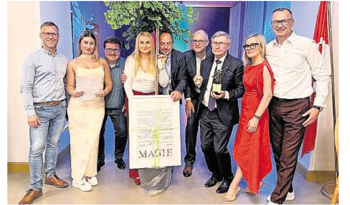
Austausch: In Brzeg Dolny treffen Vertreter der polnischen Partnerstadt, aus dem ukrainischen Ort Kovel sowie aus Barsinghausen aufeinander.

„Gerade in herausfordernden Zeiten zeigt sich, wie wertvoll persönliche Begegnungen zwischen den Menschen Europas sind“, betonte Engelmann. „Städtepartnerschaften sind kein symbolisches Projekt – sie sind gelebte europäische Realität.“ Auch die ukrainischen Vertreter aus Kovel hoben die Bedeutung der Zusammenarbeit hervor: „Für uns ist diese Partnerschaft ein Zeichen der Hoffnung und Stabilität. Sie zeigt, dass Europa im Alltag der Städte konkret erlebbar ist.“ (RED)