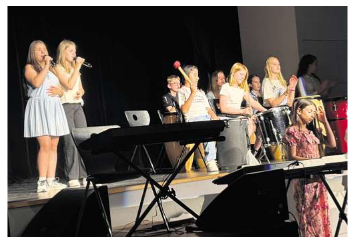
Abwechslungsreich: Bei „Kultur im Sommer“ bieten KGS-Schüler ein vielfältiges Programm.