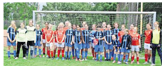
Fair Play über Ländergrenzen hinweg: Nach dem Spiel um Platz neun posieren die D-Juniorinnen der SG Everloh-Ditterke gemeinsam mit dem dänischen Team Eyb IF 1968.

Die Skelette werden derzeit von Archäologen untersucht. Nach bisherigen Erkenntnissen könnten sie vor rund 1000 Jahren bestattet worden sein. Wie alt die Skelette tatsächlich sind, welche historische Bedeutung sie haben und ob sie mit weiteren bekannten Fundstellen in Gehrdens zusammenhängen, ist derzeit noch unklar.