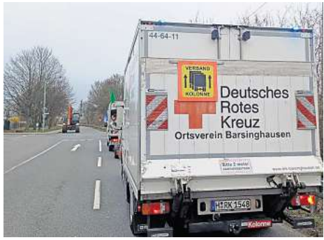
Übung: Das DRK Barsinghausen testet unter anderem die Kolonnenfahrt, um im Fall einer Katastrophe bestmöglich handlungsfähig zu sein.