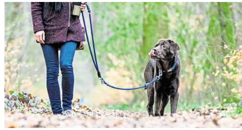
Während der Brut- und Setzzeit dürfen Vierbeiner im Wald und auf Feldwegen nicht frei herumlaufen.

Der Hegering appelliert darüber hinaus an alle Erholungssuchenden, in Feld und Flur konsequent auf den ausgewiesenen Wegen zu bleiben. Besonders während der Brut- und Setzzeit reagieren Wildtiere äußerst sensibel auf Störungen. Wiesen sind nicht nur Rückzugsräume für Jungtiere, sondern zugleich wertvolle Nahrungsquellen. Sie dienen als Futtergrundlage für Nutztiere und sichern die landwirtschaftliche Versorgung. Wenn Flächen betreten oder mit Hunden durchquert werden, kann dies Verunreinigungen verursachen und wirtschaftliche Schäden nach sich ziehen. Gerade hier sollte besondere Rücksicht selbstverständlich sein.