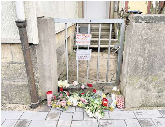
Der Tatort an der Rehrbrinkstraße: Menschen haben vor dem Tor Blumen und Kerzen abgelegt.