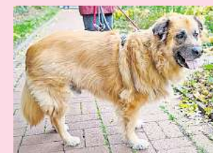
Das ist Odin.

Interessierte haben die Gelegenheit, Odin persönlich kennenzulernen – jeweils mittwochs zwischen 17 und 18 Uhr im Tierheim oder nach individueller Terminvereinbarung unter der Telefonnummer (05105) 7736777.