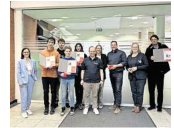
Erfolgreich: Schülerinnen und Schüler aus Barsinghausen beteiligen sich am Planspiel Börse.

Beim Planspiel Börse handelt es sich um ein onlinebasiertes