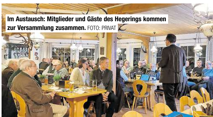
Im Austausch: Mitglieder und Gäste des Hegerings kommen zur Versammlung zusammen.

Neben den ehrenamtlich Engagierten wurden auch Unternehmen ausgezeichnet, die seit Generationen in Barsinghausen verwurzelt sind und die Stadt wirtschaftlich wie gesellschaftlich mitprägen. So wurde die Druckerei Weinaug für ihr 140-jähriges Bestehen gewürdigt, sowie der Betrieb Heinrich Stange, der seit 127 Jahren im Bereich Haustechnik tätig ist. Auch Dannenberg Bikes wurde für über ein Jahrhundert Unternehmensgeschichte ausgezeichnet.