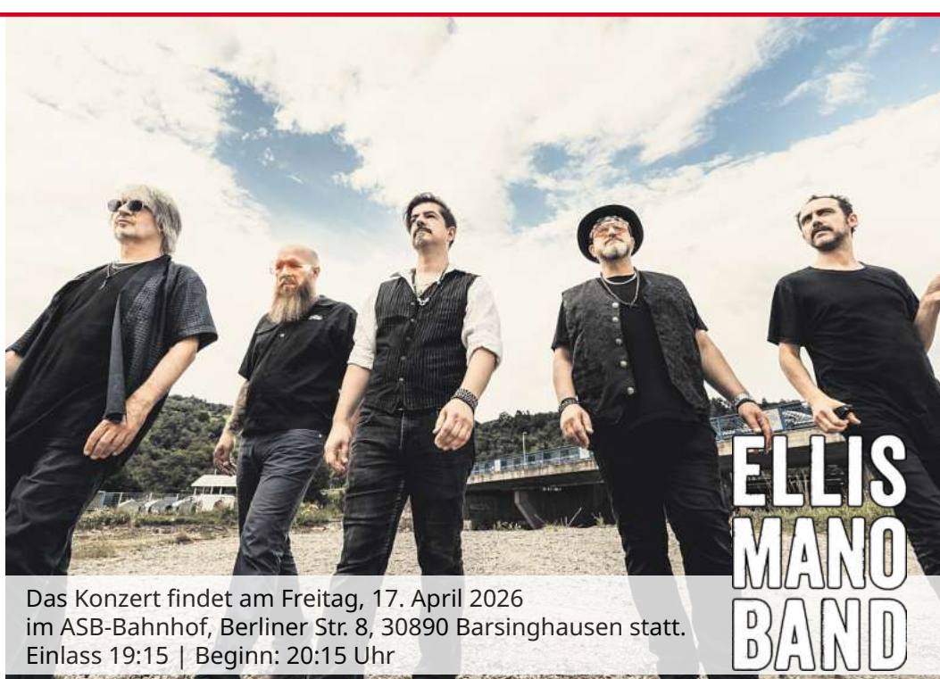
Das Konzert findet am Freitag, 17. April 2026 im ASB-Bahnhof, Berliner Str. 8, 30890 Barsinghausen statt. Einlass 19:15 | Beginn: 20:15 Uhr

Ellis Mano Band, 'Special Guest' der Deep-Purple-Sommertour'24, präsentieren neues Album MORPH live. Im Programm hat die ELLIS MANO BAND neben Kostproben vom aktuellen Tonträger zudem Lieder ihrer vorangegangenen Werke. Dazu gehört der Publikumsfavorit „A Lifetime“. Er ist bekannt aus ihrem vom „Rockpalast“ mitgeschnittenen und auf 3sat ausgestrahlten sowie bei YouTube verfügbaren Konzert. Dieses wurde kurz nach der Veröffentlichung des hochgelobten Albums „Live: Access All Areas“ aufgezeichnet. Bezeichnend, was dazu im britischen Online-Portal Great Music Stories steht: „...in dieser Welt brauchen wir tatsächlich Bands, die uns daran erinnern, warum es bei dem Kunststück namens ‚gute Musik‘ geht. Wir brauchen keine Rockgötter mehr, sondern großartige Musiker – Menschen, deren Berufung die Kunst der qualitativen Musik ist, die gut gespielt wird. Willkommen in der Welt der Musik der Ellis Mano Band – und ihrem fesselnden Klanguniversum!“