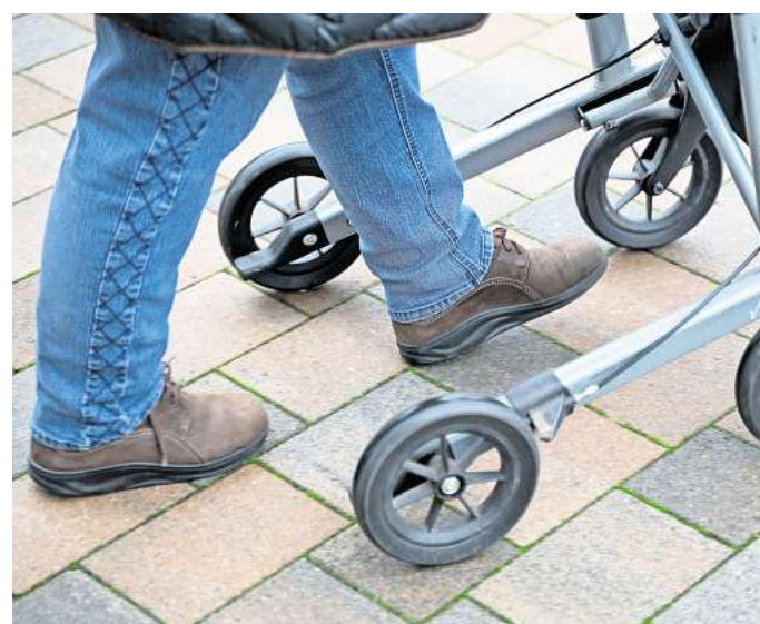
So geht's richtig: Die Füße befinden sich zwischen den Hinterrädern. Heißt: man geht nicht hinter, sondern im Rollator.

Für die größtmögliche Stabilität ist wichtig, dass sich die Füße