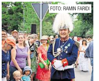
Die Vorbereitungen für das nächste Freischießen laufen. Seite 12