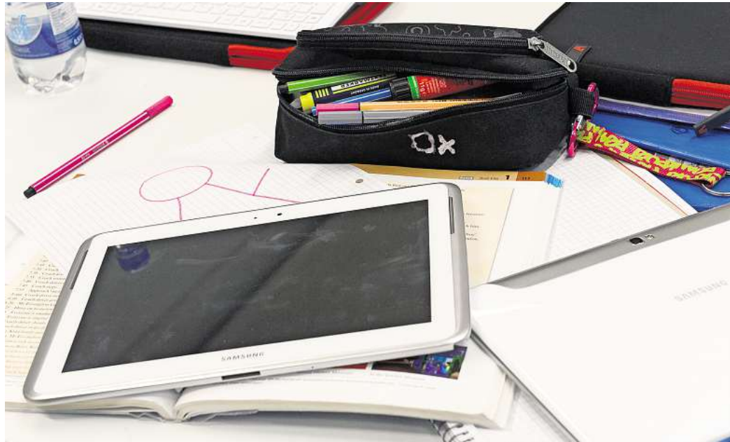
Im Unterricht heimlich ChatGPT gefragt: Das Matthias-Claudius-Gymnasium in Gehrden will die Nutzung privater Tablets im Unterricht stärker kontrollieren – mit einer umstrittenen Software.

Die MDM-Software, um die es geht, heißt „Relution“. Sie dient dazu, alle Tablets zentral, sicher und einheitlich zu verwalten. Die Software ermöglicht Lehrkräften in Echtzeit die Einsicht in das App-Inventar der Schülerinnen und Schüler und umfasst die Beschränkung von Systemfunktionen (Kamera, iCloud-Sicherung) sowie die Möglichkeit der Fernlöschung. Zudem können über die