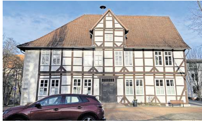
Barsinghausens Baudezernent Tobias Fischer verlässt das Rathaus: Die Stelle soll „so bald wie möglich“ ausgeschrieben werden.

wichtigsten Ämtern in einem Rathaus. Es verantwortet die gesamte städtische Entwicklung, von der Bebauungsplanung bis