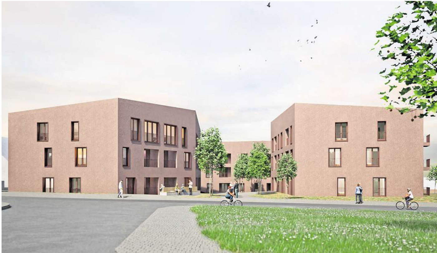
So soll's werden: Der geplante Neubau-Komplex in Egestorf hat einerseits Räumlichkeiten für eine moderne Hausarztpraxis und andererseits barrierefreie geförderte Wohnungen.

An der Stoppstraße entsteht ein moderner Komplex mit Räumen für das Medizinische Versorgungszentrum Wittum & Eriksen sowie für 52 sozial geförderte Wohnungen