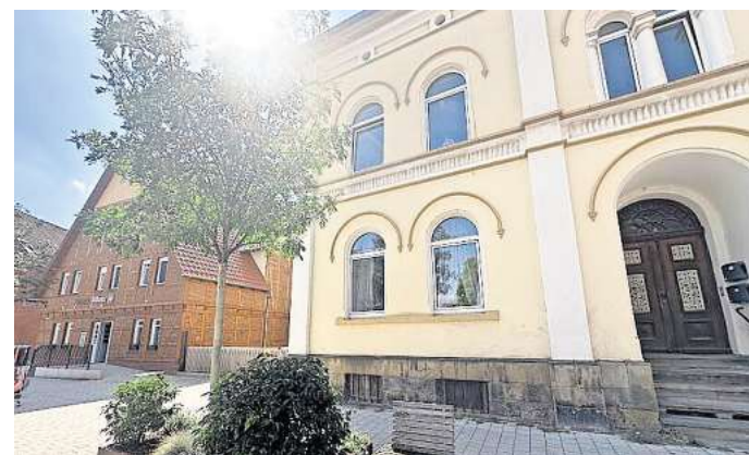
Nur wenig Grün: In Gehrden Innenstadt gibt es kaum schattige Plätze.

„Wir haben uns das Ziel einer klimaneutralen Region Hannover bis zum Jahr 2035 gesetzt – der fortschreitende Prozess der globalen Erwärmung wird aber nicht abrupt zu stoppen sein“, sagt Regionspräsident Steffen Krach. „Wir müssen daher mit den Maßnahmen zur Klimaanpassung zu-