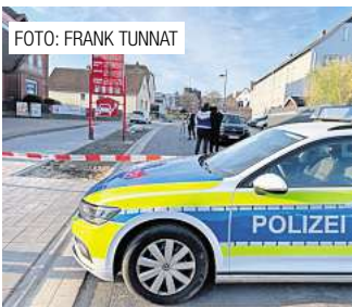
Barsinghausen: Familienvater nach Tötungsdelikt in U-Haft. Seite 5