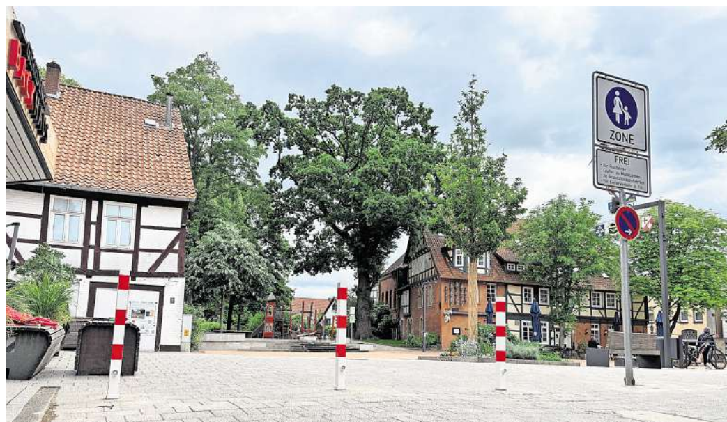
Zu wenig Sitzmöglichkeiten: Auf dem zentralen Marktplatz in Gehrden gebe es derzeit nicht genügend Bänke, sagt Irmgard Nasemann.

Außerdem wünsche sie sich einen Zebrastreifen vor der Volksbank. Der Grund wird schnell klar: Obwohl an dieser Stelle Tempo 30 gilt, halten sich viele Autofahrer nicht daran. Al-