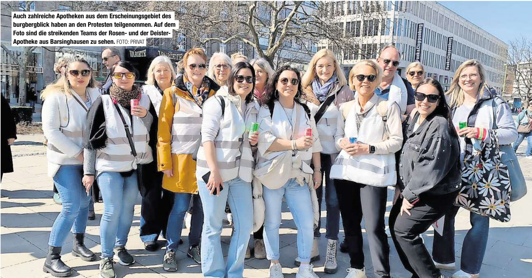
Auch zahlreiche Apotheken aus dem Erscheinungsgebiet des burgbergblick haben an den Protesten teilgenommen. Auf dem Foto sind die streikenden Teams der Rosen- und der Deister-Apotheke aus Barsinghausen zu sehen.