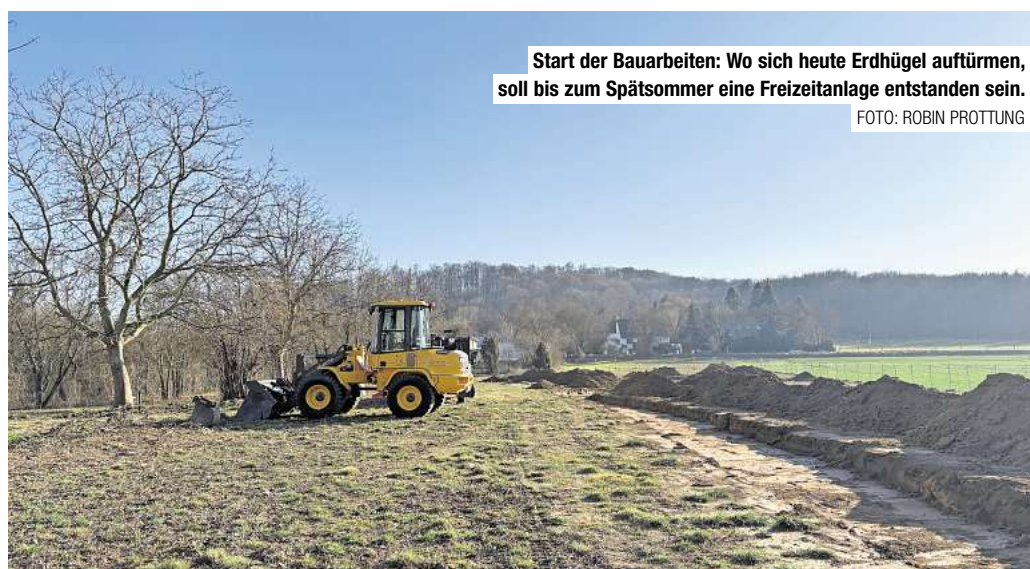
Start der Bauarbeiten: Wo sich heute Erdhügel auftürmen, soll bis zum Spätsommer eine Freizeitanlage entstanden sein.

Laut Bürgerstiftung soll in Kürze ein Orgelbeauftragter der Kirche die Lage vor Ort noch einmal genau überprüfen. Im Fall einer Zustimmung soll die bewährte Firma aus Hamburg den Umzug des Glockenspiels abwickeln. Im nächsten Sommer könnten dann wieder mehr als zwei Melodien pro Tag erklingen.