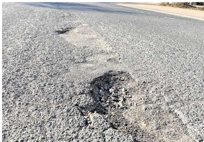
Das Ergebnis von Frost und Regen: In der Robert-Koch-Straße in Gehrdens sind große Schlaglöcher entstanden.

Die Reparaturen der Winterfolgen dauern an: Die Stadt bittet um Geduld – und um Unterstützung