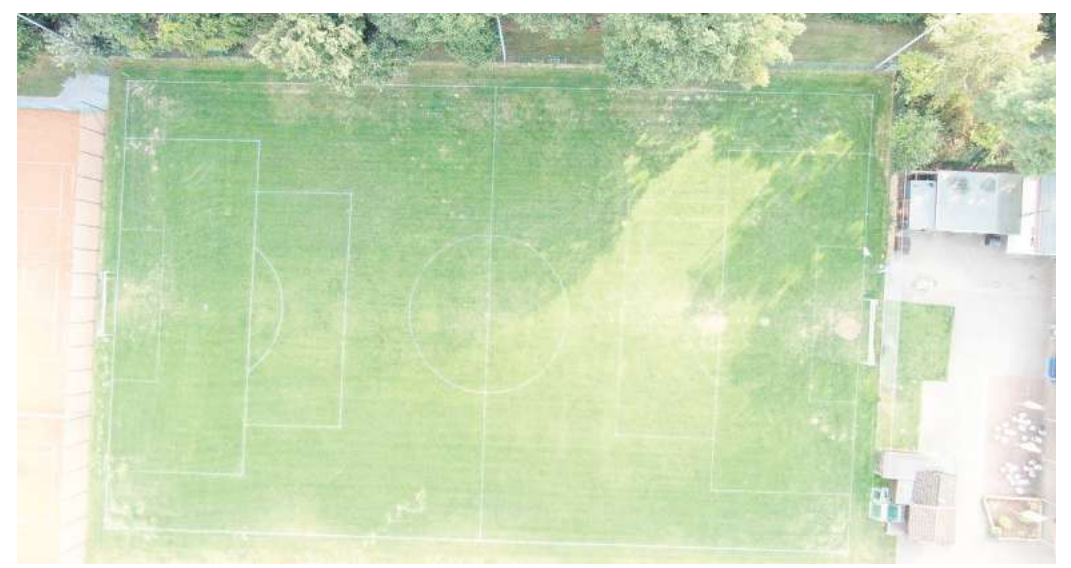
Soll bald ganzjährig bespielbar sein: Der B-Platz der Sportanlage an der Ihmer Landstraße.

Die geschätzte Nutzungsdauer betrage 15 bis 20 Jahre. In dieser Zeit sei der Wasserverbrauch deutlich geringer und es fielen kaum Pflegearbeiten an. Lediglich einmal im Monat müsse der Platz abgeburstet werden, um Moosbefall zu verhindern, erläutert der Bauhofleiter. Dünger wird nicht mehr benötigt und auch ein weiteres großes Problem der Ronneberger Anlage würde sich erledigen: „Den Maul-