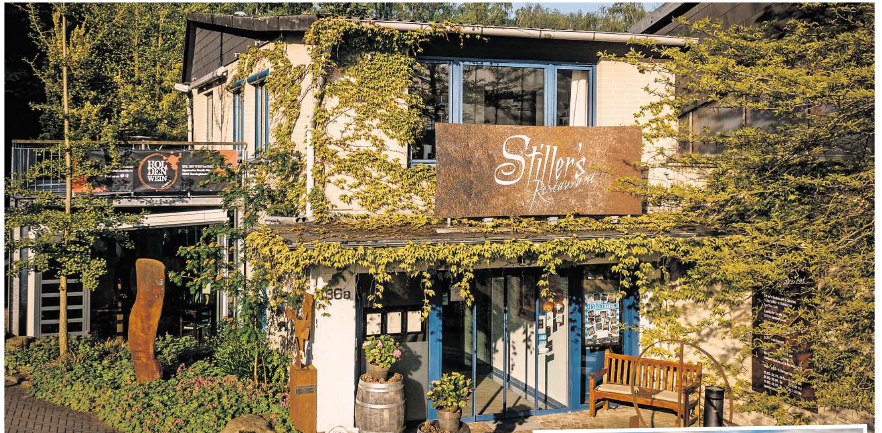
Stiller's Restaurant befindet sich an der Egestorfer Straße 36a in Barsinghausen. Die Speisekarte finden Sie unter www.stiller-genießen.de .

Osterfeuer im Biergarten, Osterbuffet im Festsaal und „Tanz in den Mai“-Party in der Festhalle