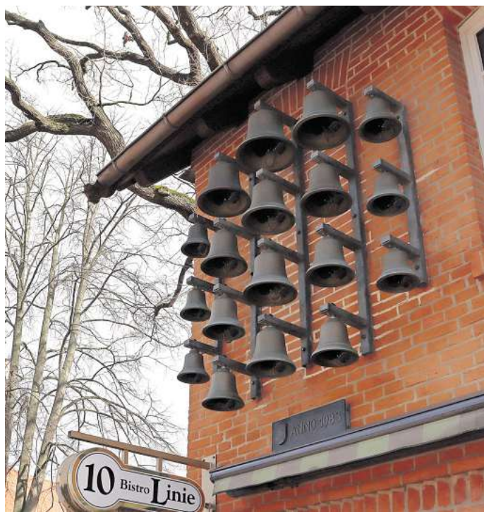
Fast 43 Jahre nach der Inbetriebnahme: Das Gehrdeners Glockenspiel soll vom Ratskeller an eine Wand der Margarethenkirche verlegt werden.

„Das Glockenspiel erklingt zurzeit nur zweimal täglich – einmal morgens und einmal nachmittags“, berichtet Middelberg. Die Einschränkung sei nötig, um Rücksicht auf die Außengastronomie des Ratskeller-Pächters zu nehmen. „Es ist für Gäste einfach zu laut“, sagt Middelberg. Als das Glockenspiel im Jahr 1983 angebracht worden sei, habe es dort noch keine Außengastronomie gegeben.