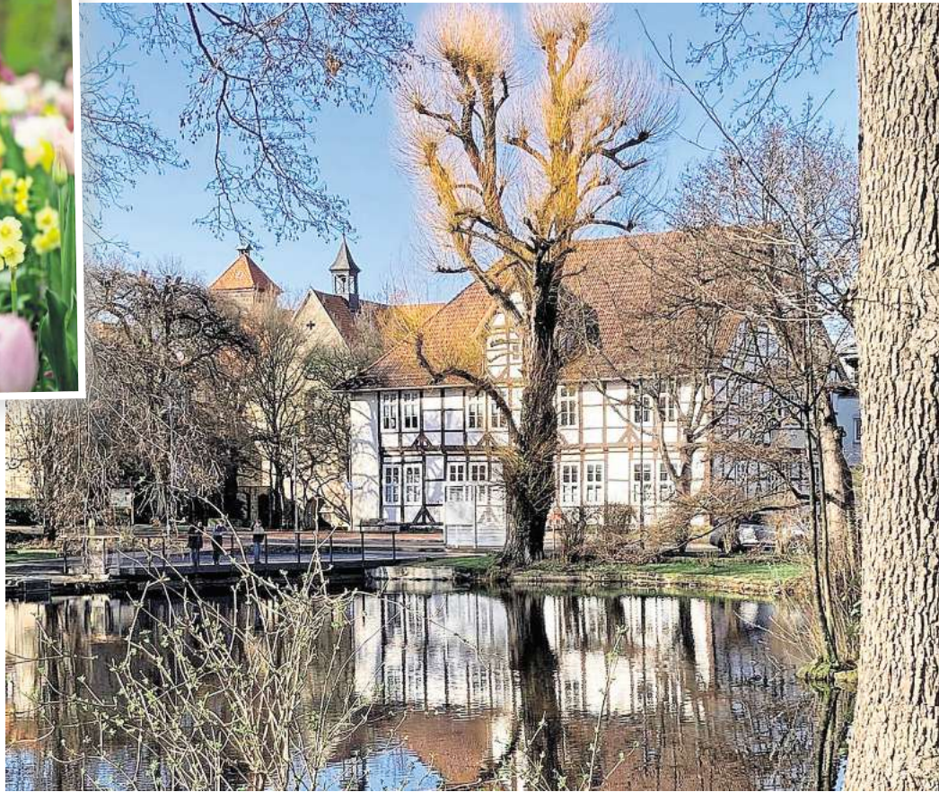
Der Frühling beginnt – auch am Ziegenteich in Barsinghausen – oft unscheinbar. Ein paar milde Tage, ein heller Abend, ein Spaziergang ohne dicke Jacke.