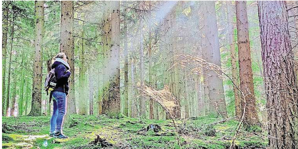
Wandern im Deister: Spaziergänger berichten, dass Begegnungen mit Rehen seltener geworden sind – stattdessen sehen sie immer mehr Mountainbiker.

Unangenehme Situationen mit Mountainbikern haben sie in den vergangenen Jahren zwar erlebt, aber nicht gehäuft. Was ihnen jedoch deutlich auffällt: Abseits der offiziellen Trails wird immer häufiger gefahren. „Das erkennt man ja an den abgefahrenen Wegen im Wald“, meint