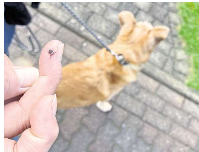
Gefunden: Wer eine Zecke an sich oder einem Haustier findet, sollte diese zunächst entfernen und anschließend für Forschungszwecke fotografieren.

„Wir möchten untersuchen, wie sich im Zuge des Klimawandels die geografische Verbreitung von Buntzecken und anderen Zeckenarten in Deutschland weiterentwickelt“, so Theresa Seidel, NABU-Expertin für Citizen Science. „Anders als früher sind Zecken heute aufgrund der höheren Temperaturen nicht saisonal, sondern ganzjährig unterwegs. Darum können Zeckenfunde auch jederzeit gemeldet werden.“ Aktuell sind rund 20 Zeckenarten in Deutschland bekannt.