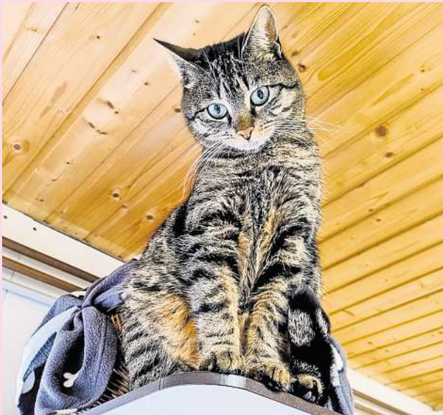
Merry lässt sich gerne streicheln.

Interessierte haben die Gelegenheit, Merry persönlich kennenzulernen – jeweils mittwochs zwischen 17 und 18 Uhr im Tierheim oder nach individueller Terminvereinbarung unter der Telefonnummer (05105) 7736777.