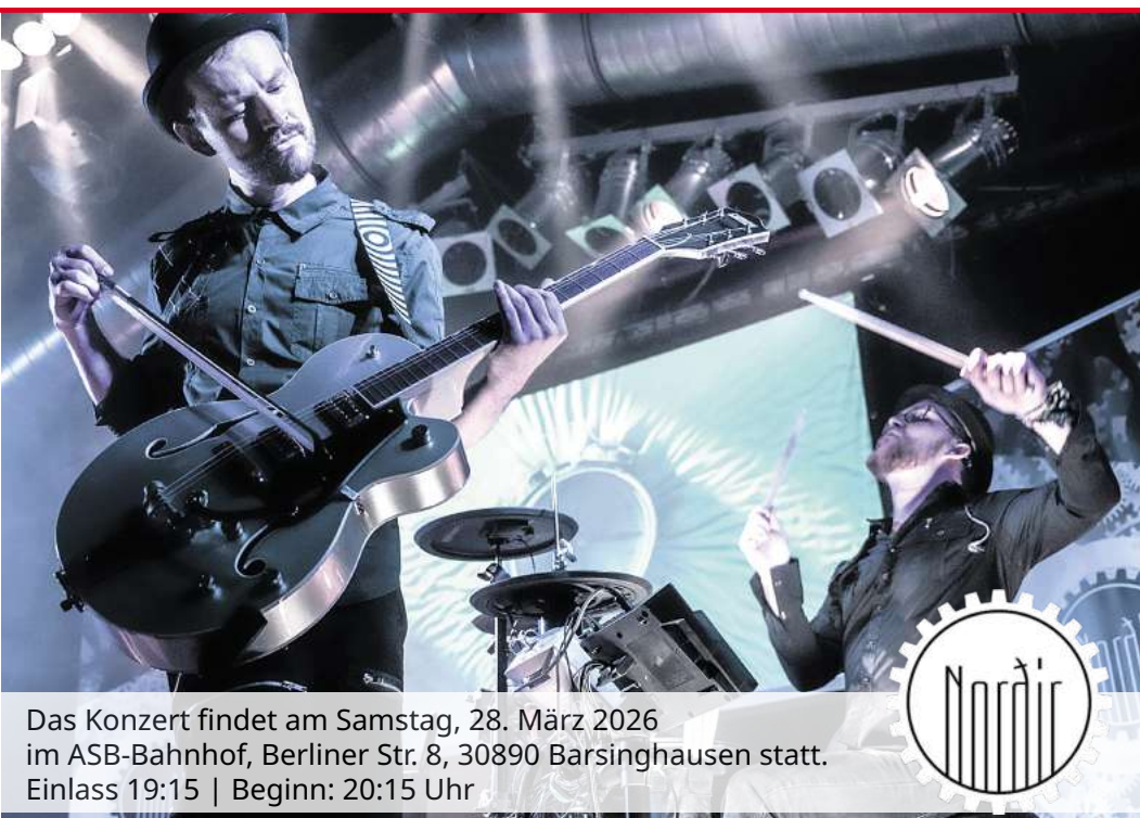
Das Konzert findet am Samstag, 28. März 2026 im ASB-Bahnhof, Berliner Str. 8, 30890 Barsinghausen statt. Einlass 19:15 | Beginn: 20:15 Uhr

Im Zentrum steht dabei nicht nur die Musik, sondern ein Gesamterlebnis: Angeführt von Marlene, einer charismatischen KI-Assistentin, navigieren NORDIR durch Schlüsselmomente der Weltgeschichte – von eindringlichen Rückblicken in die Vergangenheit bis hin zu visionären Ausblicken in die Zukunft am Rande eines schwarzen Lochs. Das Resultat ist eine audiovisuelle Zeitreise, die gleichermaßen zum Tanzen einlädt, berührt und überrascht – oft mit einem unerwarteten Augenzwinkern.