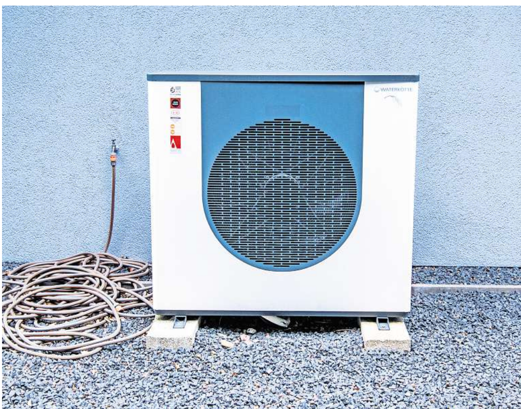
Moderne Wärmepumpen sind leiser als früher: Mit unter 50 Dezibel arbeiten sie so leise wie ein Geschirrspüler.