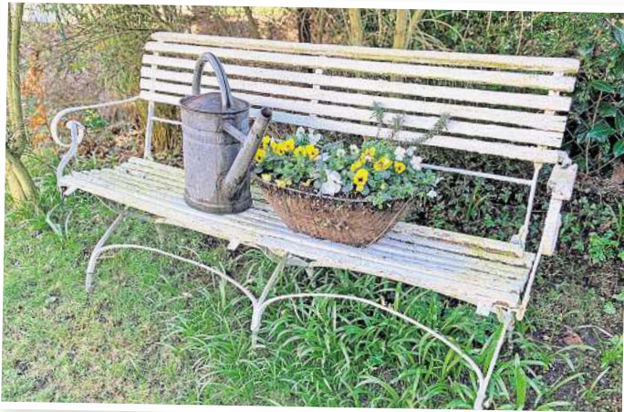
Die Natur zeigt, wie schnell sich alles wandeln kann.

Mit dem Wechsel der Jahreszeit verändert sich auch die Stimmung vieler Menschen. Die längeren Tage bringen neue Energie. Pläne werden geschmie-