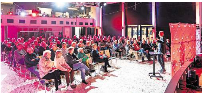
Großes Interesse: 130 Personen sind bei der Diskussionsveranstaltung mit SPD-Fraktionschef Matthias Miersch in der Marie-Curie-Schule dabei.

Zudem wurde über Themen wie Bildung, Heizungsgesetz, E-Mobilität und Ladeinfrastruktur, bezahlbares Wohnen sowie Maßnahmen zur Beschleunigung des Wohnungsbaus intensiv debattiert. Auch Schülerinnen und Schüler der Marie-Curie-Schule sowie junge Menschen aus der Region brachten ihre Perspektiven aktiv ein. Ihre Wortbeiträge zeigten laut Miersch deutlich, dass junge Menschen sich nicht nur für ihre eigenen Interessen, sondern für den gesellschaftlichen Zusammenhalt stark machen.