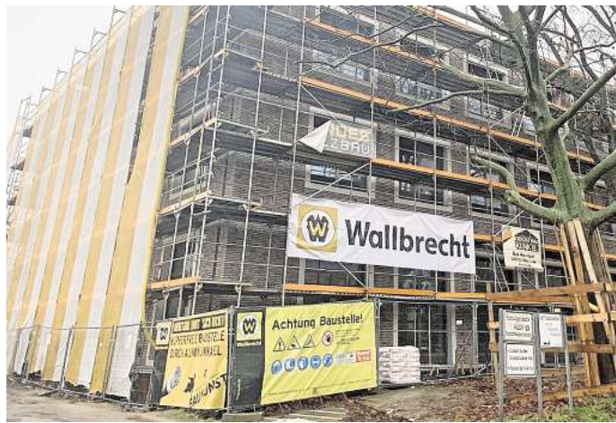
Gebäudehülle nahezu fertig: Der zweite große Baukran am Neubau der Wilhelm-Stedler-Schule ist mittlerweile abgebaut.

Für die Schule ist der Umzug in den Herbstferien ein Dämpfer. „Es ist ein Unterschied, ob wir sechs oder nur zwei Wochen Zeit haben“, sagt Schulleiterin Kath-