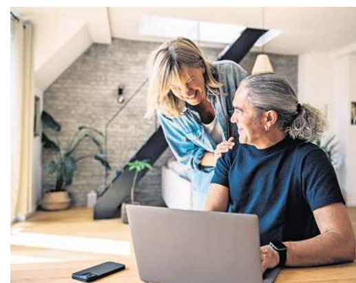
Haben gut lachen: Wessen Immobilie im Laufe der Zeit stark im Wert gestiegen ist, der kann bei der Anschlussfinanzierung von günstigeren Konditionen profitieren.

* Das vollwertige Verkehrswertgutachten: Dieses Gutachten werde meist von öffentlich