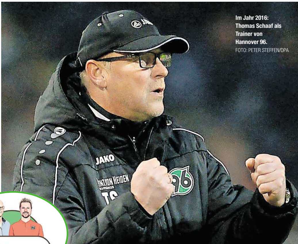
Im Jahr 2016: Thomas Schaaf als Trainer von Hannover 96.

Auch in Hannover ist Schaaf kein Unbekannter. Nach dem Ende seiner ersten Bremer Amtszeit 2013 folgten Stationen bei Eintracht Frankfurt und in Hannover 96 übernahm er 2016 zur Rückrunde in höchster Abstiegsnot – Tabellenplatz 17, der Klassenerhalt