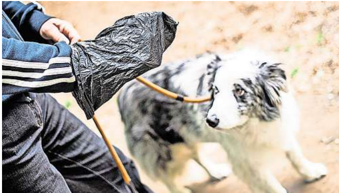
Klare Regeln: Der TSV Wennigsen hat ein Teilnahmeformular erarbeitet, mit dem sich die Teilnehmer unter anderem verpflichten, Hundekot aufzusammeln und zu entsorgen.