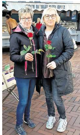
Dankeschön: Frauen bekommen am Sonnabend auf dem Barsinghäuser Wochenmarkt eine Blume geschenkt.