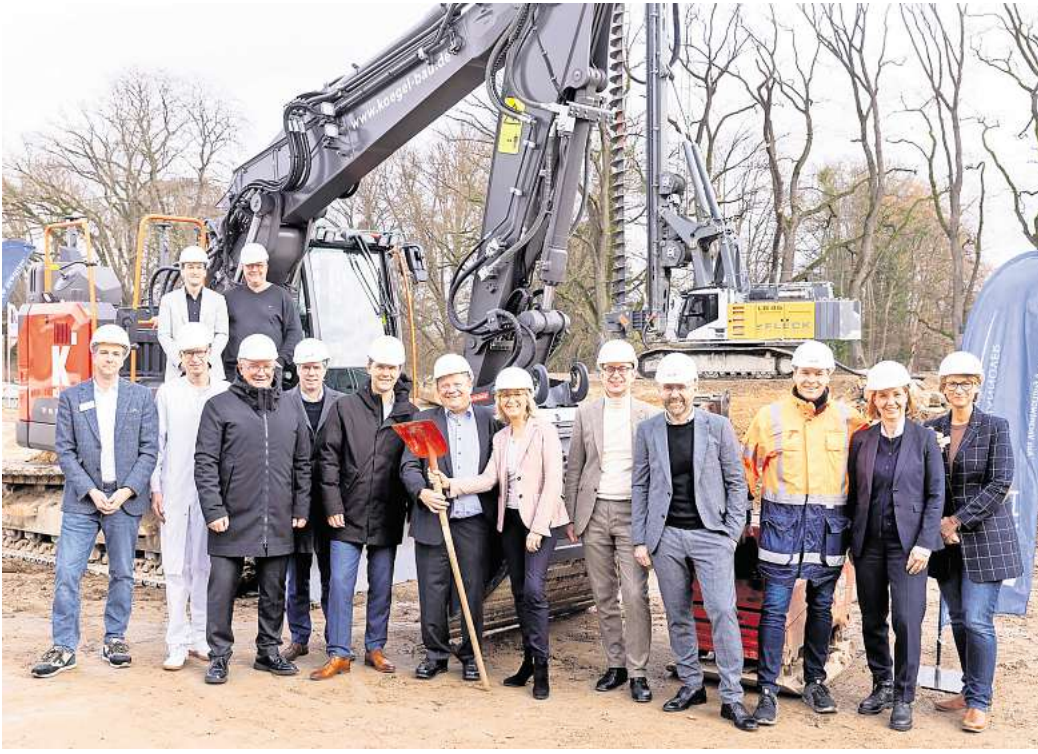
Spatenstich: Alle Anwesenden freuen sich über den „Meilenstein“ für den Neubau des KRH Klinikums Robert Koch in Gehrden.