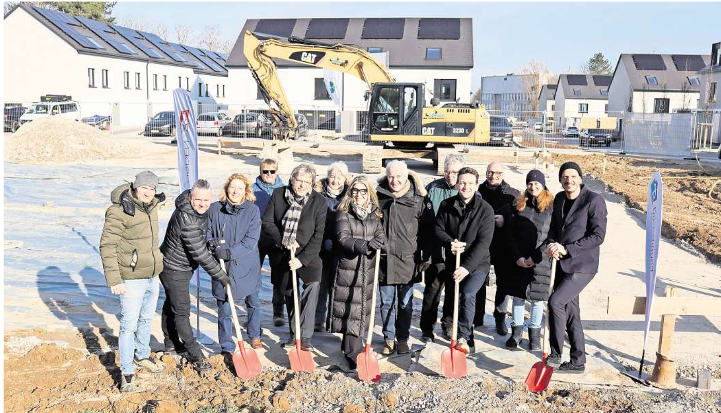
Erster Spatenstich für die neue Kita: Im Neubaugebiet Vorwerk gibt Gehrdens Bürgermeister Malte Losert (Vierter von rechts) den symbolischen Startschuss für die Bauarbeiten - gemeinsam mit Vertreterinnen und Vertretern der Kooperationspartner sowie Mitgliedern der Stadtverwaltung und des Rates der Stadt Gehrden.

Neubaugebiet Vorwerk: In nur knapp einem Jahr sollen fast 100 zusätzliche Betreuungsplätze in Gehrden entstehen