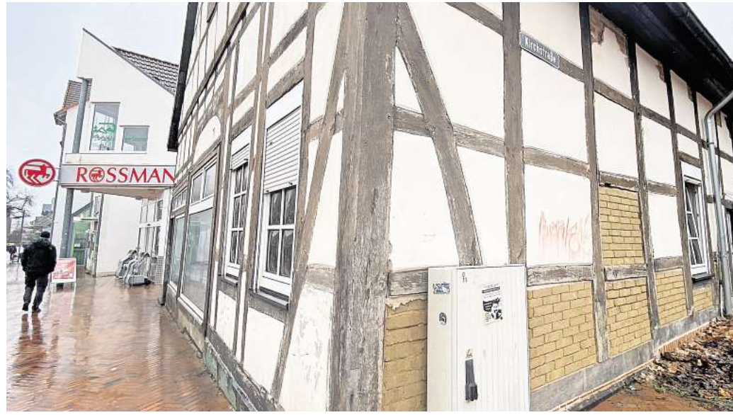
Umstrittenes Projekt auf der Investitionsliste: Das Fachwerkhaus am Thie in Barsinghausen soll für etwa 1,7 Millionen Euro saniert werden – doch nicht alle Ratsfraktionen finden das gut und sehen hier unnötig viel Geld ausgegeben.

Nach Angaben der Stadt zum Haushalt können die ordentlichen Erträge um rund 6,8 Millionen erhöht werden, auf knapp 98,6 Millionen Euro. Gleichzeitig steigen die Aufwendungen nur moderat um rund 2,8 Millionen Euro. Dadurch verbessert sich das Ergebnis deutlich: Das strukturelle Defizit im Ergebnishaushalt reduziert sich von rund 7,6 Millionen Euro auf etwa 3,6 Millionen Euro. Im Finanzetat zeigt sich ebenfalls eine Entlastung. Der Saldo aus der laufenden Ver-