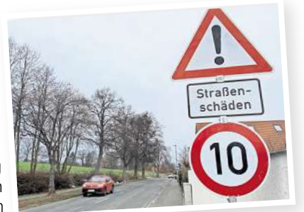
Eine drastische, aber unumgängliche Maßnahme wegen extremer Straßenschäden: Hier in Hohenbostel gilt jetzt Tempo 10 auf der L391.

Ebenso befänden sich genauere Details zu Dauer und Art der Einschränkungen für Verkehrsteilnehmer und Anwohner, die es durch die Straßensanierung geben wird, derzeit noch in der Ab-