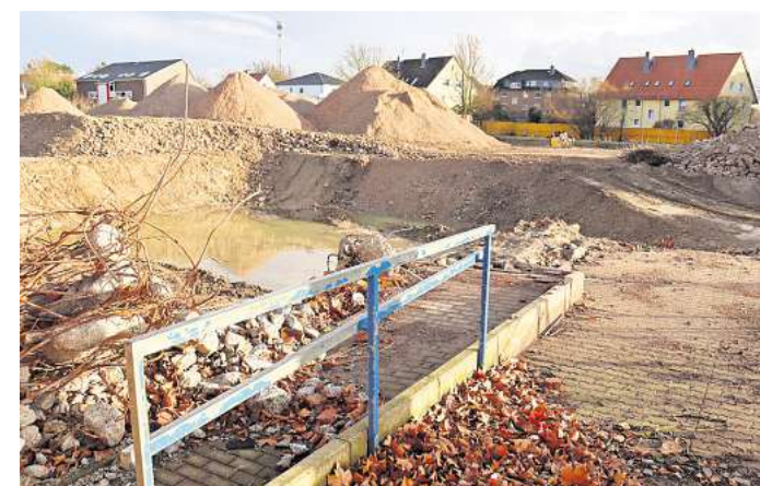
Stummer Zeitzeuge eines einst lebendigen Schulstandortes: An den Altbau der Grundschule Am Castrum erinnert nach monatelangen Abrissarbeiten nur noch ein blaues Geländer des früheren Eingangsbereiches.

Ab April soll der Staffstab auf der Baustelle weitergereicht werden. Dann beginnt der Rohbau für das neue Schulensemble. Zum Auftakt stehen laut Unsel „Fundament-, Gründungs- und Leitungsarbeiten“ auf dem Plan. Welche Baufirma diesen