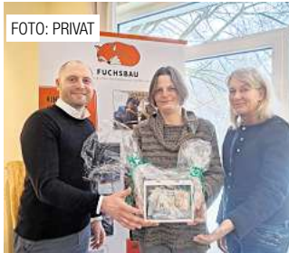
Geld für den Fuchsbau Seite 15