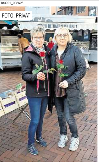
Frauen bekommen am Sonnabend eine Blume Seite 12