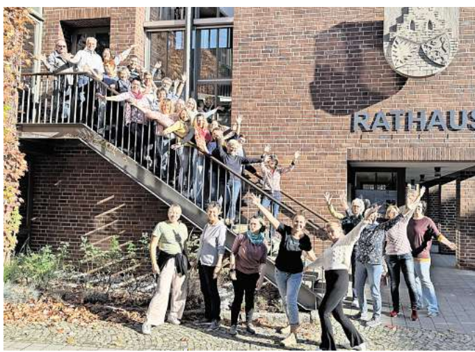
Lädt zum Workshop ein: die Gospelininitiative Gehrden.