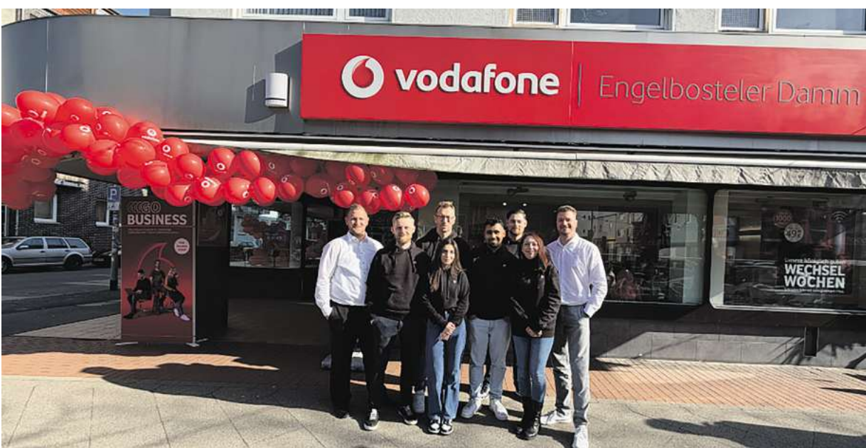
Das neue Team am Engelbosteler Damm freut sich auf neue und bekannte Gesichter.

Ob Privatkunde oder Geschäftskunde – in den modernen Räumen neh-