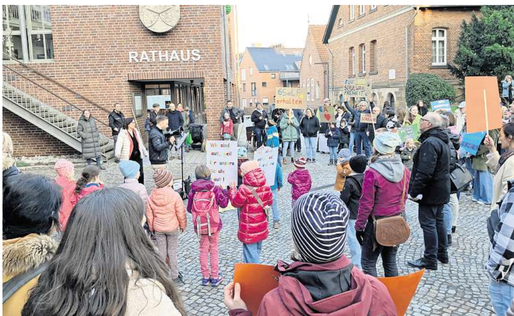
Hitzige Diskussionen: Im vergangenen Jahr gab es eine Elterndemo zu den Grundschulplänen in Gehrden.