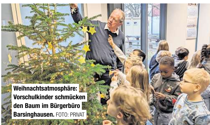
Weihnachtsatmosphäre: Vorschulkinder schmücken den Baum im Bürgerbüro Barsinghausen.

Die Feierlichkeiten beginnen um 21 Uhr. Aufgrund der großen Nachfrage empfiehlt sich eine frühzeitige Buchung – in den vergangenen Jahren war die Silvesterparty ausverkauft.