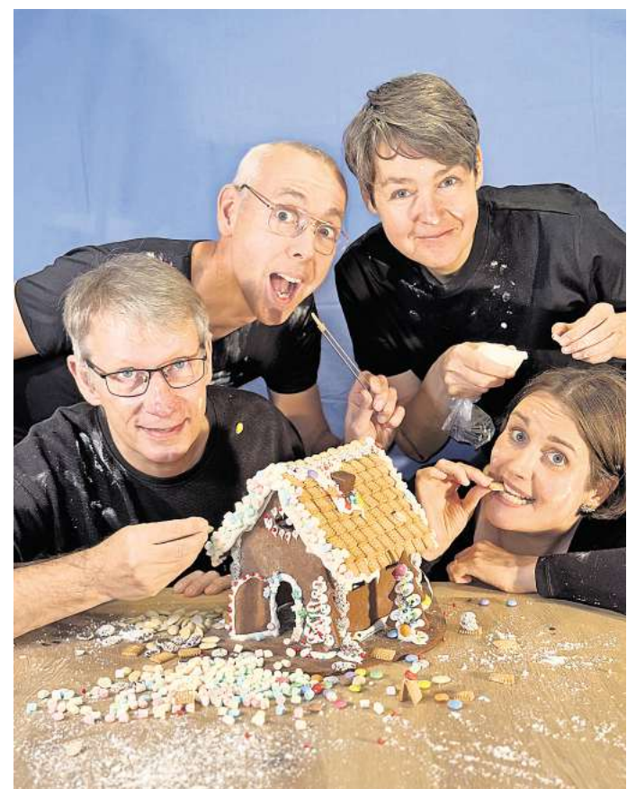
Auftritt am vierten Advent: Die 4 Christmas Singers treten im Rathaus in Gehrden auf.

Das Zuhören kostet keinen Eintritt, die Musikerinnen und Musiker freuen sich aber am Ende über „eine angemessene Spende“.