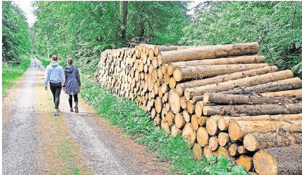
Nicht allein ein Aufenthaltsraum für Spaziergänge und Naherholung: Weil im Deister die vielfältige Nutzung von Interessengruppen geprägt ist, soll künftig ein Kodex mit Verhaltensrichtlinien für ein rücksichtsvolleres Miteinander sorgen.