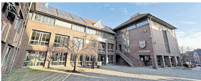
Modernisierung: Das Gehrden Rathaus soll für rund 7,3 Millionen Euro um einen zusätzlichen Trakt erweitert und umfassend erneuert und umgestaltet werden.

Ein Kritikpunkt von Fengler: In den vergangenen Jahren habe die Gehrden Stadtverwaltung immer mehr Personal eingestellt, ohne digitale Möglichkeiten zu nutzen, um Verwaltungsprozesse zu vereinfachen. Dazu könnte das bestehende Gebäude umgebaut werden, um eine „Neue Arbeitswelt“ zu schaffen. Gemeint seien damit flexible Arbeitsplätze, also keine personenbezogene Zuordnung mehr, oder das Einrichten von heimischen Arbeitsplätzen. In die Überlegungen könnte auch die Stadtbibliothek einbezogen werden, deren Platzbedarf durch die zumindest Umwandlung in eine