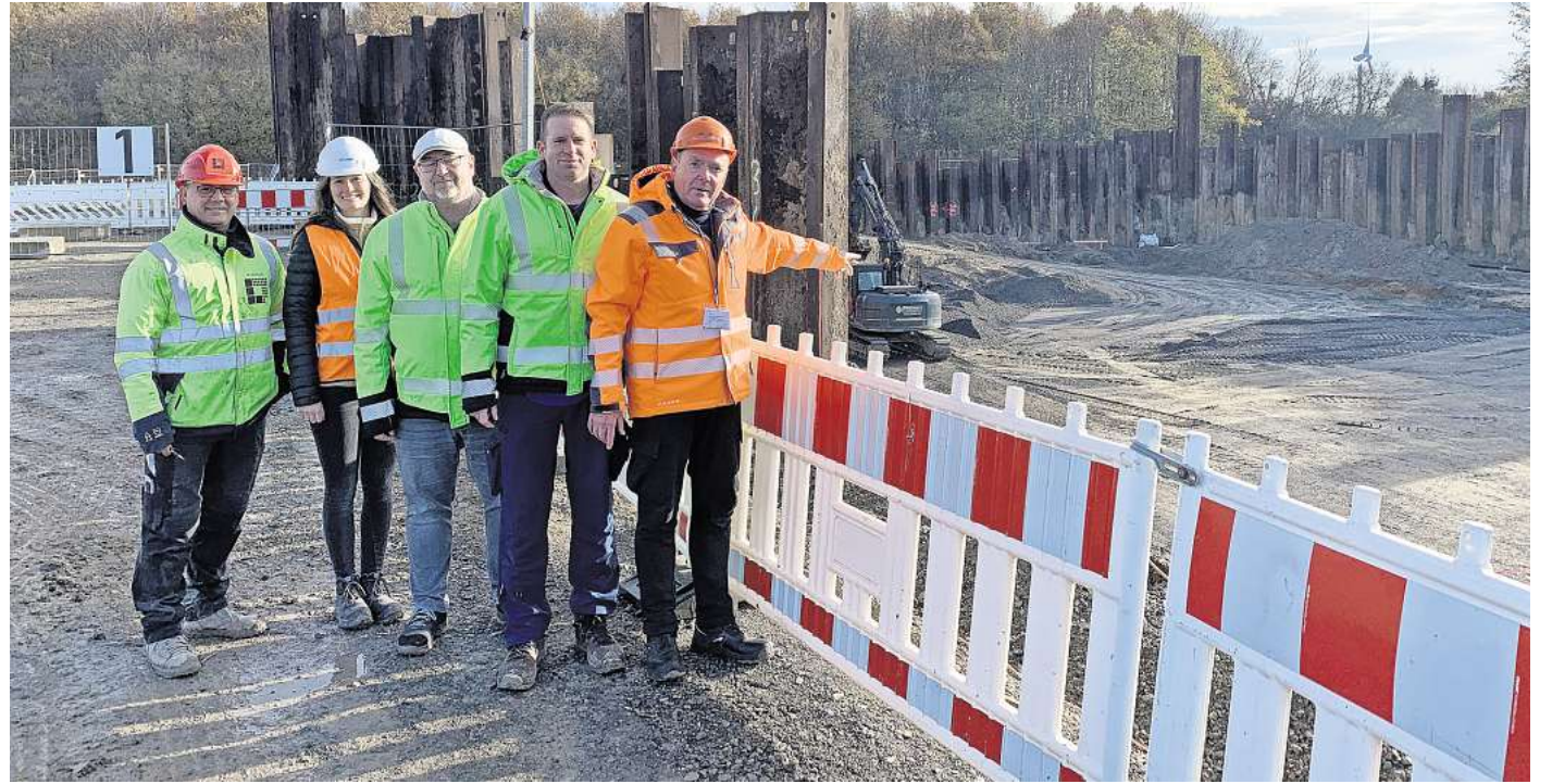
Vor der Baugrube: Die Beteiligten zeigen sich zufrieden mit dem Fortschritt des Wasserwerk-Neubaus in Eckerde.

Besonderes Fundament für einen problematischen Boden: Arbeiten auf der Großbaustelle in Eckerde gehen voran