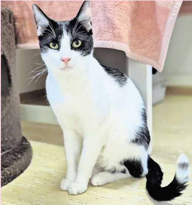
Mag fließendes Wasser, aber keine kleinen Kinder: der Kater Efe.

Weitere Informationen gibt es unter der Hotline (05105) 7736777.