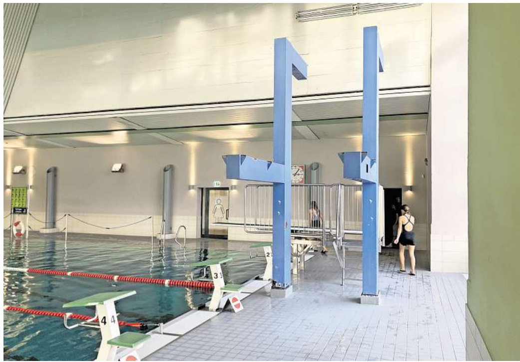
Wird abgebaut: Die Basis-Konstruktion des Sprungturms verschwindet. Springen konnte man hier schon seit mehrere Jahren nicht mehr. Im Hintergrund ist das Ein-Meter-Brett zu sein. Dieses bleibt erhalten.

„Die bestehenden Sprungtürme werden aufgrund erheblicher Korrosionsschäden und der fehlenden Möglichkeit einer technischen und wirtschaftlich vertretbaren Sanierung zurückgebaut“, sagt Frank Born, Sprecher der