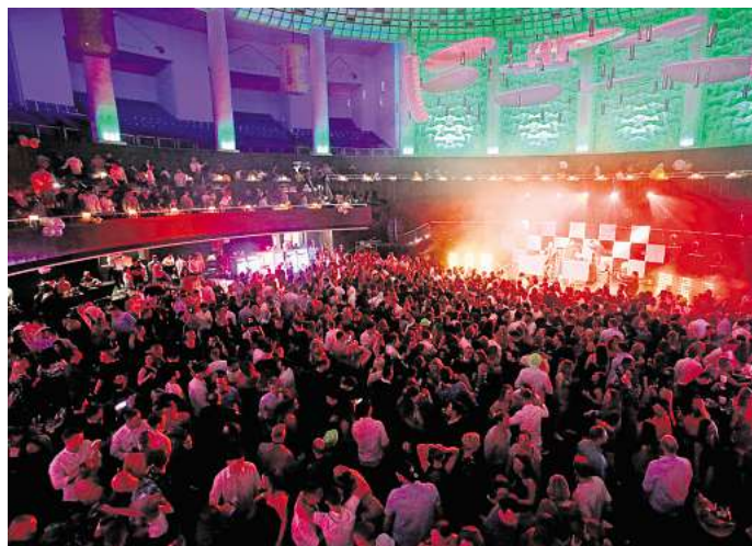
Bereits zum elften Mal steigt die große Silvesterparty im HCC.

H annover macht sich bereit für die größte Nacht des Jahres: Am 31. Dezember öffnet das HCC seine Türen. Fünf Säle verwandeln sich dann in unterschiedliche Tanzflächen und machen das Event zur größten Silvesterparty Hannovers. Die Haupttanzfläche bildet der Kuppelsaal, der zum NP-Dome wird. Die NP ist Medienpartner, Veranstalter ist Trend ID mit Martin Polomka.