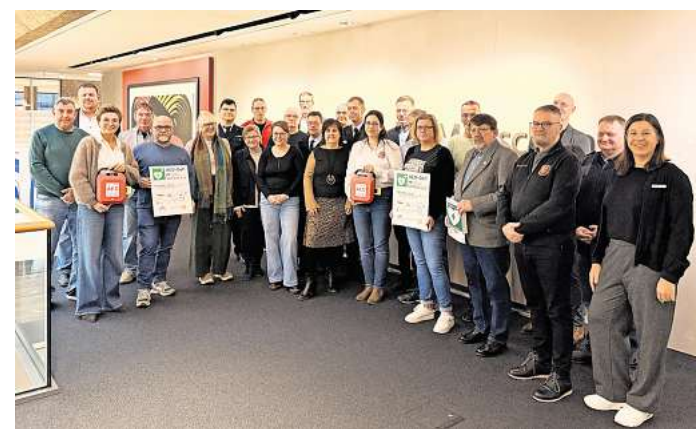
Freude über Lebensretter: Vertretende von Vereinen nehmen die Volksbank-Defibrillatoren in Empfang.