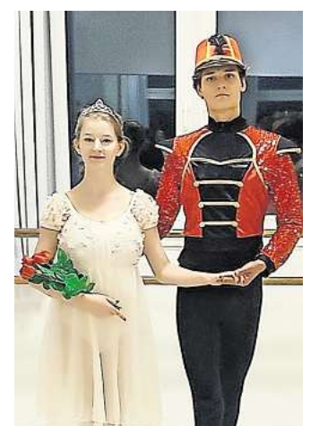
Aufführung in Barsinghausen: Balletttänzerinnen und -tänzer treten gemeinsam mit dem Ärztorchester auf.

Wennigsen/Barsinghausen. Am zweiten Adventswochenende, 6. und 7. Dezember, präsentieren die Mitglieder von Ballett am Deister aus Wennigsen und das Ärztorchester Hannover besondere Vorstellungen. An beiden Tagen zeigen sie im Theater am Spalterhals in Barsinghausen, um 11 und 15.30 Uhr das Ballett „Es war einmal... ein Nussknacker“ zu der Musik von Peter Tschaikowski.