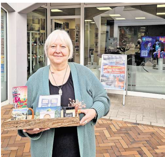
Angebot: In Barsinghausen gibt es Tickets für die Landesgartenschau 2026 in Bad Nenndorf.

Die Nutzung des öffentlichen Nahverkehrs ist im Ticketpreis bereits enthalten. „Wir freuen uns sehr, dass wir als Nachbarkommune zum Gelin-