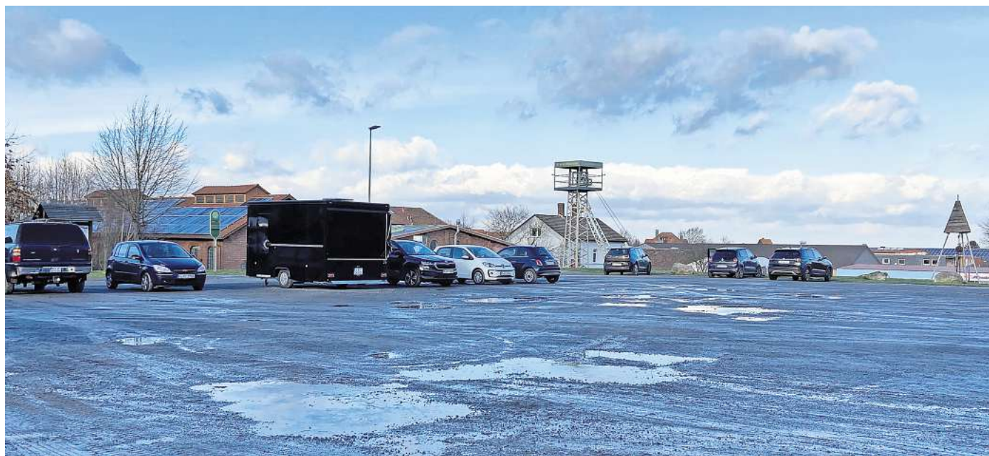
Soll schöner werden: Der Parkplatz an der Alten Zeche wirkt derzeit wenig einladend.

Die Verwaltung schlug vor, den Sperrvermerk für den Kindergarten Max & Moritz in Landringhausen aufzuheben, um mit