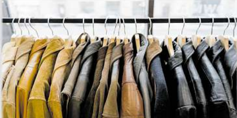
Für Lederjacken bis zu 3.500,-

Bisam • Persianer • Fuchspelze aller Art • Zobel • Nerze • Nutria • Chincilla