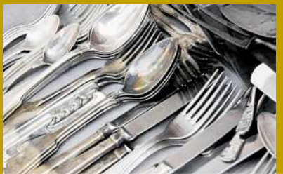
Silberbesteck bis zu 700,- Kg