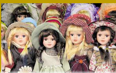
Porzellan Puppen bis zu 1.500,-