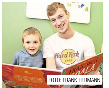
Der einzige männliche Mitarbeiter in den ASB-Kitas. Seite 11