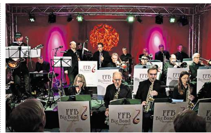
Auftritt im ASB Bahnhof: Die FFB-Bigband kommt nach Barsinghausen.

Neu gestaltet wird offenbar auch ein originalgetreues Modell eines Bergwerksstollens, in das Besucher hineinkriechen können. Grundsätzlich soll das renovierte Bergbaumuseum moderner, digitaler und interaktiver werden.