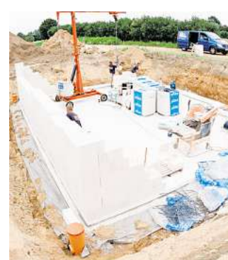
Wer keinen Keller braucht, kann kräftig sparen, verliert dafür aber die Option auf mehr Stauraum.

Die immensen Baukosten sind einer der größten Nachteile. Das liegt nicht nur an den zusätzlichen Materialkosten. Um Schäden durch Feuchtigkeit zu verhindern, müssen Keller aufwendiger als einfache Bodenplatten abgedichtet werden, so Stange. «Dadurch verlängert sich auch die Bauzeit.»