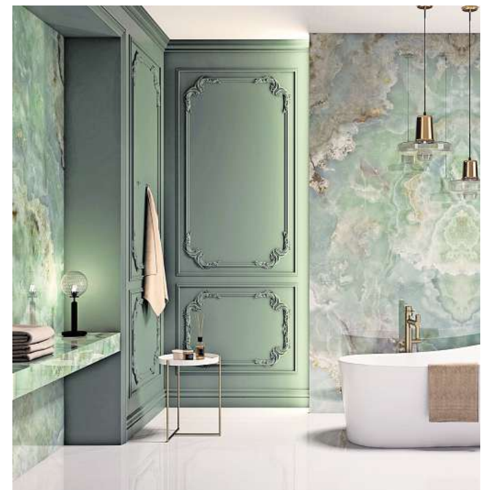
So schön wie Onyxmarmor: Keramische Fliesen in Natursteinoptik verleihen jedem Badezimmer mondänen Spa-Charakter.