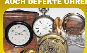
Taschenuhr (Gold & Silber)