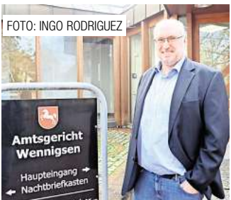
Neuer stellvertretender Direktor am Amtsgericht Wennigsen. Seite 7