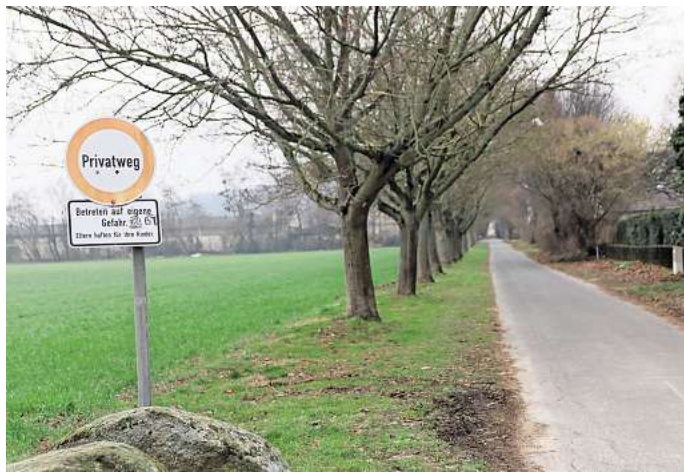
Es bleibt dabei: Die Straße Lemmier Bergfeld ist ein Privatweg. Eine öffentliche Nutzung möchten die Eigentümer nicht mehr.