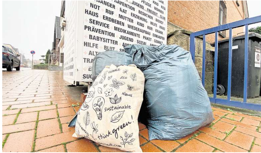
Beim DRK-Shop in der Osterstraße: Sind die Altkleidercontainer voll, werden die Säcke einfach daneben abgestellt.