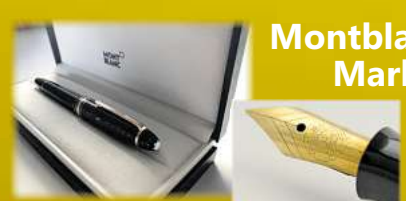
Montblanc & Markenstifte