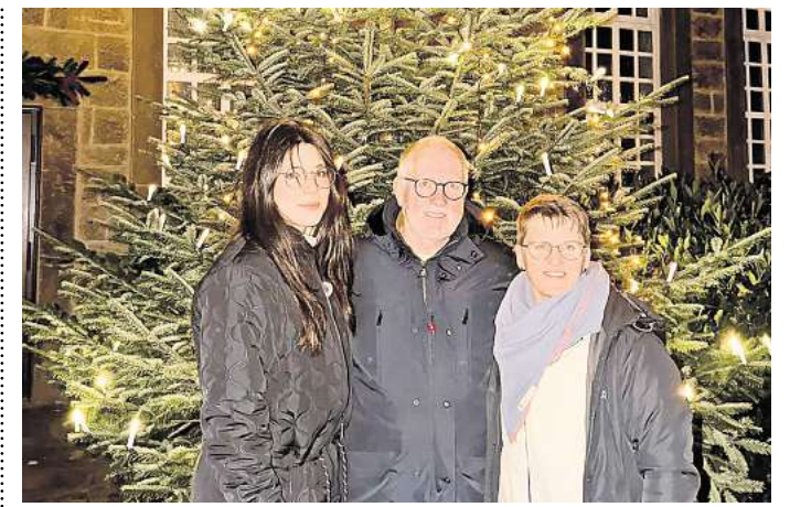
Freude bei Egestorfern: Ein 4,5 Meter großer Weihnachtsbaum steht in dieser Adventszeit im Ort.

Nachzulesen sind die detaillierten Zahlen unter dem Titel „Wanderungsplus: Region Hannover verzeichnet mehr Zu- als Wegzüge“ auf der Internetseite www.hannover.de unter dem Stichwort „ski“.