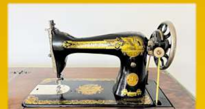
Für Nähmaschinen bis zu 1.500,-