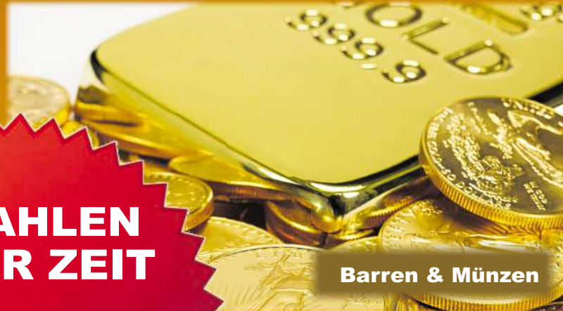
Barren & Münzen