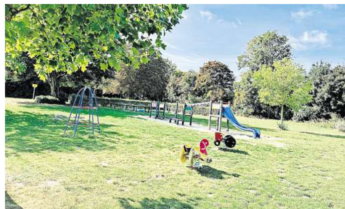
Fläche im Freibad: Dort, wo jetzt noch Spielgeräte auf dem Außengelände des Delfi-Bades stehen, soll eine neue Sporthalle errichtet werden.

Seit Jahren wird über fehlende Hallenzeiten für Schulen und Vereine diskutiert, seit mehr als fünf Jahren liegt ein Konzept für eine zweite Sporthalle auf dem Tisch. Nun kommt das Projekt allmählich voran. Ein sogenanntes Raumprogramm ist inzwischen erstellt worden. Dieses ist die Grundlage der weiteren Planung, die von einem Totalunternehmer übernommen werden soll. Die Vergabe erfolgt in einem europaweiten Verhandlungsverfahren. Es gliedert sich in den Teilnahmewettbewerb, in dem Bewerber ihr Interesse bekunden und ihre Eignung nachweisen, und das Verhandlungsverfahren, zu dem nur die Bewerber zugelassen werden, die ihre Eignung dargelegt haben.