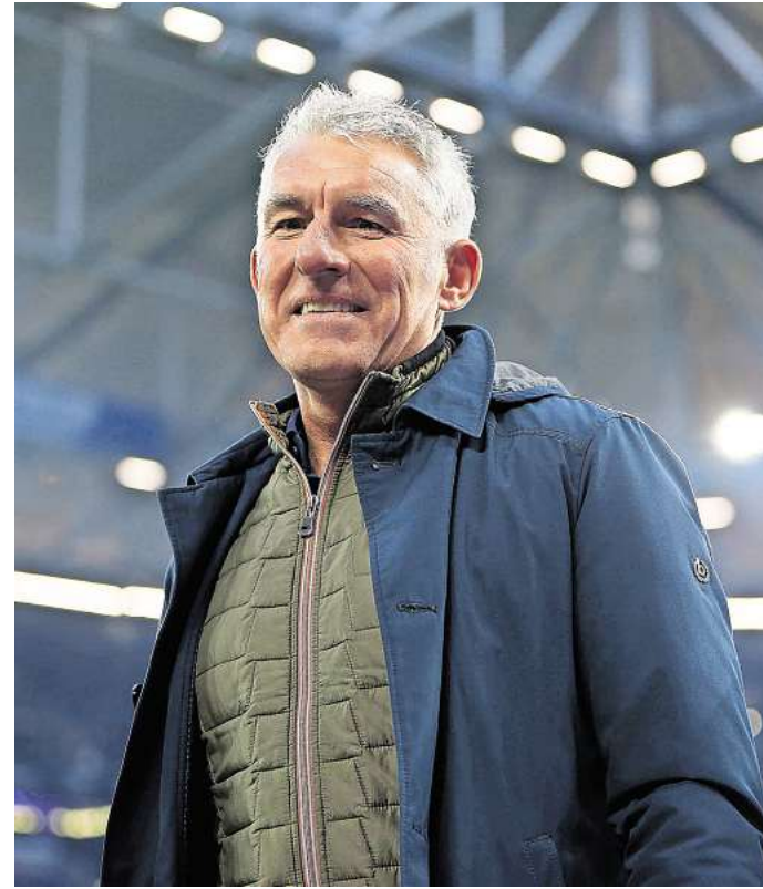
Mirko Slomka ist zu Gast beim Fußballtalk der Neuen Presse am 17. Dezember in der Alten Druckerei.

Konkrete Analysen in der Alten Druckerei