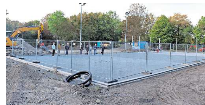
Wird vom TuS Empelde schon genutzt: Der neue Multifunktionsplatz für die Sportarten Pétanque und Bogenschießen ist bereits in Betrieb.