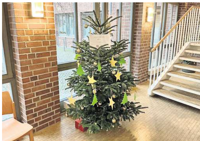
Besondere Aktion: Im Gehrden Rathaus steht ein Wunschbaum.

Bürgermeister Malte Losert sagt dazu: „Mein Dank geht an die Ortsgruppe Gehrden des Deutschen Roten Kreuzes für die Unterstützung und bereits jetzt an alle, die einen Wunsch erfüllen und beim Gelingen des Projekts mithelfen.“ Er richtet noch einen Appell an die Menschen in Gehrden: „Unterstützen Sie beim Weihnachtseinkauf bitte unseren lokalen Einzelhandel.“