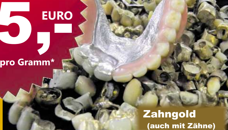
Zahngold (auch mit Zähne)

Bei sehr bevorzugte Gold Gegenstände zahlen wir einen Zuschlag von bis zu 28% !