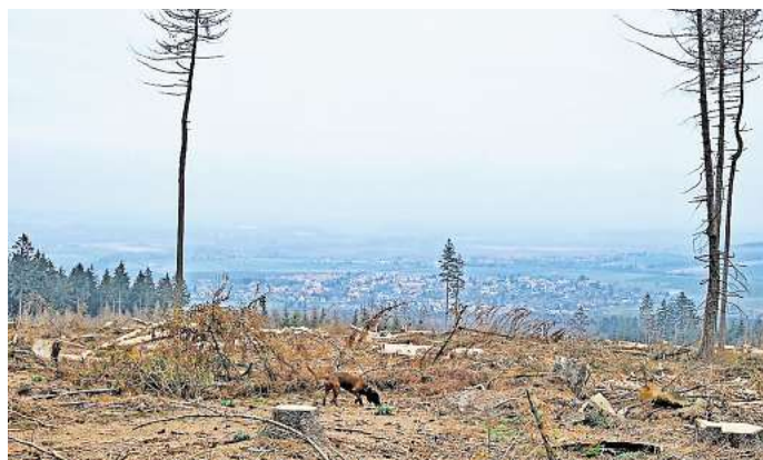
Im Deister klaffen seit Jahren immer wieder große Löcher im Wald: Der Borkenkäfer hat zahlreiche Bäume befallen.