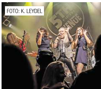
5th Avenue rockt im ASB-Bahnhof Barsinghausen. Seite 4