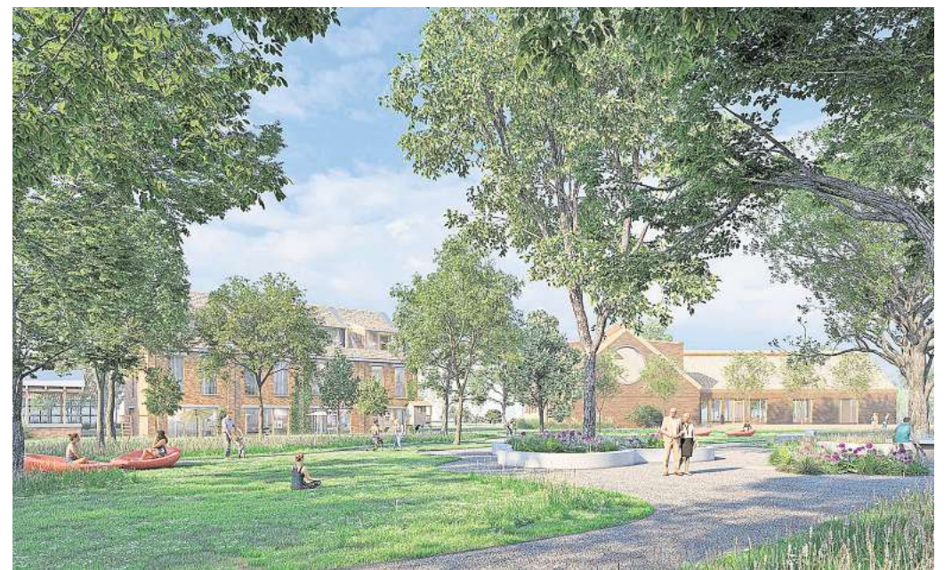
Viel Grün und eine hohe Aufenthaltsqualität: Die Planer sehen für Empelde-Mitte viel Grün im Zentrum der Planungsfläche vor.

Eine wohnortnahe Versorgung ist in Empelde-Mitte durch die zwei bestehenden Supermärkte auf der anderen Straßenseite der Berliner Straße bereits gegeben. Auch das Fachmarktzentrum an der Chemnitzer Straße ist fußläufig schnell zu erreichen. Dazu kommt eine fast optimale Anbindung an den öffentli-