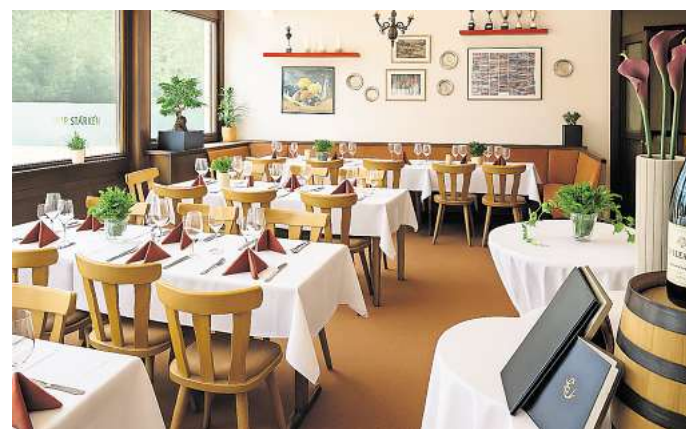
Die gemütliche Gaststube lädt zum Grünkohl-Büfett ein.

Restaurant am Tennisplatz Ludwig-Jahn-Straße 4 30890 Barsinghausen Telefonnummer für Bestellungen und Reservierungen: (0 51 05) 5 12 29 2 oder (01 73) 6 18 51 55 Öffnungszeiten: Mittwoch bis Sonnabend ab 16 Uhr; Sonn- und Feiertage ab 12 Uhr