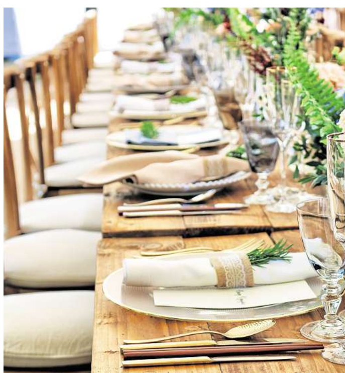
Bei der Wahl des richtigen Veranstaltungsorts für ein generationsübergreifendes Fest sollte auf bestimmte Kriterien geachtet werden.

Für Senioren ist Barrierefreiheit ein entscheidendes Kriterium. Stufenlose Zugänge, breite Türen, rutschfeste Böden und gut beleuchtete Bereiche sorgen dafür, dass sich niemand ausgeschlossen fühlt. Auch die Akustik spielt eine Rolle – zu laute Musik oder Hall in großen Räumen können Gespräche erschweren. Eine warme, aber