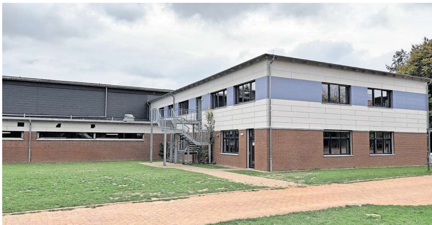
Hier läuft bis Jahresende nichts mehr: Die Sporthalle der KGS Wennigsen bekommt einen neuen Fußboden. Vereine müssen auf andere Trainings- und Spielstätten ausweichen.

Es geht um Fördermittel, dank derer die hoch verschuldete Gemeinde den Hallenboden mit einem geringen Eigenanteil sanieren kann. Von den circa 280.000 Euro übernimmt das Land 90 Prozent. Als Bedingung müssen die Arbeiten aber zwin-