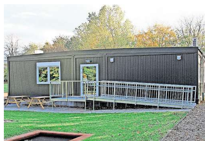
Mehr Hortgruppen: Am Mühlenrär in Ronneberg soll ein weiterer Hortcontainer aufgestellt werden.

an die Ganztagsbetreuung gibt es unterschiedliche Planungen für die verschiedenen Standorte. Während die neu gebaute Grundschule auf dem Hagen – wie die THS in Empelde – bereits seit 2024 den Betrieb als Ganztagschule regulär aufgenommen hat, bleibt die Zwergschule in Benthe bis auf Weiteres eine sogenannte Verlässliche Grundschule mit einem nachmittäglichen Hortbetrieb. Dieser wird ab 2026 dann für alle Kinder angeboten.