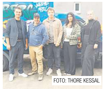
Ronnenbergs Stadtjugendpfleger stellen sich vor. Seite 6