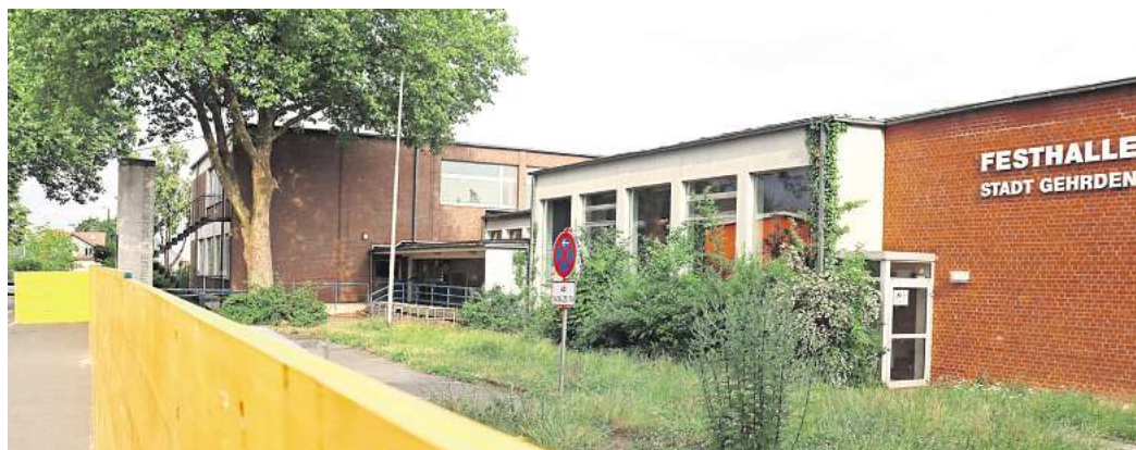
Ein Teil der Baustelle ist schon eingerichtet: Mit gut einem Jahr Verspätung beginnen die jetzt endlich die vorbereitenden Arbeiten für den Abriss der Grundschule.

Über dieses Projekt ist in der jüngsten Ratsitzung noch einmal ausgiebig debattiert worden. Die Gesamtkosten der Halle beziffert die Verwaltung auf