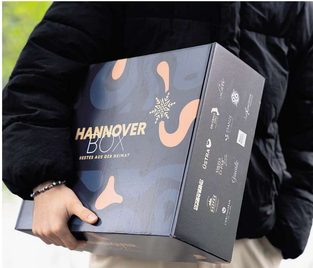
Hannovers Vielfalt im Paket: Die Hannover-Box.