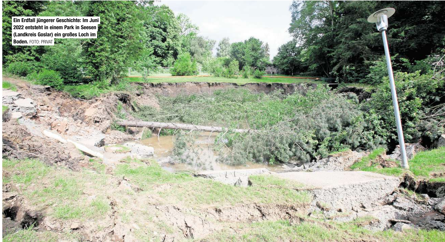
Ein Erdfall jüngerer Geschichte: Im Juni 2022 entsteht in einem Park in Seesen (Landkreis Goslar) ein großes Loch im Boden.