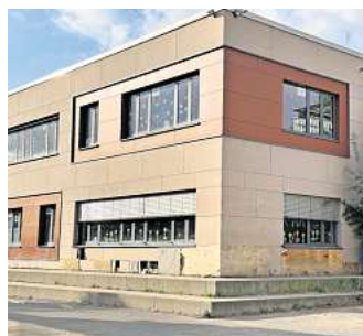
Vandalismus: Die Fassade an der IGS ist stark beschädigt. Die Platten an Gebäuden sind eingetreten worden.

Gehrden. Bürgermeister Malte Losert (parteilos) hat angekündigt, dass die Stadt Gehrden künftig nicht mehr für Schäden an öffentlichen Einrichtungen aufkommen werde. Der Grund: Zunehmender Vandalismus. Davon sind auch Schulen betroffen. Gerade dort wird regelmäßig randaliert. Sie müssen nun selbst für die Instandsetzungskosten aufkommen. Wir haben bei Gehrden Schulen nachgefragt, was sie von dem Schritt der Stadt halten.