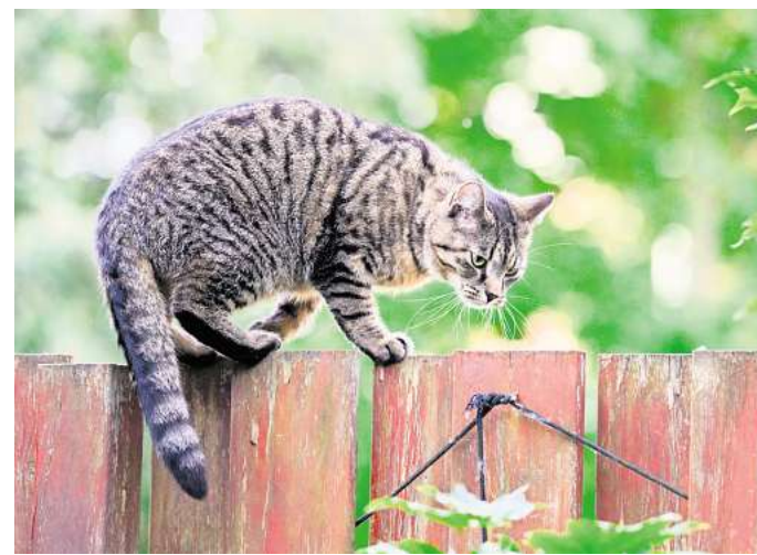
Probleme mit unkastrierten Katzen: Die Wennigser Tierschutzgruppe schlägt Alarm, weil es trotz Kastrationspflicht in der Gemeinde immer mehr Streuner gibt.

So weit die Theorie. In der Praxis wird die Pflicht offenbar noch immer von vielen Halterinnen und Haltern ignoriert – aus „Bequemlichkeit und Gleichgültigkeit“, vermutet Wallat. Auch Geld spiele eine Rolle, denn die Preise für den medizinischen Eingriff seien in den vergangenen Jahren gestiegen. „Die Menschen schaffen sich eine Katze an, sind sich der Kosten aber nicht bewusst“, kritisiert Wallat.