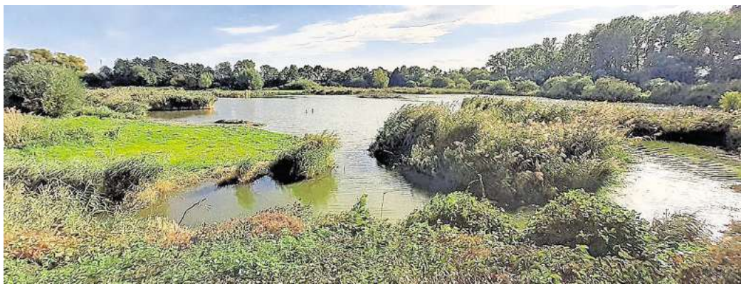
Ein Besuch lohnt sich: Die Stapelteiche in Weetzen sind zu jeder Jahreszeit ein beeindruckendes Ziel.