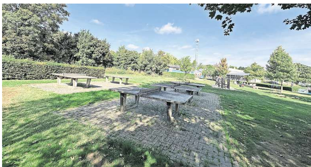
Platz für die neue Halle: Auf dem Gelände des Delfi-Bades soll die neue Dreifeld-Halle errichtet werden.