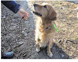
Neue Regelung: Die Stadt will klarer festlegen, wie Hunde in der Öffentlichkeit zu halten sind.

Betroffen sind von der Neufassung vor allem Hundebesitzer. „Wir wollen das Verhalten der Hunde neu regeln“, sagte Berger. Die Zahl der Menschen, die im Stadtgebiet einen Hund haben, hat laut Berger deutlich zugenommen. Das führe häufiger zu Konflikten. Die Anzahl der At-