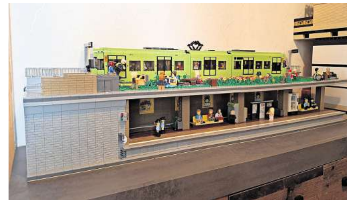
Variabel: Die grüne Straßenbahn kann auch „unterirdisch“ als U-Bahn eingesetzt werden.