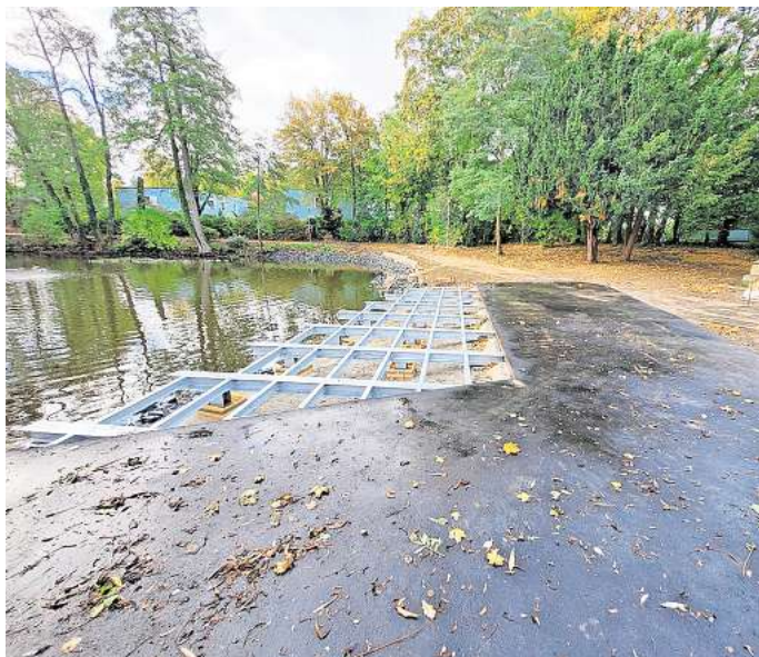
Bald fertig: Die letzten Arbeiten am Ziegenteich stehen noch aus.

Es müssen in den folgenden Tagen nur noch die Restarbeiten erfolgen. Hierzu zählen das Einfärben des asphaltierten Gehweges in Sandfarben, die abschließenden Holzarbeiten am Hochzeitsbalkon, die Aufstellung von Mobiliar sowie Pflanzarbeiten.