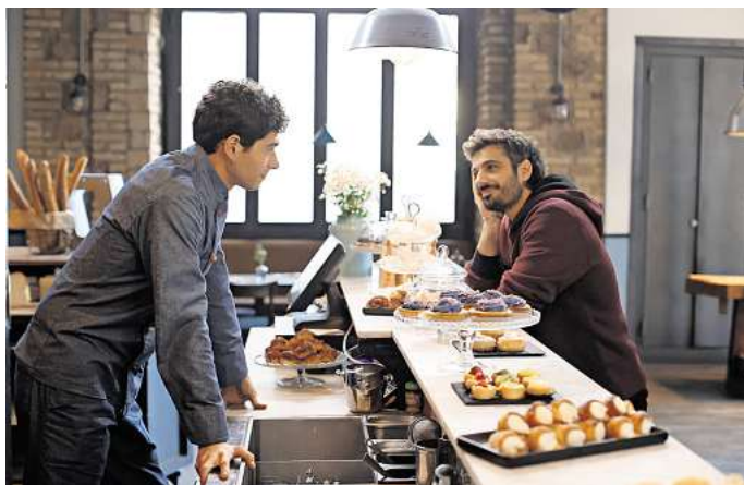
Szene aus „Mascarpone 2“.

Weitere Informationen und alle Termine auf der www.perlenfilmfestival.de