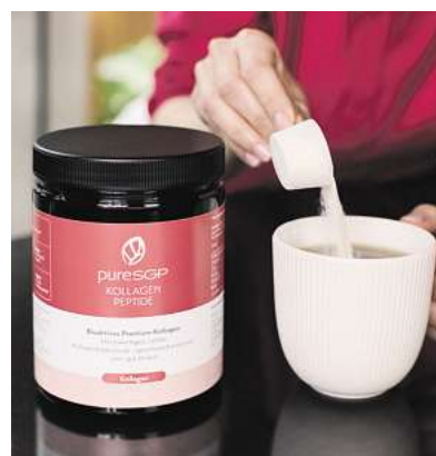
Das pureSGP Kollagenpulver lässt sich problemlos in jedes Getränk einrühren.

Experten sprechen von Haarausfall, wenn täglich mehr als