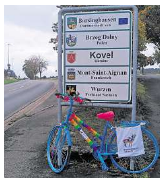
Neu: In Bantorf hat der Verein Barsinghausen ist bunt ein Fahrrad-Denkmal aufgestellt.