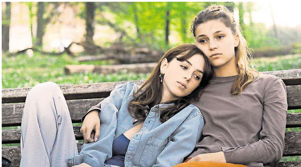
Szene aus „Rivière“.

Spielfilmhighlights sind das knallbunte, intergalaktische Abenteuer „Lesbian Space Princess“ (24. Oktober, 20 Uhr, Englisch mit deutschen Untertiteln) und die Fortsetzung des Publikumserfolgs „Mascarpone“ von 2022 – die schwule Romantikkomödie „Mascarpone 2: The Rainbow Cake“ (31. Oktober, 20 Uhr, Italienisch mit dt. UT). Die Romantik kommt auch in „Lesbian Space Princess“ nicht zu kurz, wenn Prinzessin Saira ihre Freundin Kiki aus den Händen der Straight White Malien befreien muss. In „Mascarpone 2“ treffen wir Luca und den Konditor Antonio wieder und begleiten sie durch die Liebeswirren ihres neuen Lebens.