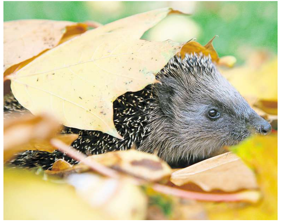
Schutz und Wärme: Igel nutzen Laubhaufen gern als Versteck.

Tauchen Igel, Vögel oder Eichhörnchen im Garten oder auf dem Balkon auf, bitte nur beobachten, nicht stören. Wer ein verletztes oder teilnahmsloses Tier findet, sollte Kontakt mit einer Wildtierstation oder einem Tierarzt aufnehmen.