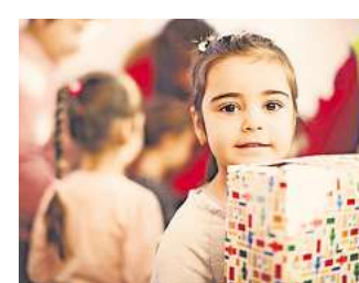
Oft das einzige Geschenk für die Kinder: Unter anderem gehen die Päckchen nach Moldawien, wie hier bei einer früheren Verteilaktion.