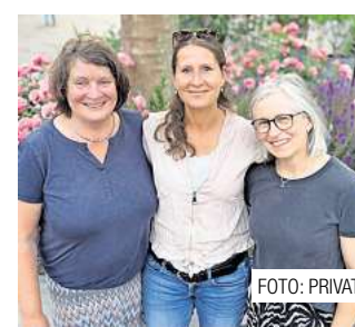
Keine Betreuung mehr bei den „Königskindern“. Seite 5

38 Jahrgang 51 Sonnabend, 20. September 2025 Barsinghausen Gehrden Ronnenberg Wennigsen