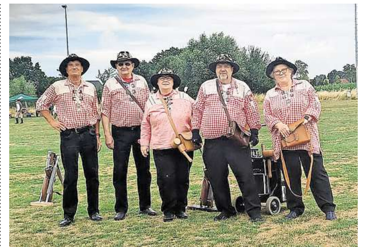
Bekommen Besuch: Ein NDR-Fernsehteam ist beim Heimatverein Eisen & Schlägel Deister am 20. September zu Gast.