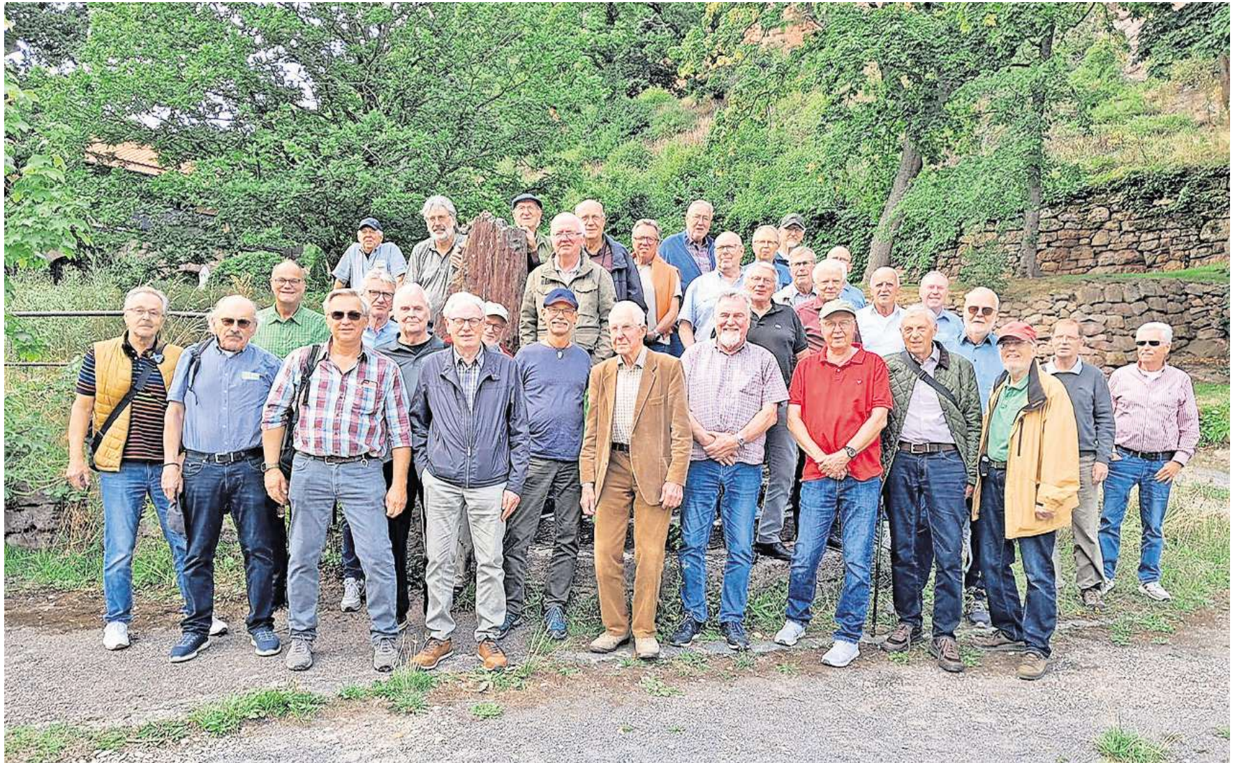
Unternehmungslustig: Fast 30 Ausflüge machen die Mitglieder des Männertreffs im Jahr. Anfang August ging es beispielsweise zum Kyffhäuser-Denkmal.

1995 ist der Männertreff ins Leben gerufen worden – an Bedeutung hat er seitdem nichts eingebüßt