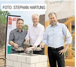
Grundsteinlegung für ein Wohnhaus am Steintor in Gehrden. Seite 3