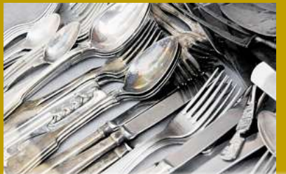
Silberbesteck bis zu 700,- Kg