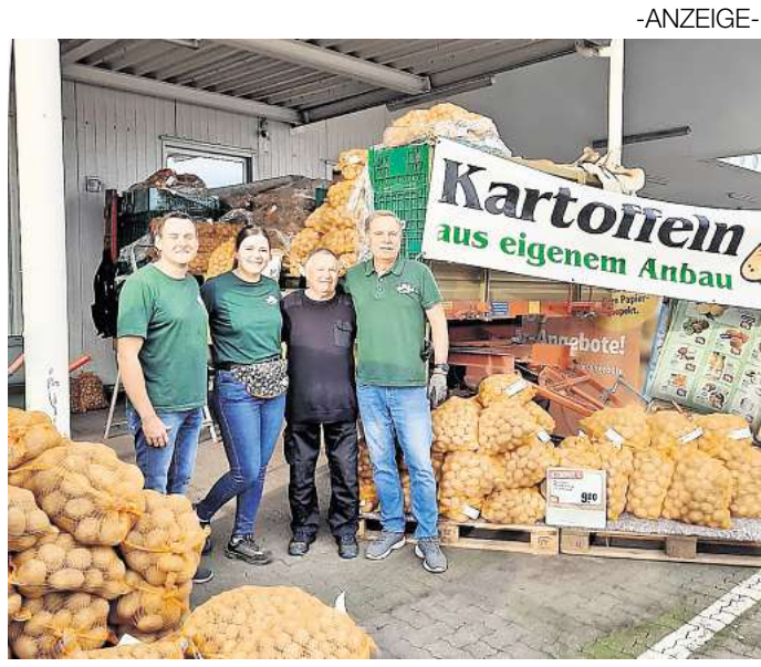
Kartoffelfans aufgepasst! Am 26. und 27. September ist wieder Kartoffelaktion bei Rewe.