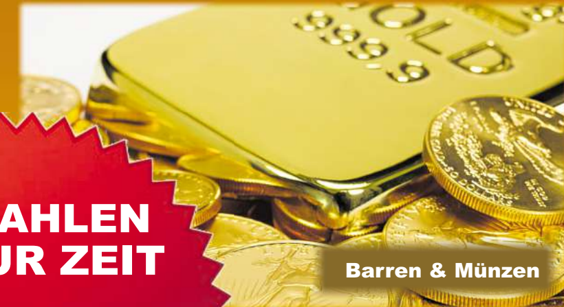
Barren & Münzen