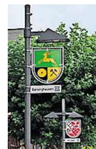
Neu: In Barsinghausen hängen nun wieder die Ortswappen.

Barsinghausen. Seit Mitte September neue Ortswappen in der Fußgängerzone aufgehängt. Die alten Wappen hätten laut Verwaltung zuvor aufgrund mangelnder Stabilität abgenommen werden müssen. „Es ist schön zu sehen, wie sich nun auch hier wieder die 18 Ortsteile im Herzen der Stadt vereinen“, so Stadtbaurat Tobias Fischer.