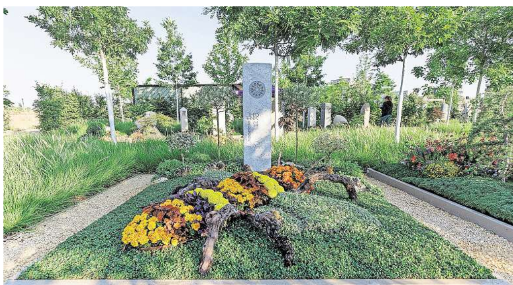
Seit dem Jahr 2001 begeht der Bund deutscher Friedhofsgärtner (BdF) den Tag des Friedhofs, um jeweils am dritten Septemberwochenende auf die kulturelle, soziale und ökologische Rolle von Friedhöfen hinzuweisen.