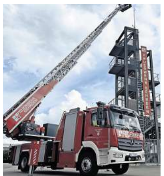
Neues Fahrzeug: Erstmals in der mehr als 115-jährigen Geschichte verfügt die Feuerwehr Gehrden über eine Drehleiter.

Das neue Rettungsgerät mit dazugehörigem Wagen wurde im April 2025 beim Hersteller abgeholt. Seitdem sind 24 Einsatzkräfte intensiv als Maschinisten intensiv geschult worden, um die komplexe Technik bedienen zu können. Beinahe täglich war das zehnte Meter lange und 16 Tonnen schwere Einsatzfahrzeug darum bei Übungen auf dem Feuer-