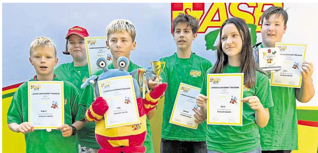
Siegreich: Die Gruppe der ASJ Leine-Weser gewinnt den Landesjugendwettkampf.

Souverän zeigten sich die zwölf- bis 15-jährigen Nach-