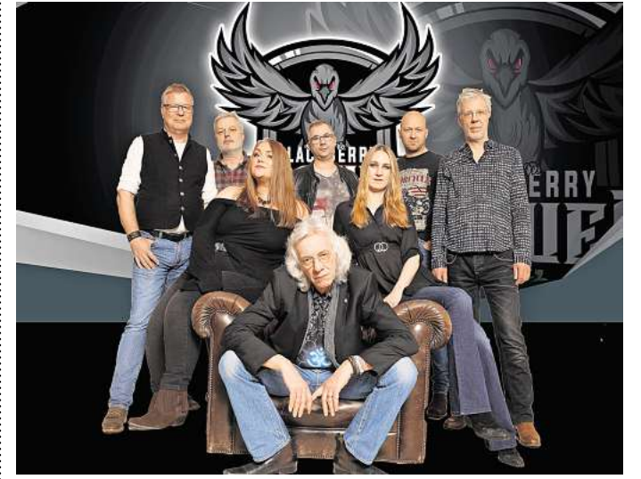
Auftritt in Barsinghausen: die Blackberry Crows.

Viele weitere, spannende Neuigkeiten aus der lokalen Kulturszene finden Sie in der aktuellen Ausgabe unseres Partnermediums magaScene, monatlich frisch gedruckt und kostenlos an über 500 Ausgelegten in Hannover oder online auf www.magaScene.de inklusive Download-Möglichkeit.