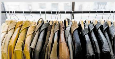
Für Lederjacken bis zu 3.500,-

Bisam • Persianer • Fuchspelze aller Art • Zobel • Nerze • Nutria • Chincilla