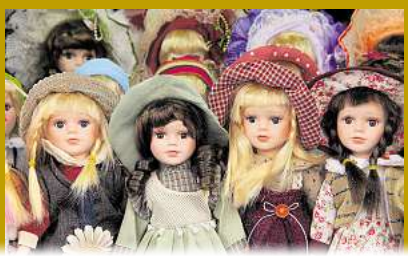
Porzellan Puppen bis zu 1.500,-