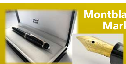
Montblanc & Markenstifte