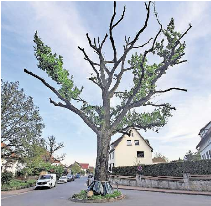
Kein schönes Bild: Die Benter Eiche treibt nur noch an wenigen Ästen aus.

Zweiter Gutachter bei Ortstermin Überraschend erschien zum Ortstermin am Baum auf Initiative Schmiersows hin mit Clemens