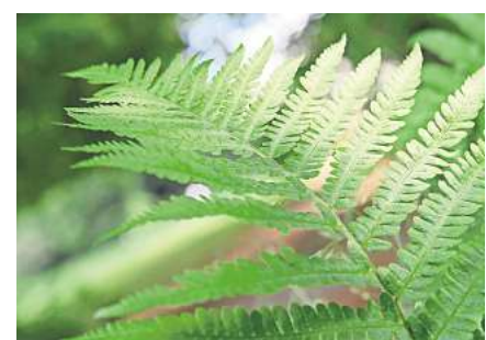
Männerfarn kommt auch wild vor und wird bis zu einem Meter hoch.

• Königsfarn kann bis zu zwei Meter hoch werden und verträgt vergleichsweise viel Sonne. Die frischgrünen Blätter sind doppelt gefiedert und wirken dadurch luftig und elegant. Im Herbst färben sie sich goldbraun. • Hirschkungenfarn ist ein immergrüner Farn. Seine Blätter sind nicht federförmig, sondern lanzettförmig. Er mag kalkhaltigen (also nicht zu sauren) Boden. • Tüpfelfarn hat zarte, federförmige Blätter mit lederartiger Textur und ist ebenfalls immergrün. Er bleibt mit etwa 70 Zentimetern relativ niedrig und verträgt auch