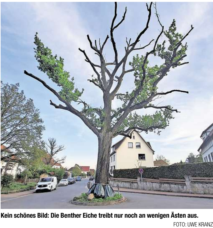
Kein schönes Bild: Die Benter Eiche treibt nur noch an wenigen Ästen aus.