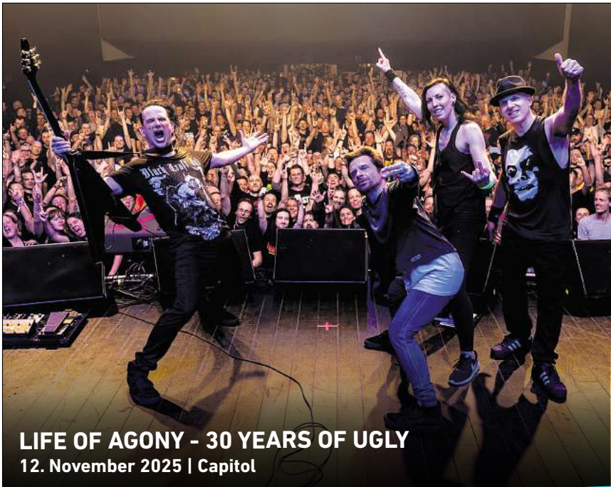
LIFE OF AGONY - 30 YEARS OF UGLY 12. November 2025 | Capitol

Auswirkungen auf den Netto-Markt in der Barsinghäuser Kernstadt soll die geplante neue Filiale in Groß Munzel nicht haben. Die Unternehmenssprecherin teilt dazu auf Nachfrage mit: „Die bereits bestehende Netto-Filiale in der Hinterkampstraße mit einer Verkaufsfläche von 700 Quadratmetern bleibt weiterhin bestehen.“