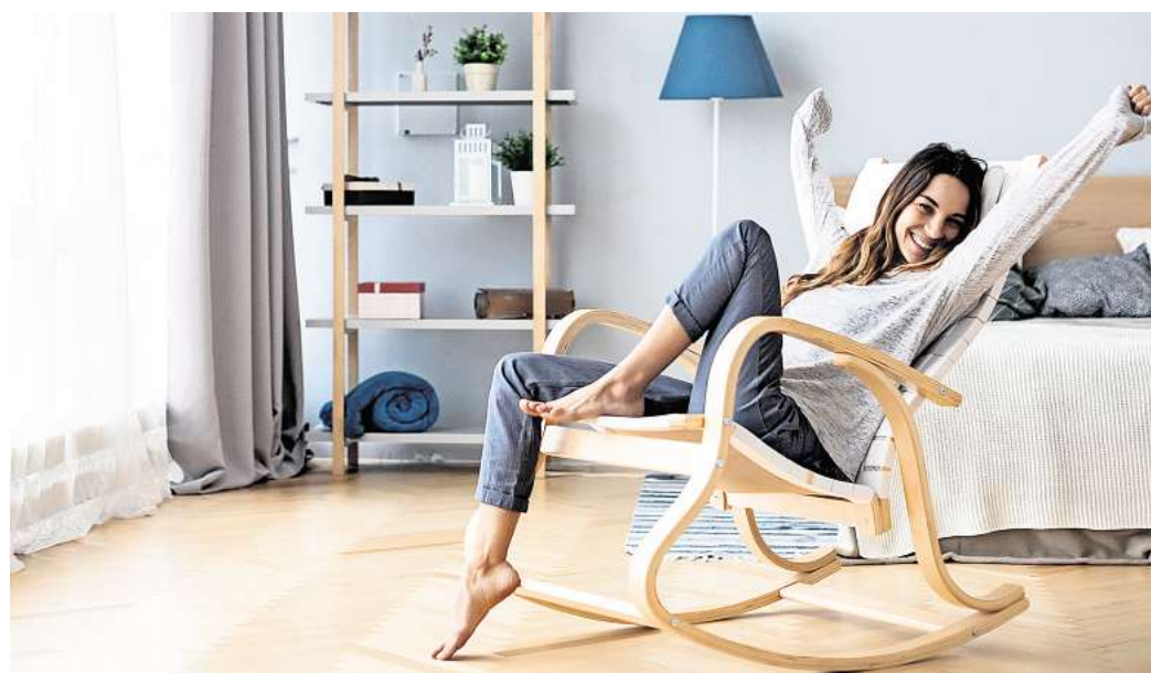
Regelmäßiges Lüften und ausreichendes Heizen sorgen für ein gesundes Raumklima und fördern das Wohlbefinden. Reichen diese Maßnahmen nicht aus, kann eine kontrollierte Wohnungslüftung mit Wärmerückgewinnung wirkungsvoll Abhilfe schaffen.

Die Energiekrise sorgt nach wie vor für große Verunsicherung – vor allem wegen der steigenden Heiz- und Energiekosten. Um die Heizkostenrechnung nicht noch weiter in die Höhe zu treiben, drehen viele Menschen die Heizung nur noch auf das Nötigste auf und verzichten sogar auf regelmäßiges Lüften. Doch so verständlich dieses Verhalten auch ist: Es kann fatale Folgen haben, warnt die Initiative Gute Luft. Denn wer zu wenig heizt und nur selten lüftet, riskiert nicht nur kalte Wände, sondern auch feuchte Raumluft. Und genau diese Kombination ist der ideale Nährboden für Schimmelpilze. Besonders betroffen sind innenliegende Bäder ohne Fenster, aber auch Schlaf- und Kinderzimmer – Orte, an denen Schimmel nichts zu suchen hat. Regelmäß-