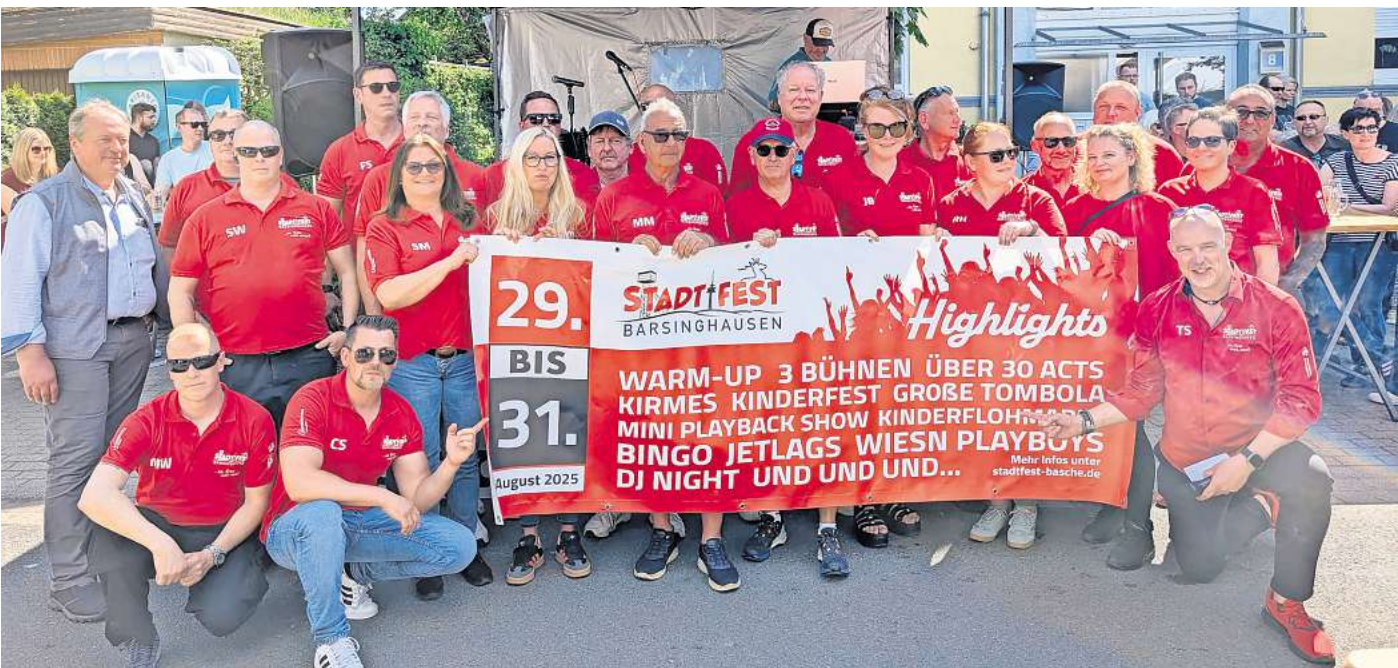
Beim Stadtfest-Opening: Um die große Party in Barsinghausen zu organisieren, sind viele Helferinnen und Helfer nötig.

Aufgrund der Baustelle am Rathaus werden in diesem Jahr nur drei Bühnen aufgebaut. „Derzeit können wir uns dadurch leider nicht vergrößern“, sagte