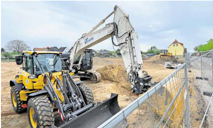
Baustelle in Groß Munzel: In nur sieben Monaten soll hier ein neuer Supermarkt entstehen.

Die Regensburger Baufirma Ratisbona gilt als einer der führenden Projektentwickler für nachhaltige Handelsimmobilien und hat nach eigenen Angaben seit der Firmengründung 1987 bereits mehr als 1.200 Märkte