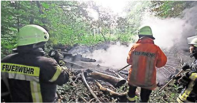
Die Waldbrandgefahr im Deister steigt: Es muss kein vorsätzlich angezündeter Holzstapel wie bei diesem Einsatz der Bredenbecker Feuerwehr sein. Auf den ausgetrockneten Waldböden kann schon eine Zigarette ein Feuer auslösen.

Rauchen im Wald steht in Niedersachsen allerdings unter Strafe. Im Zeitraum der soge-