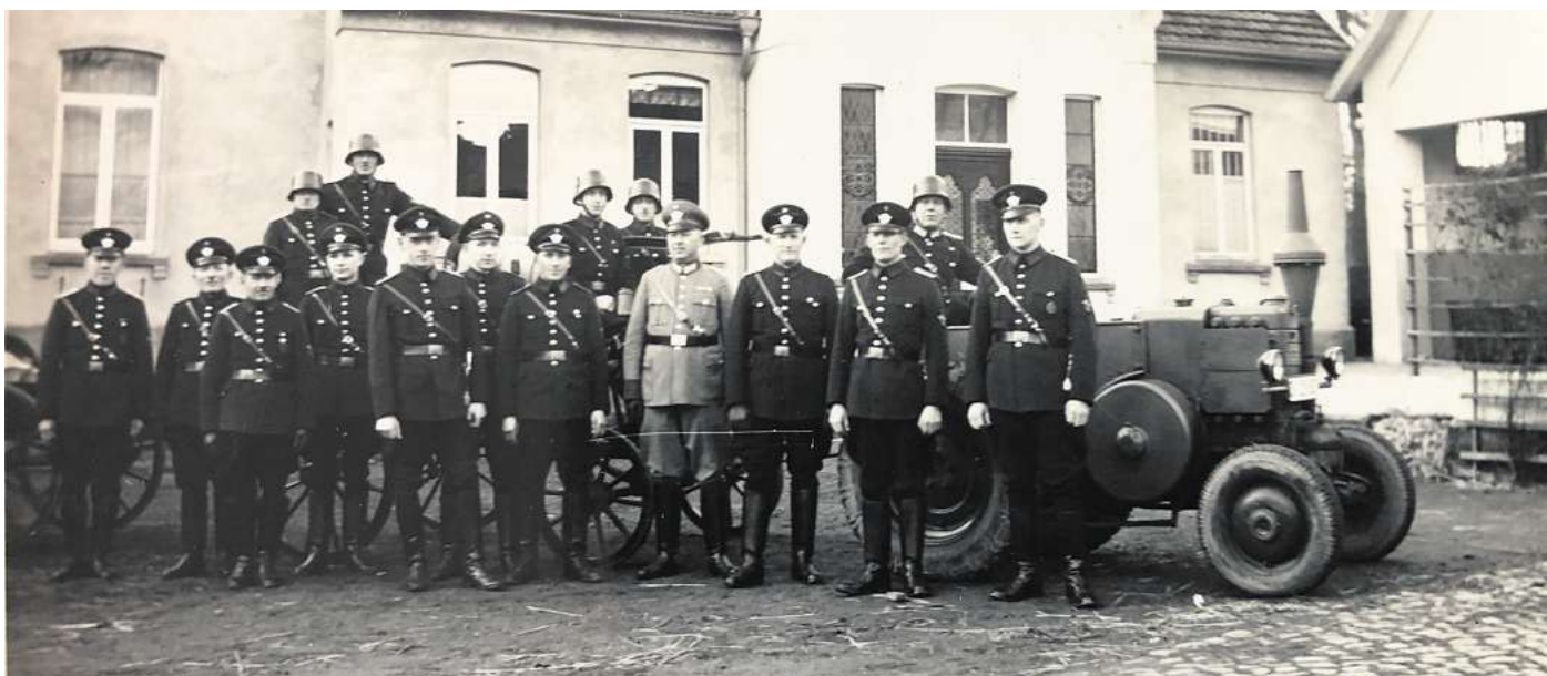
Historisches Foto: Everlohs erste Freiwillige Feuerwehrmannschaft wurde 1935 gegründet. Das Foto zeigt sie im Jahr 1936.

Die Feuerwehr Everloh feiert ihr 90-jähriges Bestehen. Ein Blick zurück offenbart den gewaltigen Wandel des Feuerwehrwesens.