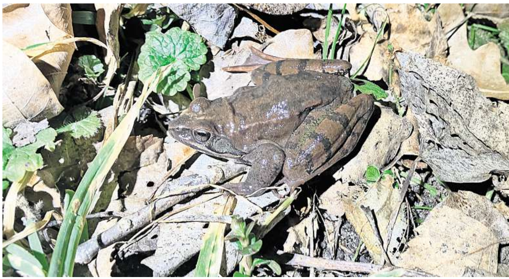
Hüpft bis zu zwei Meter: der Springfrosch.