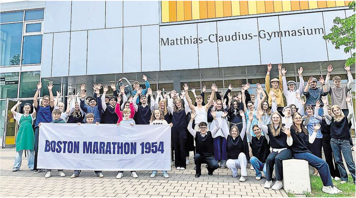
Ein starkes Ensemble: Die jungen Schauspieler und Schauspielerinnen des MCG proben für das Stück „Ein Wunder für Ralph“.