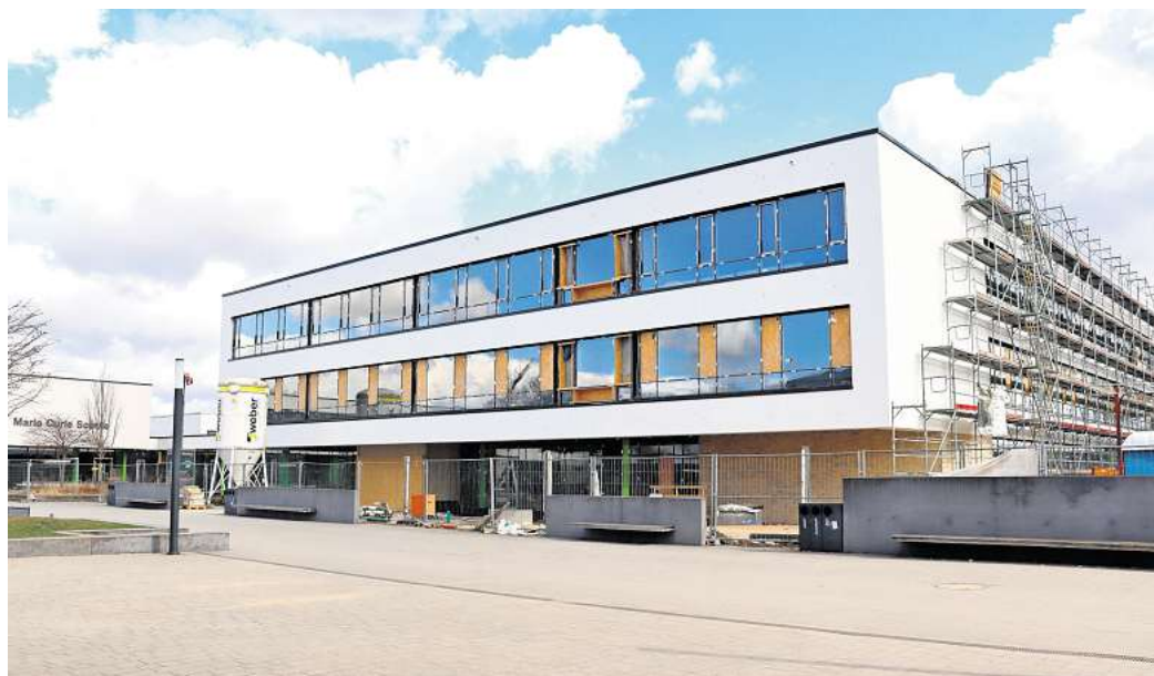
Die Arbeiten gehen in die Endphase: Im Erweiterungsanbau der für die fünften und sechsten Klassen laufen zurzeit die Arbeiten für den Innenausbau.

Mit den Umzugsplänen sind verschiedene Ziele verbunden: Einerseits sollen alle KGS-Jahrgänge an einem Standort in Empelde vereint werden – auch, um den Lehrkräften das zeitraubende Pendeln zwischen den rund drei Kilometer entfernten Standorten zu ersparen. Andererseits soll das frei werdende Gebäude an der Straße Lange Reihe in Ronnenberg der benachbarten Grundschule zur Verfügung gestellt werden, die – auch wegen der geplanten Einführung des Ganztagsbetriebes – dringend mehr Platz benötigt. Bis es so weit ist, gibt es aber trotz des derzeit zügigen Baufortschrittes in Empelde noch viel zu tun. „Es ist ein Erweiterungsanbau mit drei Vollgeschossen“, sagt Fachbereichsleiter Schulz. Das neue Gebäude umfasse allgemeine Unterrichts- und zwei Naturwissenschaftsräume für bis zu 400 Schülerinnen und Schüler. „Der fünfte und der sechste Jahrgang sind jeweils achtzugig – zwei Klassen im