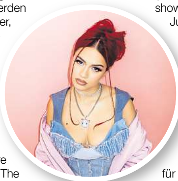
Badmómjáy ist bei der N-Joy Starshow dabei.

der Spitze der N-JOY Starshow am Samstag, 7. Juni. Zudem komplettieren Badmómjáy, Sophia, Esther Graf sowie der N-JOY Resident-DJ „Alle Farben“ das Line Up am Samstag. Tagestickets für das NDR 2 Plaza Festival am Freitag, 6. Juni, und die N-JOY Starshow sind jeweils