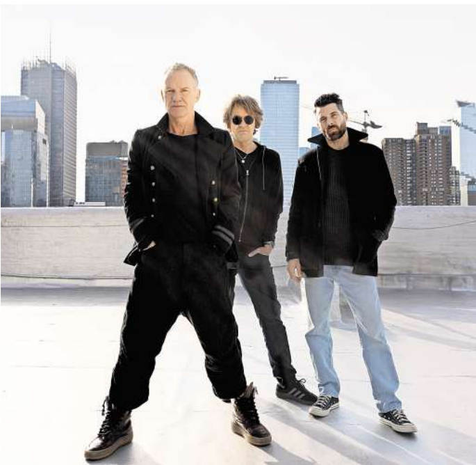
Weltstar Sting kommt zum Plaza Festival.

Das Future Bass DJ-Duo „The Chainsmokers“ und Deutschlands Superstar Ayliva stehen an