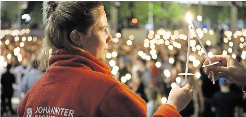
Einsatz in Hannover: Mitglieder des Johanniter-Ortsverbands Ronnenberg sind beim Kirchentag in der Landeshauptstadt als Helfende dabei.

Ronnenberger Freiwillige aus Johanniter-Ortsverband unterstützen beim Evangelischen Kirchentag in Hannover