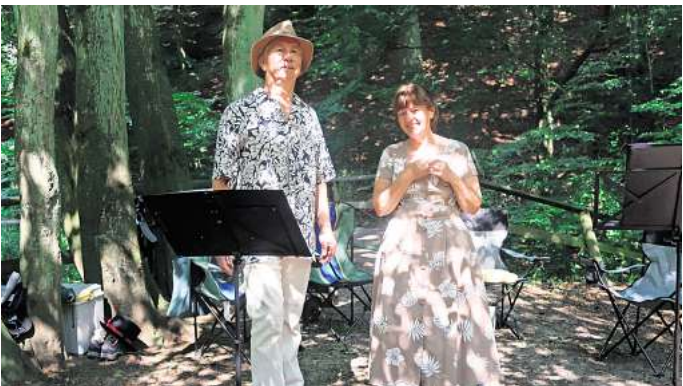
Auf Waldwanderung: Das Duo „WortReich“ geht am 1. Juni in Gehrden auf Tour.