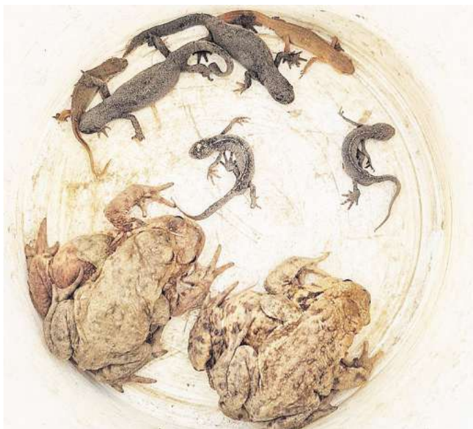
Gerettet: Helfende transportieren während des laufenden Projekts Amphibien aus den Auffangheimern an einen sicheren Ort.