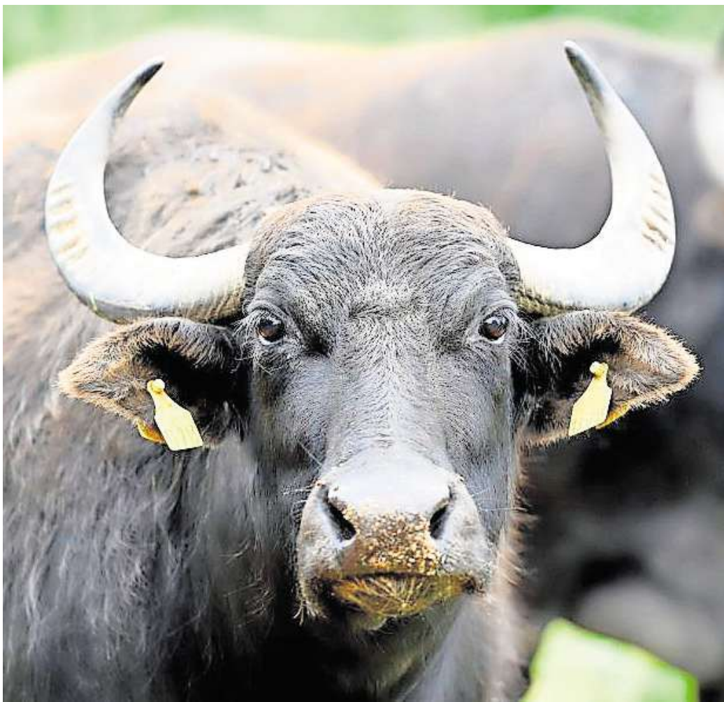
Groß, schwarz und imposant: Anfang Mai beziehen die Wasserbüffel wieder ihr Sommerquartier zwischen Wennigsen und Sorsum.

Die Rasse der Wasserbüffel (lat. Bubalus Bubalus) kommt ursprünglich aus Asien und wurde dort zum Beispiel zum Pflügen von Reisfeldern eingesetzt. 2011 schaffte sich der landwirtschaftliche Betrieb Baumgarte die ersten Wasserbüffel an, um auf natürliche Weise die Naturschutzflächen an der Ihme zwischen Evestorf und Ihme-Roloven zu pflegen. Auf den Biotop-Wiesen an der L391 zwi-