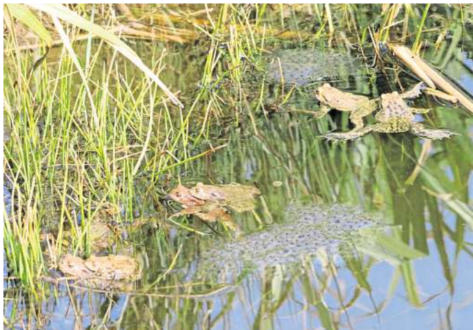
Idylle: Erdkröten fühlen sich im Raum Barsinghausen wohl.

Barsinghausen. Der NABU aus Barsinghausen zieht nach dem Ende des diesjährigen Amphibienschutzprojekts am Rehpfad Bilanz. Schülerinnen und Schüler der beiden Spalterhalsschulen und Mitglieder des NABU retteten nach eigenen Angaben mehr als 1000 Amphibien an den errichteten Krötenfangzäunen und von den Straßen. Konkret zählte der NABU 1023 Tiere. Dieses ist gegenüber dem vergangenen Jahr mit etwa 600 Tieren eine Steigerung von knapp 70 Prozent. Das zeigt auch, dass sich die beiden Hochwasserrückhaltebecken, mit zusätzlicher naturnaher Gestaltung der Umgebung, zum Amphibien-Hotspot in Barsing-