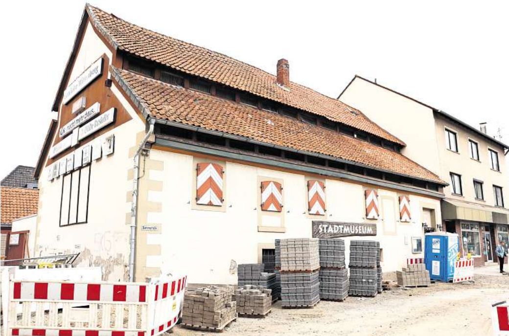
Das drittälteste Gebäude in Gehrden: Das heutige Stadtmuseum wurde 1665 nach einem Brand als Brau- und Wohnhaus neu errichtet. Seit 1975 wird dort auf zwei Etagen eine umfangreiche Dauerausstellung gezeigt.

Gehrden. Es ist ein historisches, denkmalgeschütztes Gebäude. Zugleich ist es ein fester Ort für unzählige Exponate der Heimatgeschichte. Alterserscheinungen sind auch der Grund dafür, dass das Stadtmuseum Gehrden schon seit fünf Jahren für einen regulären Betrieb geschlossen ist. Wegen erheblicher Brandschutzmängel und fehlender Barrierefreiheit darf der Heimatbund – und das auch nur auf Nachfrage – maximal Gästegruppen von sieben bis acht Personen dort empfangen. Das größte Problem: Es fehlt ein zweiter Rettungsweg. Um langfristig dem Heimatbund wieder einen Betrieb mit regulären Öffnungszeiten und für größere Gruppen zu ermöglichen, hat die Bürgerstiftung Gehrden jetzt neue Pläne zur Rettung des Museums vorgelegt. „Wir wollen gemeinsam mit dem Heimatbund das Gebäude übernehmen, sanieren und wieder mit Leben füllen“, sagt Wolfgang Middelberg aus dem Vorstand der Bürgerstiftung. Das Vorstandsmitglied ist zu einem Rundgang durch das Museum mit einer Erfolgsmeldung gekommen. Demnach liegt der Bürgerstiftung eine Zusage für einen ersten Förderzuschuss in Höhe von 25.000 Euro vor. Das Geld soll aus einem Programm der Region Hannover für die Leerstands-beseitigung fließen. Das Geld reicht jedoch nur für eine erste Maßnahme. Geplant