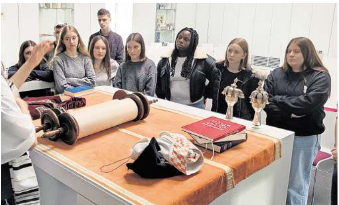
Austausch: HAG-Schüler des zehnten Jahrgangs besuchen liberale jüdische Synagoge.

Besonders beeindruckend war, als die Torarolle aus dem Toraschrein genommen und anschließend genauer angeschaut werden durfte. Die Begegnung mit gelebter Religion und der Dialog der Religionen ist ein zentrales Element des Unterrichts in