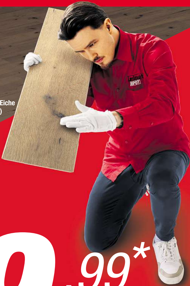
Maja Eiche (7613)

*Nur auf ausgewählte Böden bis zum 03.06.2025. Nicht kombinierbar mit anderen Aktionen. Eine Rabattierung bereits getätigter Aufträge ist nicht möglich. Abgabe nur in haushaltsüblichen Mengen bei sofortiger Mitnahme. Nur solange der Vorrat reicht.