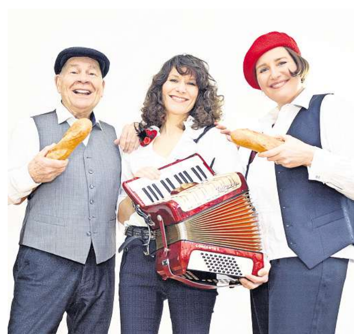
Reise in die Vergangenheit: Das Trio Nostalgie tritt am 18. Mai in Gehrden auf.

Etwa drei Viertel der 30 Kinder aus den Grundschulen und weiterführenden Schulen in Gehrden, die einen Lesepaten haben, haben einen Migrationshintergrund. „Daher ist der Bedarf auch so hoch. Denn zu Hause wird in diesen Familien oft nicht Deutsch gesprochen“, erläutert Stegemann. Vor der ersten Flüchtlingswelle im Jahr 2015 sei der Anteil von deutschstämmigen und ausländischen Kindern gleich groß gewesen, erinnert sich Büttner. In den ersten Jahren ab 2003 ging es erst für Kinder ab Klasse zwei los, mittlerweile aber schon in der Phase der Alphabetisierung im ersten Jahrgang. Auch hier gilt: Der Bedarf ist hoch.