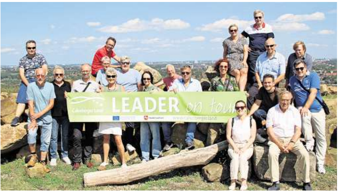
Leader-Aktionsgruppe Calenberger Land: Die Gruppe bilden die sechs Kommunen Wennigsen, Barsinghausen, Ronnenberg, Gehrden, Pattensen und Springe.

Wennigsen. Droht den Kommunen im ländlichen Raum eine viele Millionen Euro schwere Förderung wegzubrechen? Das Leader-Programm, das mit EU-Geld Projekte umsetzt, steht vor einer ungewissen Zukunft. Die Aktionsgruppe der Leader-Region Calenberger Land schlägt mit Blick auf die kommende Förderperiode der EU Alarm. Der Grund: Im Finanzplan taucht das Programm nach 2027 nicht auf. Leader? Was ist das eigentlich? Vereine, Institutionen oder auch Einzelpersonen, die eine gute Idee für ein Projekt in ihrem Ort haben, denen aber das notwendige Geld fehlt, können sich bislang um Zuschüsse aus dem gleichnamigen Programm bewerben. In der aktuellen Förderperiode sind aus dem EU-Topf bereits mehr als 3 Millionen Euro allein in die Region Calenberger Land geflossen. Dazu zählen neben Wennigsen noch Barsinghausen, Ronnenberg, Gehrden, Springe und Pattensen. Insgesamt stehen bis 2027 jährlich etwa 500.000 Euro für Projekte innerhalb dieser sechs Kommunen zur Verfügung. Doch genau diese Finanzierung steht nach 2027 auf der Kippe. „Aktuell wird in Brüssel der mehrjährige Finanzrahmen der EU diskutiert – und die ländliche Entwicklung ist dabei nicht sicher verankert“,