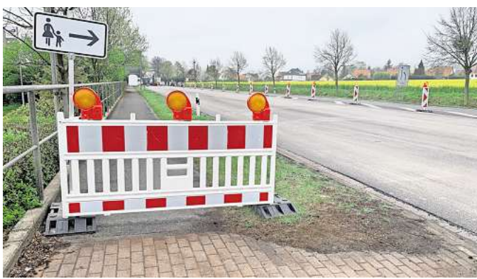
Stau auf der Umleitungsstrecke: Die B65 aus Barsinghausen in Richtung Bad Nenndorf ist derzeit wegen der Radwegsanierung gesperrt.

„Einschränkungen bei einer solch stark frequentierten Straße sind nicht zu vermeiden“, teilt die Niedersächsische Landesbehörde für Straßenbau und Verkehr auf Anfrage mit. Im Vorfeld seien umfangreiche Abstimmungen mit der Landesbehörde, der Verkehrsbehörde, der Stadt Barsinghausen, der Straßenmeiste-