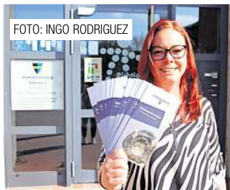
Stadt Ronnenberg startet Kampagne gegen Ratten. Seite 6