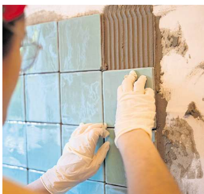
Wer die Fliesen selbst verlegen will, sollte etwa zehn Prozent Verschnitt einplanen.

senbedarf sollte man etwa zehn Prozent Verschnitt einplanen», rät Raschke-Kremer. Denn beim Zuschneiden komme es in der Regel zu Verlusten. Weiteres Material und Werkzeug einkalkulieren. Beim Fliesenlegen kommen noch Ausgaben für weiteres Material wie Kleber, Mörtel und Silikon hinzu. «Hier hängt der Preis nicht zuletzt von der Auftragsdicke ab, die je nach Fugenbreite und Fliesengröße variiert», so Christian Meyer, Redakteur bei der Zeitschrift «selbst ist der Mann». Wer die Fliesen selbst legen will, muss bedenken, dass er auch noch Werkzeug braucht - etwa Fliesenschneider, Mauerkelle und zum Anrühren der Fugenmasse einen Rührquirl an einer Bohrmaschine. Tipp: Manches Werkzeug kann man sich auch im Baumarkt ausleihen - und so Kosten sparen. Einfach