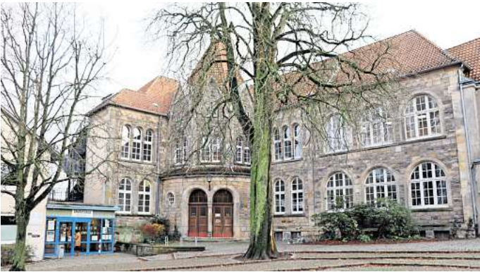
Hat bald ausgedient: Der 1908 errichtete und denkmalgeschützte Altbau der Grundschule Ronnenberg spielt im Zukunftskonzept für die Bildungseinrichtung keine Rolle mehr und soll nach umfassenden Umbauarbeiten am gesamten Standort als Schule entwidmet werden – spätestens im Jahr 2030.

In die grauen Betonbauten aus den Siebzigerjahren soll nach umfangreichen Umbauarbeiten fast der gesamte Unterrichtsbetrieb der Grundschule verlagert werden. Das sei notwendig, um in Absprache mit der Schulleitung ein Zukunftskonzept mit sogenannten Lernclustern umzusetzen, sagt Schulz. Das geplante Raumkonzept: Pro Grundschuljahrgang soll jeweils eine Etage mit vier Unterrichtsräumen zur Verfügung stehen. Was in jedem Geschoss noch dazu kommt: „Für jeweils zwei Klassen werden Differenzierungsräume mit einem dahinterliegenden Ma-