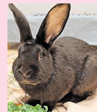
Langweilt sich derzeit: Kaninchen Ernesto.

Weitere Informationen gibt es unter der Hotline (05105) 7736777.