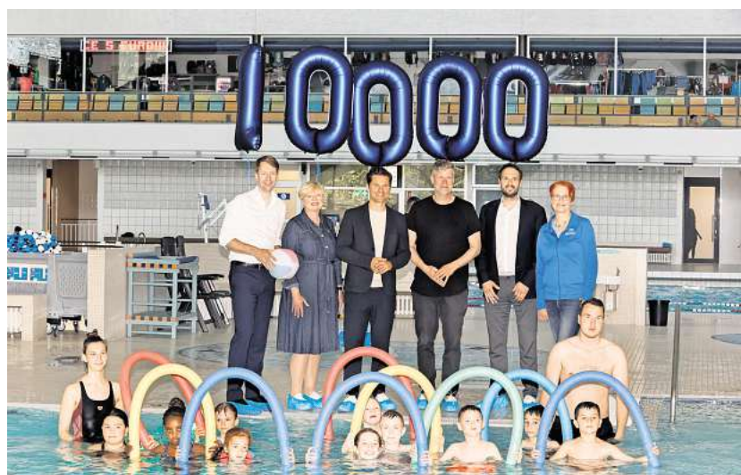
10.000 Kinder haben das Schwimmen erlernt. Die Schwimmoffensive geht weiter.

➤ aktion.neuepresse.de/umfrage/npschwimmsommer2025 .