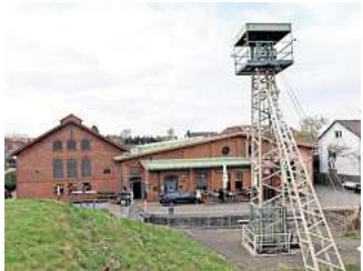
Frischzellenkur für einen Touristenmagnet: Das Besucherbergwerk und sein Museum sollen fit für die Zukunft gemacht werden.

„Wir sehen erstmal vielmehr eine unglaublich liebevolle Sammlung an Reliquien, als ein Museum“, fasst Ecke seinen ersten Eindruck zusammen. Nach den Worten von Wilfried Klatt und Hans-Werner Röth, den bei-