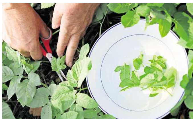
Vom Garten in die Küche: Giersch kann zum Beispiel als Zutat in Suppen oder als Pesto verwendet werden.

nesseln etwa dienen Schmetterlingsraupen als Futterquelle. Löwenzahn ist laut Nabu Berlin einer der ersten Frühblüher im Jahr: Wildbienen und Hummeln finden hier Pollen. Andere Wildkräuter sind sogar überlebenswichtig, da sie von bestimmten Arten bevorzugt werden. So braucht die Spalhornbiene Ackerwinde und die Natterkopf-Mauerbiene mag getreu ihrem Namen ausschließlich Natterkopf. Was tun mit dem «Unkraut»? Tätig werden sollte man erst, wenn die Wildkräuter Kulturpflanzen verdrängen. Da-