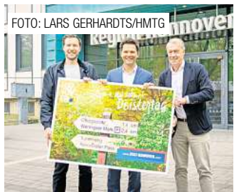
Sechs Kommunen laden zum 16. Deistertag. Seite 11