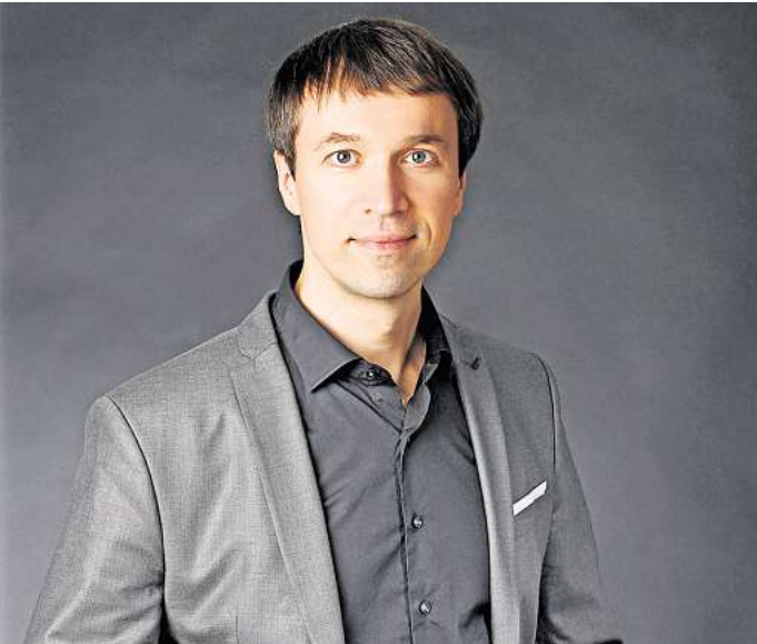
Spielt in Gehrden: der Pianist Slawomir Saranok.