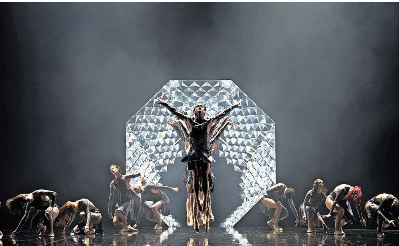
Das Staatsballett Hannover zeigt „Ikarus“.

Dieses Jahr gastiert Marcos Morau, Choreograf des Jahres 2023, mit seiner Compagnie La Veronal auf der großen Bühne. Der Stückname „Sonoma“ fin-det sich in keinem Wörterbuch. Er ist eine Neuschöpfung aus dem griechischen „Soma“ für Körper und dem lateinischen „Sonum“ für Klang. „Sonoma“ entführt das Publikum in ein imaginäres Filmstudio. Inspi-