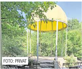
Trauungen unter freiem Himmel in Ronnenberg. Seite 6