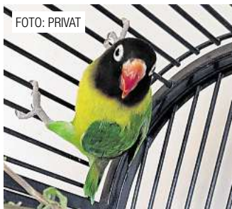
Papagei sucht neues Zuhause. Seite 4