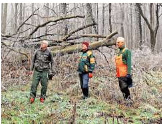
Beklagen im Ronnenberger Holz ein fortschreitendes Eschensterben: Die Mitglieder des Nabu treffen sich regelmäßig in dem Waldgebiet zwischen Ronnenberg und Ihme-Roloven, um die umgestürzten Bäume aus dem Waldgebiet zu entfernen und zu Brennholz zu verarbeiten.

Was für heute auf dem Programm steht: „Wir müssen die umgestürzten Bäume von der Grünfläche entfernen und das Totholz verarbeiten“, berichtet er. Das Eschensterben werde – nicht nur in Ronnenberg – von einem Pilzbefall hervorgerufen. „Hymenoscyphus fraxineus“ – das sei der Name eines soge-