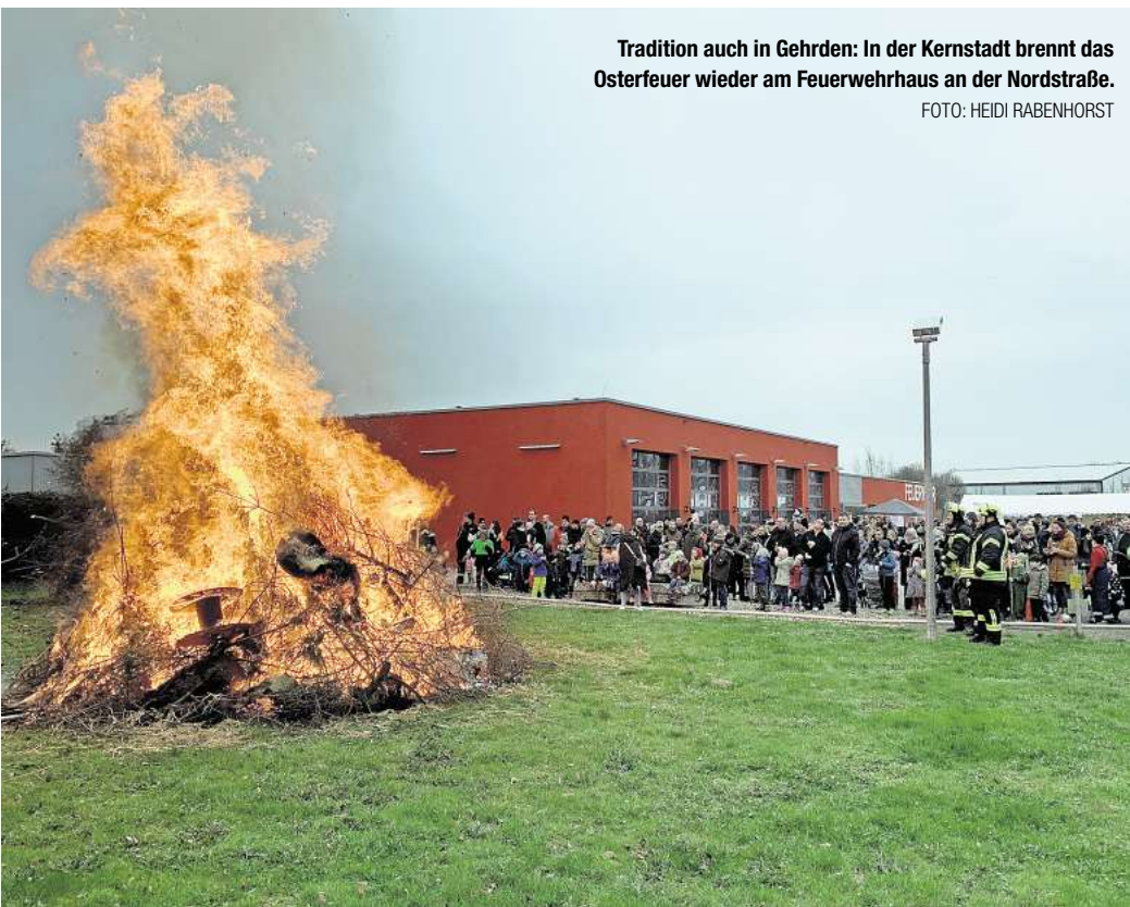
Tradition auch in Gehrdens: In der Kernstadt brennt das Osterfeuer wieder am Feuerwehrhaus an der Nordstraße.