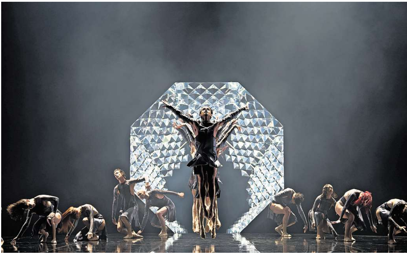
Das Staatsballett Hannover zeigt „Ikarus“.

Dieses Jahr gastiert Marcos Morau, Choreograf des Jahres 2023, mit seiner Compagnie La Veronal auf der großen Bühne. Der Stückname „Sonoma“ findet sich in keinem Wörterbuch. Er ist eine Neuschöpfung aus dem griechischen „Soma“ für Körper und dem lateinischen „Sonum“ für Klang. „Sonoma“ entführt das Publikum in ein imaginäres Filmstudio. Inspi-