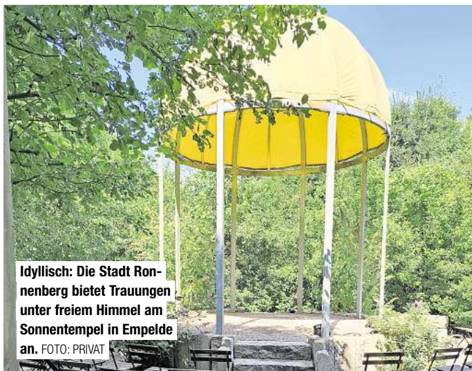
Idyllisch: Die Stadt Ronnenberg bietet Trauungen unter freiem Himmel am Sonnentempel in Empelde an.