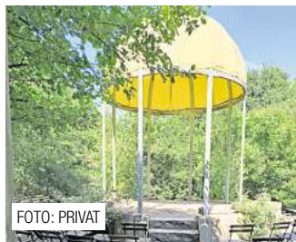
Trauungen unter freiem Himmel in Ronnenberg. Seite 6