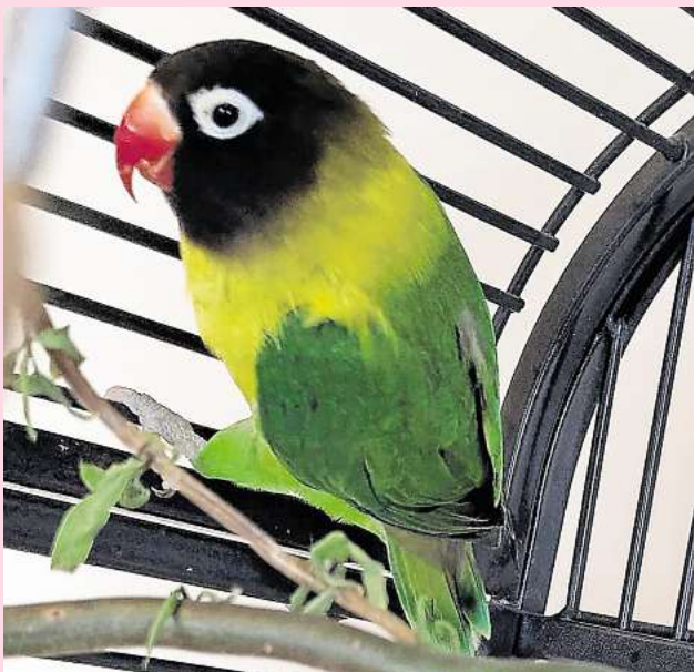
Sucht ein Zuhause mit möglichst großer Voliere: der Papagei, dessen Geschlecht noch nicht feststeht.

Interessenten können sich ab sofort melden unter der Hotline (05105) 7736777.