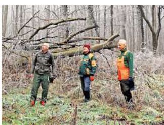
Beklagen im Ronnenberger Holz ein fortschreitendes Eschensterben: Die Mitglieder des Nabu treffen sich regelmäßig in dem Waldgebiet zwischen Ronnenberg und Ihme-Roloven, um die umgestürzten Bäume aus dem Waldgebiet zu entfernen und zu Brennholz zu verarbeiten.

„Hymenoscyphus fraxineus“ – das sei der Name eines soge-