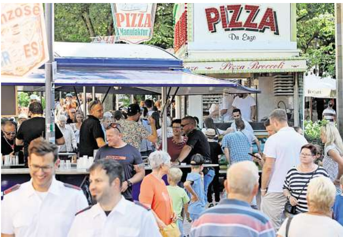
Musik, Rummel, Leute treffen: So ausgelassen feiern die Menschen das 52. Barsinghäuser Stadtfest.

Etwas komplizierter sieht es angesichts der zahlreichen Baustellen im Sommer aus. Zum einen ist der Neubau der Wilhelm-Stedler-Schule in vollem Gange, aber auch die Sanierungsarbeiten des Innenstadtrings und am Ziegenteich sollen zu der Zeit laufen. Das hat Folgen. „Hinter dem Rathaus wird es in diesem Jahr keine Bühne geben und auch das Kinderfest kann dort nicht stattfinden“, sagt Sander. Die Bühne entfalle ersatzlos, das Kinderfest hingegen findet in diesem Jahr auf der Wiese zwischen Thie und Volkers Hof statt.