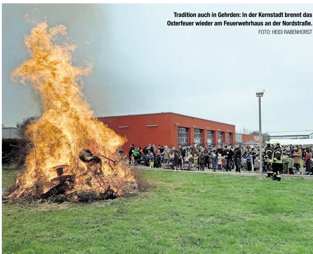
Tradition auch in Gehrdens: In der Kernstadt brennt das Osterfeuer wieder am Feuerwehrhaus an der Nordstraße.

Zum Feuer in Gehrdens dürften wie schon in den vergangenen Jahren wieder die meisten Besucher auf das Feuerwehrareal an der Nordstraße strömen. „Das Gelände bietet sich dafür an, wir haben die Fläche. Die Leute nehmen es gut an“, sagt Fricke. Ein weiterer Standortvorteil: Für Regen ist man gewappnet. „Dann fahren wir einfach unsere Autos