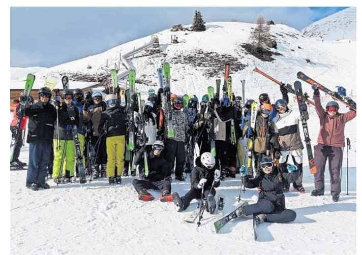
Unterwegs in Südtirol: 28 Schüler der Lisa-Tetzner-Schule begeben sich auf Skifahrt.

Der Skikurs bot neben sportlicher Herausforderung auch viel Spaß und förderte den Teamgeist. Die erfolgreiche Fahrt ist ein fester Bestandteil des außerschulischen Lernangebots der Oberschule und soll im nächsten Jahr wiederholt werden.