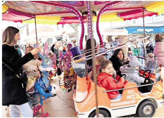
Entspanntes Shoppen für die Eltern, Spiel und Spaß für die Kids. So funktioniert der erste verkaufsoffene Sonntag.

Flanieren und schnabulieren auf dem Ostermarkt mit leckeren Gastroangeboten und mehr