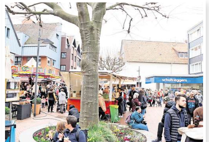
Shoppen und genießen: Der Verein „Unser Barsinghausen“ lädt zum Ostermarkt mit verkaufsoffenem Sonntag und Schlemmermeile ein.

B evor am 7. April die Osterferien in Niedersachsen beginnen und wir am 20. April das Osterfest feiern, laden am Sonntag, 30. März, die teilnehmenden Geschäfte in Barsinghausen von 13 bis 18 Uhr zum ersten verkaufsoffenen Sonntag des Jahres ein. Dank der Koordination durch den