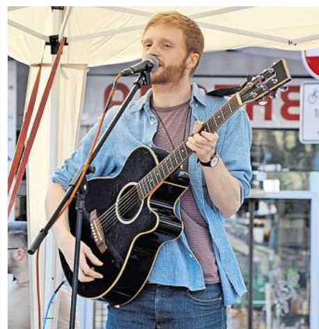
Die Musik des britischen Sängers James Naylor ist wie geschaffen für einen schönen Frühlingstag.

Der nächste verkaufsoffene Sonntag findet dann am 22. Juni unter dem Motto „Mittsommer – Das Leben ist ein Fest“ statt. Dritter und letzter Termin für einen verkaufsoffenen Sonntag ist dann der 14. September, er wird zusammen mit dem Tag der Ortsteile und dem Regionsentdeckertag veranstaltet.