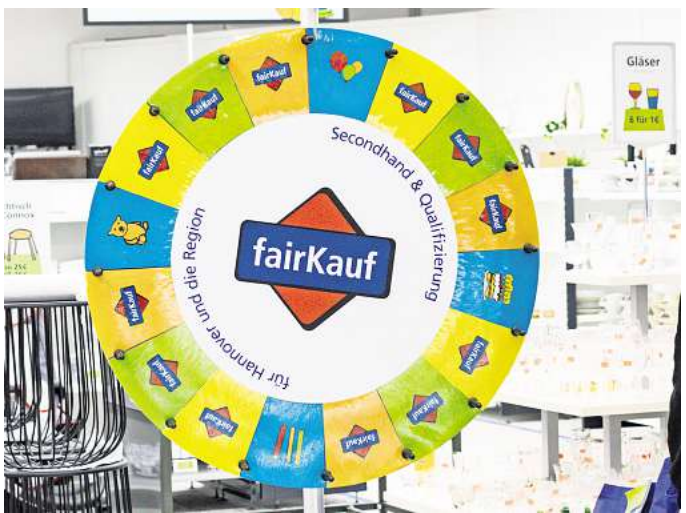
Tolle Aktion: Jede Drehung bringt die Chance auf tolle Preise.