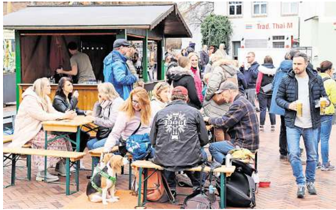
Die Mitglieder des Round Table verkaufen Hotdogs. Passend dazu kreiert die 405er Brauerei ihr Bier in mehreren Variationen.