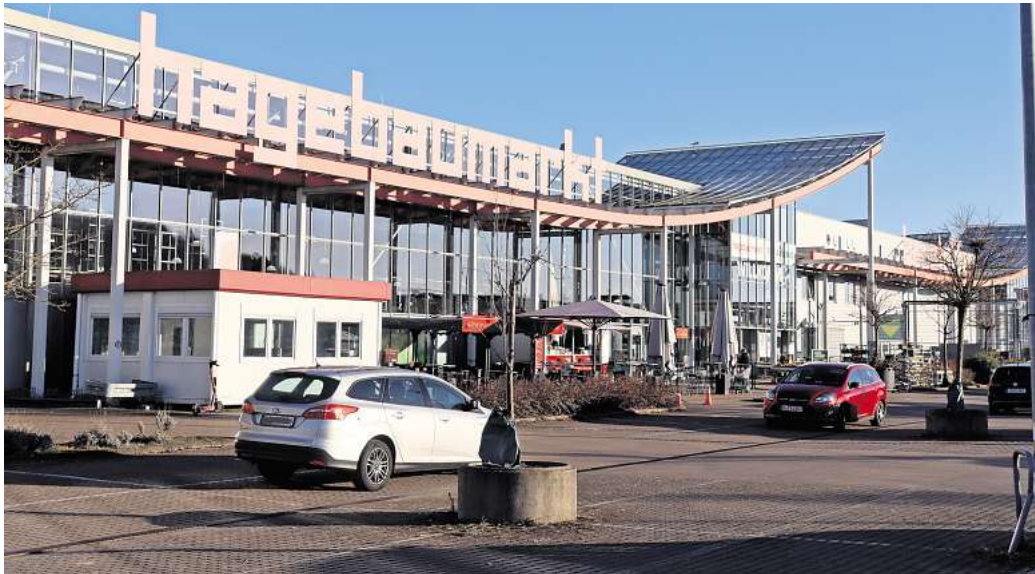
Bald ein Obi-Markt: Der Hagebau-Markt in Empelde ändert seine Markenzugehörigkeit.

Der Baumarkt wechselt zum Jahresbeginn 2026 die Marke. Einige Läden in der Region Hannover stehen vor dieser Umstellung.