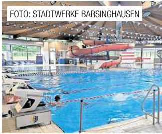
Ausschuss vertagt Entscheidung über Hallenbad-Neubau. Seite 10