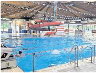
Wieder warm ums Herz: Im Deisterbad kommt der Warmbadetag (mittwochs) zurück – und mit ihm auch das beliebte Babyschwimmen.