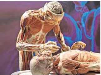
Ein Herzchirurg bei der OP.