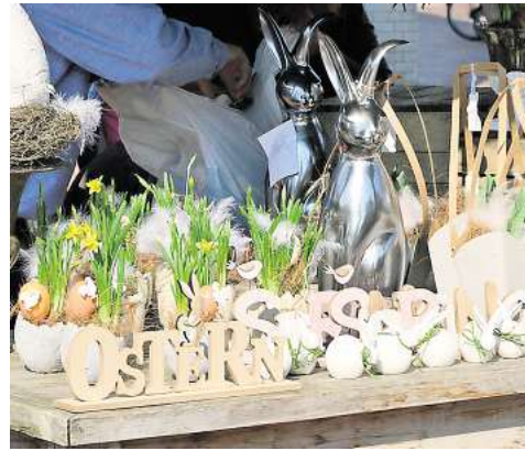
Frühlingshaftes gibt es beim verkaufsoffenen Sonntag auf dem Frühlingsmarkt zu entdecken.