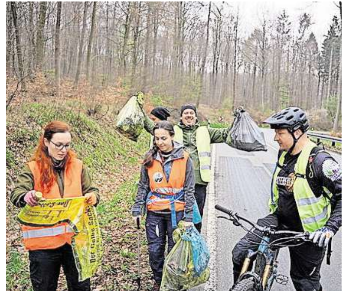
Unterwegs in der Natur: Die Deisterfreunde sammeln am 16. März wieder Müll.

Die alte Drehleiter soll am Ende ihrer offiziellen Dienstzeit versteigert werden. Vor allem Dachdecker- und Malerbetriebe hätten Interesse an solchen Fahrzeugen, meint Geestmann.