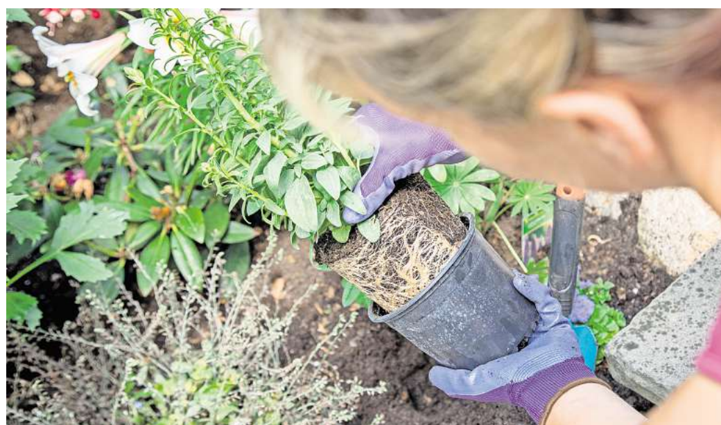
Bei Stauden wie dem Löwenmäulchen sollte man die Wurzelballen vor dem Einpflanzen wässern.