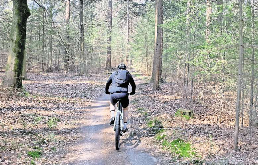
Erlaubt oder nicht? Fahrräder und Mountainbikes dürfen auf Wegen und Straßen im Wald genutzt werden. Kreuz und quer zu fahren, ist nicht erlaubt. Es denn, es ist ein speziell ausgewiesener Parcours eingerichtet.

Feld- und Forsthüter arbeiten eng mit Kommune und Polizei zusammen und sind Verwaltungsvollzugsbeamte. Das bedeutet: Nach dem niedersächsischen Gesetz über den Wald und