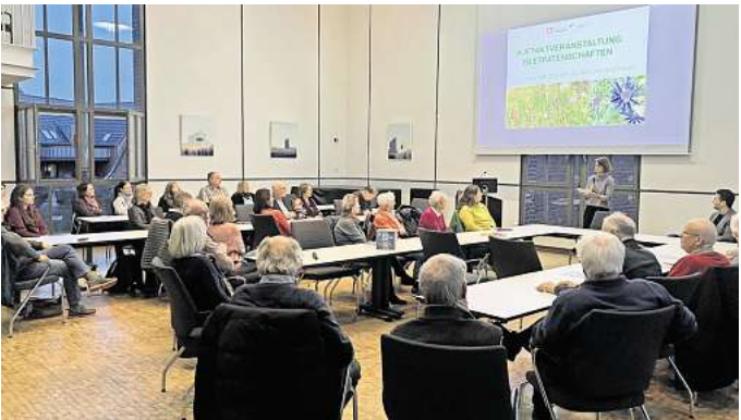
Infoabend zu Beetpatenschaften in Gehrden.