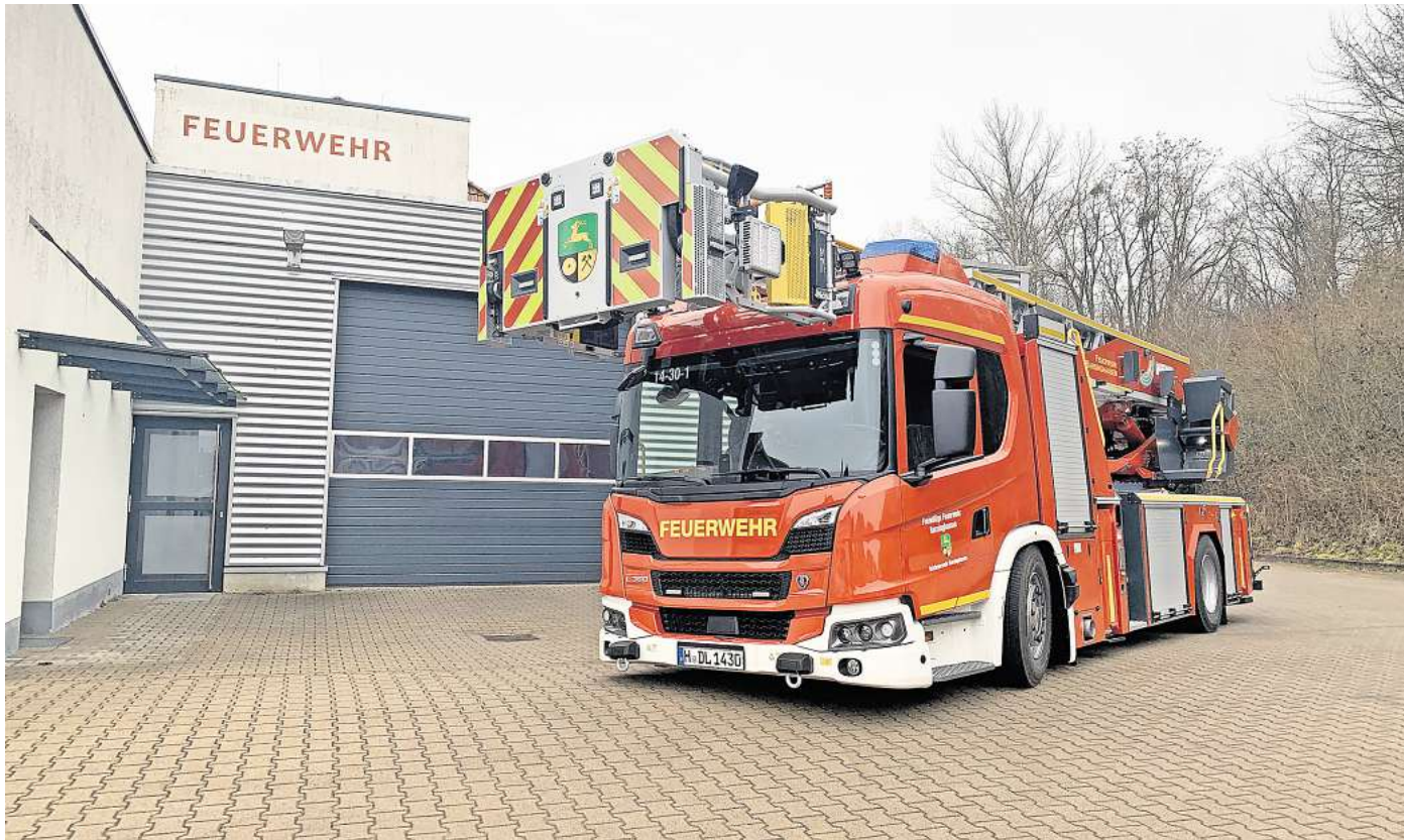
Mehr als 16 Tonnen schwer: Die Feuerwehr Barsinghausen hat eine neue Drehleiter. Offiziell in den Dienst genommen wird sie im Mai.

Das Besondere an der neuen Drehleiter ist vor allem der Korb, der direkt vor dem Führerhaus abgesetzt werden kann. „Die alte Drehleiter musste immer erst zur