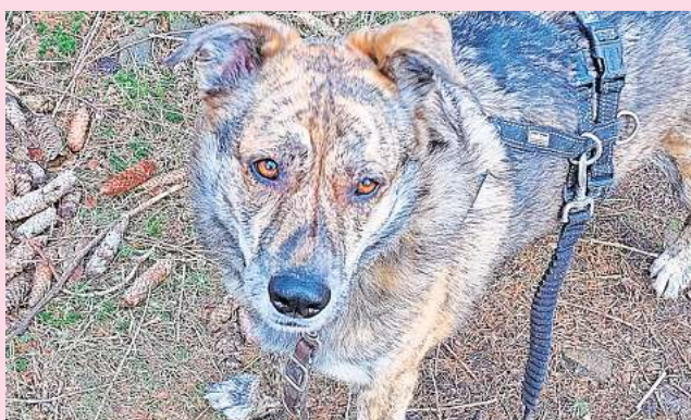
Vier Jahre alt: Die Hündin Sissi sucht ein neues Zuhause bei Menschen mit einem gewissen Hundeverstand und viel Geduld.

Wer Interesse an Sissi hat, kann sich mit dem Tierschutzverein Barsinghausen und Umgebung in Verbindung setzen. Dieser ist beheimatet an der Ludwig-Jahn-Straße 11a in Barsinghausen und ist erreichbar unter Telefon (05105) 7736777 sowie per E-Mail an info@tierschutzverein-barsinghausen.de.