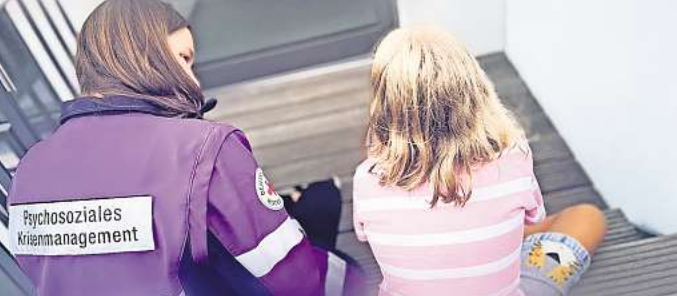
Hilfe in der Not: Das DRK hat ein Kompetenzzentrum Psychosoziales Krisenmanagement ins Leben gerufen.

Auf das Potenzial dieser starken Gemeinschaft können aber nicht nur Rotkreuz-Mitarbeitende für sich und ihre Familien zurückgreifen. Es gibt mittlerweile Kooperationsverträge beispielsweise mit Behörden, die ihren Mitarbeitenden auf diese Weise eine kompetente Krisenintervention anbieten können. Bedarf und Nachfrage steigen, weitere Ehrenamtliche sind daher sehr willkommen. Interessierte wie Hilfesuchende können sich jederzeit unter Telefon 0511 367-178745 oder per E-Mail an psnv@drk-hannover.de melden.