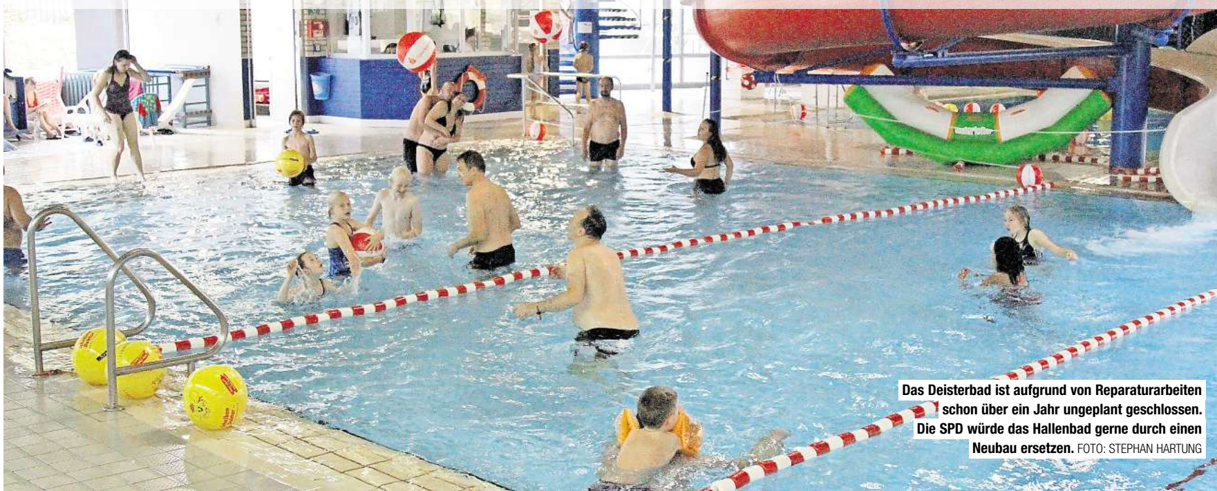
Das Deisterbad ist aufgrund von Reparaturarbeiten schon über ein Jahr ungeplant geschlossen. Die SPD würde das Hallenbad gerne durch einen Neubau ersetzen.

SPD-Fraktion will keine größeren Investitionen mehr in Deisterbad und Lehrschwimmbecken – wie entscheidet der Rat am 3. April?