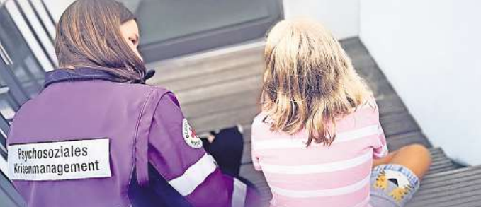
Hilfe in der Not: Das DRK hat ein Kompetenzzentrum Psychosoziales Krisenmanagement ins Leben gerufen.