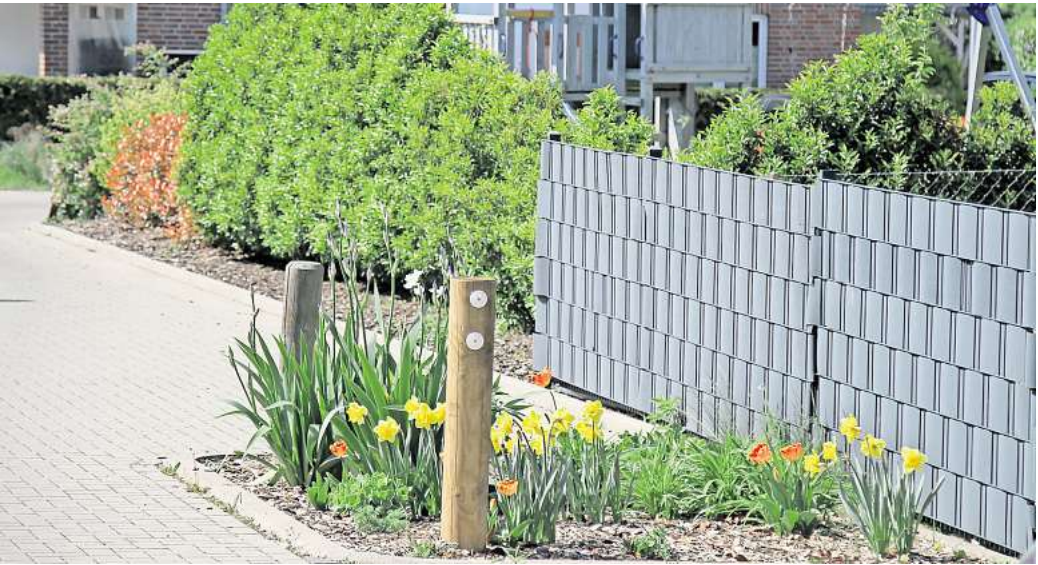
Buntes Beet: Wie hier in Northen könnte es bald auch in anderen Ortsteilen in Gehrden blühen.