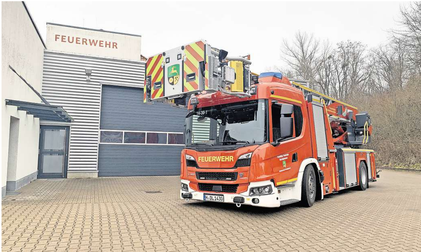
Mehr als 16 Tonnen schwer: Die Feuerwehr Barsinghausen hat eine neue Drehleiter. Offiziell in den Dienst genommen wird sie im Mai.

Das Besondere an der neuen Drehleiter ist vor allem der Korb, der direkt vor dem Führerhaus abgesetzt werden kann. „Die alte Drehleiter musste immer erst zur