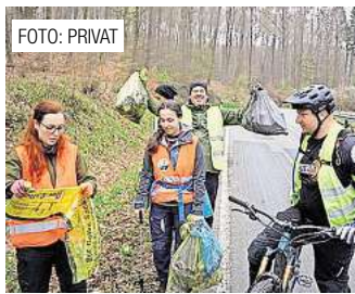
Die Deisterfreunde sammeln am 16. März wieder Müll. Seite 4