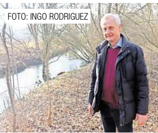
Langjähriger Nabu-Vorsitzender plant Rückzug aus dem Vorstand. Seite 6