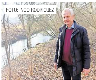
FOTO: INGO RODRIGUEZ Langjähriger Nabu-Vorsitzender plant Rückzug aus dem Vorstand. Seite 6