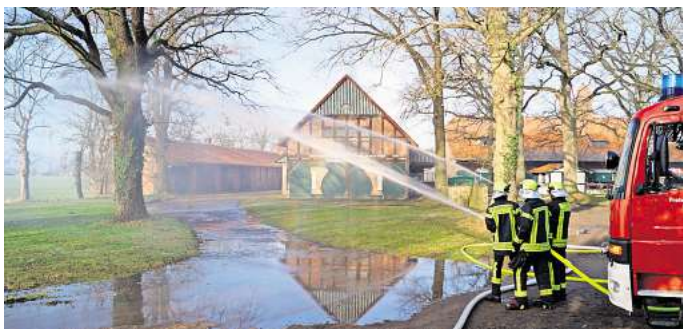
Auf dem Garbenhof in Ditterke: Feuerwehrleute üben die Brandbekämpfung.

Gehrden/Ditterke. „Rauchentwicklung aus einem Pkw auf dem Hof der Familie Garben-Mogwitz“. So lautet die Alarmierung für die rund 45 Feuerwehrleute aus Ditterke und Gehrden. Das Szenario, das sich den Einsatzkräften nach ihrem Ankommen bietet: Ein Elektroauto steht unter einem Carport und ist stark ver Raucht. Der Rauch zieht in einen Veranstaltungsraum über dem Carport, in dem sich noch Menschen befinden.