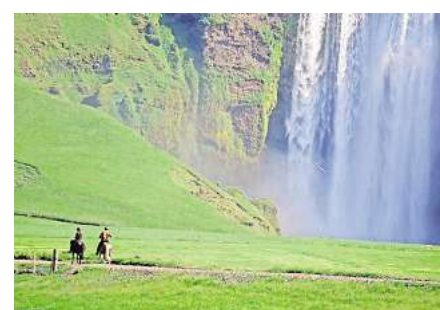
Beeindruckend: Der Wasserfall Skogafoss auf Island.