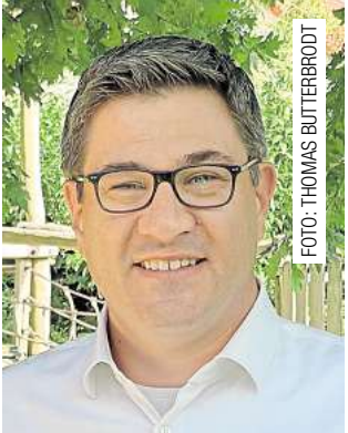
Ich werde mich weiter dafür einsetzen.