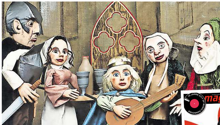
„Es lebe der König“ im Theatrio.

Das Trio Gruberich aus Oberbayern spielt am 16. März ab 10.30 Uhr im Schloss Landestrost, in Neustadt am Rübenberge das Kinder-Erzählkonzert „Die Kuh will mehr“. Dabei geht es um eine Kuh, die Gedichte schreibt und Sehnsucht nach dem Meer be-