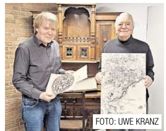
Ronnberg war wichtige Gerichts- stätte im Mittelalter.