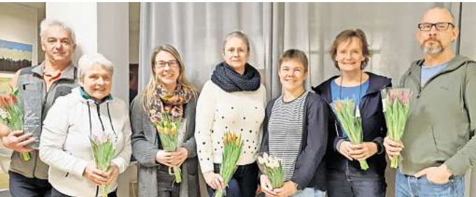
Wünschen sich weitere Spielerinnen und Spieler: der neue Spartenvorstand der Volleyballabteilung des TSV Barsinghausen.