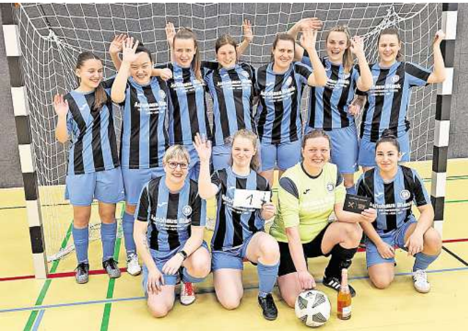
Stark gespielt: Ohne ein Gegentor zu kassieren, gewinnen die Frauen der SG Everloh-Ditterke das Turnier in Godshorn.

hierfür sind vorbereitende Erdarbeiten, die Herstellung der neuen Oberflächen in Asphalt- und Pflasterbauweise sowie das Aufstellen der neuen Straßenbeleuchtung. Eine Umleitungsstrecke über Dammstraße, Hindenburgallee, Lindenweg und Brauereiweg sowie auch in umgekehrte Richtung wird ausgeschrieben, erklärt die Stadt.