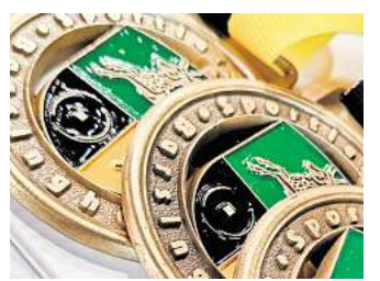
Wer bekommt die Medaillen bei der diesjährigen Sportlerehrung?

Welche Sportlerinnen und Sportler für die Sportlerehrung 2024 nominiert sind und wie die Onlineabstimmung genau funktioniert, erfährt man an diesem