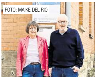
Hilfe zur Selbsthilfe bei Sucht – Gruppe 77.