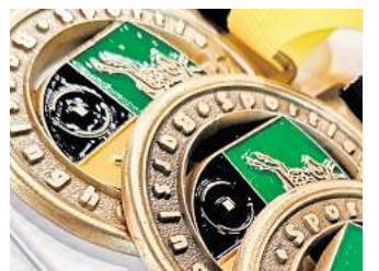
Wer bekommt die Medaillen bei der diesjährigen Sportlererhebung?

17 Einzelsportler und Mannschaften aus Barsinghausen sind nominiert