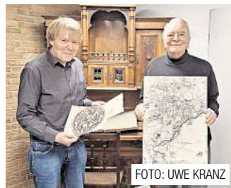
Ronnberg war wichtige Gerichts- stätte im Mittelalter.