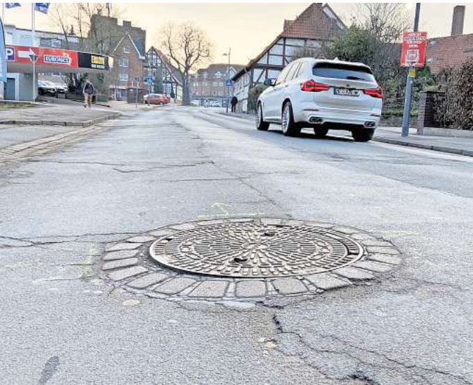
Die kaputte Rehrbrinkstraße: Der erste Bauabschnitt geht bis zur Einmündung Kaltenbornstraße, einschließlich Im Stillen Winkel.

Diese fünf Bauabschnitte gibt es: Von der Wilhelm-Hess-Straße bis Mitte der Tankstelle, von