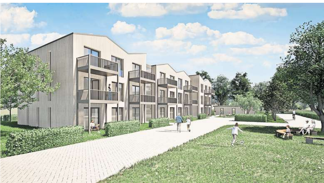
So sollen die Mehrfamilienhäuser aussehen: Die Genossenschaft Gemeingut Bredenbeck möchte 35 Wohnungen bauen, 30 davon mit sozialer Förderung.

Bredenbeck. Wohnungen sind im von Einfamilienhäusern geprägten Wennigsen rar. Der Anteil mit sozialer Förderung ist in den vergangenen Jahren zudem kontinuierlich gesunken. Entsprechend interessiert schaut die Gemeinde derzeit auf das Vorhaben der Genossenschaft Gemeingut Bredenbeck. 35 Wohnungen – davon 30 gefördert – will ein Architektenbüro mit den Mitgliedern im Neubaugebiet „Im Bergfelde“ bauen. Wie das Modell funktioniert und was die Wohnungen kosten, haben die Initiatoren jetzt vorgerechnet. Zwei Bauplätze hat das Büro K+A Architekten aus Hannover in dem Neubaugebiet reserviert. Durch den hohen Anteil der geförderten Wohnungen wollen sie das Projekt zu mehr als 70 Prozent mit zinsgünstigen Krediten der NBank stemmen. 15 Prozent Eigenanteil kommen über die Einlagen der Mitglieder zusammen.