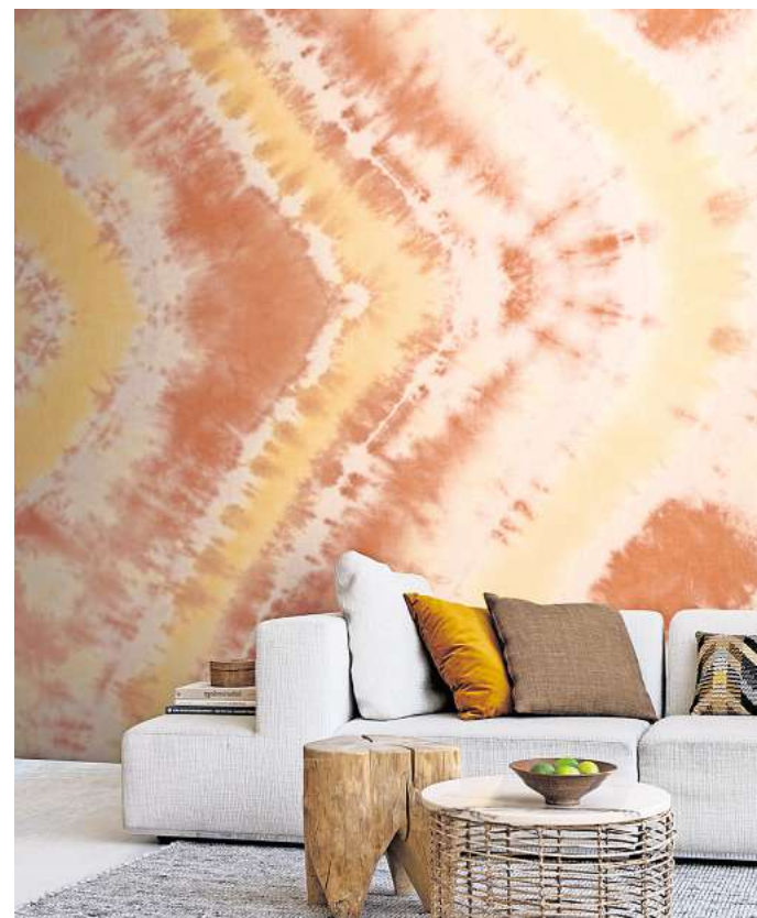
Inspiziert von der Mode, bringt der Batik-Look jetzt auch Wände zum Strahlen.

„Dennoch gibt es ein verbindendes Element: das Unfertige“, sagt Brandt. „Die Tapeten haben viele helle Flächen und scheinbar freie Stellen. Damit stehen sie im harten Kontrast zu den satten Blautönen, die uni die gesamte Fläche ausfüllen.“