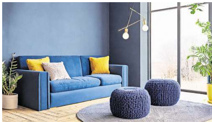
Mut zur Farbe: Dunkelblaue Wände und ein passendes Sofa schaffen eine gemütliche Atmosphäre und laden zum Entspannen ein.

Tapeten 2025: Womit Sie die Trends am besten kombinieren