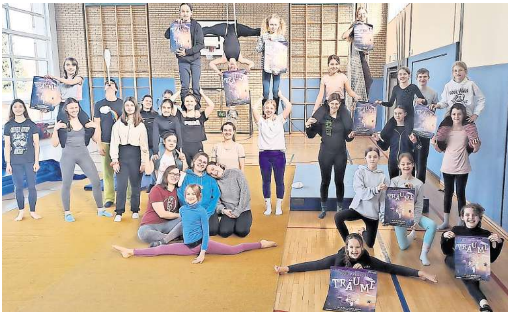
Es wird die 25. Gala: Die jungen Künstlerinnen und Künstler des Kinder- und Jugendcircus laden ein, mit ihnen in die Welt der Träume zu reisen.

Barsinghausen. „Träume“ – so heißt die neue Gala, für die der Kinder- und Jugendcircus Barsinghausen (KiJuCiBa) gerade intensiv probt. Am 15. und 16. März ist es so weit. An dem Wochenende zeigen etwa 65 Akrobaten aus der Hauptgruppe des Zirkus und die Minis ihr neues abendfüllendes Programm. Die Show im Schulzentrum Am Spalterhals beginnt am Sonnabend um 18 Uhr und am Sonntag um 14.30 Uhr. Träume. Wir alle erleben sie und befinden uns plötzlich in einer Welt, die nicht bloß reine Fantasie ist. Im Traum scheint alles möglich. Doch was ist, wenn Alpträume die schönen Träume verdrängen und man sich plötzlich allein seinen größten Ängsten stellen muss? Ob hoch oben in der Luft, am Boden in kunstvollen Bewegungen oder mit verblüffenden Tricks: Die jungen Künstlerinnen und Künstler des Kinder- und Jugendcircus wollen die Besucherinnen und Besucher mitnehmen auf eine Reise in die Welt der Träume. Tolle Botschaft: Die Zuschauer erleben in einer Show aus Artistik, Theater, Tanz und Akrobatik, wie man mithilfe von Träumen über sich hinauswachsen kann, wie man stärker werden und Ängste besiegen kann.