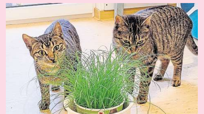
Möchten gerne in ein neues Zuhause ziehen: Die Katzenkinder Feliz und Noel samt Mutter Merry.

Interessenten melden sich über die Hotline des Tierschutzvereins Barsinghausen und Umgebung unter (05105) 7736777.