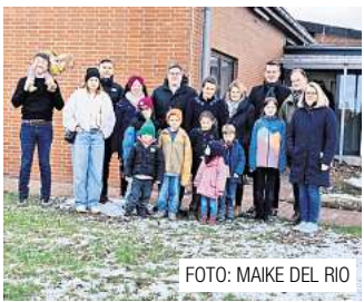
Argestorfer suchen geeignetes Grundstück für Spielplatz. Seite 11