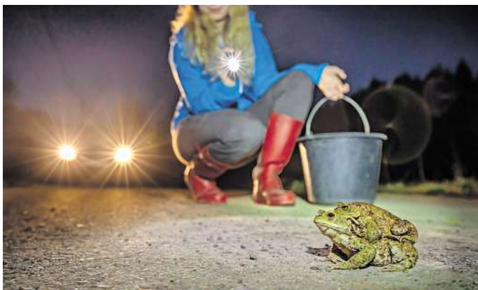
Hilfe bei Amphibienwanderung: Der NABU bittet um Rücksicht gegenüber kleinen Lebewesen im Straßenverkehr.

Auch ehemals häufige Arten wie Erdkröte oder Grasfrosch sind in den letzten Jahren deutlich in ihren Beständen zurückgegangen. Gründe dafür sind die