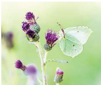
Müssen sich an neue klimatische Bedingungen anpassen: Dabei gelten Zitronenfalter als besondere Überlebenskünstler.

NABU: Niedersachsens Schmetterlinge müssen sich an neue Bedingungen anpassen – dabei kann der Mensch helfen