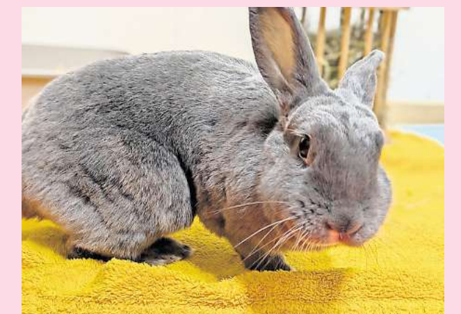
Nur im Doppelpack mit Hans zu bekommen: Kaninchendame Sunny.

Wer möchte dieses süße Kaninchenpaar einmal kennenlernen? Interessierte wenden sich an den Tierschutzverein unter der Hotline (05105) 7736777.