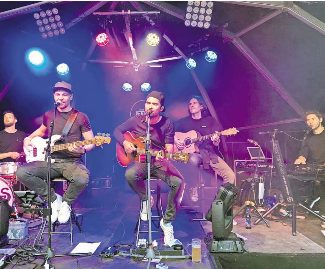
Die Jetlags rocken die Waldbühne am Gehrdener Berg.