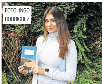
Gehrdener Autorin berichtet von ihrer Flucht aus Afghanistan. Seite 3