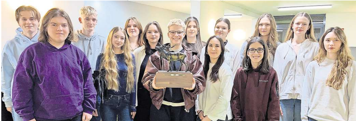
Ausgezeichnet: Der „Barsinghäuser Hirsch“ 2024 geht an die Gruppe „JU want – Jupa Basche“. Die Jugendlichen bereiten gerade ein Jugendparlament für Barsinghausen vor.

Die Gewinner machen sich für ein neues Jugendparlament in Barsinghausen bis zur Kommunalwahl 2026 stark