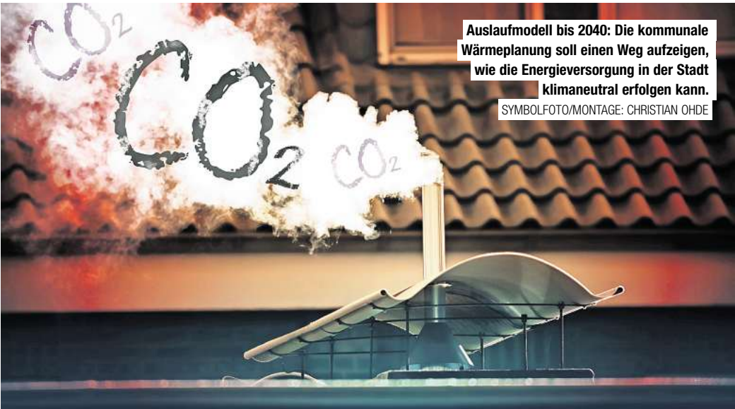
Auslaufmodell bis 2040: Die kommunale Wärmeplanung soll einen Weg aufzeigen, wie die Energieversorgung in der Stadt klimaneutral erfolgen kann.

Grundlage für die Aufstellung der Wärmeplanung sind Bestands- und Potenzialanalysen, die inzwischen vorliegen. Ermittelt wurden Informationen wie Gebäudecharakteristika, Baualtersklassen, Wärmebedarf und die aktuell genutzten Energieträger. Dabei griff Enercity nach eigenen Angaben auch auf Daten von Schornsteinfegern zurück.