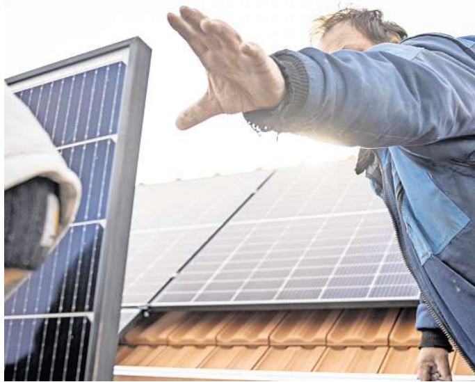
Wer die Installation einer Photovoltaik-Anlage plant, sollte sich von einem Fachbetrieb beraten lassen.