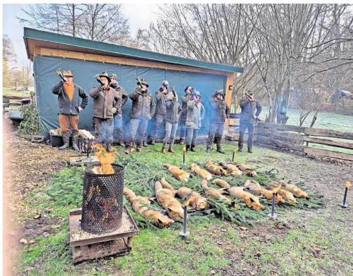
Aus Jägersicht erfolgreich: 14 Füchse erlegten die Mitglieder des Hegerings bei ihrer Jagd.

Moderne Jagd im Sinne des Artenschutzes Hegering-Mitglieder erlegen Füchse, Waschbär und Marder, damit sich heimische Tierwelt besser entwickeln kann