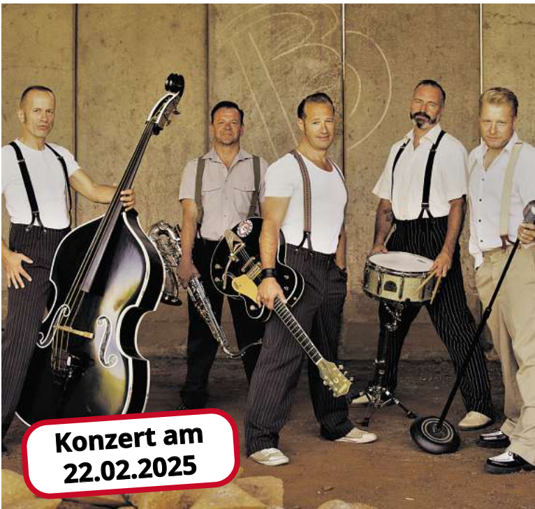
Konzert am 22.02.2025