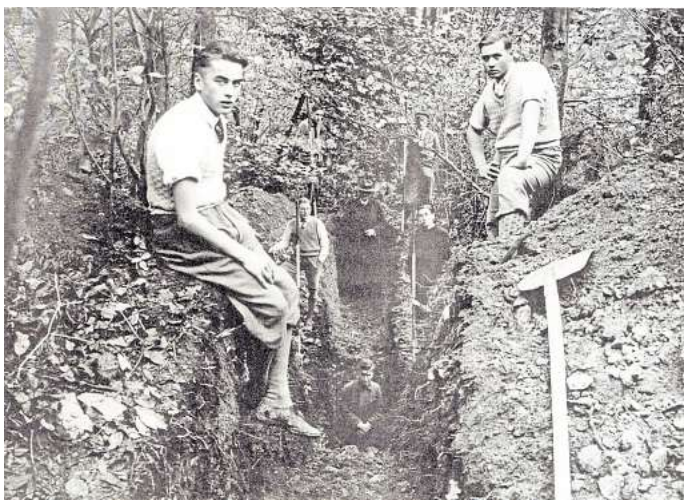
Auf der Suche: Im Jahr 1931 liefen unter der Leitung des Landesmuseums Hannover Grabungen an der Wallanlage. In der NS-Zeit wurden die Funde der Artefakte oft ideologisch ausgeschlachtet.

hätten diese Festungsbaukunst von den „Barbaren“ übernommen – und nicht umgekehrt. „Eine mutige Behauptung“, kommentieren die Autoren in ihrem Heft. Es sei wohl unbestritten, dass die Römer in ihrer Entwicklung den Germanen voraus waren. Diese Erkenntnisse nur auf Grundlage von Scherbenfunden umzustößen, sei ihres Erachtens wissenschaftlich zweifelhaft. Entdeckt wurden auf dem Burgberg in der Vergangenheit auch Werkzeuge aus Feuerstein, Pfeilspitzen aus der Jungsteinzeit und der Bronzezeit sowie eine römische Münze. Es zeigt sich, dass sich im Laufe der Jahre immer wieder Menschen an dieser Stelle aufgehalten haben. Die Zeitsätze, die Historiker zu Grunde legen, die sich mit der Wallanlage beschäftigt haben, schwanken zwischen der Zeit um Christi Geburt und dem frühen Mittelalter. Klarere Erkenntnisse ergab auch eine Grabung aus dem Jahr 2013 nicht, die Studenten der Freien Universität Berlin unternommen hatten. Eine völlig neue Situation habe sich mit dem Fund des römischen Marschlagers in Hemmingen-Wilkenburg im Jahr 2015 ergeben, sagt Hobbyhistoriker Temps. „Die in Gehrden gefundene Münze ist identisch mit denen aus Wilkenburg. Gibt es da einen Zusammenhang, oder ist das Zufall?“ Einen Zusammenhang könne man nur konst-