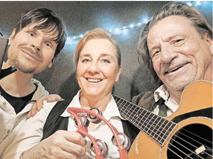
Spielt in Weetzen: die Gruppe Wiederschön.