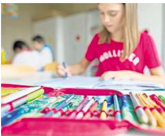
Hortbetreuung: Die Stadtverwaltung sucht nach der AWO-Kündigung nach einer Lösung für den Standort Am Castrum.