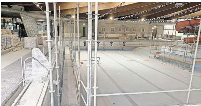
Im April soll der Betrieb wieder starten: Der Beckenkopf ist schon in großen Teilen modelliert, die übrigen Meter erfolgen in den kommenden Tagen.