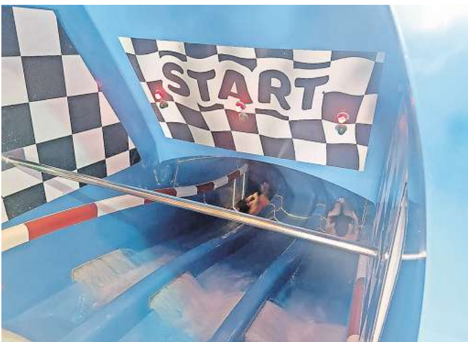
Spaß im Wasser: Jugendliche der Feuerwehren Barsinghausen genießen die Zeit im Wasserrutschenpark.

Barsinghausen. Das war mal etwas anderes: Mitglieder der Jugendfeuerwehren aus Barsinghausen unternahmen kürzlich einen Ausflug in den Wasserrutschenpark Aquamagis in Plettenberg. Bereits früh morgens trafen sich die Teilnehmenden im Feuerwehrhaus Barsinghausen, um die Verpflegung für die Hin- und Rückreise vorzubereiten und zu verstauen. Gut gelaunt startete die Gruppe mit dem Bus zur etwa zweieinhalbstündigen Fahrt ins Sauerland. Vor Ort erwartete die Jugendlichen ein abwechslungsreiches Angebot an Wasserrutschen, das sie ausgiebig testeten. Von rasanten Highspeed-Rutschen bis hin zu entspannten Wasserbahnen war für jeden Geschmack etwas dabei. Doch neben dem Spaß ging es teils auch um Zeiten und gute Noten: Die Jugendfeuerwehr Barsinghausen entschied sich, den Wettbewerb der Winter-