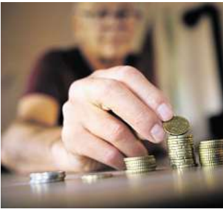
Im Vorsorge-Spezial der Neuen Presse und der Hannoverschen Allgemeinen Zeitung geht es auch um finanzielle Altersabsicherung.

Klar ist: Niemand weiß, was morgen passiert. Umso wichtiger, wenn man vorbereitet ist. Die HAZ und NP haben ein Konzept zusammengestellt, das alle notwendigen Themen verständlich