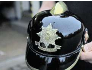
Mit Schriftzug: Auf dem Helm ist deutlich „Linderte“ zu erkennen.