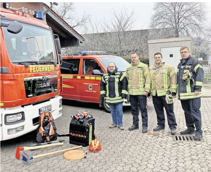
Neugründung: Fünf Kommunen des Brandschutzabschnittes II in der Region Hannover haben einen 5. Zug mit „speziellen Fähigkeiten“ gebildet. Mit dabei: Die Ortswehren aus Langreder und Winninghausen.