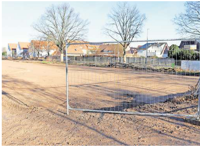
Vorboten für einen näher rückenden Baubeginn: An der Ronnenberger Straße sollen mit dem Empelder Hof zwei Mehrfamilienhäuser und eine Garagenanlage entstehen.

An der Ronnenberger Straße entsteht eine Wohnanlage mit zwei Mehrfamilienhäusern und Garagen für Wohnmobile