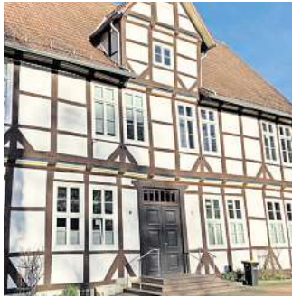
Das Rathaus I an der Bergamtstraße.

Die Rathäuser I und II sollen deutlich moderner gestaltet werden – mit offenen Raumkonzepten, die sich an sogenannten Open