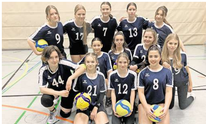
Mit Spaß und Erfolg: Nach einer längeren Pause gibt es wieder eine Volleyball-Mädchenmannschaft beim SV Gehrden.

SV Gehrden hat vier Jahre nach der Corona-Pandemie wieder ein Volleyball-Mädchenteam