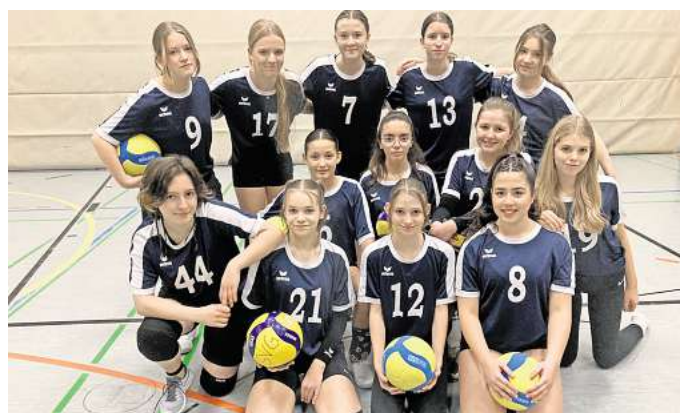
Mit Spaß und Erfolg: Nach einer längeren Pause gibt es wieder eine Volleyball-Mädchenmannschaft beim SV Gehrden.

Denn eine Mädchen-Volleyballmannschaft, die am Punktspielbetrieb teilnimmt, hat es im SVG lange nicht gegeben. „Die Corona-Zeit hat eine Delle verursacht, da haben viele Leute aufgehört“, berichtet Hungerland. Im Sommer 2022 habe eine Art Neuaufbau begonnen. „Ich wurde gefragt, ob ich die Anfängergruppe übernehmen möchte.“ Sie wollte. Zweieinhalb Jahre später und rund vier Jahre nach der Pandemie gibt es heute wieder eine Mannschaft. „Damals waren es nur fünf Anfängerinnen. Ich hätte nicht gedacht, dass es so ausartet“, sagt sie mit einem Augenzwinkern. Mittlerweile sind es 15 Mädchen. „Sie haben mich echt überrascht.“