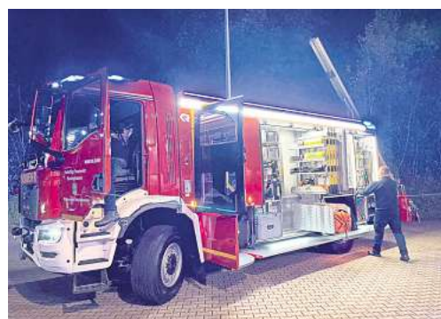
Ab sofort in Betrieb: Das neue Löschgruppenfahrzeug der Ortsfeuerwehr Barsinghausen.

Um alle mit den Neuerungen vertraut zu machen, wurde extra ein Ausbildungsprogramm ausgearbeitet, das die Ehrenamtlichen in den vergangenen zwei Monaten durchlaufen haben. Dabei ging es unter anderem um die Bedienung der Pumpe, Einweisungsfahrten und Sicherheitstraining. „Das neue Fahrzeug