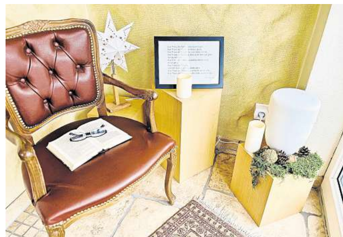
Für die Gespräche mit Trauernden nimmt sich das Team immer viel Zeit.