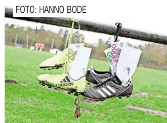
Sportförderung in Barsinghausen leicht angehoben. Seite 4