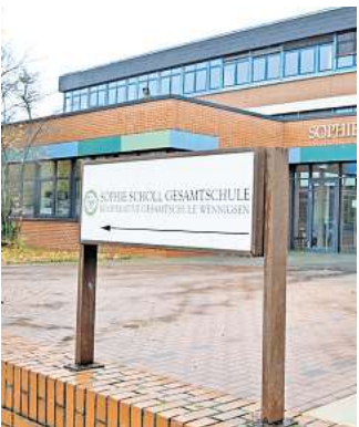
Sophie-Scholl-Gesamtschule: Zur Förderung der körperlichen Bewegung und des sozialen Miteinanders sollen die Pausenangebote verbessert werden.

Die Behördensprecherin betont aber auch: „Ein generelles Handyverbot ist rechtlich nicht zulässig.“ Außerhalb des Unterrichts, beispielsweise in Pausen, Freistunden oder während der Mittagspause, könne die Nutzung der Geräte gar nicht untersagt werden, weil dies einen „Eingriff in die Persönlichkeitsrechte“ bedeuten würde. Auf dem Schulhof könnte man allenfalls über Handyzonen nachdenken, so Trogisch. Inzwischen hat das RLSB Hannover als zuständige Behörde die KGS auch darauf hingewiesen, dass die Regel mindestens so abzuändern sei,