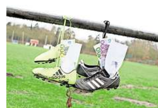
Geld für den Sport: Der Sportring in Barsinghausen hatte 330.000 Euro an Sportförderung beantragt, per Ratsbeschluss gibt es in den nächsten zwei Jahren nur 230.000 Euro.

Bei der Sportförderung handelt es sich um eine freiwillige Leistung der Stadt, die nicht erbracht werden muss. Sport und Bewegung seien jedoch unverzichtbar für Lebensqualität und Zusammenleben, sagt Kuban. So können Sportvereine unter anderem die körperliche Gesundheit fördern und sie können sozial-integrative Aufgaben ausüben, indem sie Menschen aus unterschiedlichen soziokulturellen Schichten zusammenführen.