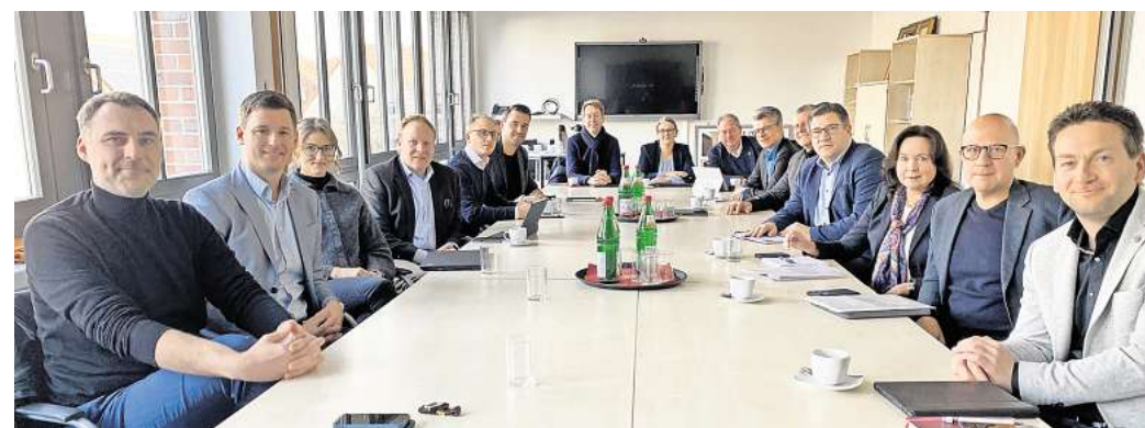
Dritte Runde in der Diskussion über das Stromterminal: Die Bürgermeister der südlichen Kommunen sitzen mit Vertretern der Politik und Tennet zusammen.

Der Hintergrund: Der Netzbetreiber Tennet hat vor, auf einer Fläche von 40 Hektar einen so-