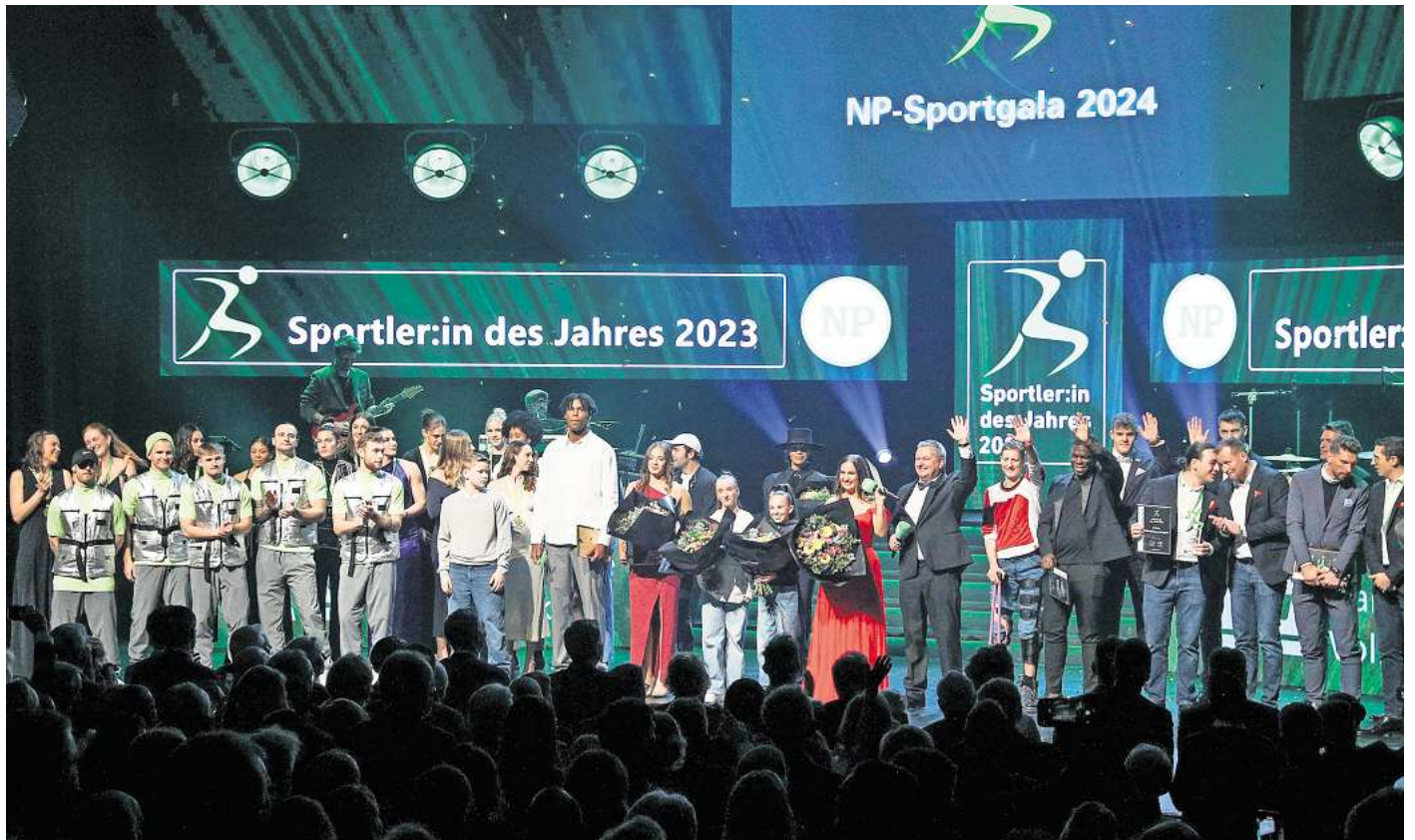
Nächste Woche haben wir ein Jubiläum: Am 28. Januar feiern wir die 30. NP-Sportgala.

Sportlegenden wie Speerwurf-Weltmeisterin Steffi Nerius, Box-Weltmeister Sven Ottke und Zehnkampf-Olympiasieger Christian Schenk waren be-