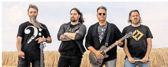
Besuch in Barsinghausen: Die Gruppe „Ocean Of Time“ ist am 25. Januar im ASB-Bahnhof zu Gast.

Es geht anschließend im Wochenrhythmus weiter: Am 1. Februar sind The Cryptex zu Gast, gefolgt von Sportfreunde Helden und der Zed Mitchell Band am 15. Februar. Boppin'B sind am 22. Februar auf der Bühne zu Gast. Am 1. März sind The Swipes zu Besuch in Barsinghausen. Alle ausführlichen Informationen zu den weiteren bevorstehenden Konzerten gibt es auf der Internetseite des ASB-Bahnhofs unter www.asb-bahnhof-barsinghausen.de .