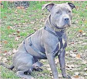
Konsequente Besitzer gesucht: Der Rüde Albert ist im pubertierenden Alter.