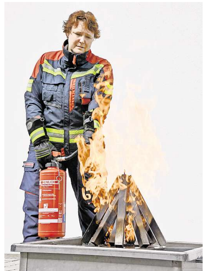
Ausbildung: Die Johanniter bieten in Ronnenberg einen Leihgang für Brandschutzhelfende in Betrieben an.

Weitere Informationen und die Lebensgeschichten der beiden Gründer sind auf der Internetseite https://crimex.social/ verfügbar.