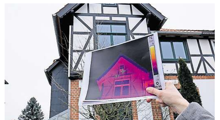
Welche Wärmeverluste gibt es: Beim Thermografiespaziergang können Hausbesitzer Genauer über die eigene Gebäudehülle erfahren.

Wer konkrete Fragen zu energieeffizientem Bauen oder Sanieren am Gebäude hat, kann einen kostenfreien Erstberatungstermin wahrnehmen. Weitere Informationen dazu gibt es im Internet unter zusammen-zukunft-empelde.de .