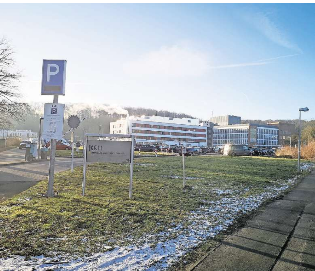
Modernisierung geplant: Das Klinikum in Gehrden erhält einen Teilneubau. Fast 250 Millionen Euro wird das kosten.