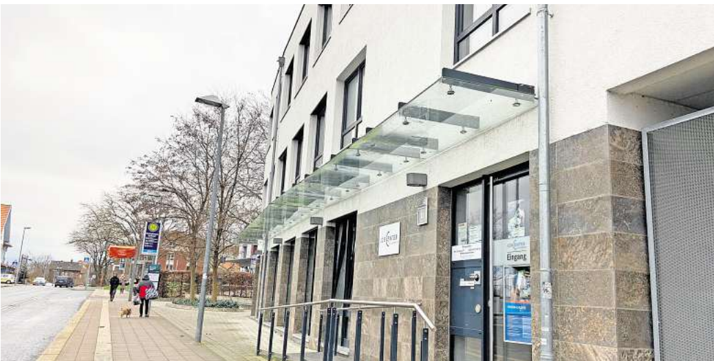
Neue Adresse: Die Agentur für Arbeit in Barsinghausen befindet sich ab sofort in der Berliner Straße 11, wo auch das Jobcenter drin ist.