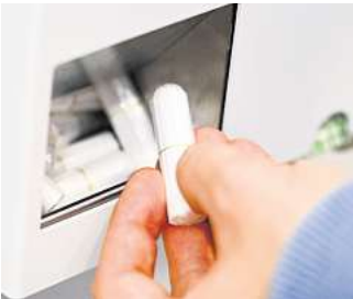
Projekt des Jugendparlaments: In Wennigsen hängen solche Spender unter anderem auf den Toiletten im Rathaus und in der KGS. Tampons und Binden darf man sich hier kostenlos herausnehmen.