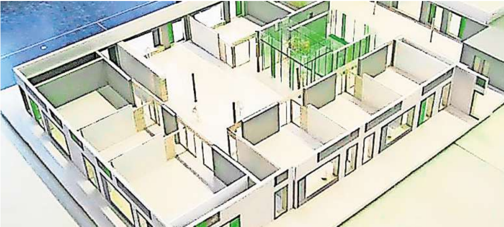
Einblick: So in etwa sieht das „Innenleben“ der künftigen Lernhäuser der Grundschule Am Castrum aus.

Das Büro h4a-architekten aus Düsseldorf hat in seiner Planung auch den erhöhten Platzbedarf für Kinder mit körperlich-motorischen Einschränkungen berücksichtigt. Die Grundschule wird weitgehend in Holzrahmenbauweise errichtet und soll nach möglichst hohen Energiestandards gebaut werden. Die zeitliche Planung ist ambitioniert: Mit dem Start des Schuljahres 2026/2027 soll das Gebäude bezugsfertig sein.