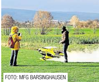
Silvesterfliegen mit Flugshow. Seite 8