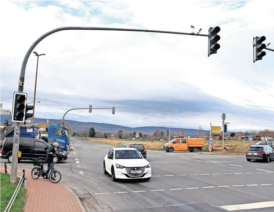
Ampelungsfall an der Möllerburgkreuzung: Hier fordert Degersens Ortsbürgermeister so schnell wie möglich eine Ersatzampel.