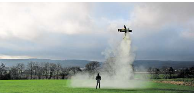
Jahresausklang: Die Mitglieder der MFG Barsinghausen lassen noch einmal ihre Modellflieger in den Himmel aufsteigen.