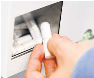
Projekt des Jugendparlaments: In Wennigsen hängen solche Spender unter anderem auf den Toiletten im Rathaus und in der KGS. Tampons und Binden darf man sich hier kostenlos herausnehmen.