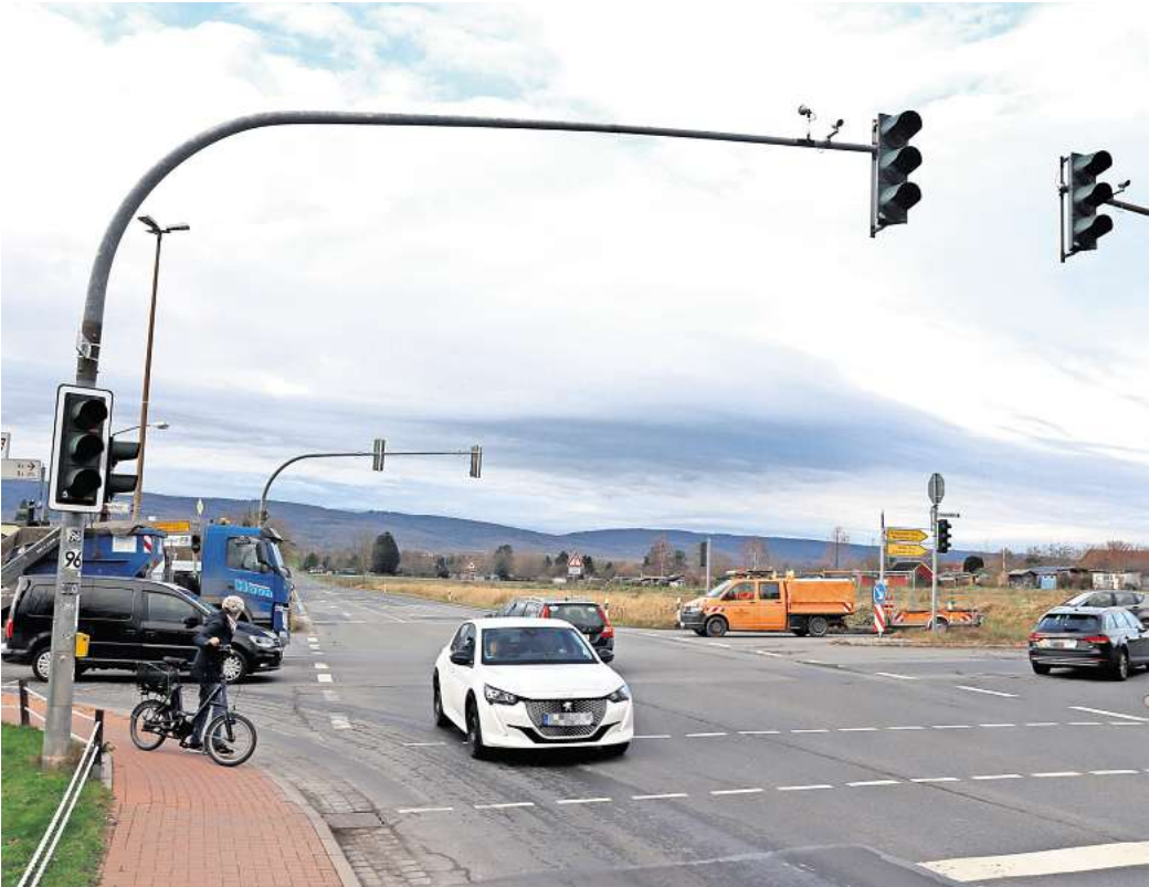
Ampelungsfall an der Möllerburgkreuzung: Hier fordert Degersens Ortsbürgermeister so schnell wie möglich eine Ersatzampel.