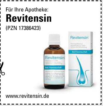
Abbildung Betroffenen nachempfunden REVITENSIN. Wirkstoffe: Acidum hydrofluoricum Dil. D12, Graphites Dil. D8, Pel. talpae Dil. D8, Selenium Dil. D12, Thallium metallicum Dil. D12. Homöopathisches Arzneimittel zur unterstützenden Behandlung bei Haarausfall. www.revitensin.de • Zu Risiken und Nebenwirkungen lesen Sie die Packungsbeilage und fragen Sie Ihre Ärztin, Ihren Arzt oder in Ihrer Apotheke. • PharmaSGP GmbH, 82166 Gräfelfing

Egal in welchem Alter oder Lebensphase: Wir Frauen stylen uns gerne, um unsere Haare in Form zu bringen. Aber wenn wir merken, dass die Haare zunehmend ausfallen , ist das erschreckend! Dabei ist uns schönes Haar doch so wichtig! Immer mehr Anwenderinnen vertrauen inzwischen auf das rezeptfreie Revitensin (Apotheke), das verschiedene Formen von Haarausfall von innen bekämpfen kann. Bei Revitensin ist keine äußere Anwendung erforderlich, sodass die Frisur nicht darunter leidet. Die natürlichen Arzneitropfen werden einfach mit einem Glas Wasser eingenommen. Neben- oder Wechselwirkungen sind nicht bekannt. Aufgrund der Wachstumsphase der Haare empfiehlt der Hersteller eine Einnahme von mindestens 12 Wochen.