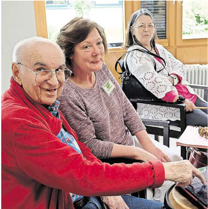
Das neue „Lebenswerk³“-Projekt startet im Frühjahr 2025

magaScene: „Lebenswerk³“-Projekt startet im Frühjahr 2025