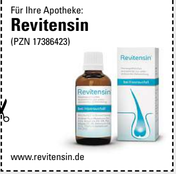
Abbildung Betroffenen nachempfunden REVITENSIN. Wirkstoffe: Acidum hydrofluoricum Dil. D12, Graphites Dil. D8, Pel. talpae Dil. D8, Selenium Dil. D12, Thallium metallicum Dil. D12. Homöopathisches Arzneimittel zur unterstützenden Behandlung bei Haarausfall. www.revitensin.de • Zu Risiken und Nebenwirkungen lesen Sie die Packungsbeilage und fragen Sie Ihre Ärztin, Ihren Arzt oder in Ihrer Apotheke. • PharmaSGP GmbH, 82166 Gräfelfing

Egal in welchem Alter oder Lebensphase: Wir Frauen stylen uns gerne, um unsere Haare in Form zu bringen. Aber wenn wir merken, dass die Haare zunehmend ausfallen , ist das erschreckend! Dabei ist uns schönes Haar doch so wichtig! Immer mehr Anwenderinnen vertrauen inzwischen auf das rezeptfreie Revitensin (Apotheke), das verschiedene Formen von Haarausfall von innen bekämpfen kann. Bei Revitensin ist keine äußere Anwendung erforderlich, sodass die Frisur nicht darunter leidet. Die natürlichen Arzneitropfen werden einfach mit einem Glas Wasser eingenommen. Neben- oder Wechselwirkungen sind nicht bekannt. Aufgrund der Wachstumsphase der Haare empfiehlt der Hersteller eine Einnahme von mindestens 12 Wochen.