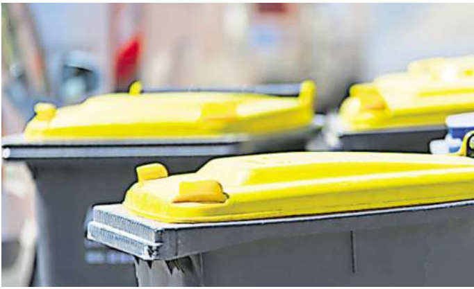
Gelber Sack ist Geschichte: Im neuen Jahr 2025 wird in Barsinghausen die Gelbe Tonne abgeholt.

Zwischen Hannover Hbf und Barsinghausen verkehren die Züge der Linie S21 bereits ab