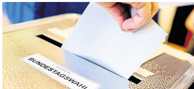
Am 23. Februar 2025 wird gewählt: Berlins Landeswahlleiter Stephan Bröckler hält die Stimmabgabe an der Wahlurne für die sicherste Alternative.

der Kirchstraße 5. Vor Ort gibt es Secondhand-Kleidung für Kinder, Spielzeug und eine Cafeteria mit Kuchen. Das Ende ist für 16.30 Uhr vorgesehen.