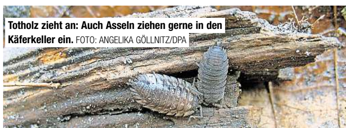
Totholz zieht an: Auch Asseln ziehen gerne in den Käferkeller ein.

Gemeinsam mit einer Gruppe von Kindern der integrativen Kindertagesstätte Lummerland in Ronnenberg, hat Plaumann eine Käferburg gebaut und die Einfachheit des Aufbaus erklärt. Grundlage ist zunächst ein Käferkeller – eine etwa 50 Zentimeter tiefe Grube. In diese wird das Holz entweder schräg eingelegt oder senkrecht gestellt. Linu, Li-