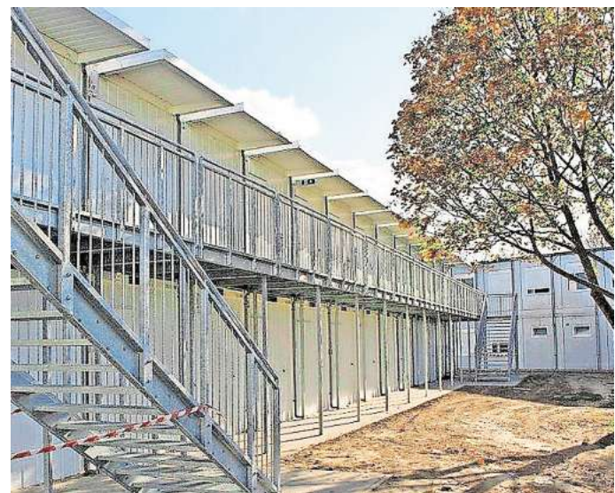
Unterkunft für Geflüchtete: Am Bünteweg steht Menschen, die aus Kriegs- und Krisengebieten nach Gehrden kommen, ein Wohnkomplex zur Verfügung. Dort gibt es kaum noch Platz für Neuzugewandene.

Bereits entschieden ist, dass ein Haus im Gehrden Ortsteil Redderse an der Wiesenstraße von der Stadt gekauft wird. Auf diesem Grundstück befinden sich zwei freie Wohnungen, die perspektivisch für die Unterbringung von Geflüchteten genutzt werden sollen. Auch am Suenser Weg/Ecke Sorsumer Straße wird die Stadt für etwa 350.000 Euro ein Haus mit drei Wohnungen er-