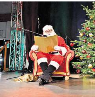
Liest vor: der Weihnachtsmann.