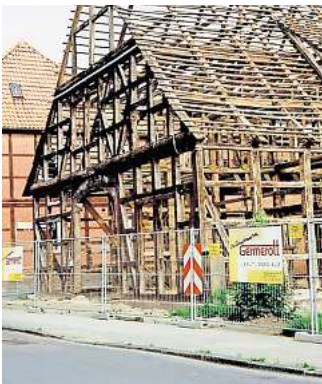
Thema im 73. Gelben Heft: Das in den Neunzigerjahren sanierte Vierständerhaus an der Kirchstraße.

Beim Einmarsch der US-Armee in Gehrden im April 1945 sollen keine Schüsse gefallen sein, weil sich der damalige Bürgermeister Ottomar von Reden persönlich dafür eingesetzt haben soll, dass deutsche Soldaten die Stadt nicht mehr verteidigen. „Ottomar von Reden holte den deutschen Militärbefehlshaber zu einer geheimen nächtlichen Besprechung in die Franz-