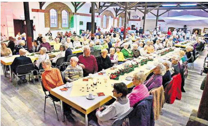
Gemütliches Ambiente: Die große Seniorenweihnachtsfeier des ASB im Zechensaal war wieder ein voller Erfolg.

250 Senioren sind bei der Weihnachtsfeier im Zechensaal dabei