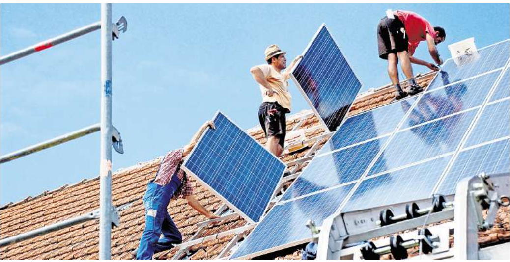
Solaranlagen auf dem Dach: Dank verschiedener Maßnahmen hat die Stadt Gehrden hinsichtlich einer möglichen Reduktion der Treibhausgasemissionen bereits eine Vorreiterrolle in der Region Hannover inne.

Die Stadt Gehrden habe bereits einen Antrag zum sogenannten Vorreiterkonzept gestellt, das derzeit in Planung sei, berichtete zur Bonsen. Deshalb habe die Studie auch einen großen Bezug zur Burgbergstadt. Zum Vorreiterkonzept als Fortschreibung und Aktualisierung des Klimaschutz-Aktionsprogramms zählt auch die kommunale Wärmeplanung, die aufzeigt, wie Gebäude klimafreundlich mit Wärme versorgt werden könnten. Das Ziel: Das Stadtgebiet von Gehrden soll zum Jahr 2035 bei den Treibhausgasemissionen die Klimaneutralität erreichen.