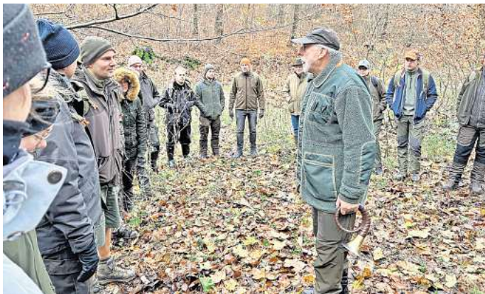
Unterwegs in der Natur: Beim Jägerkurs sind die Teilnehmer im Deister unterwegs.