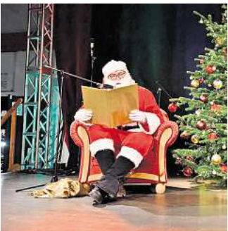
Liest vor: der Weihnachtsmann.