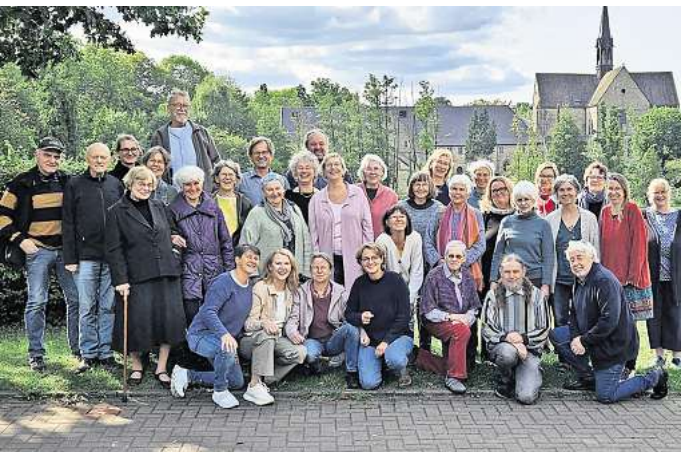
Auftritt in Wennigsen: die Calenberger Cantorei.