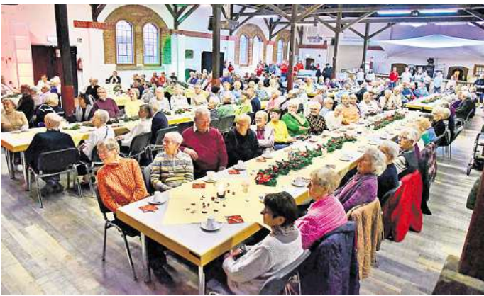
Gemütliches Ambiente: Die große Seniorenweihnachtsfeier des ASB im Zechensaal war wieder ein voller Erfolg.

250 Senioren sind bei der Weihnachtsfeier im Zechensaal dabei