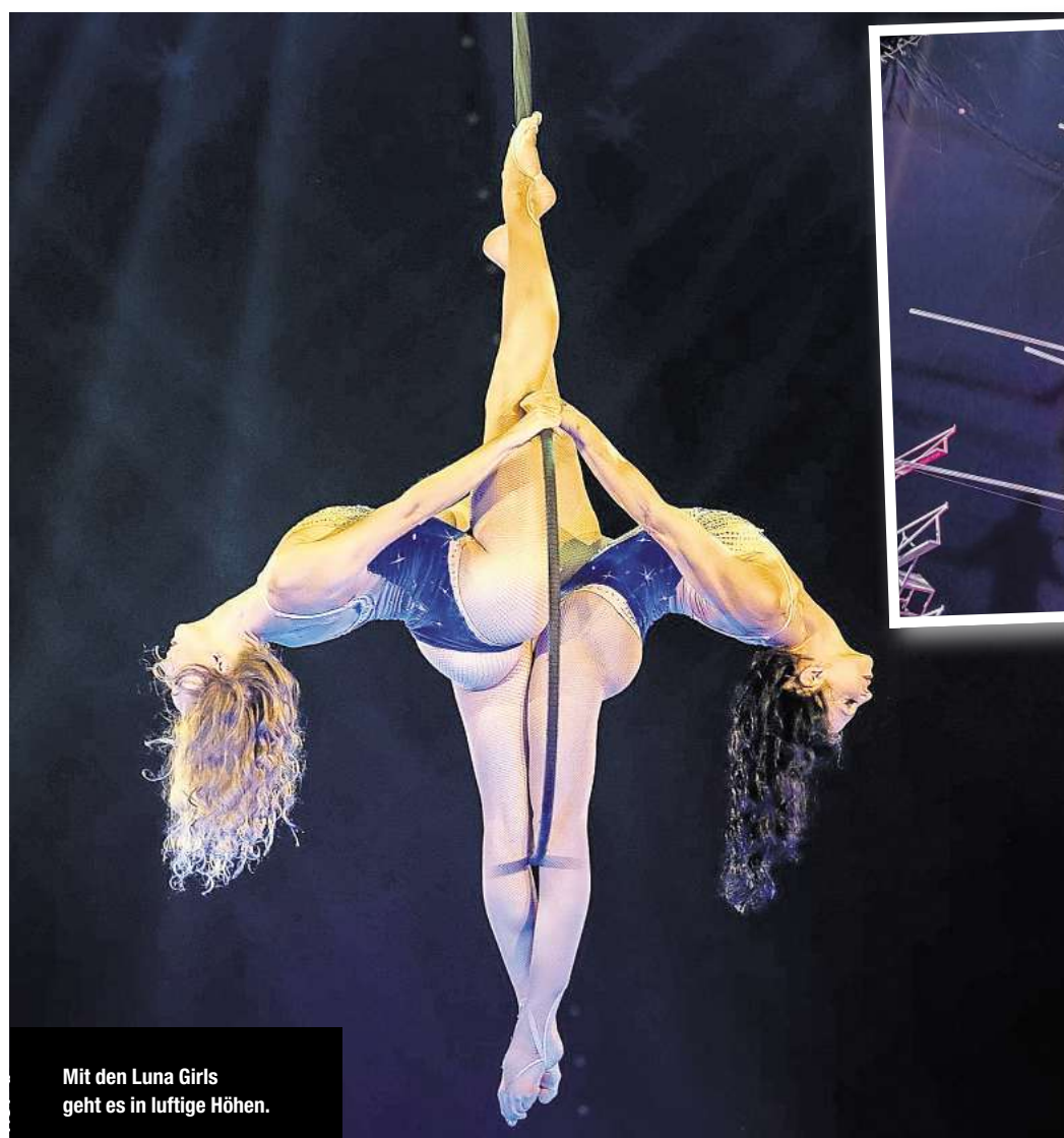
Mit den Luna Girls geht es in luftige Höhen.

Wo findet man die Crème de la Crème der internationalen Artistik? In Hannover – und das nur zur Weihnachtszeit. Als schöne Bescherung für das Publikum, denn der Weihnachtscircus Hannover geht mit dem beliebten „Grand Prix der Artisten“ im komfortablen Zelt mit nummerierten Einzelsitzen in die nächste Runde. Supersicht auf die Superstars der Manege: Das neue Zelt wird ohne innere Masten errichtet – so haben die Besucher von jedem Platz aus besten Blick auf das Geschehen. Die auf großen internationalen Circus Festivals ausgezeichneten Artisten müssen an der Leine eine ganz besondere Hürde nehmen: Das Publikum ent-