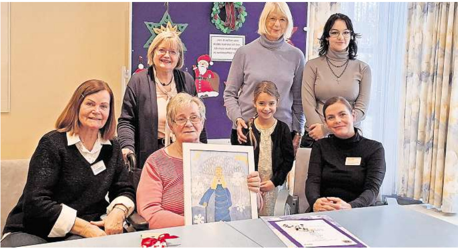
Ausgezeichnet: Die Preisträgerinnen der Bilder des diesjährigen Adventskalenders freuen sich über die Würdigung durch den Lions Club Deister Calenberger Land.

Die Jury war beeindruckt von den zarten, durchscheinenden Farben, die etwas Leichtes, Ästherisches bei Grobes Werk ausstrahlen. Die Siegerin ist schon seit vielen Jahren Mitglied der Kreativgruppe des ASB-Alten- und Pflegeheims und hat dort überhaupt erst