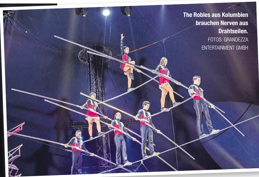
The Robles aus Kolumbien brauchen Nerven aus Drahtseilen.

russ aus Budapest, ihre preisgekrönte Show an Luftgurten zelebriert. Das Quartett The Robles windet sich durch die Stäbe eines stählernen Käfigs in schwindelnder Höhe. Noch außergewöhnlicher und schwieriger ist wohl die Darbietung von Ricce Meticce. Die beiden Italienerinnen haben die gute alte – und schon fast vergessene – Kunst des Zopfhangs neu belebt. Da muss die Frisur sitzen. Ungewöhnlich und noch nie im Weihnachtscircus zu erleben, ist die Power-Show von Lift. Die vier Akrobatinnen und Akrobaten aus Frankreich und Kanada sind Spezialisten auf dem Fangstuhl.