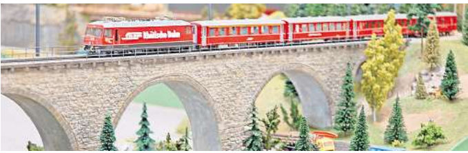
Sehr detailreich: Der Verein Modell-Eisenbahn-Freunde Hannover Land zeigen unterschiedliche Anlagen.

Die H0m Anlage stellt die schweizerische Rhätische Bahn (RhB) nach. Die Landschaft auf der H0m-Anlage ist sehr detailreich gestaltet und der bergigen