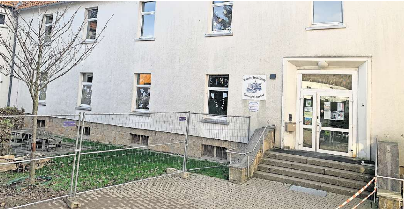
Hat höchste Priorität auf der Liste der Stadt: Die Wilhelm-Busch-Grundschule in Hohenbostel.