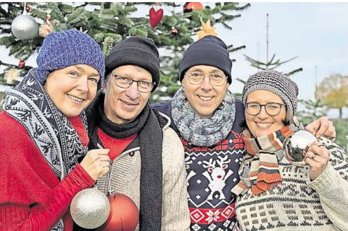
Treten im Bürgersaal auf: die 4 Christmas Singers.