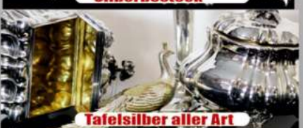
Tafelsilber aller Art

Wir zahlen zur Zeit bis zu 95,99* Euro pro Gramm