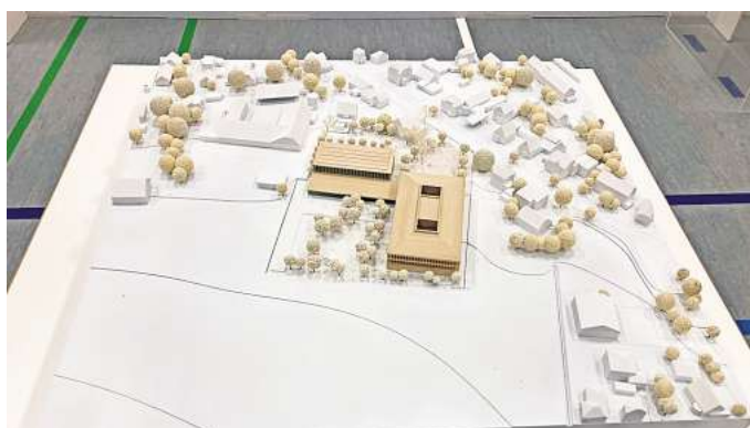
Sieger: Dieser Entwurf hat den Architektenwettbewerb für den Neubau der Grundschule Weetzen gewonnen. In der Ausstellung sind auch alle weiteren Vorschläge zu sehen.

Das Preisgericht, bestehend aus Expertinnen und Experten der Architektur und Stadtplanung, hat die eingereichten Arbeiten intensiv geprüft und die Ge-