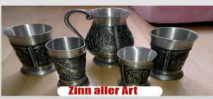
Zinn aller Art