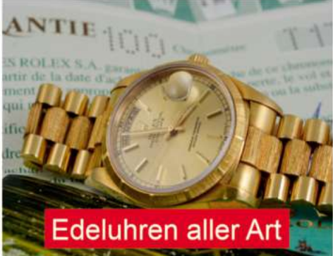
Edeluhren aller Art