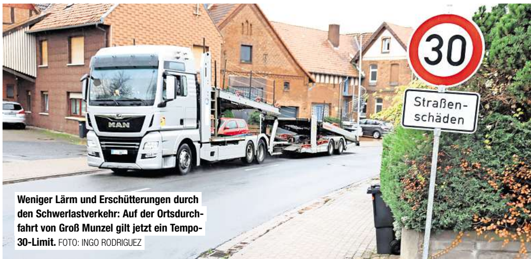
Weniger Lärm und Erschütterungen durch den Schwerlastverkehr: Auf der Ortsdurchfahrt von Groß Munzel gilt jetzt ein Tempo-30-Limit.