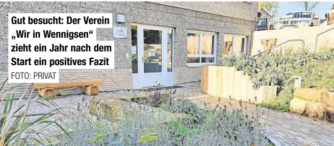
Gut besucht: Der Verein „Wir in Wennigsen“ zieht ein Jahr nach dem Start ein positives Fazit