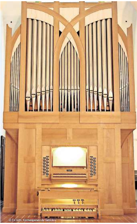
Populär: Über die Orgel der Margarethenkirche in Gehrden gibt es nun auf einer speziellen Orgel-Internetseite Informationen.