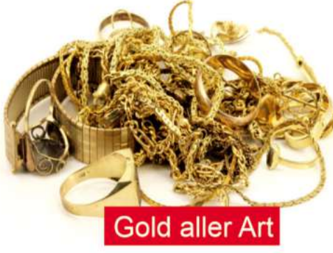
Gold aller Art