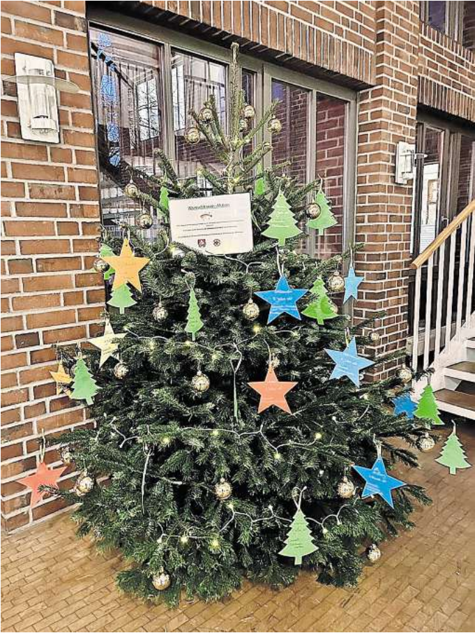
Steht im Rathaus: Am Wunschbaum können Kinder ihre Wünsche hängen und Gehrden diese anschließend erfüllen.

Alle Einwohnerinnen und Einwohner Gehrden, die den Kindern eine Freude machen möchten, sind aufgerufen, sich einen Wunsch abzupflücken und zu erfüllen. Die weihnachtlich verpackten Wunsch-Geschenke sollten bis zum 12. Dezember im Rathaus abgeben werden. Die Ausgabe der Weihnachtsgeschenke an die Kinder erfolgt am 19. Dezember.