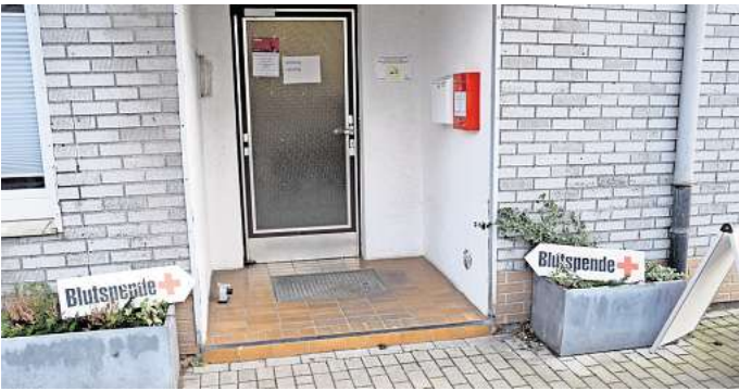
Das Ende der Ortsgruppe bedeutet auch, dass ein weiterer Ort für Blutspendetermine wegfällt.

Schon frühzeitig habe man deshalb in der Ortsgruppe versucht, neue Mitglieder zu gewinnen. Doch damit hatte der Vorstand keinen Erfolg. „Ich kann das verstehen“, sagt die Vorsitzende. „Ich trete ja auch nicht in jeden Verein ein.“ Dabei habe der