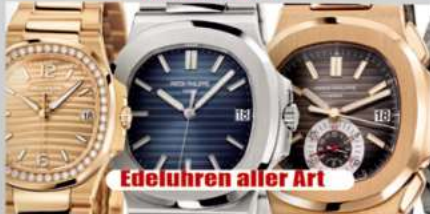
Edeluhren aller Art

Ihre Vorteile: ✓ kostenlose Beratung ✓ kostenlose Wertschätzung ✓ transparente Abwicklung ✓ Bargeld sofort