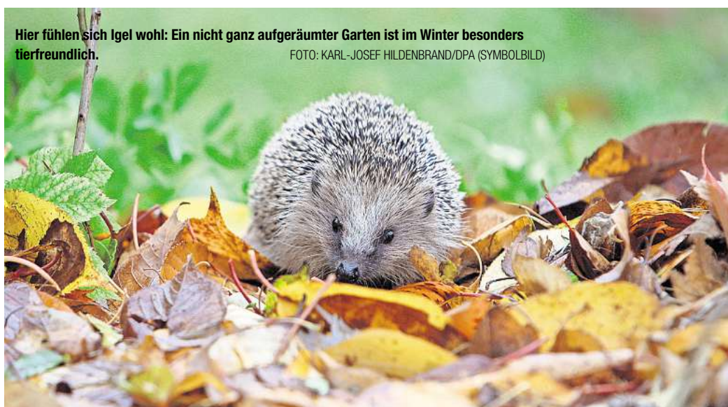
Hier fühlen sich Igel wohl: Ein nicht ganz aufgeräumter Garten ist im Winter besonders tierfreundlich. FOTO: KARL-JOSEF HILDENBRAND/DPA (SYMBOLBILD)

Mit einer mit Laub gepolsterten Holzkiste unter dem Blätter- und Reisigberg könne man einen gemütlichen Unterschlupf für Igel bauen. Auch einige übereinander gelegte alte Dachziegel