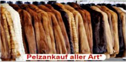
Pelzankauf aller Art*