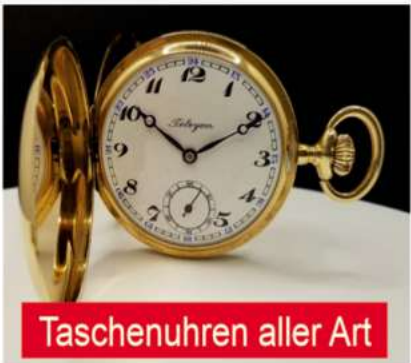
Taschenuhren aller Art