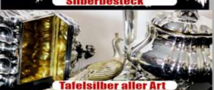
Tafelsilber aller Art

Wir zahlen zur Zeit bis zu 95,- Euro pro Gramm