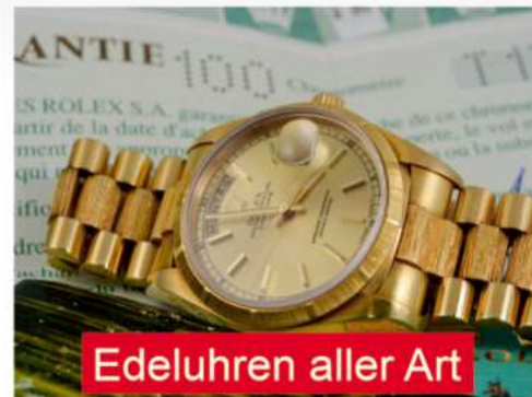
Edeluhren aller Art