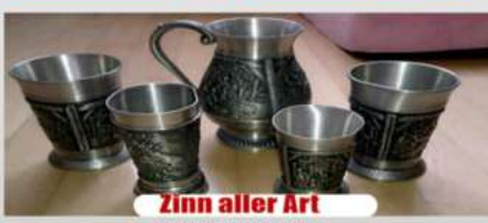
Zinn aller Art