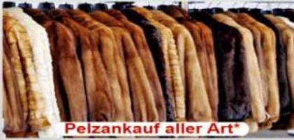
Pelzankauf aller Art*