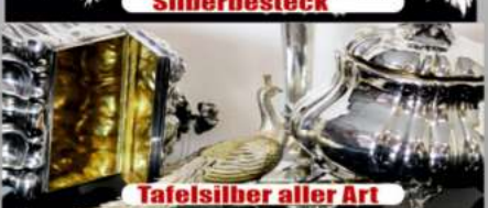
Tafelsilber aller Art

Wir zahlen zur Zeit bis zu 95,- Euro pro Gramm