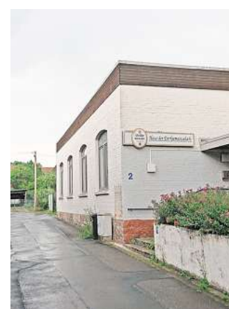
Wegen finanzieller Engpässe wird die Heizung im Dorfgemeinschaftshaus doch erst im nächsten Jahr erneuert.