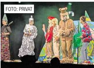
Das Theater für Niedersachsen präsentiert „Der Zauberer von Oz“. Seite 5