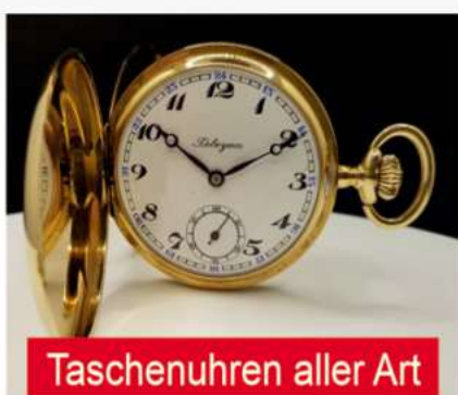
Taschenuhren aller Art