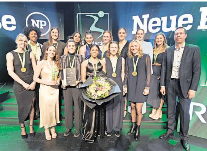
Im vergangenen Jahr belegten die Sportler des TKH in der Mannschaftswertung den ersten Platz.

Möglichkeit zwei: Sie schneiden den ausgefüllten Coupon aus, kleben ihn auf eine frankierte Postkarte und schicken ihn mit