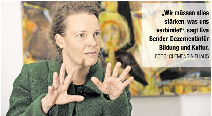
„Wir müssen alles stärken, was uns verbindet“, sagt Eva Bender, Dezernentin für Bildung und Kultur.

Eva Bender, Dezernentin für Bildung und Kultur der Landeshauptstadt Hannover, im Interview