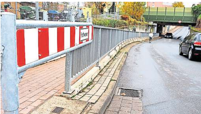
An der Einfahrt zur Unterführung an der Berliner Straße sind die geöffneten Schranken Anfang der Woche zu sehen.

Anlass für die Installation der Schranken ist der Starkregen am Morgen des 4. Septembers, bei dem die Kanalisation in der Senke überfordert war. Die Fahrbahn der Straße Am Sportpark wurde an ihrem tiefsten Punkt bis zu 70 Zentimeter überflutet. Die Feuerwehr musste die Straße zwei