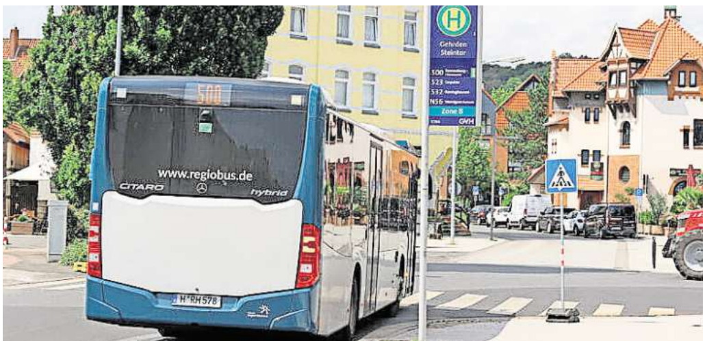
Anbindung: Die Busse der Linie 500 fahren vom Steintor bis zum Hauptbahnhof nach Hannover. Die Region hält dieses Angebot für gut, viele Gehrdenen dagegen wünschen sich eine Verbindung zum S-Bahnhof Weetzen.

Die SprintH-Linie 500 wird ab 2025 bis zum S-Bahnhof nach Weetzen fahren – an den Kosten muss sich Gehrden allerdings zur Hälfte beteiligen