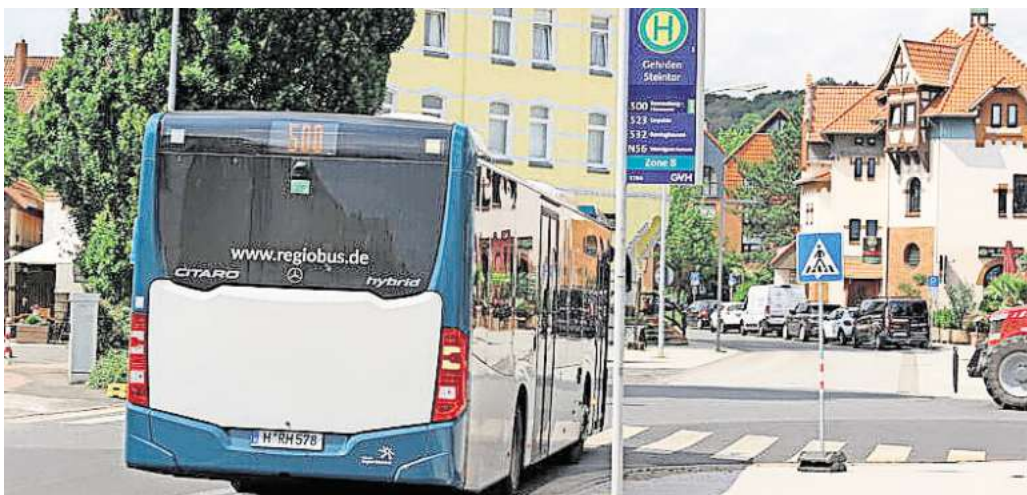
Anbindung: Die Busse der Linie 500 fahren vom Steintor bis zum Hauptbahnhof nach Hannover. Die Region hält dieses Angebot für gut, viele Gehrdenener dagegen wünschen sich eine Verbindung zum S-Bahnhof Weetzen.

Die SprintH-Linie 500 wird ab 2025 bis zum S-Bahnhof nach Weetzen fahren – an den Kosten muss sich Gehrden allerdings zur Hälfte beteiligen