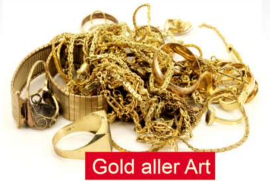
Gold aller Art