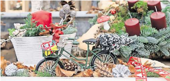
Weihnachtliche Stimmung: Die Lebenshilfe Seelze veranstaltet in Holtensen ihren Winterzauber. LEBENSHILFE SEELZE

Die Parkplätze im Ort sind begrenzt. Um den Besuch so entspannt wie möglich zu machen, hat die Lebenshilfe einen kostenlosen Shuttle-Service eingerichtet. Lebenshilfe-Busse werden regelmäßig zwischen den Parkplätzen in Groß Munzel, Hohes Feld 4, und Wunstorf, Bahnhof Südseite, pendeln.