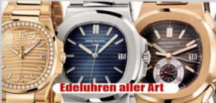
Edeluhren aller Art

Ihre Vorteile: ✓ kostenlose Beratung ✓ kostenlose Wertschätzung ✓ transparente Abwicklung ✓ Bargeld sofort