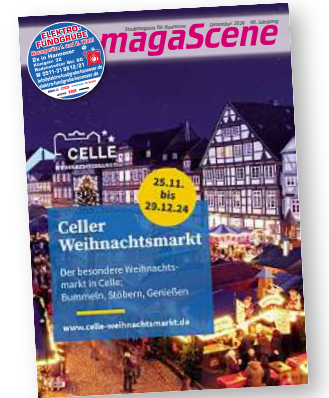
Stadtmagazin für Hannover magaScene

Welche gelernten Veranstaltungen werden 2025 mit dem UCOM-Jubiläum gebrandet? Der Neujahrsempfang am 10. Januar im Neuen Rathaus. Wir freuen uns sehr, dass der Oberbürgermeister ihn unter das Motto „10 Jahre UNESCO City of Music Hannover“ stellen wird. Unter anderem ist zum Start in den Abend eine Flashmob-Aktion geplant. Zum allerersten Mal wird auch der Rathausbalkon in diese Veranstaltung einbezogen, dort darf ja eigentlich nur Hannover 96 seine Aufstiege feiern. Bei all unseren Aktivitäten im UCOM-Jubiläumsjahr geht es darum, Menschen zusammenzubringen, auch und besonders jene, die sich mit dem Thema Musik nicht so oft befassen. Wenn wir im Jubiläumsjahr drei bis fünf Veranstaltungen pro Woche zum Thema haben, müssen wir den Blick auch weiter nach vorne richten. Wie wollen wir den Titel in den nächsten zehn Jahren mit Leben füllen? Wie können wir diesen Titel noch ernster nehmen und was können wir eigentlich noch für die Musiklandschaft in Hannover tun? Gemeinsam mit dem Musikland Niedersachsen und weiteren Akteur*innen wollen wir im nächsten Jahr einen Musikentwicklungsplan schreiben, der diese und weitere Fragen beantwortet. Erste Netzwerktreffen mit der Musikszene hat es bereits gegeben. Gemein-