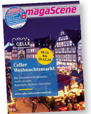
Stadtmagazin für Hannover magaScene

Welche gelernten Veranstaltungen werden 2025 mit dem UCOM-Jubiläum gebrandet? Der Neujahrsempfang am 10. Januar im Neuen Rathaus. Wir freuen uns sehr, dass der Oberbürgermeister ihn unter das Motto „10 Jahre UNESCO City of Music Hannover“ stellen wird. Unter anderem ist zum Start in den Abend eine Flashmob-Aktion geplant. Zum allerersten Mal wird auch der Rathausbalkon in diese Veranstaltung einbezogen, dort darf ja eigentlich nur Hannover 96 seine Aufstiege feiern. Bei all unseren Aktivitäten im UCOM-Jubiläumsjahr geht es darum, Menschen zusammenzubringen, auch und besonders jene, die sich mit dem Thema Musik nicht so oft befassen. Wenn wir im Jubiläumsjahr drei bis fünf Veranstaltungen pro Woche zum Thema haben, müssen wir den Blick auch weiter nach vorne richten. Wie wollen wir den Titel in den nächsten zehn Jahren mit Leben füllen? Wie können wir diesen Titel noch ernster nehmen und was können wir eigentlich noch für die Musiklandschaft in Hannover tun? Gemeinsam mit dem Musikland Niedersachsen und weiteren Akteur*innen wollen wir im nächsten Jahr einen Musikentwicklungsplan schreiben, der diese und weitere Fragen beantwortet. Erste Netzwerktreffen mit der Musikszene hat es bereits gegeben. Gemein-