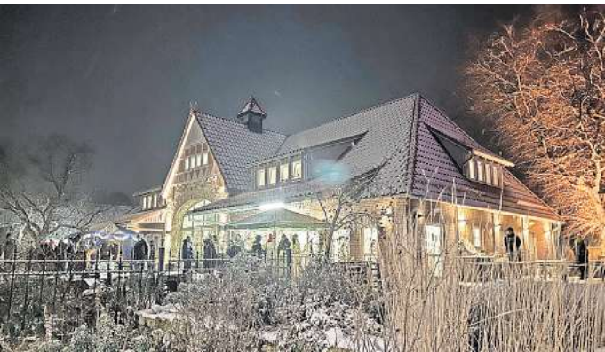
Weihnachtliche Stimmung: Die Lebenshilfe Seelze veranstaltet in Holtensen ihren Winterzauber.

Derzeit sucht die Stadtverwaltung noch Ehrenamtliche, die sich bei der vorgezogenen Bundestagswahl als Wahlhelferin oder als Wahlhelfer engagieren wollen. Interessierte können sich per E-Mail an wahl@stadt-barsinghausen.de bei der Verwaltung melden. Wahlhelfer kann jede Person werden, die die deutsche Staatsangehörigkeit besitzt, das 18. Lebensjahr vollendet hat und selbst bei der Bundestagswahl wählen darf. Das Engagement am Wahlsonntag wird mit einem Erfrischungsgeld entschädigt.