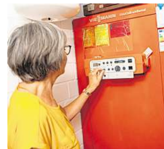
Auf sie kommt's an: die Heizungsanlage.

Damit die Heizenergie nicht verpufft, empfiehlt die Verbraucherzentrale Brandenburg, in unbeheizten Räumen und Heizungskellern die Rohre nachträglich zu dämmen. „Die Rohrleitung ist dann gut gedämmt, wenn die Dämmung etwa so dick ist wie das Rohr selbst“, erklärt Jens Krumnow. (DPA)