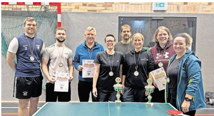
Mit Spaß dabei: Bei der zwölften Auflage der Tischtennis-Hobbymeisterschaft freuen sich die Erwachsenen über ihre Erfolge.

Insgesamt stellt Christiane Winkes eine Summe von 1000 Euro zur Verfügung. Diese Summe wird auf die fünf Vereine und Organisationen aufgeteilt. Der erste Platz erhält 500 Euro, der zweite 200 Euro und die drittplatzierte Einrichtung bekommt 150 Euro. Damit keiner der Vereine an der Spendenwand leer ausgeht, gibt es für den vierten Platz 100 Euro und für den fünften Platz immerhin noch 50 Euro.