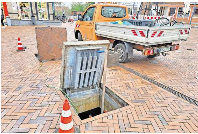
Abschließende Reinigung: Mitarbeiter des Bauhofes haben das Wasserspiel am Thie für den Winter vorbereitet.

Partnerschaftsgewalt geht oft auch nach der Trennung weiter. Frauen mit Kindern seien besonders stark betroffen. Das habe eine Umfrage des Vereins unter gewaltbetroffenen Müttern bestätigt. Demnach versuchten Täter auch nach der Trennung, mit Gewalt Kontrolle über die Frau auszuüben. Wenn es gemeinsame Kinder gibt, nutzen Täter auch das Sorge- und Umgangsrecht dafür aus und Frauen werden erneut Opfer.