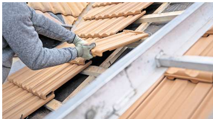
Dachschäden können von Fachleuten behoben werden.

Spätestens wenn alle Blätter von den Laubbäumen gefallen sind, ist es höchste Zeit, das Haus winterfest zu machen. Denn Frost, Regen, Sturm und Schnee können einer Immobilie ganz schön zusetzen.