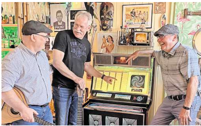
Treten in der Alten Kappelle in Weetzen auf: „Band to be named“.