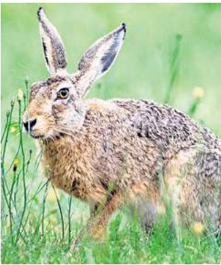
Virus breitet sich bei Feldhasen aus: Wer ein totes Tier entdeckt, wird gebeten, den Fund zu melden.

Durch sogenannte Flurbereinigung und die damit einhergehende „sehr aufgeräumte Landschaft“ habe sich der Bestand grundsätzlich massiv verringert. „In der Feldmark gab es kein Gehölz mehr, es gab weniger He-