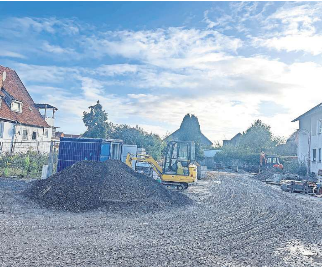
Zankapfel: Gegenwärtig wird der Parkplatz an der Dammstraße als Materiallager von den Baufirmen genutzt.

„Zusätzlich zu wichtigen Parkplätzen brauchen wir auch mehr Flächen- und Stadtentwicklung, barrierefreie zirkulierende Zufahrten, einen perspektivischen