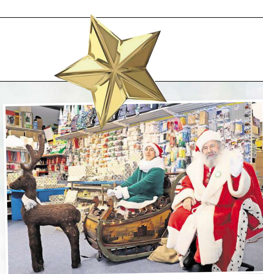
Der Weihnachtsmann will auch in diesem Jahr wieder vielen Kindern Freude bereiten ...