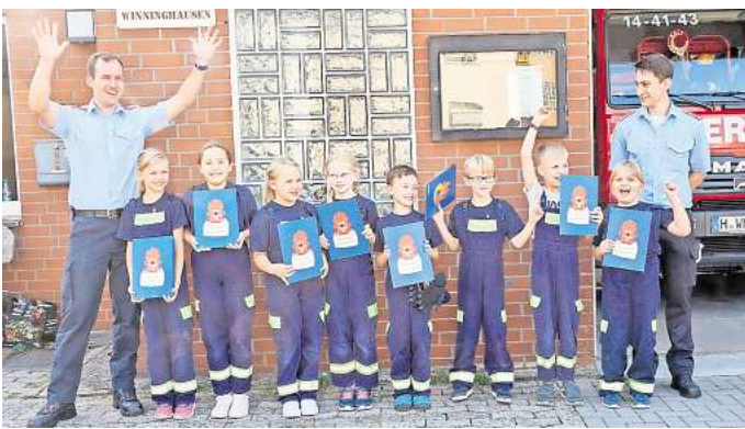
Erfolgreiche Ausbildung: Acht Kinder haben die Kinderflamme bei der Abnahme der Feuerwehr Winninghausen erhalten.

Winninghausen. An verschiedenen Stationen konnten die Kinder der Feuerwehr Winninghausen ihr Können zeigen. So bewältigten sie im Bereich der Ersten Hilfe Aufgaben wie das Anlegen von Pflastern und das Versorgen kleiner Wunden. Auch ihr Wissen im Bereich Allgemeinwissen wurde abgefragt, beispielsweise das richtige Verhalten im Brandfall oder die Notrufnummern. Darüber hinaus stand auch die Feuerwehrentechnik im Fokus: In Zweiertteams musste mit der Kübelspritze ein „Brandhaus“ erfolgreich gelöscht werden. Insgesamt acht Kinder absolvierten bei dieser Abnahme erfolgreich ihre Kinderflamme. Anfang September führte die Kinderfeuerwehr der Feuerwehr Winninghausen die Abnahme der Kinderflamme durch. Insgesamt acht Kinder stellten dabei ihr umfangreiches Wissen erfolgreich unter Beweis. Die Kinderflamme, ein Leistungsnachweis für Mitglieder der Kinderfeuerwehr, ist in verschiedene Stufen