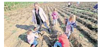
Ausflug in die Natur: Vorschulkinder lernen Wissenswertes über die Kartoffel.