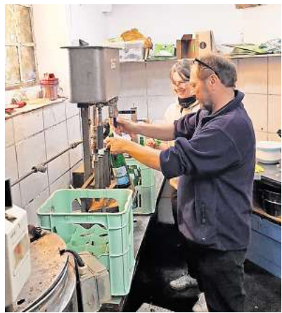
Nun auch in Flaschen: Bei der Mosterei in Großgoltern ist die neue Abfüllung nun möglich.

Weitere Informationen zum Apfelpressen gibt es im Internet unter www.deister-vorland.de/apfelzeit . Das Team vor Ort ist auch erreichbar unter Telefon 0176/56704128 oder per E-Mail an apfelzeit@deister-vorland.de .