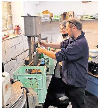
Nun auch in Flaschen: Bei der Mosterei in Großgoltern ist die neue Abfüllung nun möglich.

nen Äpfeln nun entsprechend abfüllen lassen. Diese Flaschen und die Äpfel bringen die Besucherinnen und Besucher selbst mit. Die Glasflaschen sollen standardisierte Mineralflaschen sein. Weitere Informationen zum Apfelpressen gibt es im Internet unter www.deister-vorland.de/apfelzeit . Das Team vor Ort ist auch erreichbar unter Telefon 0176/56704128 oder per E-Mail an apfelzeit@deister-vorland.de .