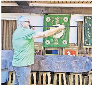
Neuer Trend: Das Blasrohrschießen ist in Ronnenberg möglich.