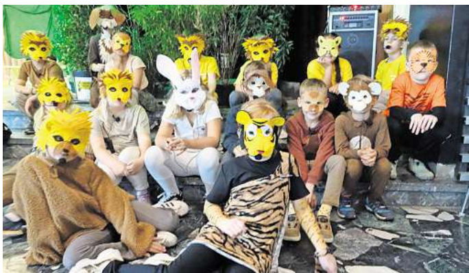
Tierisch: Grundschul Kinder führen nach wochenlangem Üben ihr Musical auf.