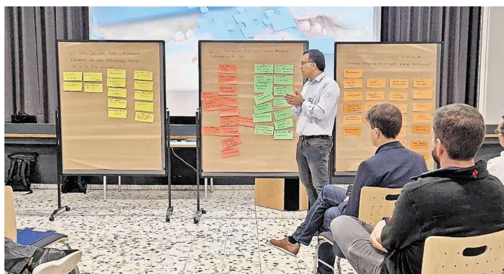
Erste Zwischenergebnisse: Arbeitsgruppen haben sich in Ronnenberg bereits mit dem Thema kommunale Wärmeplanung befasst. STADT RONNENBERG

Ehrgeiziges Ziel: Ergebnis soll schon in einem Jahr vorliegen und Bürgern Planungssicherheit beim Heizen verschaffen