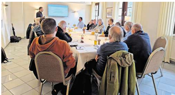
Fragen stellen, Antworten erhalten: Die Stadt Ronnenberg bietet den nächsten Energietreff in Empelde an.