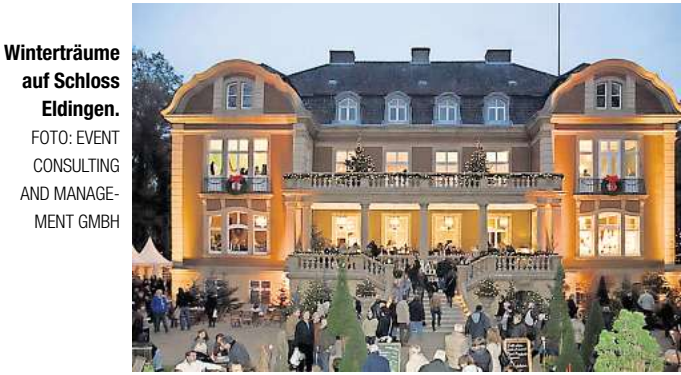
Winterträume auf Schloss Eldingen.