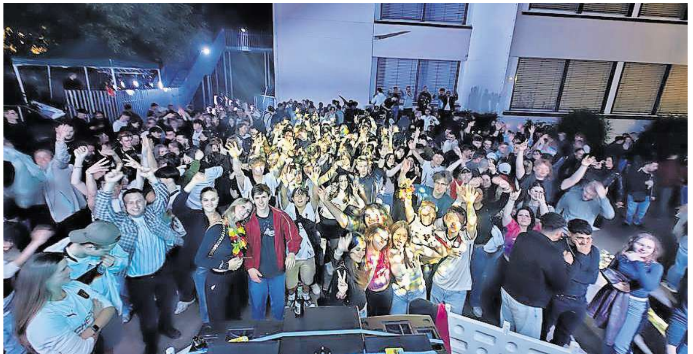
Gästemagnet: Auch in der Partyzone herrscht Jahr für Jahr ausgelassene Stimmung.

Steigende Kosten und schwierige Sponsorensuche: Vorstand diskutiert über neue Geldquellen – 3 Euro pro Besuch?