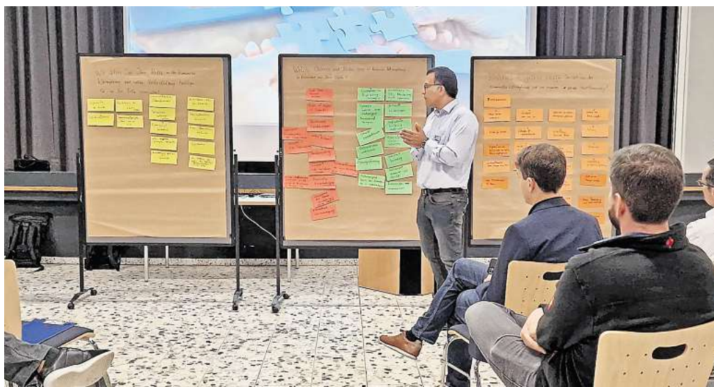
Erste Zwischenergebnisse: Arbeitsgruppen haben sich in Ronnenberg bereits mit dem Thema kommunale Wärmeplanung befasst. STADT RONNENBERG

Ehrgeiziges Ziel: Ergebnis soll schon in einem Jahr vorliegen und Bürgern Planungssicherheit beim Heizen verschaffen