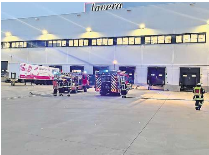
Realistische Szenarien: Die Mitglieder mehrerer Ortsfeuerwehren üben für den Ernstfall.

Feuerwehren aus Bantorf und Hohenbostel üben für den Ernstfall