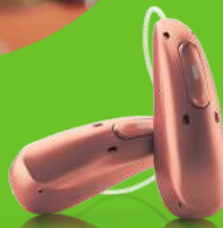
Audéo Sphere™ Infinio ist das weltweit erste Hörsystem mit KI-Chip.