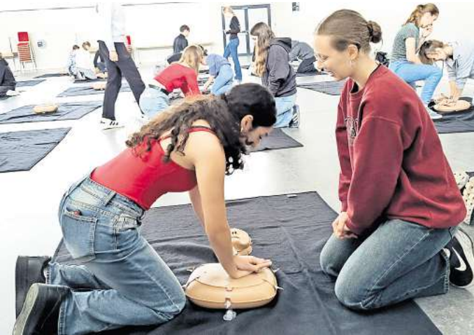
Vorbereitung auf einen möglichen Ernstfall: Schülerinnen und Schüler des Hannah-Arendt-Gymnasiums üben das Reanimieren.