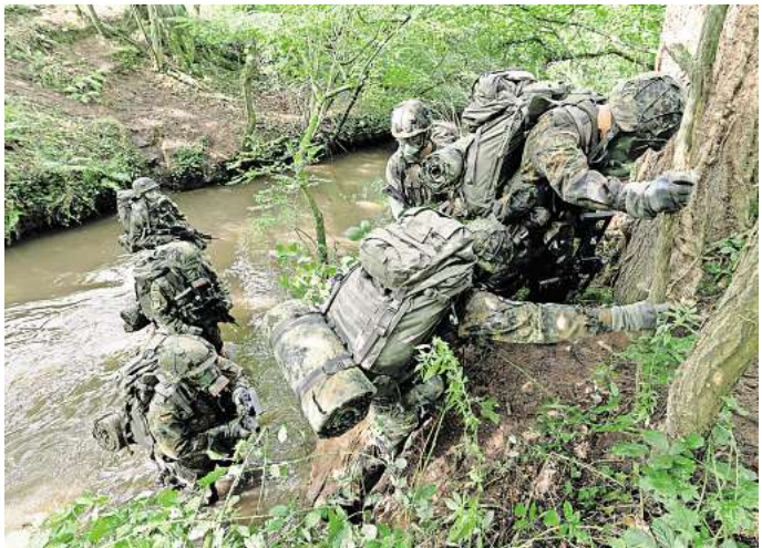
Durchschlageübung: Das Landeskommando Niedersachsen der Bundeswehr plant für Anfang November eine dreitägige Übung im gesamten Deister, an der 25 Soldatinnen und Soldaten teilnehmen werden.

Bundeswehr plant im November eine dreitägige Übung im gesamten Deister