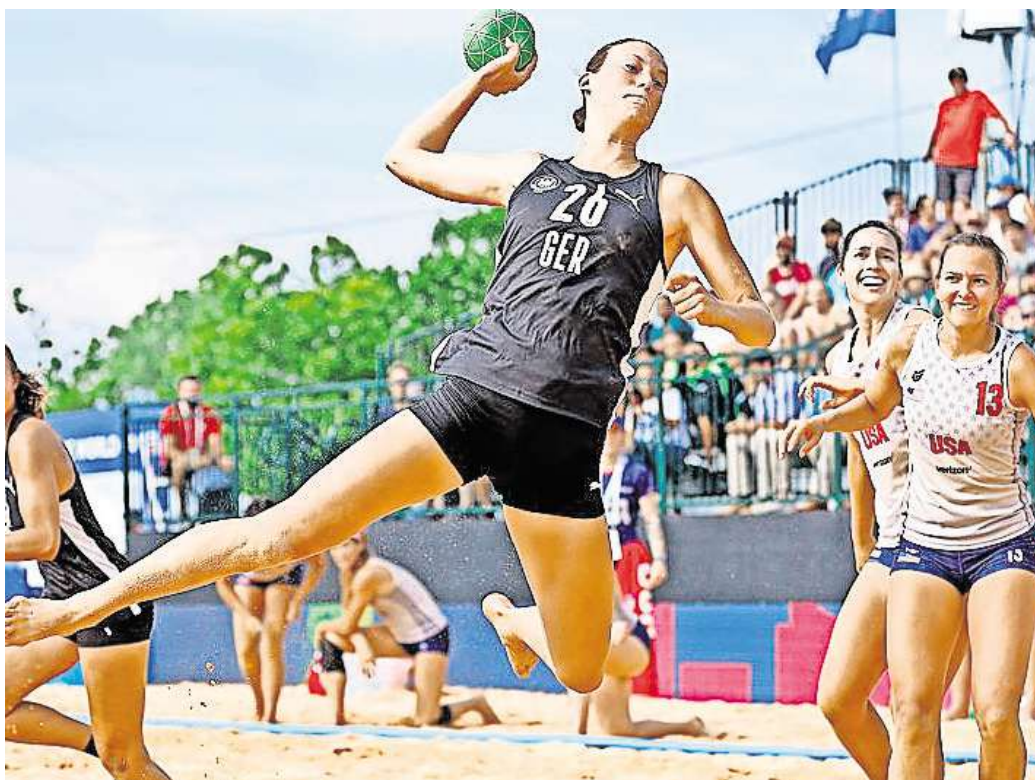
Unter freiem Himmel: Auch Beachhandball gehört zum Programm der World Games

Zwar respektiere man, dass Karlsruhe den Zuschlag bekommen hat. „Aber wir fragen uns mittlerweile schon, wie dieser Beschluss denn zustande gekommen ist. Das hat uns auch im Nachgang noch niemand transparent erklären können. Das war ein unfairer Um-