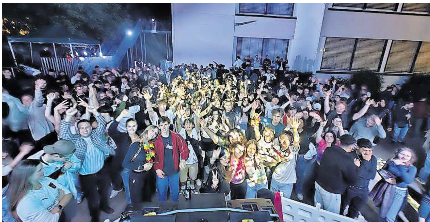
Gästemagnet: Auch in der Partyzone herrscht Jahr für Jahr ausgelassene Stimmung.

Es seien aber weniger die Gagen für die Künstler ein Problem.