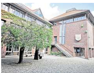
Personalsorgen im Rathaus: In den nächsten Jahren werden zahlreiche Mitarbeiterinnen und Mitarbeiter in Rente gehen. Doch der Verwaltung fehlt der Nachwuchs.