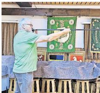
Neuer Trend: Das Blasrohrschießen ist in Ronnenberg möglich.