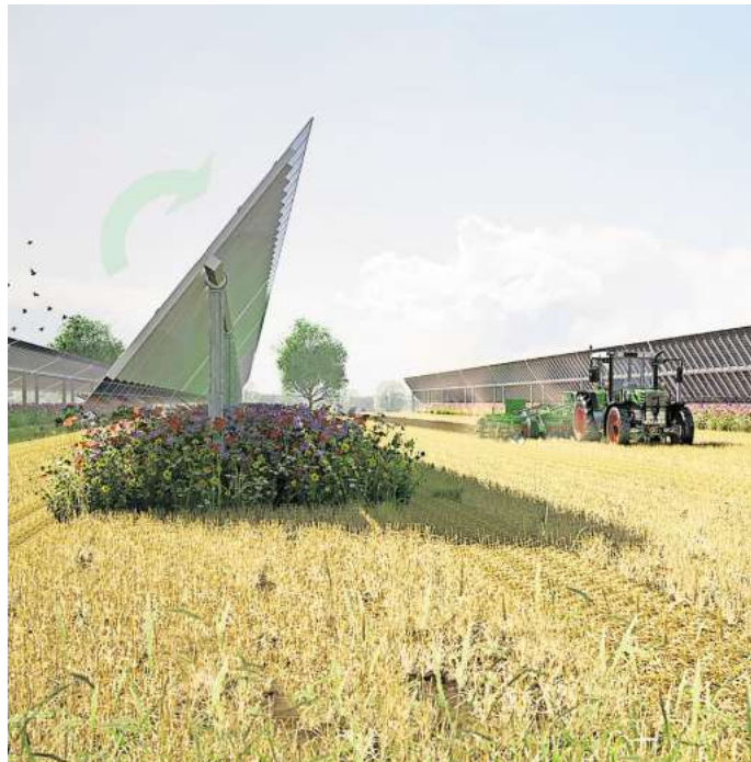
Eine Agrikultur-Photovoltaik-Anlage (Agri-PV-Anlage) mit flexibel auszurichtenden Modulen: Eine landwirtschaftliche Bewirtschaftung erfolgt zwischen den Modulen.