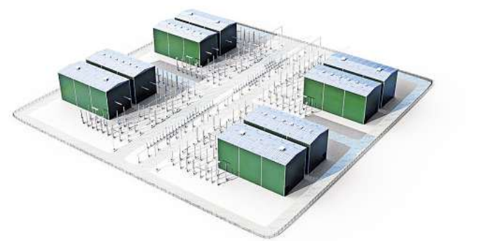
Schematische Grafik: Die ersten Multiterminal-Hubs, die in Norddeutschland entstehen, bestehen neben der DC-Schaltanlage aus einem Konverter und einem Umspannwerk.

„Es ist wegen der Dreifachnutzung der Flächen für uns ein Stück Idealismus dabei, trotzdem ist es auch ein Beitrag, um die Betriebe mit Einnahmen aus der Pacht diversifiziert und zukunftsicher aufzustellen“, sagt von Wedemeyer. Profitieren soll auch die Stadt Gehrdens – von