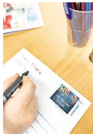
Früh übt sich wer lernt, einen Brief zu schreiben.

Sie sind Lehrer oder Lehrerin und möchten Postkarten als Material für Ihren Deutschunterricht? Dann melden Sie gerne unter service@citipost.de .