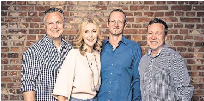
Mal swingend, mal soulig: Die Ellingtons nehmen das Publikum mit auf eine faszinierende Entdeckungsreise durch die Musik der letzten Jahrzehnte.