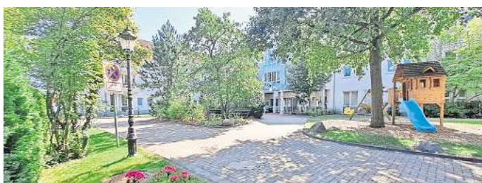
Das „Haus Gehrden“ ist seit je her eine Vorzeigeeinrichtung.