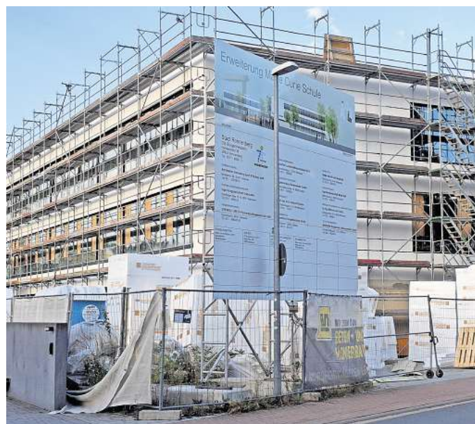
Bauarbeiten: Die Fortschritte an der Fassade des Erweiterungsbaus sind deutlich hinter dem Gerüst zu erkennen.