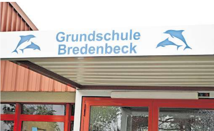
Grundschule Bredenbeck: Der zukünftige Name soll die Schule prägen.

Ein guter Schulname prägt eine Schule und stiftet Identität. „Es bleibt die Grundschule der Bredenbecker, Holtenser und Evestorfer Kinder. Durch eine gemeinsame Namensgebung können die Bewohnerinnen und Bewohner der Ortschaften ihre Identifikation mit der neuen Schule zum Ausdruck bringen“,