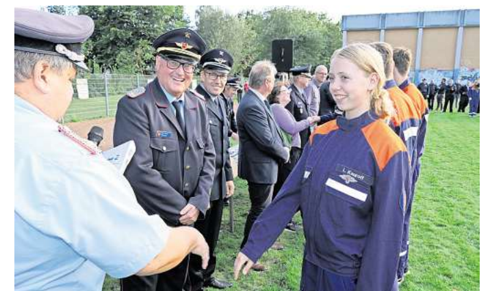
Erfolgreich bestanden: Mädchen und Jungs aus den Ronnenberger Jugendfeuerwehren haben erfolgreich die Leistungsspange erworben.