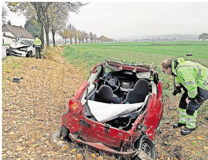
Keine Seltenheit: Die Rehrbrinkstraße/L392 gehört zu den Straßen im Barsinghäuser Stadtgebiet, an denen regelmäßig Verkehrsunfälle mit Personenschaden geschehen. Im Jahr 2022 traf es unter anderem einen weißen VW Golf und einen roten Toyota Aygo, die dort zusammenstießen.

Unfallatlas 2023: In Alt-Barsinghausen, Kirchdorf und Egestorf haben sich die meisten Verkehrsunfälle mit Verletzten ereignet