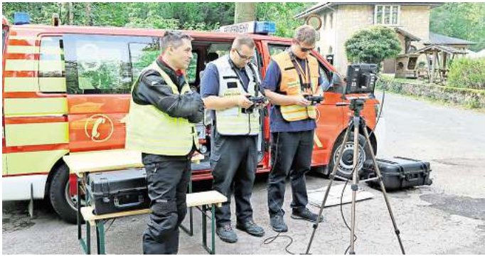
Ein Drohnteam ist mit dabei.

Im Nachgang soll nun das Konzept und die Ausstattung des neu aufgestellten Zuges zur Vegetationsbrandbekämpfung und zu Hochwasserschutzsystem analysiert werden. Hier fehlt es laut Feuerwehr noch an spezieller Ausstattung, um Vegetationsbrände schnell in den Griff zu bekommen. Entsprechendes Gerät und Fahrzeuge sollen in den nächsten Jahren beschafft werden.