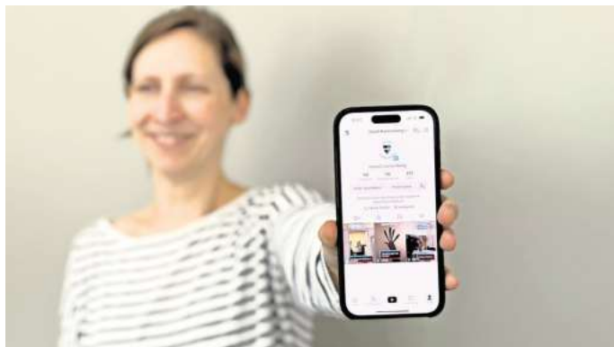
Modernes Medium: Die Stadt Ronnenberg hat einen eigenen TikTok-Kanal gestartet.