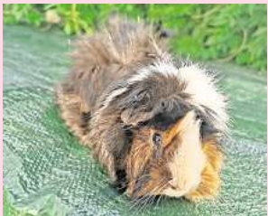
Der Tierschutzverein Barsinghausen sucht für das Meerschweinchen Vincent und zwei weitere Tiere ein neues Zuhause.

Der Tierschutzverein Barsinghausen hofft, für die Meerschweinchen schnell ein schönes Zuhause zu finden, so dass sie nicht wieder ins Tierheim kommen müssen. Weitere Informationen gibt es unter der Telefon-Hotline (05105) 7736777.