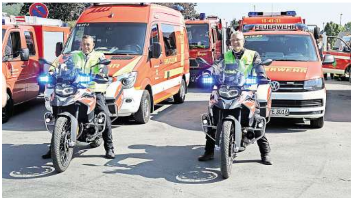
Die Kradmelder sondieren vorab die Lage.

Bei der kurzen Nachbesprechung dankte der ausscheidende Brandabschnittsleiter Eber-