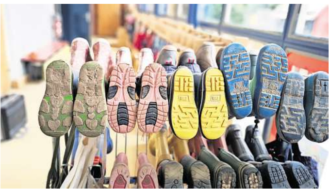
Fehlende Fachkräfte: Die Betreuungssituation in den Gehrden Kitas ist angespannt. Ab April können Kinder mit Inklusionsstaats in der Kita Am Castrum nicht mehr betreut werden.

Um einen Job in einer städtischen Einrichtung schmackhaft