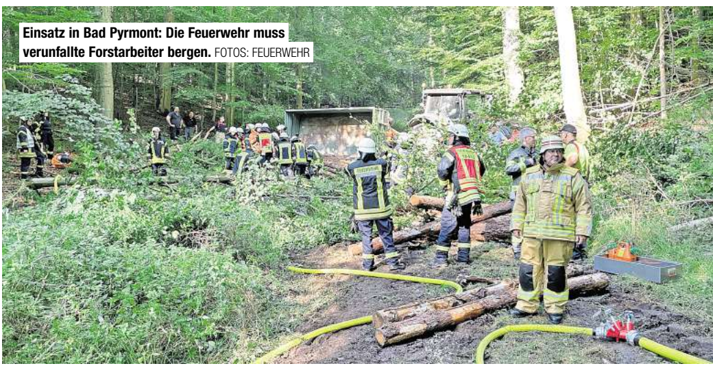
Einsatz in Bad Pyrmont: Die Feuerwehr muss verunfallte Forstarbeiter bergen. FOTOS: FEUERWEHR

Der erste Zug wurde zur Unterstützung der Pyrmont-Kräfte oberhalb der Sennhütte