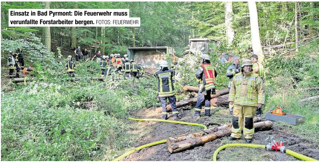
Einsatz in Bad Pyrmont: Die Feuerwehr muss verunfallte Forstarbeiter bergen.

Der erste Zug wurde zur Unterstützung der Pyrmont-Kräfte oberhalb der Sennhütte