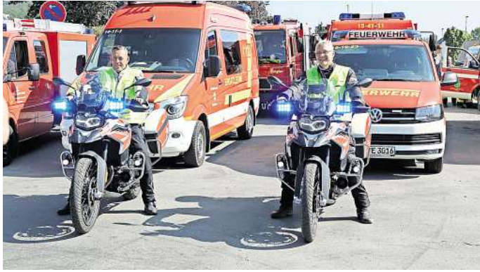
Die Kradmelder sondieren vorab die Lage.

Bei der kurzen Nachbesprechung dankte der ausscheidende Brandabschnittsleiter Eber-