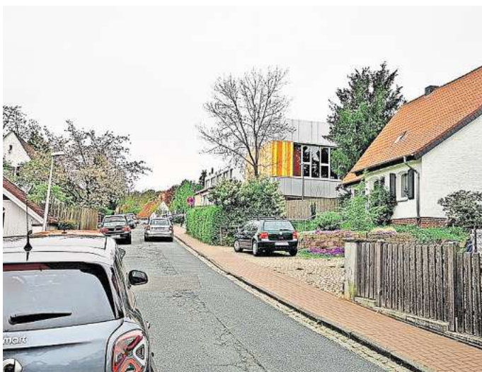
Hohe Priorität: Die Matthias-Claudius-Straße am Gymnasium soll zu einem verkehrsberuhigten Bereich umgestaltet werden.

Die Planer sprechen von „unverbindlichen Empfehlungen“, die aber durchweg sinnvoll seien und an einigen Stellen auch eine gewisse Dringlichkeit hätten. 18 Punkte mit „einem gewissen Handlungsdruck“ haben die höchste Priorität erhalten. Dazu gehören unter anderem das Parkraumangebot in der Kernstadt, der inzwischen geplante Bau einer Premiumradroute nach Hannover, die Verbesserung der Verkehrssicherheit an der Schulstraße und dem Stadtweg sowie die Verkehrsberuhigung am Matthias-Claudius-Gymnasium. Auch eine Verlängerung des SprintH der Linie 500 bis zum S-Bahnhof nach Weet-