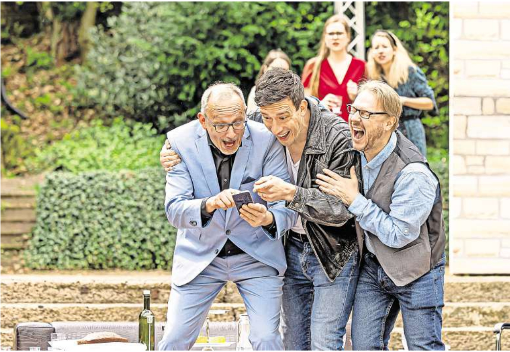
Als Film ein Riesenerfolg und auch auf der Deister-Freilicht-Bühne kommt's richtig gut an: Mehrere Vorstellungen von „Das perfekte Geheimnis“ in dieser Saison waren ausverkauft.

Was ihn freut: Alle drei Stücke seien vom Publikum gleich gut angenommen worden. Die letzten Vorstellungen von „Das perfekte Geheimnis“ waren allesamt ausverkauft. Vor allem das jüngere Publikum hatte außerdem wohl nicht erwartet gehabt, sagt