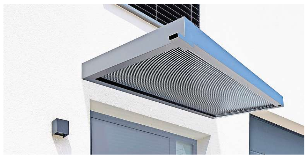
Die brandneue Serie an Premium-Haustürvordächern verfügt über einen cleanen Korpus aus anthrazitfarbenem Aluminium. Für besondere Hingucker und ein ansprechendes Licht-Schatten-Spiel sorgt eine innovative „Zebraplatte“

Wer schon einmal im strömenden Regen oder bei Schneefall vor der Haustür stand und umständlich nach dem Schlüssel gesucht hat, weiß: Ein Haustürvordach kann ein wahrer Segen sein – noch dazu, wenn es neben seinem funktionalen Nutzen auch noch die Gebäudehülle aufwertet. Dafür gibt es eine große Auswahl an Premium-Haustürvordächern „made in Germany“. Neu im Sortiment ist eine Linie, die dem Credo „stylish, stabil & erschwinglich“ folgt. Das in den Maßen 1.600 x 900 x 125 mm oder 2.000 x 900 x 125 mm erhältliche Rechteck-Vordach verfügt über ein schlichtes kubisches Design aus einer langlebigen Aluminium-Konstruktion, die mit einer anthrazitfarbenen Pulverbeschichtung mit matter Feinstruktur versehen ist. Die besondere Raffinesse besteht in der Abdeckung, bei der eine 16 mm starke „Zebraplatte“ zum Einsatz kommt. Hier zeigt sich, dass Längsstreifen nicht nur schlank, sondern auch schick machen, denn die klare Polycarbonat-Stegplatte verfügt über dunkle Längsstreifen, die einen außergewöhnlichen 3D-Effekt kreieren. Sie hält Wind und Wetter zuverlässig fern und kann an heißen Tagen sogar wohltuenden Schatten spenden, wobei sie weiterhin ausreichend Licht hindurchlässt. Eine integrierte Entwässerung verhindert die Ansammlung von Regenwasser. Auch zwei bewährte Rechteckvordächer haben ein Upgrade