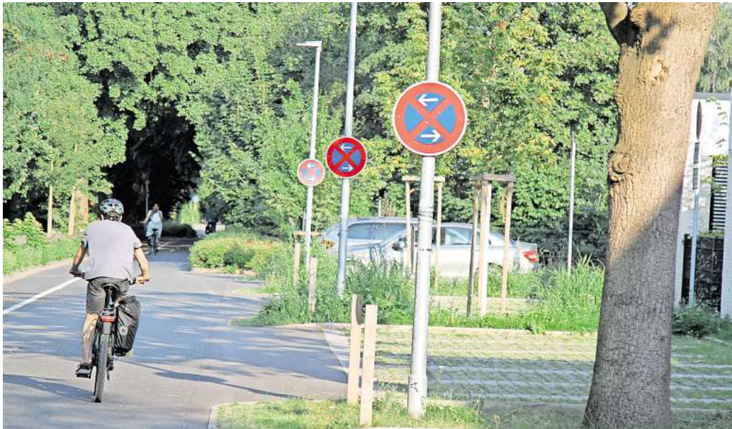
Schilderwald: Alle paar Meter weist an der Straße Auf dem Hagen ein Schild auf das bestehende Halteverbot hin. Es soll keine Ausreden für die autofahrenden Eltern mehr geben.

An der Grundschule Auf dem Hagen in Empelde zeigen Maßnahmen von Polizei und Verwaltung erste Erfolge. Wie ist das gelungen?