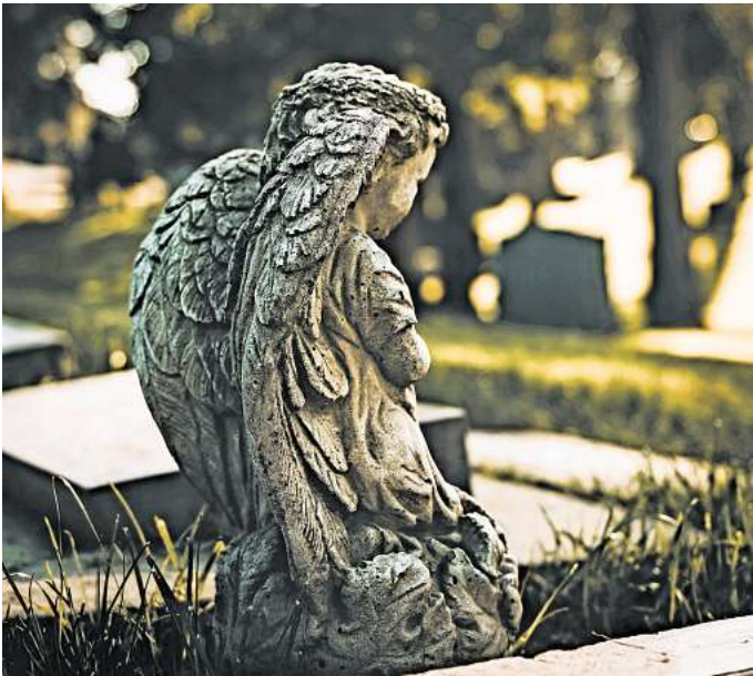
Der Friedhof ist ein Ort des Gedenkens, aber auch der lokalen Geschichte und der Ruhe und Erholung im Grünen.

Informationsständen sollen Interessierte am Tag des Friedhofs die Gelegenheit erhalten, Friedhöfe aus einer neuen Perspektive zu betrachten. Nicht nur soll der Umgang mit Tod und Trauer enttabuisiert werden, es geht auch darum, den Friedhof als Ort des Lebens zu begreifen, der Erholung und der Erinnerung.