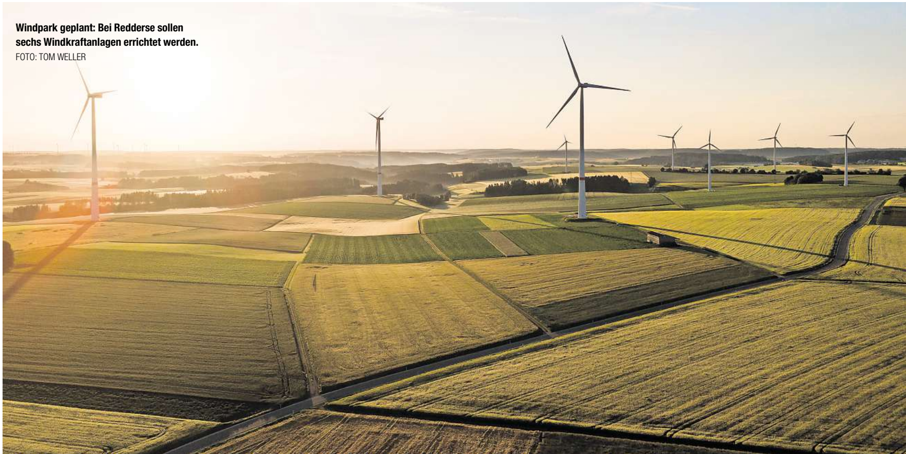
Windpark geplant: Bei Redderse sollen sechs Windkraftanlagen errichtet werden.