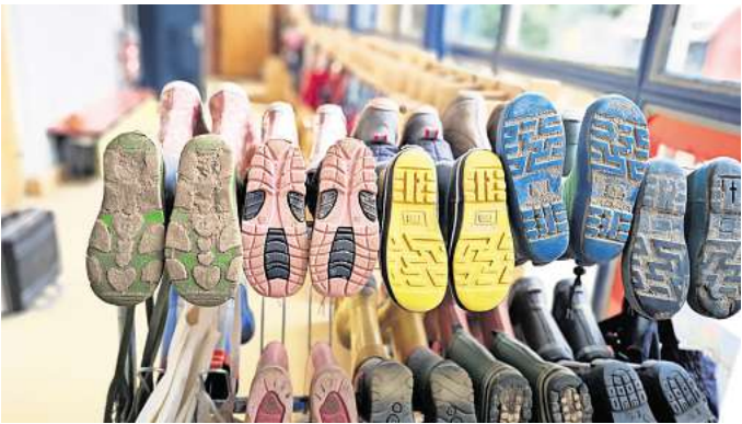
Fehlende Fachkräfte: Die Betreuungssituation in den Gehrden Kitas ist angespannt. Ab April können Kinder mit Inklusionsstaats in der Kita Am Castrum nicht mehr betreut werden.

Um einen Job in einer städtischen Einrichtung schmackhaft