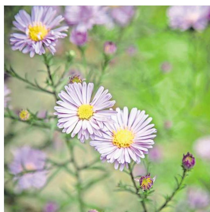
Die Freude am Garten im Herbst zu verlängern, gelingt auch mit Astern.

der Alu-Rahmenkonstruktion, dem geschlossenen Dachkörper und der anthrazitfarbenen Pulverbeschichtung auch die Ausleuchtung des Eingangsbereichs optimiert, indem die zuvor mittig platzierte Einbauleuchte durch leuchtstarke, rechteckige LED-Profile mit verbesserter