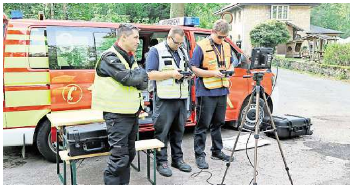
Ein Drohnteam ist mit dabei.

Im Nachgang soll nun das Konzept und die Ausstattung des neu aufgestellten Zuges zur Vegetationsbrandbekämpfung und zu Hochwasserschutzsystem analysiert werden. Hier fehlt es laut Feuerwehr noch an spezieller Ausstattung, um Vegetationsbrände schnell in den Griff zu bekommen. Entsprechendes Gerät und Fahrzeuge sollen in den nächsten Jahren beschafft werden.