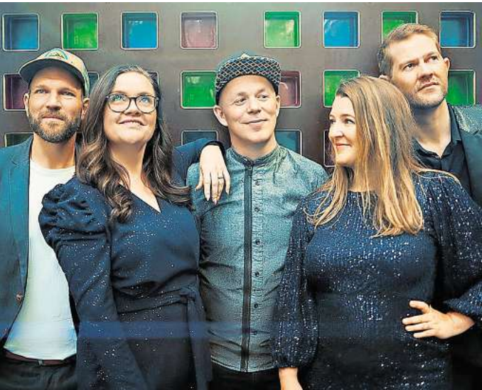
Postyr aus Dänemark – am 26. September im Pavillon

Die magaScene findet die interessantesten Festivals für Euch: Vom 26. bis 29. September dreht sich auf der chor.com alles um die Vokalmusik