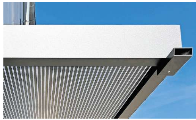
Die „Zebraplatte“ besteht aus einer klaren Polycarbonat-Stegplatte, die mit dunklen Längsstreifen versehen ist. So entsteht eine attraktive Optik mit außergewöhnlichem 3D-Effekt.

stabiler, wodurch sich nicht zuletzt die Garantie von fünf auf 15 Jahre erhöht. So wurde neben