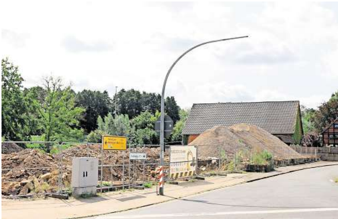
In Egestorf sollen an der Nienstedter Straße auf dem Grundstück der früheren Gaststätte Reinecke drei Mehrfamilienhäuser mit insgesamt 17 Eigentums- und Mietwohnungen entstehen.