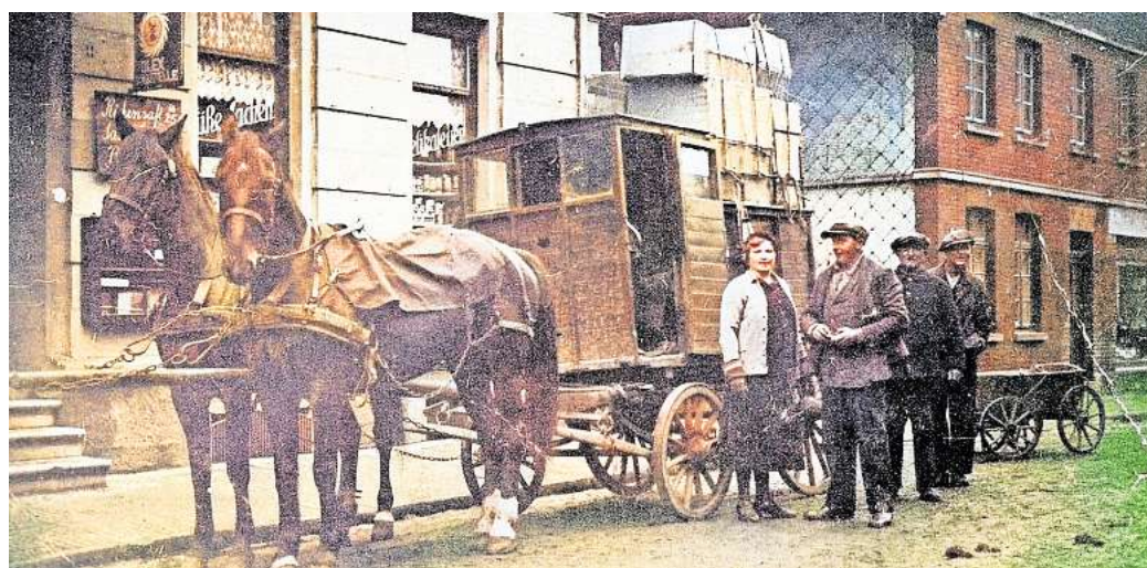
Pakete aus Hannover: Vor dem Laden Vocke am Steinweg ist dieses Foto 1935 aufgenommen worden. Dort wird der Paket-Transportwagen „Hannover – Gehrdens“ freudig begrüßt.

Eine Hoffnung, die auch in einem Programm der Region Hannover mündet: das Anlegen von naturnahen Hausgärten als lebendige Alternative zu Schotter und Kies. Mit dem eigenen Garten könne dazu beigetragen werden, Lebensräume für Flora und Fauna zu schaffen, heißt es. Mit einer Broschüre, die auch die Gehrdener Agenda-Gruppe verteilt, wird Aufklärungsarbeit geleistet. Dass dafür gewonnen werden muss, ist an sich etwas absurd. Denn: Grünflächen durch Schotter und Pflaster zu ersetzen, ist eigentlich rechtswidrig. Das Problem: Es fehlt an Personal, um diesen Teil der niedersächsischen Landesbauordnung auch durchzusetzen.