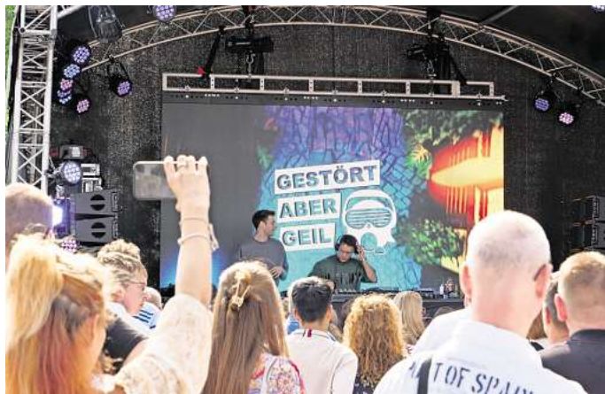
Ausgelassene Stimmung vor der Bühne.