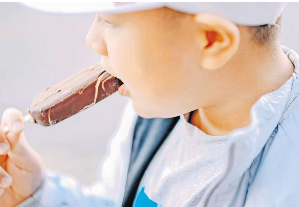
Mit gezielt an Kinder gerichtete Werbung werden diese früh an ungesunde Lebensmittel herangeführt.

Eine Übersichtsstudie amerikanischer Forscher hat gezeigt, dass an Kinder gerichtete Werbung sich auch auf das Verhalten der Eltern auswirkt. Diese sorgt nämlich dafür, dass Kinder