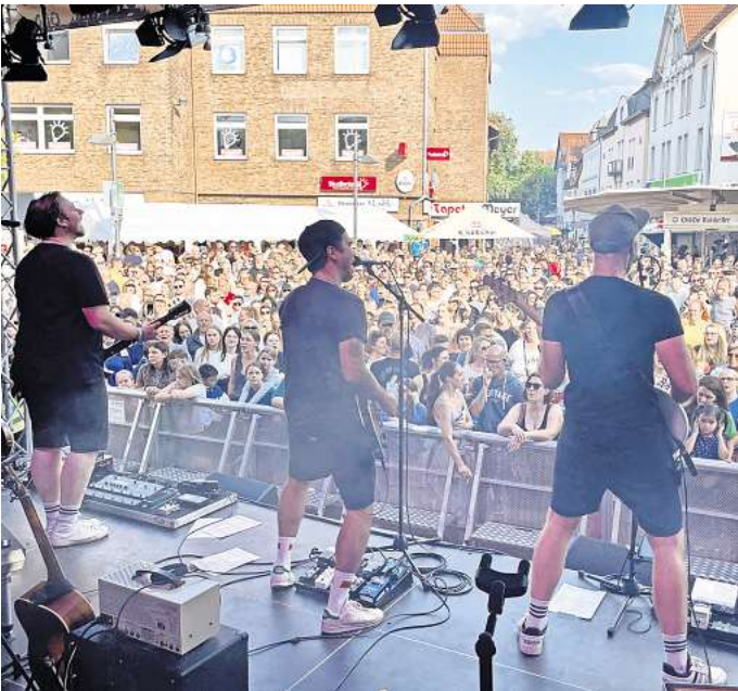
20 Jahre und kein bisschen leise: The Jetlags feiern in diesem Jahr ihren 20. Bandgeburtstag. Am Sonntag heizten sie auf dem Stadtfest in Barsinghausen ordentlich ein.