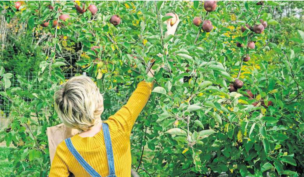
Der Spätsommer ist Erntezeit im Garten.

Im September lassen sich die Sonnenseiten der ausklingenden warmen Monate noch einmal richtig auskosten