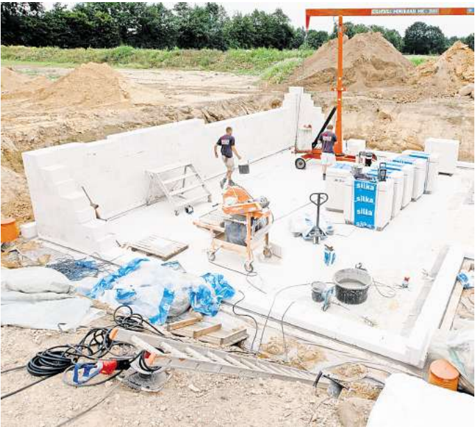
Mit Keller oder ohne? Ein Baugrundgutachten kann wichtige Informationen dazu liefern, aus denen sich Vorgaben für das geplante Bauvorhaben ergeben.

Sie rät, die beschrifteten Papiertütchen mit den Samen in verschließbaren Behältern wie Schraubgläsern oder Kunststoff-Boxen zu sammeln und sie in einem Schrank aufzubewahren. Dann könnten Tomaten auch nach vier Jahren noch problemlos angebaut werden. Gut zu wissen: Nicht jedes Saatgut hält sich so lange. Wer etwa Schnittlauch selbst vermehren will, der sollte dessen Samen unbedingt im Jahr nach der Ernte säen, so Drage. Sonst keimen sie nicht mehr.