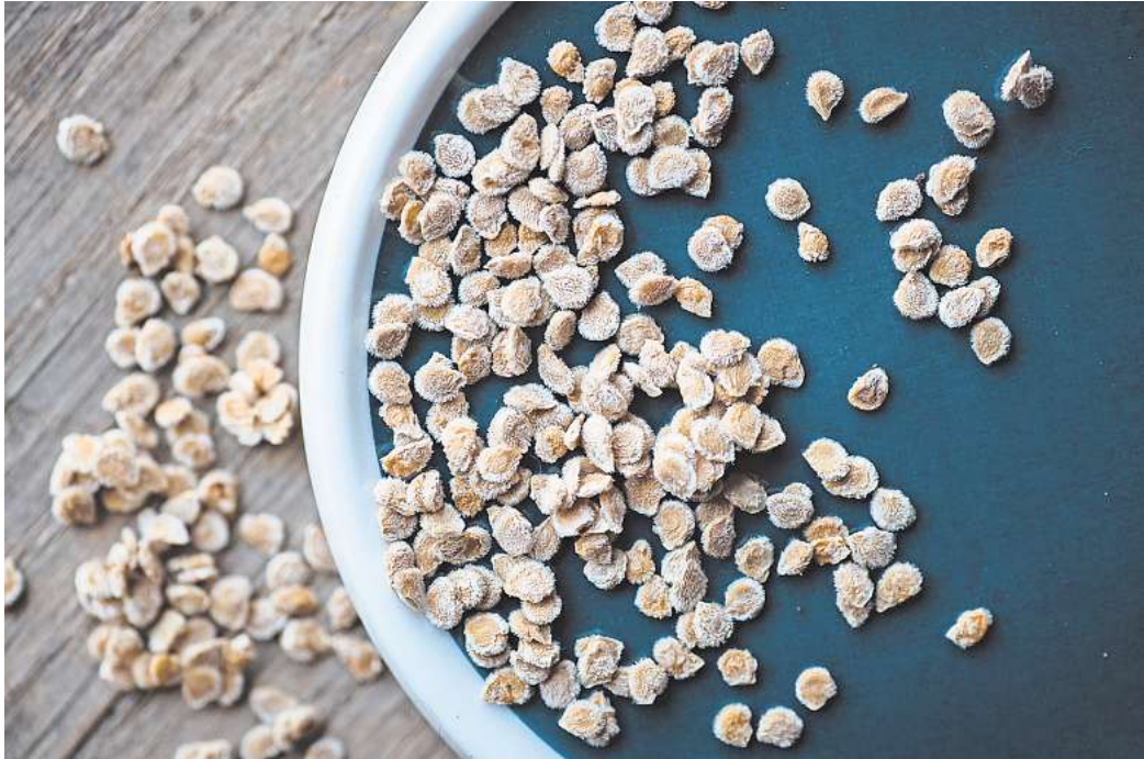
Das getrocknete Tomatensaatgut hält sich mehrere Jahre lang.