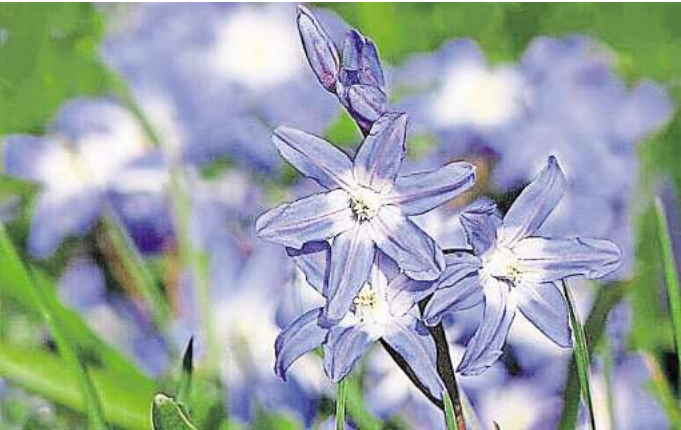
Blausternchenzwiebeln können ab Ende September in die Erde eingesetzt werden.

Auch wenn dieser kleine Pflegekniff schwerfällt, lohnt er sich: Früchte, die aus diesen spät befruchteten Blüten entstehen, würden nicht mehr ausreifen. Dafür stecken die Pflanzen ihre Kraft in den Geschmack und die Größe bereits vorhandener Früchte. Die Energie dafür gewinnen die Pflanzen aus der Photosynthese, die in den Blättern stattfindet. Deshalb bleiben die Blätter – anders als die Blüten – an der Pflanze. Zeigen Blätter allerdings braune Flecken oder andere Anzeichen von Krankheiten, schneiden Sie diese ab. Blausternchen stecken Mit dem Stecken der Tulpenzwiebeln können Sie sich noch Zeit bis einschließlich November lassen. Kleine Zwiebeln wie die