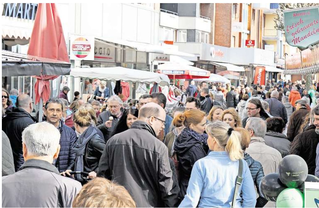
Die City von Barsinghausen: In der Deisterstadt leben relativ wenige Singles, dafür aber recht viele sehr alte Menschen.

Andersrum verhält es sich beim Anteil der Scheidungen. In der Region Hannover wird sich