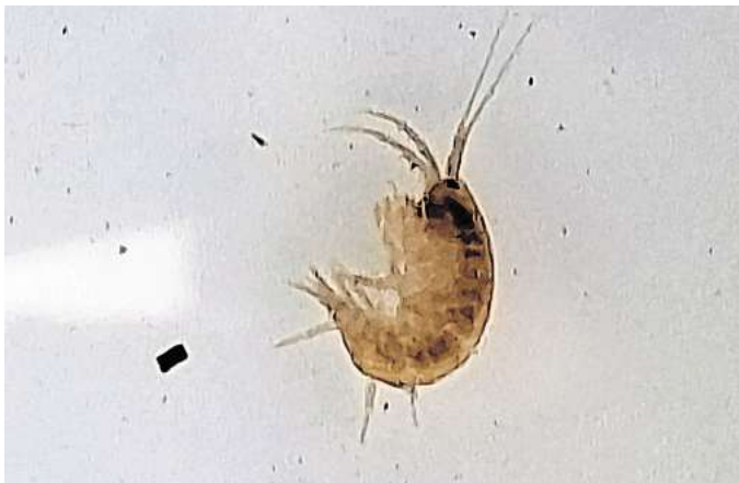
Da ist er wieder: So sehen die kleinen Flohkrebse aus.

Die nächsten Proben entnehmen die beiden Umweltschützer