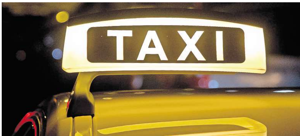
Für einen sicheren Heimweg: In Gehrden soll ein Frauennachttaxi eingeführt werden. (SYMBOLBILD)

Die Stadt Gehrden zahlt vom Preis jeder Fahrt 7 Euro, den Rest müssen die Frauen selbst übernehmen. Die Abrechnung kann laut Olbrich folgendermaßen ablaufen: Die Frauen zahlen bei der Person, die das Taxi fährt, den Fahrpreis, der auf dem Tachometer steht, abzüglich der 7 Euro der Stadt Gehrden. Das Taxi-