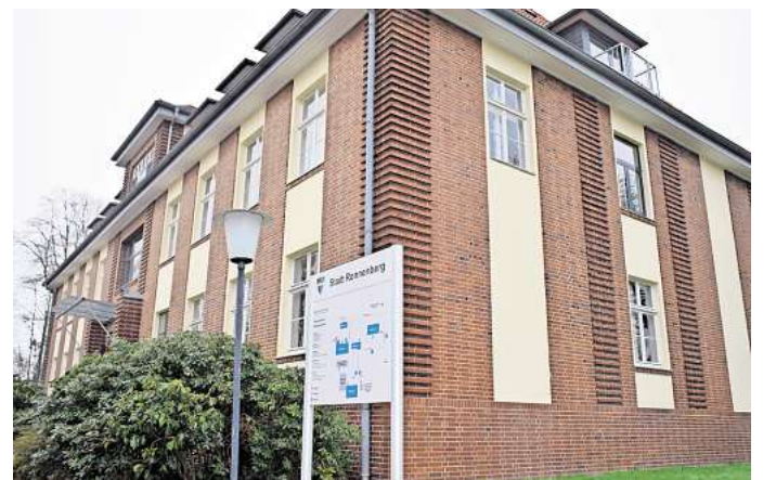
Sparzwang: Im Ronnenberger Rathaus dürfen die Rotstifte bereits angespitzt werden.

Weitere Informationen zu den einzelnen Ausbildungen und Studiengängen sind ebenfalls in den Stellenausschreibungen auf der Internetseite der Stadt zu finden.