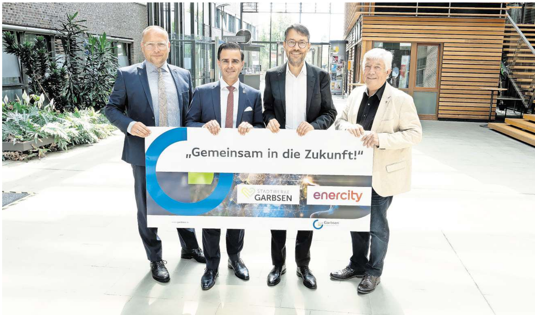
Der hannoversche Energieversorger Enercity übernimmt das Strom- und Gasnetz der Stadtwerke Garbsen und zahlt dafür einen mittleren zweistelligen Millionenbetrag.

Die hohen Investitionssummen in die vielerorts veraltete Infrastruktur muss dann der Konzern stemmen. Er wolle den Aufwand nicht verniedlichen, betonte Finanzvorstand Hansmann, aber das gehöre zum Standardgeschäft und man sei dafür gut gerüstet. Den Verkaufspreis bezeichneten die Parteien als „fair und marktüblich“.