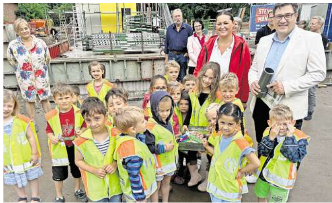
Vorfreude auf die neue Kita: Bei der Grundsteinlegung in Holtensen füllten die Kinder mit Bürgermeister Ingo Klokemann ihre Zeitkapseln.

Mehr Räume? Ja. Ein großes Außengelände? Auch das. Viele Wünsche kann die Gemeinde mit dem Neubau erfüllen. Auf zweieinhalb Geschossen gibt es Platz für zwei Kindergartengruppen mit jeweils 25 Kindern und eine Krippengruppe. Im Erdgeschoss werden die 15 Krippenkinder be-