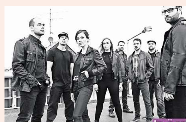
Bewährungsprobe bestanden: Die Rhythm-and-Blues-Band Bäm ist zum zweiten Mal beim Barsinghäuser Stadtfest dabei.

17.30 Uhr The Steris, Live-Musik 21 Uhr ollie-smalls, Coverband, Live-Musik ■ REWE-Bühne bei Speckmann 11 Uhr Söhnke „DJ“ Alby, DJ-Musik 14 Uhr Fight Club Basche 15 Uhr Prisma, Coverband, Live-Musik 17.30 Uhr Riesen Ding, Live-Musik 21 Uhr – 0 Uhr Bitter Sweet Alley, Live-Musik ■ Kinder-Event-Bühne hinter dem Rathaus 12 – 18 Uhr Kinderfest, Interaktion 12 – 17 Uhr Blaulicht Ausstellung 15 Uhr Kijuciba, Kinder- und Jugendzirkus 16 Uhr Heiner Rusche, Live-Musik für Kinder