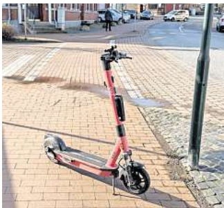
Soll bald ein Ende haben: E-Scooter, die an Ampeln und auf Geh- und Radwegen abgestellt werden, ärgern und gefährden Fußgänger und Radfahrer.

Außerdem setzt die Verwaltung auf ausgewiesene Abstellflächen, wo die E-Scooter nach