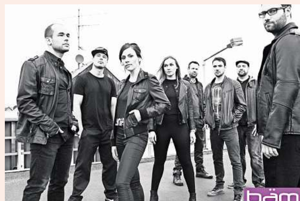
Bewährungsprobe bestanden: Die Rhythm-and-Blues-Band Bäm ist zum zweiten Mal beim Barsinghäuser Stadtfest dabei.