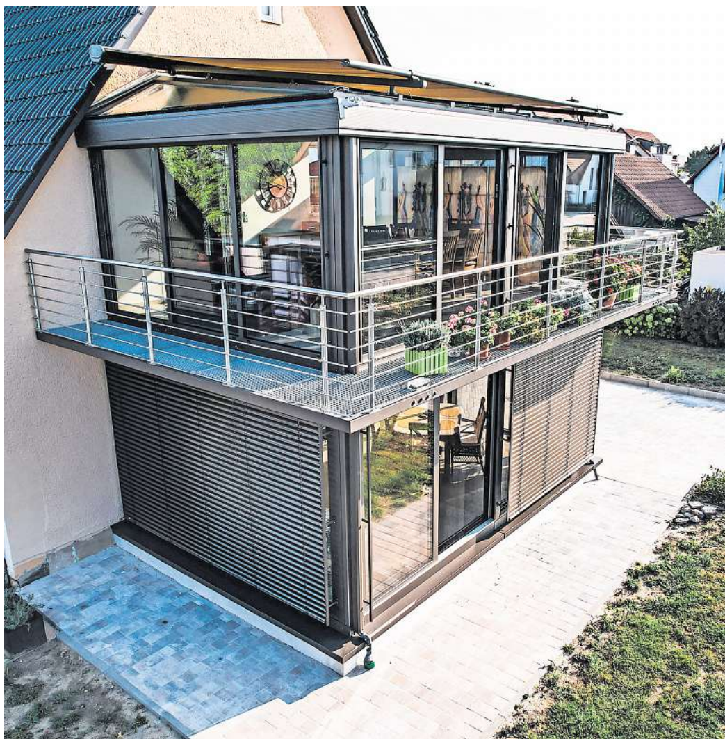
Lust auf einen Wintergarten? Mit diesem Balkonverglasungssystem kann jeder Balkon auch nachträglich in einen geschützten Bonusraum verwandelt werden.

Der zusätzliche, vorgelagerte Raum wirkt auch als thermische Pufferzone und bildet eine zweite Fassade. In der Folge bleiben die Wohnräume im Sommer kühler und im Winter wärmer. Unüberhörbar ist die erhebliche Schalldämmung von 17 dB – insbesondere Balkone in der Nähe von Straßen, Schienen, Flugrouten