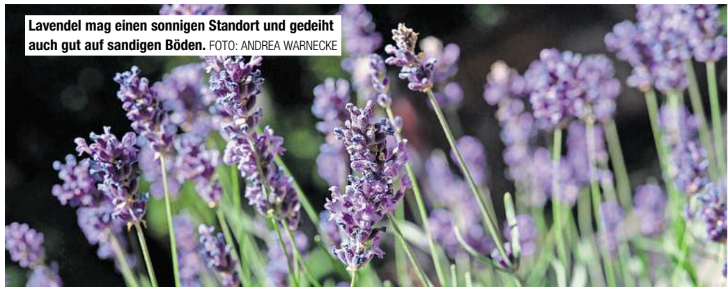
Lavendel mag einen sonnigen Standort und gedeiht auch gut auf sandigen Böden.