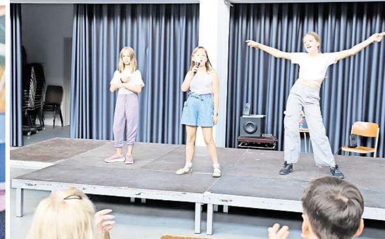
Proben: Im Kulturzentrum Krawatte proben die teilnehmenden Kids für ihren großen Auftritt bei der Mini-Playback-Show.

Bei der Tombola winken in diesem Jahr hochwertige Preise wie Fahrräder, Handys, ein Küchengerät und eine Klimaanlage. Die Lose werden während des Stadtfestes verkauft. „Dabei erhalten wir in diesem Jahr Unterstützung von Mitgliedern der Deister-Freizeit-Bühne in Kostümen der aktuellen Stücke“, teilte Huschke mit. Der Lospreis beträgt zwei Euro, die Verlosung findet am Samstag um 19 Uhr auf der Glide-Bühne am Thie statt.