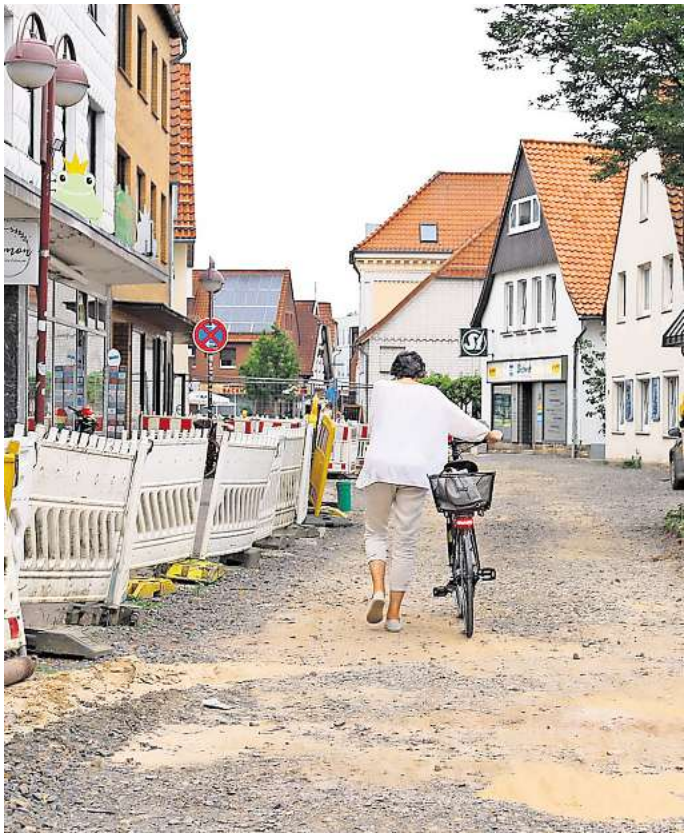
Schwer zugänglich, viel Schmutz, keine Parkplätze und deshalb auch weniger Laufkundschaft: Die Geschäftsleute entlang der Dammstraße leiden enorm unter den Folgen der Bauarbeiten.