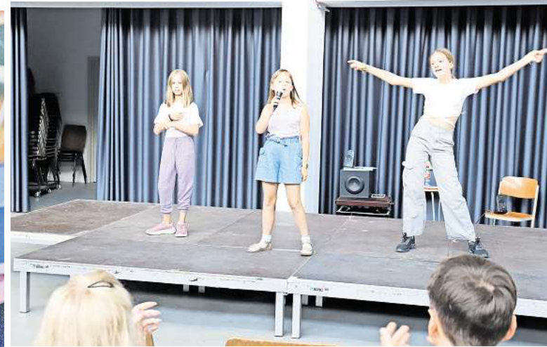
Proben: Im Kulturzentrum Krawatte proben die teilnehmenden Kids für ihren großen Auftritt bei der Mini-Playback-Show.

Bei der Tombola winken in diesem Jahr hochwertige Preise wie Fahrräder, Handys, ein Küchengerät und eine Klimaanlage. Die Lose werden während des Stadtfestes verkauft. „Dabei erhalten wir in diesem Jahr Unterstützung von Mitgliedern der Deister-Freilicht-Bühne in Kostümen der aktuellen Stücke“, teilte Huschke mit. Der Lospreis beträgt zwei Euro, die Verlosung findet am Samstag um 19 Uhr auf der Glide-Bühne am Thie statt.