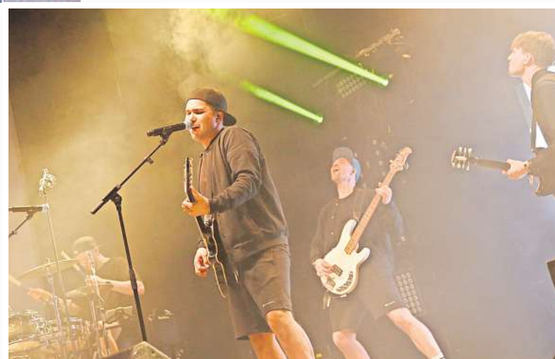
Auf Tour: Das Barsinghäuser Stadtfest ist fester Bestandteil auf der langen Tourdatenliste von The Jetlags.