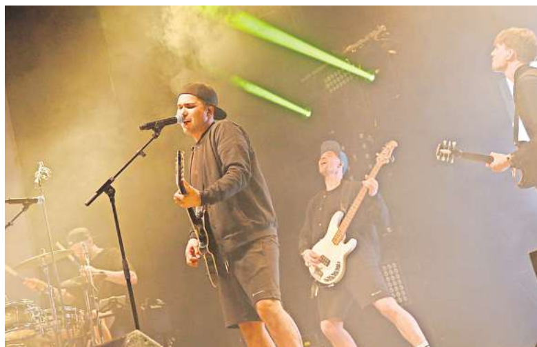
Auf Tour: Das Barsinghäuser Stadtfest ist fester Bestandteil auf der langen Tourdatenliste von The Jetlags.