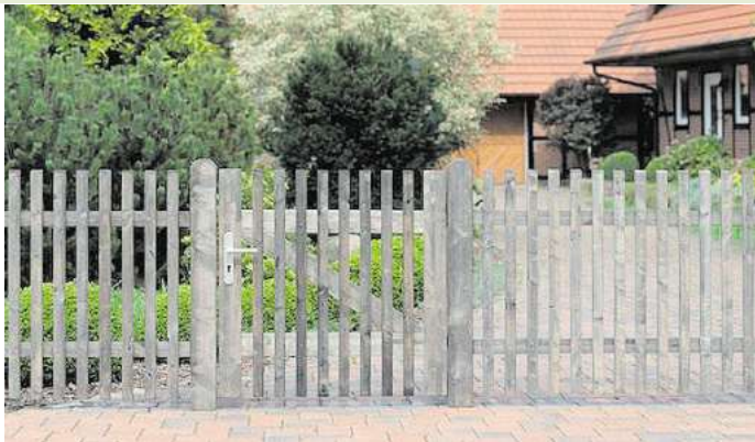
Puristisch gebaut, natürlich vergraut – ein Staketzaun aus druckimprägniertem Massivholz fügt sich harmonisch in jede Landschaft ein.

0,9 Tonnen CO 2 gespeichert, und zwar im Baum ebenso wie im verarbeiteten Produkt. Es wird erst wieder frei, wenn das Holz kompostiert oder verbrannt wird. Je länger also die Lebensdauer von Gartenzäunen ist, desto mehr profitieren Umwelt und Geldbeutel. Auf Qualität zu achten, zahlt sich hier doppelt aus.