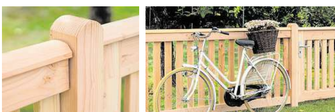
Stabile, wasserableitende Rahmen und Pfosten machen Holzläste besonders haltbar.