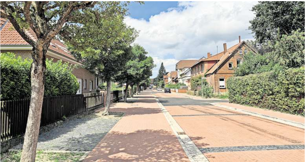
Viel Platz für Fußgänger: Der breite Gehweg unter den Zierapfelbäumen soll der umgebauten Bahnhofstraße den Charakter einer Allee verleihen.

Die Bauverwaltung nutzte den notwendigen Vollausbau, um das gesamte Straßenbild zu verändern und die Maße der Fahrbahn sowie der Fußwege neu zu ordnen. Das Ergebnis: Die Straße ist mit 5,50 Meter jetzt etwas schmaler als vorher, bietet aber noch immer genügend Platz für zwei sich begegnende Lkw. Auch die Parkplätze auf beiden Fahrbahnseiten blieben erhalten. Wenn Fahrradfahrer die geparkten Fahrzeuge umfahren,