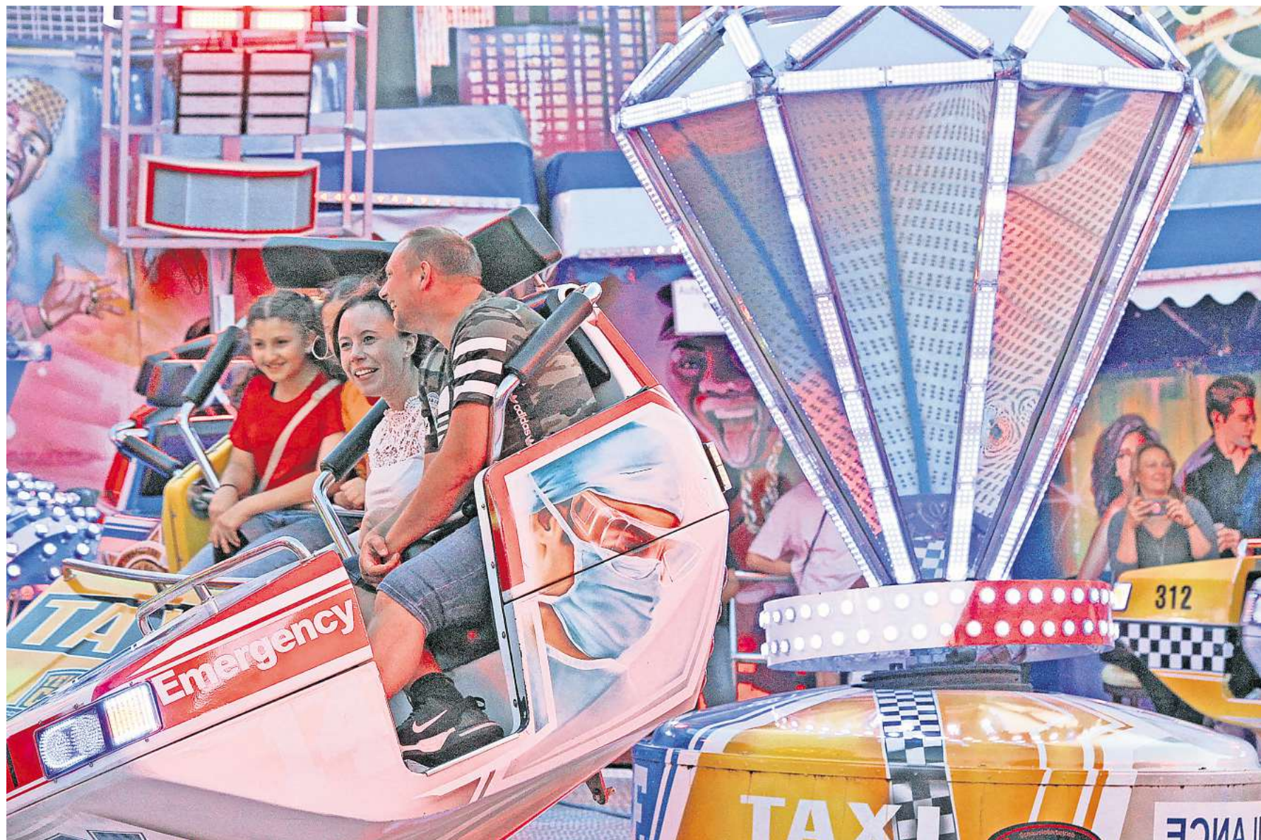
Autoscooter, Breakdance, Berg- und Talbahn, Kettenkarussell, ein Flugsimulator und einiges mehr werden wieder im Kirmesbereich auf dem Parkplatz Breite Straße zu finden sein.