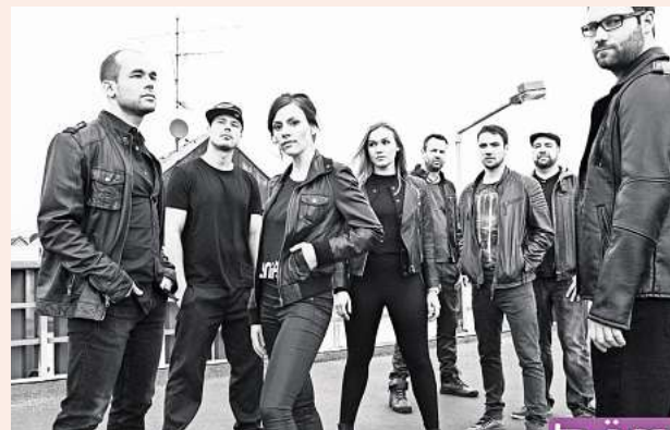
Bewährungsprobe bestanden: Die Rhythm-and-Blues-Band Bäm ist zum zweiten Mal beim Barsinghäuser Stadtfest dabei.

14 Uhr DJ Fabian, DJ-Musik 15 Uhr Mind in the gap, Coverband, Live-Musik 18.30 Uhr – 22 Uhr Bäm, Live-Musik ■ REWE-Bühne bei Speckmann 11 Uhr Söhnke „DJ“ Alby, DJ-Musik 12 Uhr Hart Berg, Live-Musik 14.30 Uhr Don't feed the ducks, Live-Musik 18 Uhr Mit 18 Band, Westernhagen Cover-Band, Live-Musik ■ Kinder-Event-Bühne hinter dem Rathaus 11 Uhr – 19 Uhr Kinderfest, Interaktion 13 Uhr – 15 Uhr Mini Playback Show, Interaktion 16 Uhr – 17 Uhr Randale, Live-Musik für Kinder ■ Klosterkirche 10 Uhr Ökumenischer Stadtfestgottesdienst ■ Café im Kloster 14 Uhr – 18 Uhr Kaffee und Kuchen mit den Johannitern ■ Kirmes 11 Uhr – 21 Uhr Fahrgeschäfte