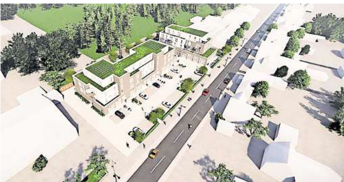
So könnte es aussehen: Geht es nach den Vorstellungen des Investors, dann könnten an der Egestorfer Straße zwei Gebäude entstehen, die Wohnungen sowie Geschäfte und Praxisräume aufnehmen. GRAFIK: GUDER HOFFEND ARCHITEKTEN

In den Obergeschossen soll öffentlich geförderter Wohnraum, also Sozialwohnungen, entstehen. Die Architekten planen bisher mit Ein-Personen- bis zu Sieben-Personen-Wohnungen – insgesamt 32 Wohneinheiten auf