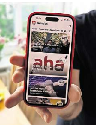
Start frei: Die Stadt Gehrden hat nun eine eigene App.

Beim Öffnen der Gehrden-App erfährt die Bürgerin oder der Bürger gegenwärtig, dass die Stadt neue Azubis eingestellt hat, wie die Mülltrennung verbessert werden kann oder dass die Stadt Gehrden mit der kommunalen Wärmeplanung begonnen hat. In zahlreichen Rubriken wie „Rathaus“, „Baustellen“, „Familie“ bis hin zu „Kultur“, „Senioren“ und „Sport“ soll die App schnell