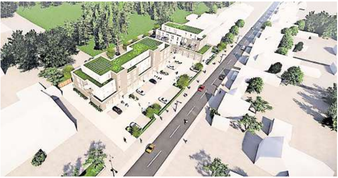
So könnte es aussehen: Geht es nach den Vorstellungen des Investors, dann könnten an der Egestorfer Straße zwei Gebäude entstehen, die Wohnungen sowie Geschäfte und Praxisräume aufnehmen. GRAFIK: GUDER HOFFEND ARCHITEKTEN

In den Obergeschossen soll öffentlich geförderter Wohnraum, also Sozialwohnungen, entstehen. Die Architekten planen bisher mit Ein-Personen- bis zu Sieben-Personen-Wohnungen – insgesamt 32 Wohneinheiten auf