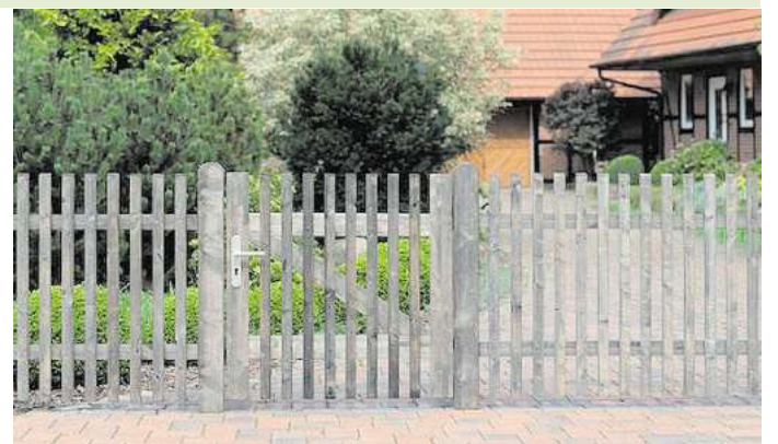
© SCHEERER / Könnker Holzhandlung Puristisch gebaut, natürlich vergraut – ein Staketzaun aus druckimprägniertem Massivholz fügt sich harmonisch in jede Landschaft ein.

0,9 Tonnen CO 2 gespeichert, und zwar im Baum ebenso wie im verarbeiteten Produkt. Es wird erst wieder frei, wenn das Holz kompostiert oder verbrannt wird. Je länger also die Lebensdauer von Gartenzäunen ist, desto mehr profitieren Umwelt und Geldbeutel. Auf Qualität zu achten, zahlt sich hier doppelt aus.