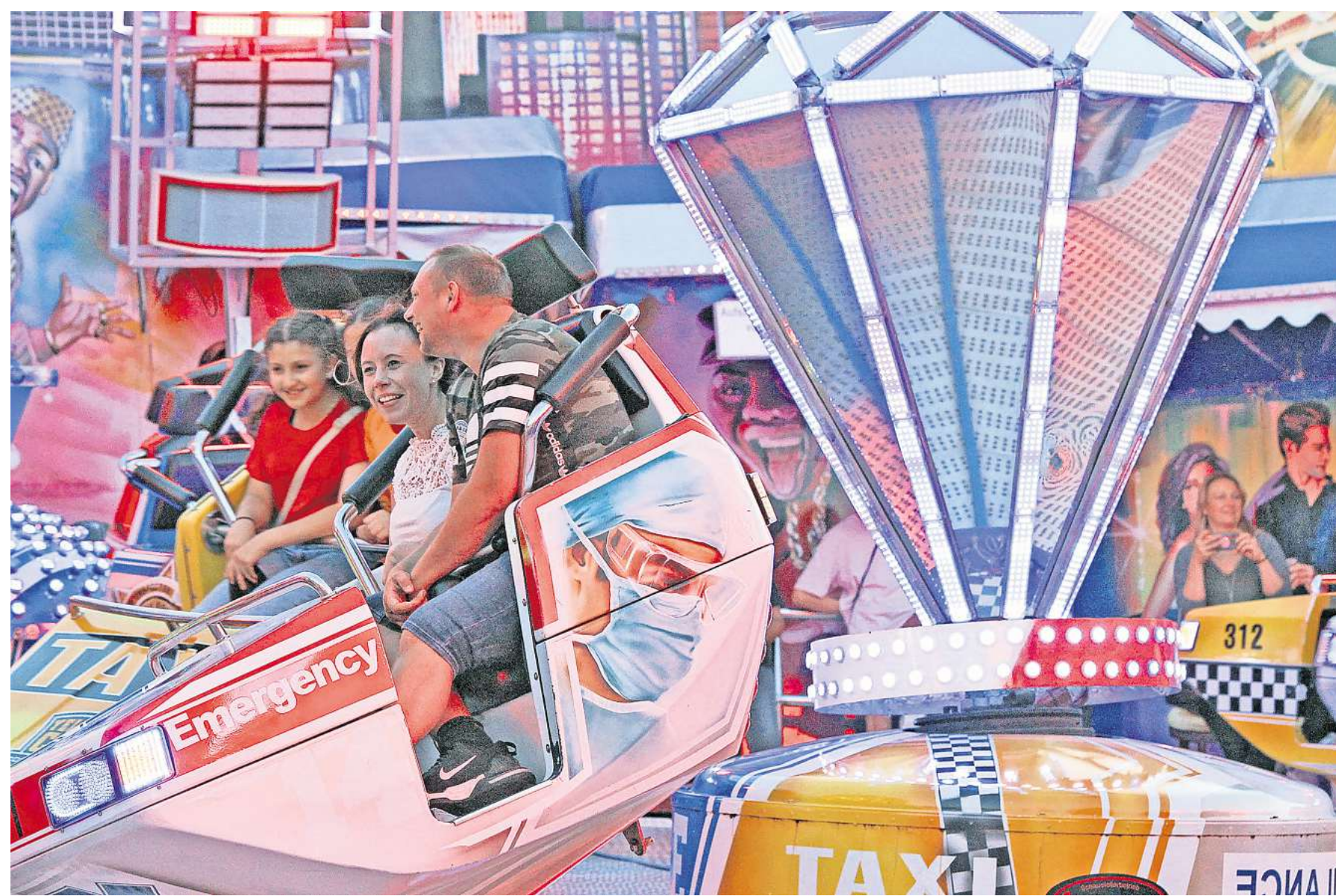
Autoscooter, Breakdance, Berg- und Talbahn, Kettenkarussell, ein Flugsimulator und einiges mehr werden wieder im Kirmesbereich auf dem Parkplatz Breite Straße zu finden sein.