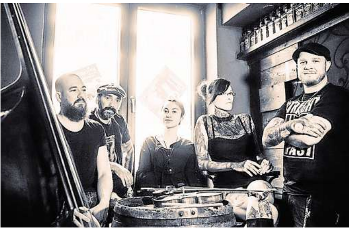
Feinster Pub Rock mit The Hoochigans am 23. August.

Los geht es am Freitag um 15 Uhr. Ab 16 Uhr gibt es dann knackigen Indie-/Post-Punk von den Parting Gyfts. Ab 17.30 Uhr ste-