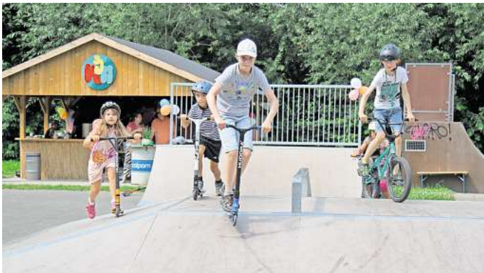
Die Kinder geben schon Vollgas: Der Jugendplatz Egestorf hat nun eine Skateranlage.

Die große Fläche vor dem Kinder- und Jugendhaus gab es be-