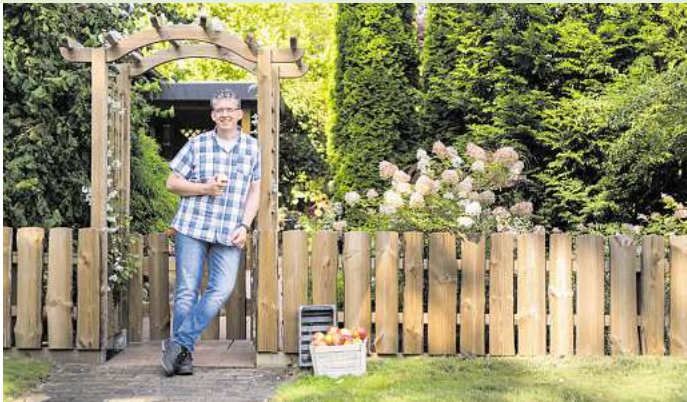
Ein Gartenzaun aus Massivholz bildet den perfekten Rahmen für Haus und Grundstück.

Zäune aus Massivholz bieten viele Gestaltungsmöglichkeiten, lassen sich einfach bearbeiten und passen sich optisch und funktional an jedes Gelände an. Wer Traditionen liebt, wählt den klassischen Jägerzaun; Puristen bevorzugen zeitlos elegante Staket- oder Lattenzäune. Dabei sind alle Modelle äußerst robust und pflegeleicht: Eine Kesseldruckimprägnierung mit RAL-Gütesiegel macht sorgfältig ausgesuchtes, heimisches Nadelholz genauso haltbar wie Tropenholz. Douglasienholz ist dank des hohen Gerbsäureanteils von Natur aus äußerst widerstandsfähig. Bei korrekter Montage, also mit einer wasserableitenden Konstruktion ohne Erdkontakt, benötigen diese Hölzer keine Pflege, um jahrzehntelang zu halten. Farbig behandelte Holzläste freuen sich hin und wieder über einen Anstrich, sie sehen dann einfach schöner aus.