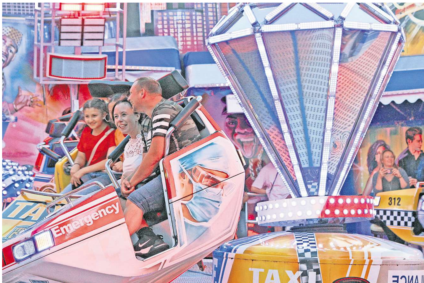
Autoscooter, Breakdance, Berg- und Talbahn, Kettenkarussell, ein Flugsimulator und einiges mehr werden wieder im Kirmesbereich auf dem Parkplatz Breite Straße zu finden sein.