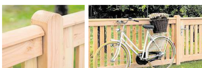
Stabile, wasserableitende Rahmen und Pfosten machen Holzläste besonders haltbar.