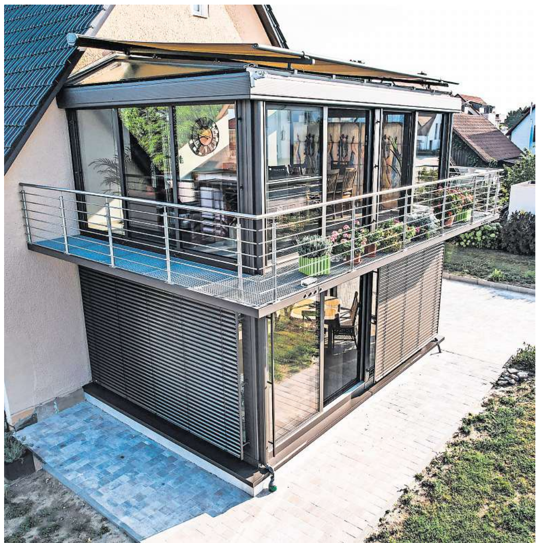
Lust auf einen Wintergarten? Mit diesem Balkonverglasungssystem kann jeder Balkon auch nachträglich in einen geschützten Bonusraum verwandelt werden.

Der zusätzliche, vorgelagerte Raum wirkt auch als thermische Pufferzone und bildet eine zweite Fassade. In der Folge bleiben die Wohnräume im Sommer kühler und im Winter wärmer. Unüberhörbar ist die erhebliche Schalldämmung von 17 dB – insbesondere Balkone in der Nähe von Straßen, Schienen, Flugrouten