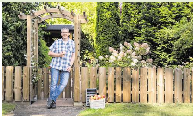
Ein Gartenzaun aus Massivholz bildet den perfekten Rahmen für Haus und Grundstück.

Zäune aus Massivholz bieten viele Gestaltungsmöglichkeiten, lassen sich einfach bearbeiten und passen sich optisch und funktional an jedes Gelände an. Wer Traditionen liebt, wählt den klassischen Jägerzaun; Puristen bevorzugen zeitlos elegante Staket- oder Lattenzäune. Dabei sind alle Modelle äußerst robust und pflegeleicht: Eine Kesseldruckimprägnierung mit RAL-Gütesiegel macht sorgfältig ausgesuchtes, heimisches Nadelholz genauso haltbar wie Tropenholz. Douglasienholz ist dank des hohen Gerbsäureanteils von Natur aus äußerst widerstandsfähig. Bei korrekter Montage, also mit einer wasserableitenden Konstruktion ohne Erdkontakt, benötigen diese Hölzer keine Pflege, um jahrzehntelang zu halten. Farbig behandelte Holzlände freuen sich hin und wieder über einen Anstrich, sie sehen dann einfach schöner aus.