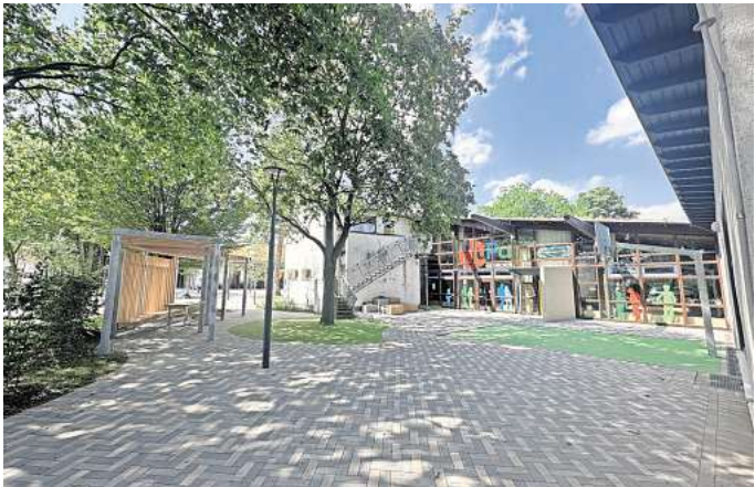
Umgestaltet: Neues Pflaster, neuer Basketballkorb und neue Sitzgelegenheiten - der Vorplatz am Jugendpavillon hat sich sichtbar verändert.

Ganz so wird der neue Platz nicht zwar aussehen, doch die Wünsche werden weitestgehend erfüllt. Im Zusammenspiel mit dem