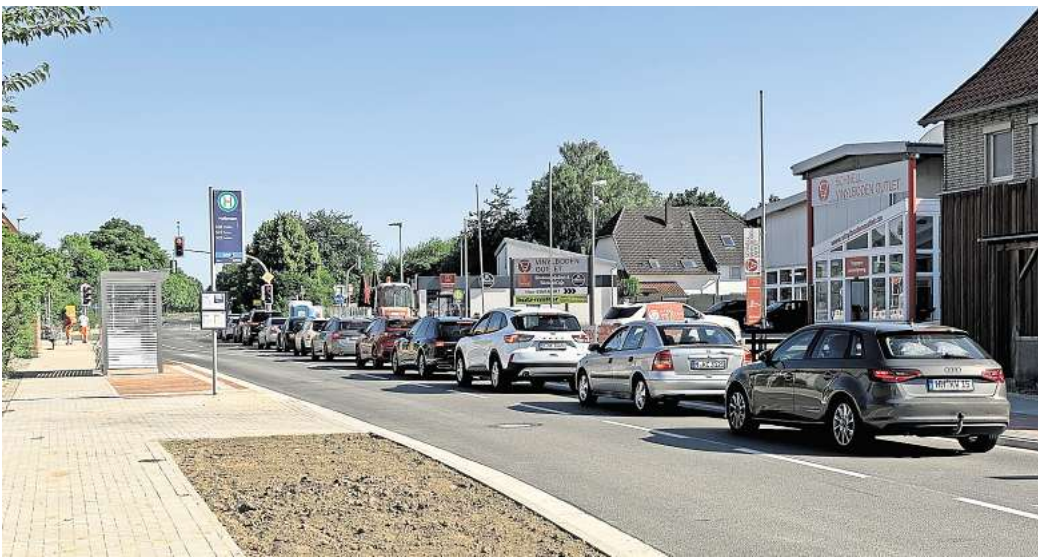
Längere Grünphasen für den Durchgangsverkehr in Holtensen. Bauträger kontert Kritik an geänderten Fahrspuren.

hr täglich etwa 15.000 Pkw und 600 Lkw durch den Wennigser Ortsteil. Um diesen Pendlerstrom nicht über Gebühr auszu-