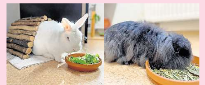
Wit und Friday.

Tierschutzverein Barsinghausen und Umgebung Ludwig-Jahn-Straße 11a 30890 Barsinghausen Telefon (05105) 7736777