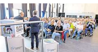
Der Vortrag „Solarenergie vom eigenen Dach – Strom, Wärme oder beides?“ bietet Hintergrundinfos, Tipps und zahlreiche Hinweise.

S olarenergie lohnt sich – für Ihren Geldbeutel und fürs Klima. Ob und wie sich die eigene Dachfläche nutzen lässt, um Strom aus Sonnenenergie zu gewinnen, welche Erträge sich erzielen lassen, welche Anlage zum jeweiligen Gebäude passt und welche Fördermöglichkeiten es gibt, erfahren interessierte Hausbesitzer am Dienstag, 6. August, um 18 Uhr im Bürgersaal des Rathauses, Kirchstraße 1-3, 30989 Gehrden.