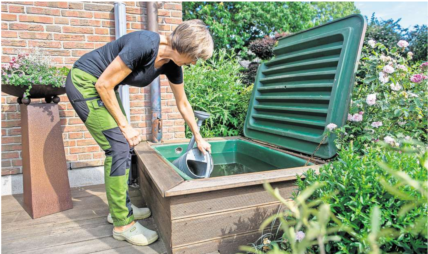
Die Morgen- oder Abendstunden sind die besten Zeiten, um Garten- und Balkonpflanzen zu gießen.

1. Bewusster Konsum, Verschwendung vermeiden: Der Kauf regionaler und saisonaler Produkte sowie die Reduzierung von Fleischkonsum können den