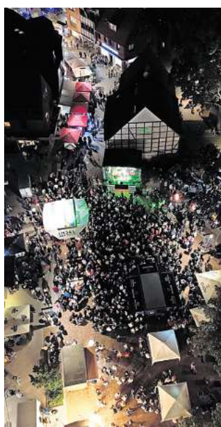
Blick von oben: Im Vorjahr lockte vor allem das Musikprogramm die Menschen in die Innenstadt.

Neu ist auch, dass das Gehrden Stadtfest in diesem Jahr Teil des Regionsentdeckertages sein wird. Am Sonntag, 8. September, werden sich daher verschiedene Vereine in der Innen-