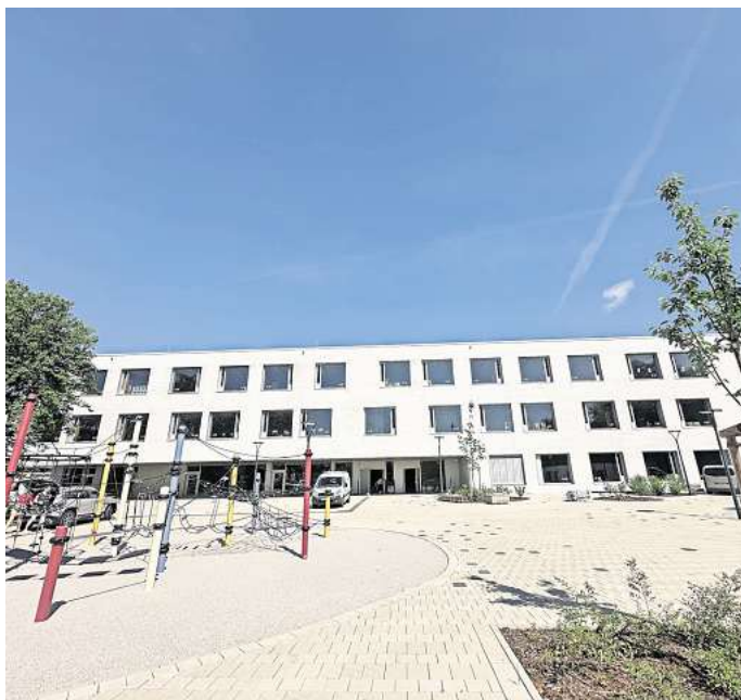
Neue Schule: Ab Montag, 5. August, wird an der neuen, vierzügigen Grundschule Am Langen Feld der Unterricht beginnen.