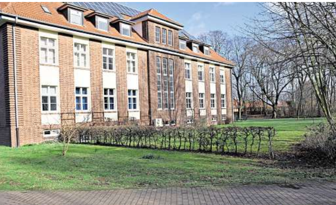
Platz für Neues: Der Garten auf der Rückseite des Ronnenberger Rathauses in Empelde ist bislang relativ nüchtern gestaltet.

„Wir wollen zeigen, dass das Rathaus nicht nur ein Ort der Verwaltung ist“, erläutert der Bürgermeister. Die Fläche soll für die Menschen im Ort nutzbar gemacht werden, Familien sollen dort zusammenkommen können. Kern der neu gestalteten Fläche soll nach Kratzkes Vorstellung ein Abenteuerspielplatz mit einer Matschanlage sein, der auf der Rückseite des Rathauses zur Hansastraße hin entstehen soll. Damit will die Verwaltung auch eine vorhandene Lücke schließen. „Wir haben in Ronnenberg eine gute Ausstat-