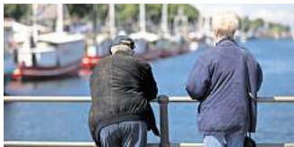
Sehen wir eine gemeinsame Zukunft? Auch wenn beide auf die 80 zugehen, kann die Antwort „Nein“ lauten.