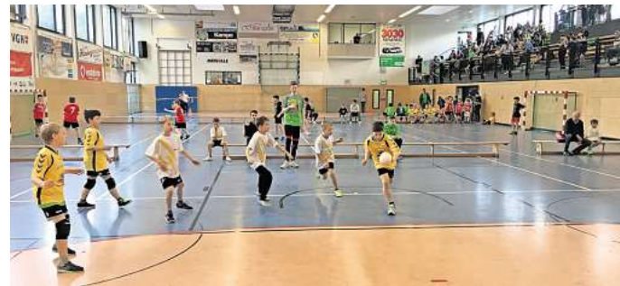
Hier wird Sport getrieben: Alle Sportstätten in Barsinghausen, wie hier die Glück-Auf-Halle, wurden von der Berliner Agentur mit Blick auf den Sportentwicklungsplan untersucht.

„Wir haben zuletzt den Prozess wiederbelebt. Die Ergebnis-