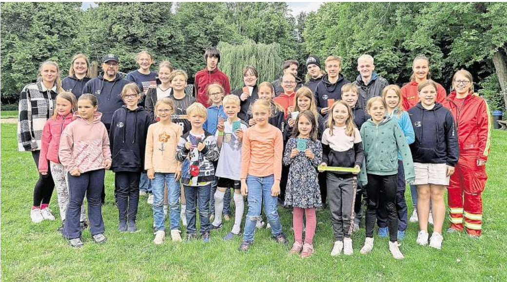
Übergabe: 20 Schwimm- und 16 Rettungsschwimmabzeichen wurden im vergangenen halben Jahr bei der DLRG Wennigsen absolviert.

Wer ein Rettungsschwimmabzeichen ablegt, müsse ebenfalls in der Lage sein, in Not geratene Menschen im und am Wasser mit Hilfe von Rettungsgeräten, wie einem Gurtretter oder einem Rettungsbrett an Land zu bringen