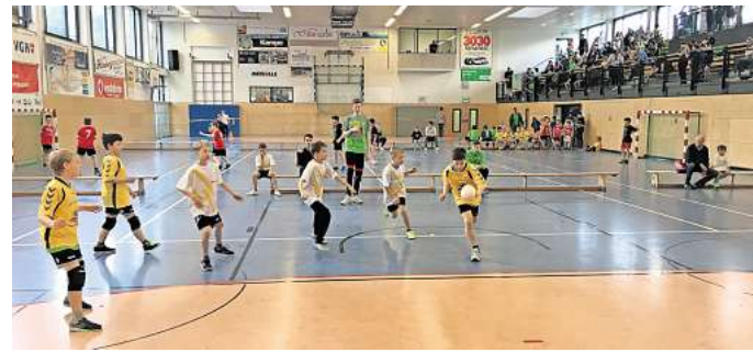
Hier wird Sport getrieben: Alle Sportstätten in Barsinghausen, wie hier die Glück-Auf-Halle, wurden von der Berliner Agentur mit Blick auf den Sportentwicklungsplan untersucht.

„Wir haben zuletzt den Prozess wiederbelebt. Die Ergebnis-