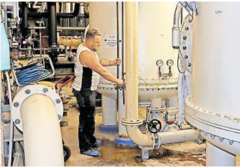
Ein Keller voll Technik: Dass sich die Anlage unter dem Schwimmbad befindet, ist nicht mehr zeitgemäß.

Die Aufgabe der Verwaltung gemeinsam mit der Gehrdenener Politik sei es jetzt, einen Weg zu finden, wie man diese Umbauten und Sanierungen angeht. „Ich glaube,