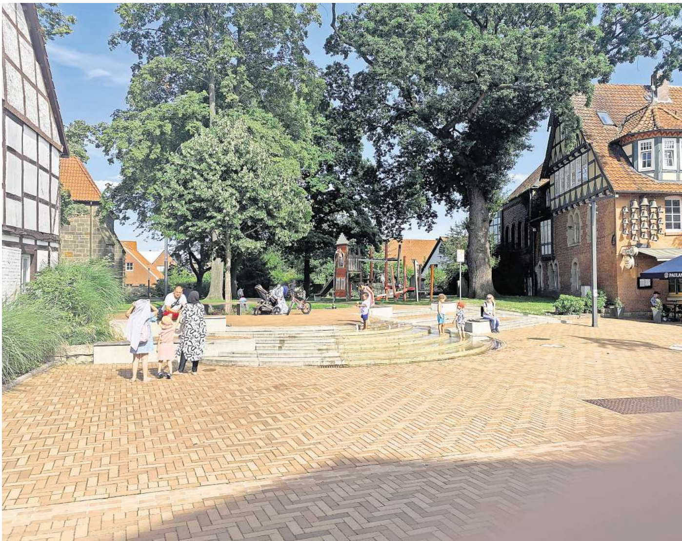
Beliebtes Ziel bei Familien: Das Wasserspiel am Marktplatz und das dahinterliegende Klettergerüst im Kirchhof.