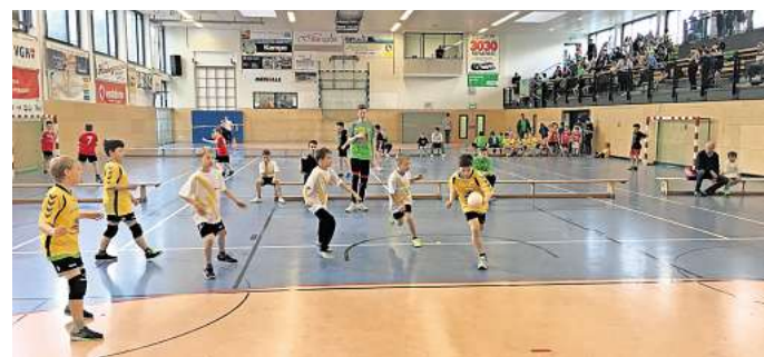
Hier wird Sport getrieben: Alle Sportstätten in Barsinghausen, wie hier die Glück-Auf-Halle, wurden von der Berliner Agentur mit Blick auf den Sportentwicklungsplan untersucht.

„Wir haben zuletzt den Prozess wiederbelebt. Die Ergebnis-