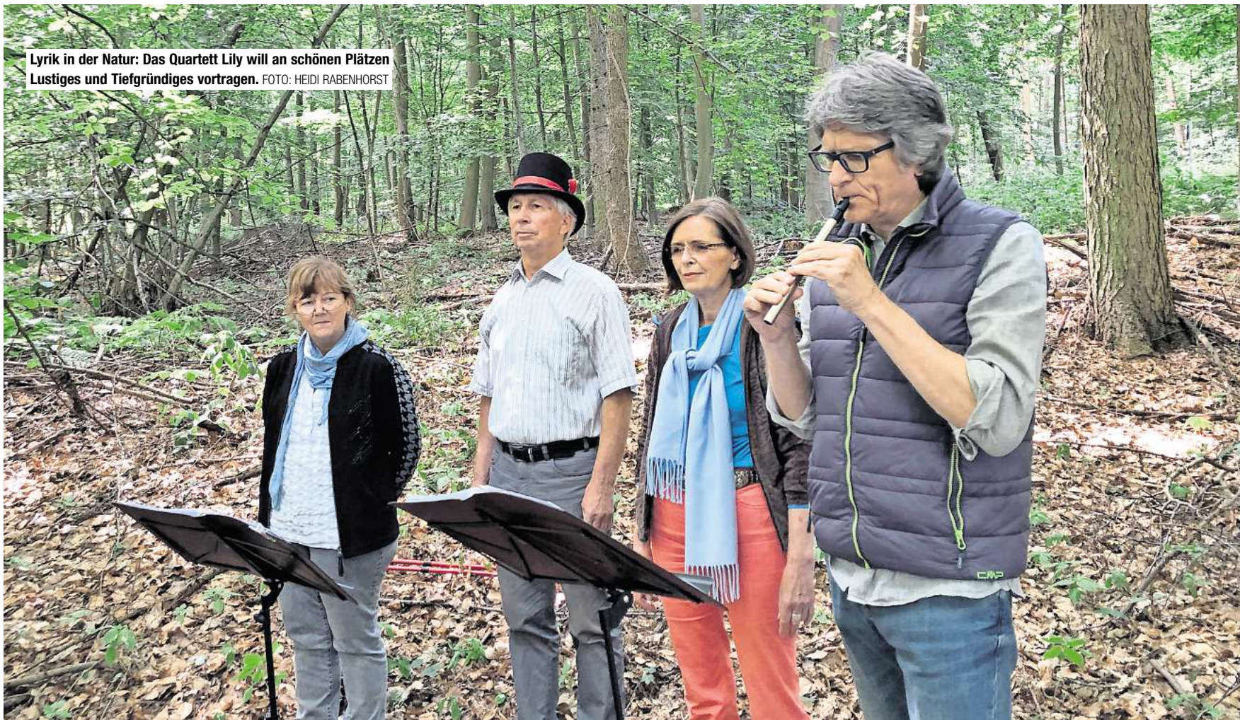
Lyrik in der Natur: Das Quartett LiLy will an schönen Plätzen Lustiges und Tiefgründiges vortragen.