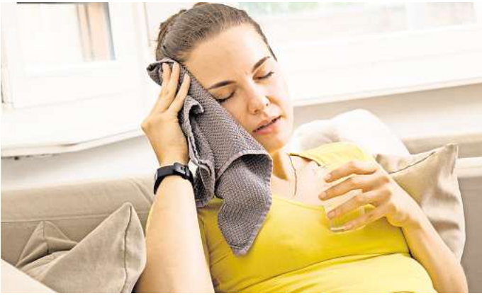
Bei Verdacht auf einen Hitzschlag: Erst mal raus aus der Sonne und den Notruf wählen.

Das Grundproblem, das bei einem Hitzschlag besteht: „Der Körper schafft es nicht mehr, die Wärme wegzutransportieren“, sagt Frank Erbguth, Präsident der Deutschen Hirnstiftung. Es kommt zu einem Wärmestau, die Körpertemperatur steigt auf 40 Grad und höher – normalerweise liegt sie bei 37 Grad.