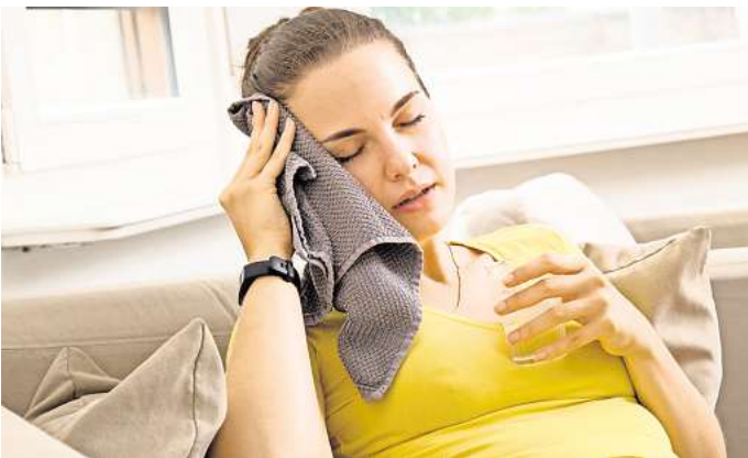
Bei Verdacht auf einen Hitzschlag: Erst mal raus aus der Sonne und den Notruf wählen.

Das Grundproblem, das bei einem Hitzschlag besteht: „Der Körper schafft es nicht mehr, die Wärme wegzutransportieren“, sagt Frank Erbguth, Präsident der Deutschen Hirnstiftung. Es kommt zu einem Wärmestau, die Körpertemperatur steigt auf 40 Grad und höher – normalerweise liegt sie bei 37 Grad.