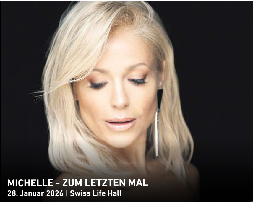
MICHELLE - ZUM LETZTEN MAL 28. Januar 2026 | Swiss Life Hall

Partner im RedaktionsNetzwerk Deutschland