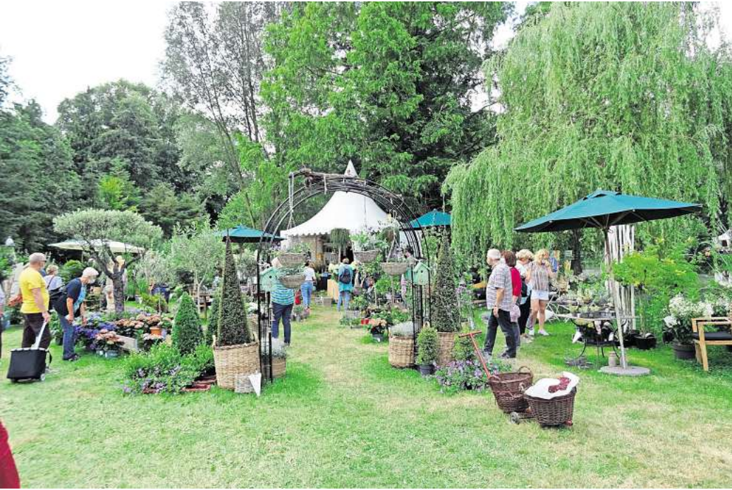
Das Gourmet & Garden Festival in Wienhausen ist ein Fest für die Sinne

Gourmet und Garden-Festival auf dem Landgut Wienhausen bei Celle