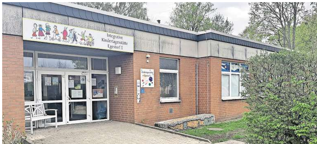
Zukunft noch ungewiss: Für einige städtische Kitas will das Kinderbetreuungsamt doch noch ein Betreuungsangebot in den Randzeiten schaffen. Im Falle der Kita Egestorf I (Bild) und der Einrichtungen in Ostermunzel und Großgötern wird dies nach Aussagen der Verwaltung aber schwer.

Der befürchtete Ausfall der Randzeitenbetreuung in Barsinghausens Kinderbetreuungseinrichtungen werde aller Voraussicht nach nicht so extrem ausfallen, wie nach den ersten Bescheiden vom 24. Juni 2024 befürchtet, betonte sie am Mittwoch. „Es wird kein Elternteil seinen Job wegen fehlender Randzeiten in der Kinderbetreuung kündigen müssen, wir arbeiten