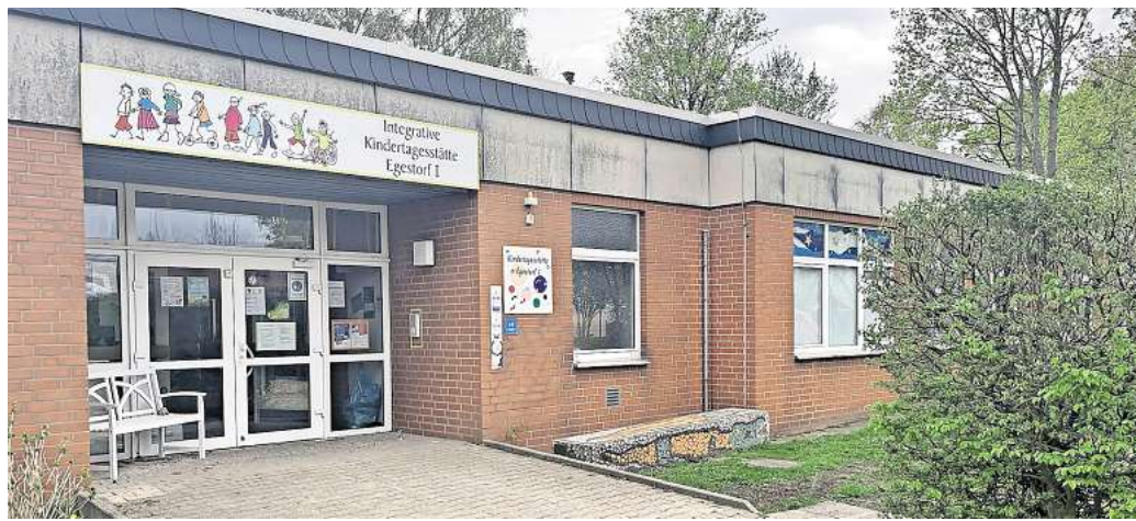
Zukunft noch ungewiss: Für einige städtische Kitas will das Kinderbetreuungsamt doch noch ein Betreuungsangebot in den Randzeiten schaffen. Im Falle der Kita Egestorf I (Bild) und der Einrichtungen in Ostermunzel und Großgötern wird dies nach Aussagen der Verwaltung aber schwer.

Der befürchtete Ausfall der Randzeitenbetreuung in Barsinghausens Kinderbetreuungseinrichtungen werde aller Voraussicht nach nicht so extrem ausfallen, wie nach den ersten Bescheiden vom 24. Juni 2024 befürchtet, betonte sie am Mittwoch. „Es wird kein Elternteil seinen Job wegen fehlender Randzeiten in der Kinderbetreuung kündigen müssen, wir arbeiten