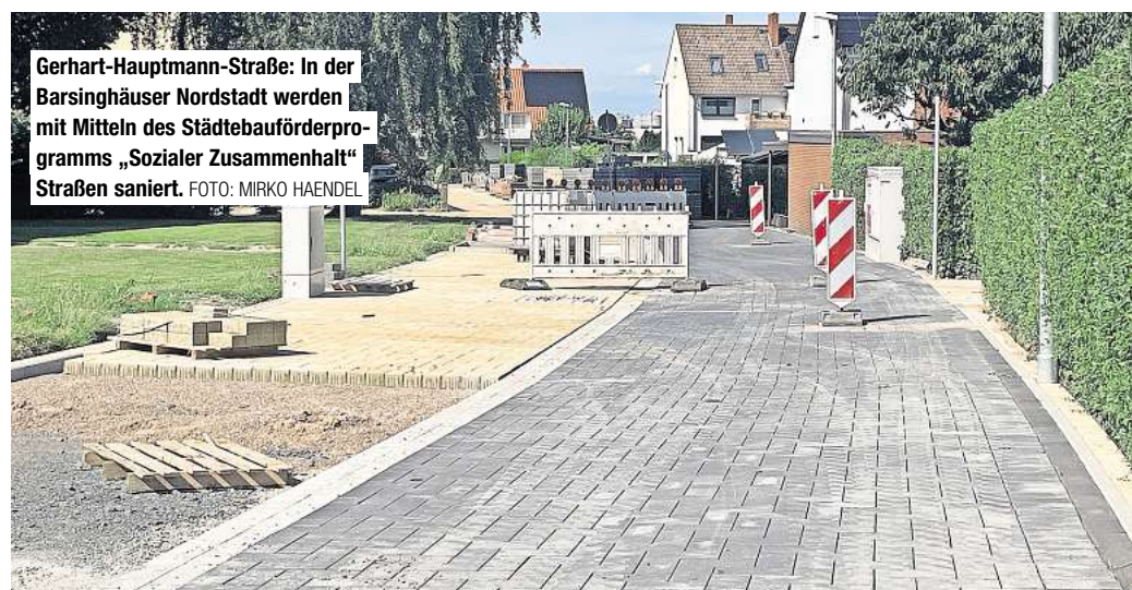
Gerhart-Hauptmann-Straße: In der Barsinghäuser Nordstadt werden mit Mitteln des Städtebauförderprogramms „Sozialer Zusammenhalt“ Straßen saniert.

Sein Fraktionskollege Brian Baatzsch ist aber schon jetzt sehr zuversichtlich: „Die Ausweisung eines Naturparks Deister könnte sich strukturell und personell an der Ausgestaltung des Naturparks Steinhuder Meer orientieren. Dort funktioniert das Konstrukt seit fast 50 Jahren sehr erfolgreich“, berichtet der SPD-Regionsabgeordnete aus Springe.