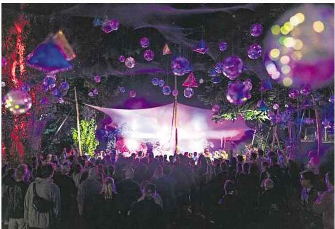
Das SNNTG Festival geht vom 26. bis zum 28. Juli.

einen Besuch wert. Einmal im Jahr, in diesem Jahr vom 26.7. bis 28.7., setzt das SNNTG-Festival noch einen drauf und organisiert auf dem Gelände für ein Wochenende ein sehens- und hörenswertes Programm. Die Musikrichtungen Pop, Elektro, Hiphop und Disco sind mit rund 40 Bands, DJs und anderen Künstlern vertreten und dürfen damit fast jeden Musikge-