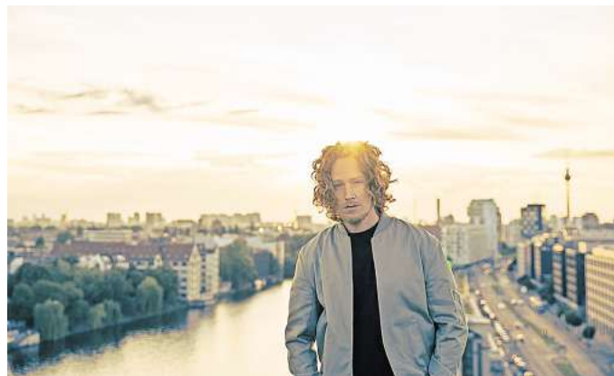
Michael Schulte steht am 27. Juli auf der Lagunenbühne.

Wir verlosen 1 x 2 Freikarten für das Konzert am 27. Juli, ab 20 Uhr. Wer gewinnen will, scannt einfach bis zum 22. Juli, 10 Uhr, nebenstehenden QR-Code, meldet sich an und dann heißt es Daumen drücken.