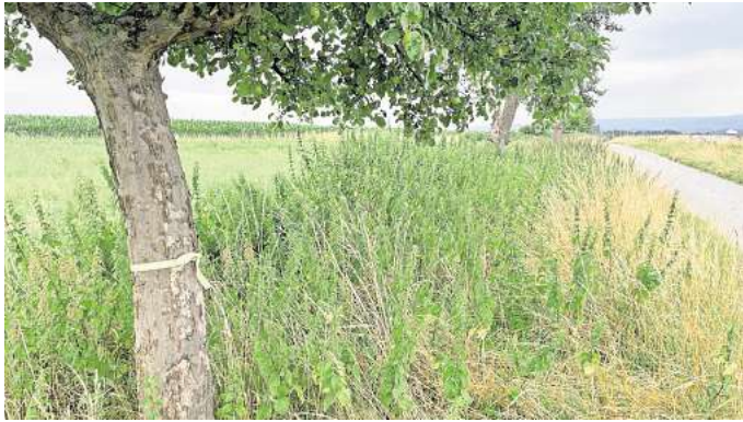
Wenn gelb, dann los! Zahlreiche Obstbäume an den Feldwegen im Barsinghäuser Stadtgebiet tragen derzeit ein gelbes Band. Von diesen Bäumen kann Obst geerntet werden. Es handelt sich zumeist um Apfel-, Birnen- und Pflaumenbäume.

Auch im Barsinghäuser Stadtgebiet gibt es zahlreiche Obstbäume entlang von städtischen Straßen und Feldwegen. Viele dieser städtischen Bäume sind bereits mit einem gelben Band markiert und können für den Eigenbedarf beerntet werden. Auch das bereits heruntergefallene Obst darf aufgesammelt werden. Im Stadtgebiet gibt es einige „Hotspots“, in denen besonders viele Obstbäume stehen, die für das Ernten freigegeben sind. Besonders zu nennen