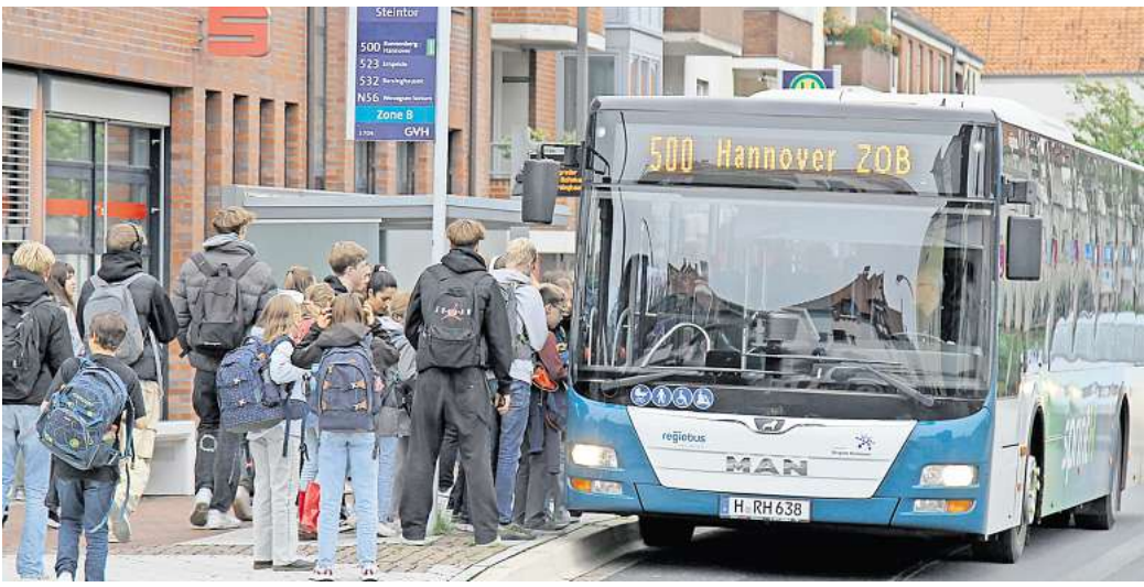
Ein beherrschendes Thema seit Jahren: Viele Gehrden'er wünschen sich eine direkte Anbindung an den S-Bahnhof Weetzen.

Die Linie 522 verbindet Gehrden mit Weetzen, aber nur mit einem