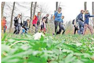
Auf Entdeckertour: Der Deister ist auch in Wennigsen sehr beliebt bei Wanderern und Naherholungssuchenden.

Farwig erinnert vor diesem Hintergrund an die großen Bemühungen und Pläne der jüngeren Vergangenheit. Er nennt unter anderem eine Machbarkeitsstudie der Region Hannover, das regelmäßige Gesprächsformat „Großer Runder Tisch Deister“ und die Pläne für die Gründung einer gemeinsamen Vernetzungsgesellschaft.