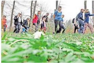
Auf Entdeckertour: Der Deister ist auch in Wennigsen sehr beliebt bei Wanderern und Naherholungssuchenden.

Farwig erinnert vor diesem Hintergrund an die großen Bemühungen und Pläne der jüngeren Vergangenheit. Er nennt unter anderem eine Machbarkeitsstudie der Region Hannover, das regelmäßige Gesprächsformat „Großer Runder Tisch Deister“ und die Pläne für die Gründung einer gemeinsamen Vernetzungsgesellschaft.