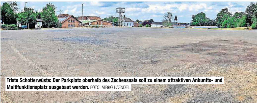
Triste Schotterwüste: Der Parkplatz oberhalb des Zechensaals soll zu einem attraktiven Ankunfts- und Multifunktionsplatz ausgebaut werden.

Barsinghausen. Attraktiver soll sie werden, ein Herzstück Barsinghausens soll sie bleiben: Die Sanierung der Alten Zeche ist seit Monaten beschlossene Sache. Doch über die genaue Umsetzung ist sich die Politik weiterhin uneins. Besonders die Umgestaltung des Parkplatzes des Besucherbergwerks Klosterstollen sorgt für Diskussionen. Eigentlich hatte in der letzten Ratssitzung vor der Sommerpause über die konkrete Gestaltung der Sanierung und die Prioritäten abgestimmt werden sollen. Doch die Entscheidung ist vertagt worden. „Der Tagesordnungspunkt ist auch aufgrund unserer Bedenken abgesetzt worden“, berichtet CDU-Fraktionschef Gerald Schroth. „Wir hoffen, dass da jetzt mehr Bewegung rein kommt.“ Die CDU sieht durch die von der Stadtverwaltung favorisierten Umbaupläne die Zukunft des Zechensaals gefährdet. Der Tenor: Große Veranstaltungen wären wegen fehlender Parkplätze dann nicht mehr möglich. Die Stadt hatte 2022 eine Studie in Auftrag gegeben, die Mög-