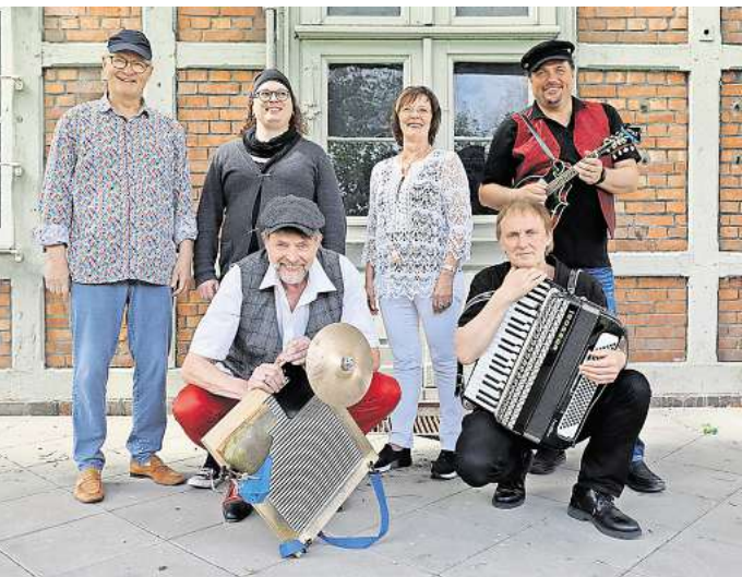
Die Sundown Skiffers eröffnen die Jazz Matineen am 7. Juli.

In diesem Jahr starten die Jazz Matineen am 7.7. mit den Sundown Skiffers aus Bremerhaven. Sie präsentieren neben traditionellen Skiffle-Stücken bekannte Oldies der 60er und 70er Jahre auch in plattdeutscher Sprache, musikalisch neu definiert, druckvoll mit Waschbrett, Piano, Gitarre, E-Bass und mehrstimmigem Gesang. Am 14.7. wird dann Jackpot auf der Bühne stehen. Das Kult-Orchester aus Dresden lässt sich in keine Schublade stecken. Seit 1995 gibt es die Band und seitdem sind sie in den verschiedensten Genres zu Hause, von Dixie bis zu Klassikern der 70/80er Jahre ist alles mit dabei. International wird es am 21.7., wenn die Metropolitan Jazzband & Eva Emingerová zu Gast in Langenhagen sind. Die Band besticht durch perfekt arrangierte Bläusersätze; Vorbilder