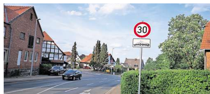
Runter vom Gaspedal: Um den Autoverkehr auf der Ortsdurchfahrt zu entschleunigen, wünschen sich die Lemmie Bürgerinnen und Bürger seit Jahren ein Tempo-30-Limit.

Auch Gehrden ist der Städteinitiative „Tempo 30“ beigetreten. Auslöser war ein Antrag des Ortsrats Lemmie. Dort wird schon seit Langem gefordert, auf der Deisterstraße ein durchgängiges Tempo-30-Limit zu erlassen. Die Initiative Lemmie 2020