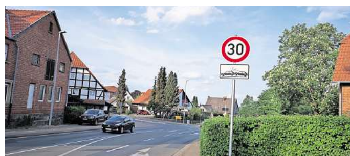
Runter vom Gaspedal: Um den Autoverkehr auf der Ortsdurchfahrt zu entschleunigen, wünschen sich die Lemmie Bürgerinnen und Bürger seit Jahren ein Tempo-30-Limit.

Auch Gehrden ist der Städteinitiative „Tempo 30“ beigetreten. Auslöser war ein Antrag des Ortsrats Lemmie. Dort wird schon seit Langem gefordert, auf der Deisterstraße ein durchgängiges Tempo-30-Limit zu erlassen. Die Initiative Lemmie 2020