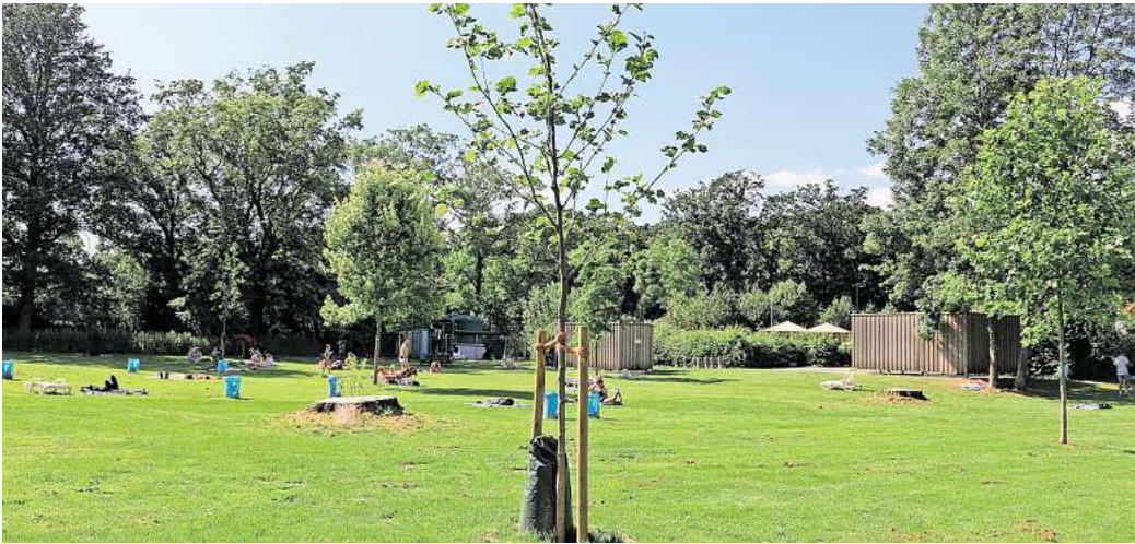
Ersatz für drei gefällte Weiden: Auf der Liegewiese des Freibades Empelde hat der städtische Bauhof ebenfalls fünf neue Bäume angepflanzt.

Wo in diesem Jahr neue Bäume eingesetzt werden sollen, steht erst zum Teil fest. Ein Auftrag ist bereits vergeben. Auf dem Schulhof der Grundschule Ronnenberg werden im Randbereich