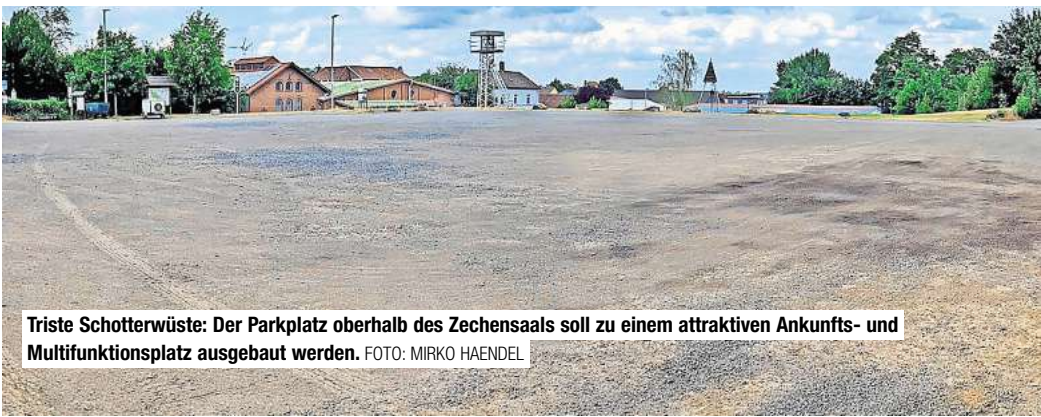
Triste Schotterwüste: Der Parkplatz oberhalb des Zechensaals soll zu einem attraktiven Ankunfts- und Multifunktionsplatz ausgebaut werden.

Barsinghausen. Attraktiver soll sie werden, ein Herzstück Barsinghausens soll sie bleiben: Die Sanierung der Alten Zeche ist seit Monaten beschlossene Sache. Doch über die genaue Umsetzung ist sich die Politik weiterhin uneins. Besonders die Umgestaltung des Parkplatzes des Besucherbergwerks Klosterstollen sorgt für Diskussionen. Eigentlich hatte in der letzten Ratssitzung vor der Sommerpause über die konkrete Gestaltung der Sanierung und die Prioritäten abgestimmt werden sollen. Doch die Entscheidung ist vertagt worden. „Der Tagesordnungspunkt ist auch aufgrund unserer Bedenken abgesetzt worden“, berichtet CDU-Fraktionschef Gerald Schroth. „Wir hoffen, dass da jetzt mehr Bewegung reinkommt.“ Die CDU sieht durch die von der Stadtverwaltung favorisierten Umbaupläne die Zukunft des Zechensaals gefährdet. Der Tenor: Große Veranstaltungen wären wegen fehlender Parkplätze dann nicht mehr möglich. Die Stadt hatte 2022 eine Studie in Auftrag gegeben, die Mög-