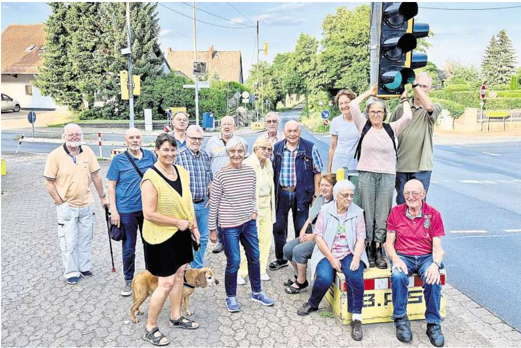
Für den Erhalt der Ampel an der Ortsdurchfahrt: Mitglieder des Vereins Lemmie 2020 setzen sich für mehr Verkehrssicherheit im Gehrdenen Ortsteil ein.