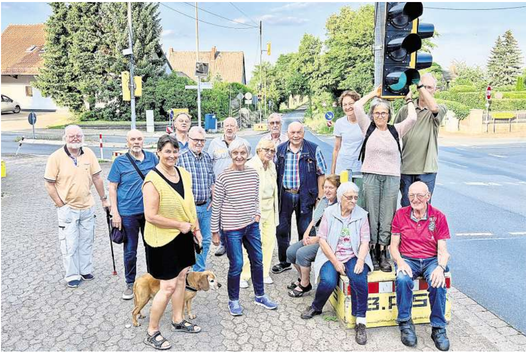
Für den Erhalt der Ampel an der Ortsdurchfahrt: Mitglieder des Vereins Lemmie 2020 setzen sich für mehr Verkehrssicherheit im Gehrdenen Ortsteil ein.