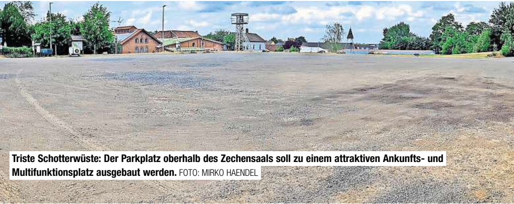
Triste Schotterwüste: Der Parkplatz oberhalb des Zechensaals soll zu einem attraktiven Ankunfts- und Multifunktionsplatz ausgebaut werden.

Nur 40 Parkplätze und Photovoltaik auf der Fläche statt auf dem Dach: CDU kritisiert akribisches Festhalten der Verwaltung an Modernisierungskonzept zur Alten Zeche