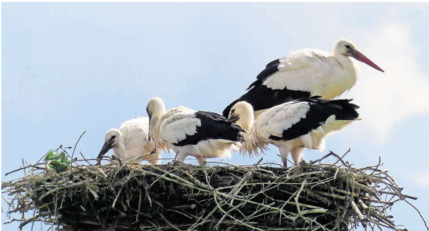
Erfolgreich beim Nachwuchs: Im Nest in Vörie entwickeln sich die drei Jungtiere (im Vordergrund) prächtig.